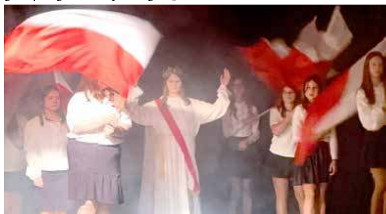
Spektakl słowno-muzyczny z okazji odzyskania niepodległości