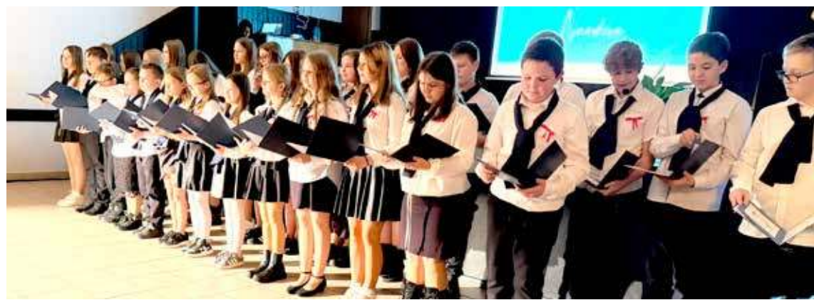
W trakcie występu uczniów z SP w Czarnogłowach