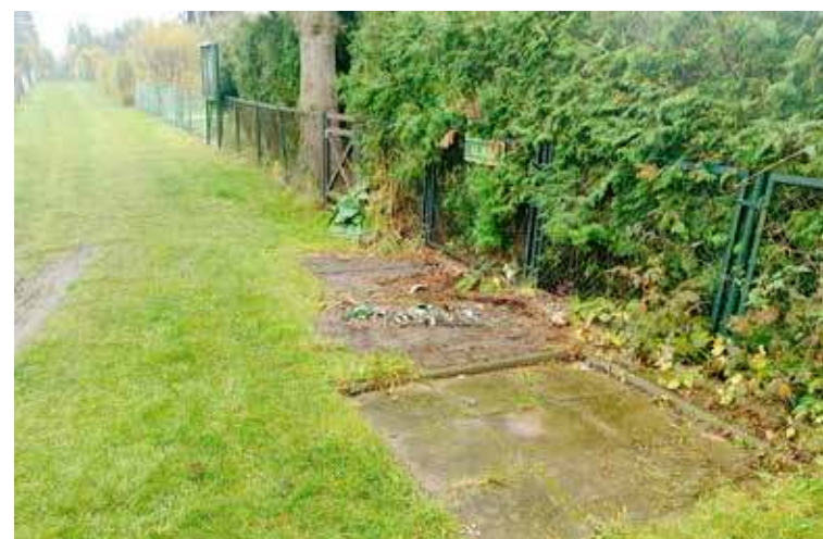
Po zabranych pojemnikach pozostawiono odpady

Udaliśmy się na miejsce i istotnie, są tam pozostawione szkła. Można powiedzieć że jest ich niewiele i to nieduży problem. Nie