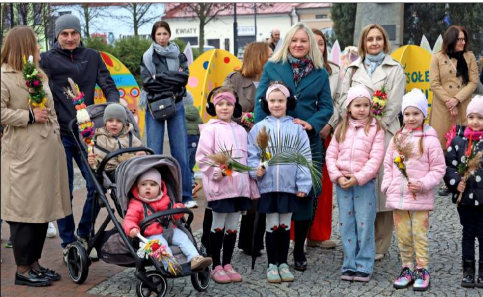
KOLBUSZOWA. Wierni licznie wzięli udział w uroczystościach.