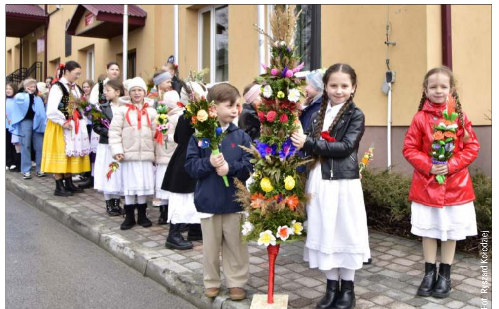
RANISZÓW. Parafianie jak co roku wzięli udział w Niedzieli Palmowej.