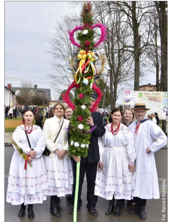
RANISZÓW. Nie zabrakło palm przygotowanych m.in. przed KGW.