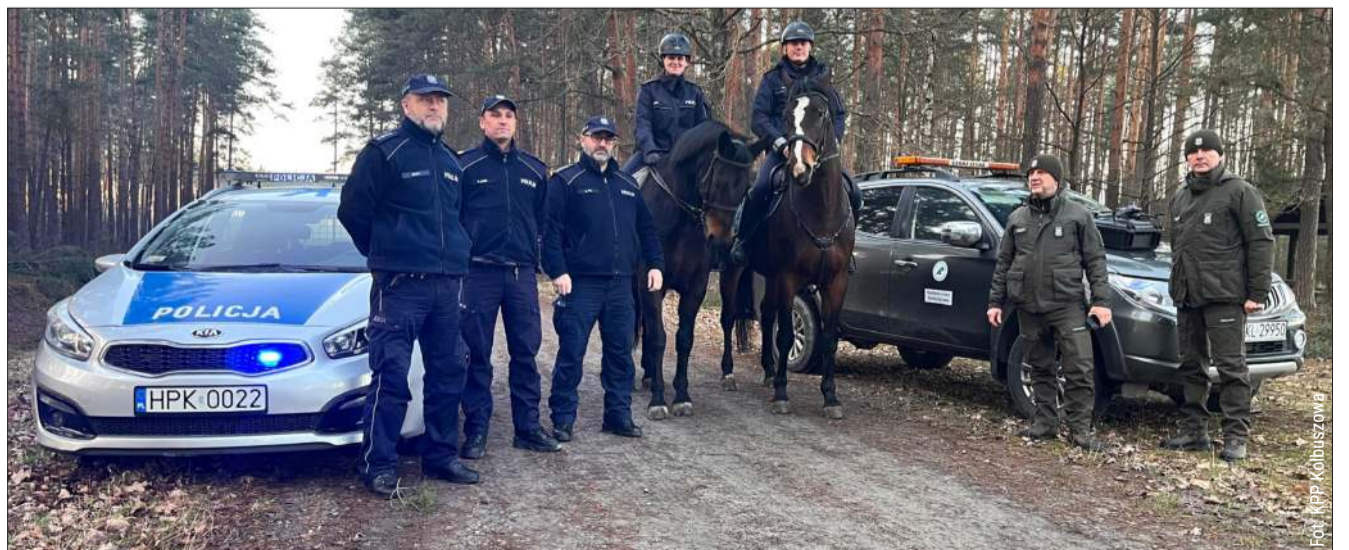
Strażnicy leśni często współpracują z innymi służbami mundurowymi. Nie bez powodu mówi się o nich „leśna policja”.