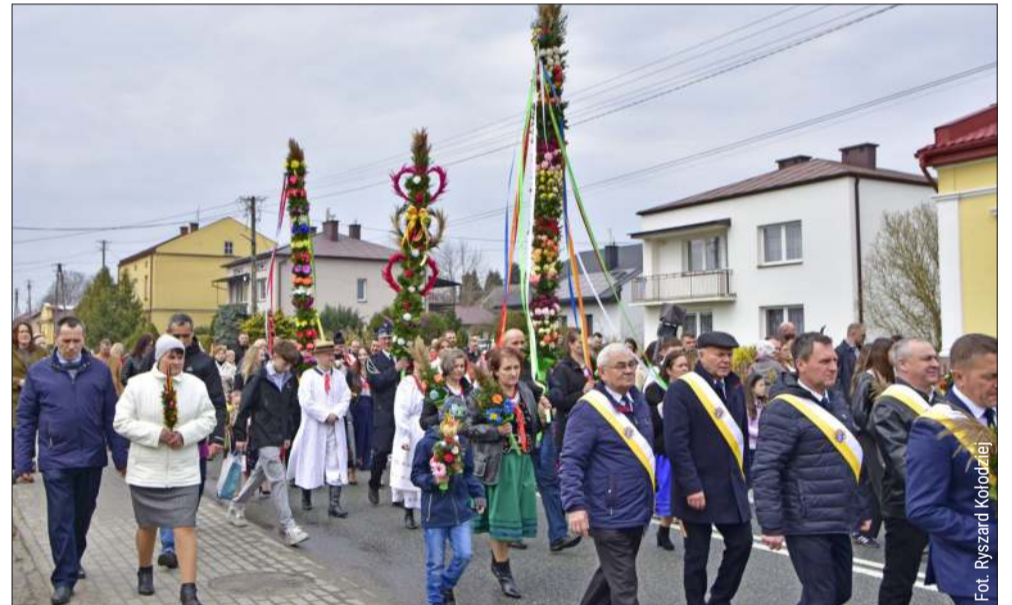
RANISZÓW. Wierni przeszli ulicami wsi, od rynku aż do swojej świątyni.