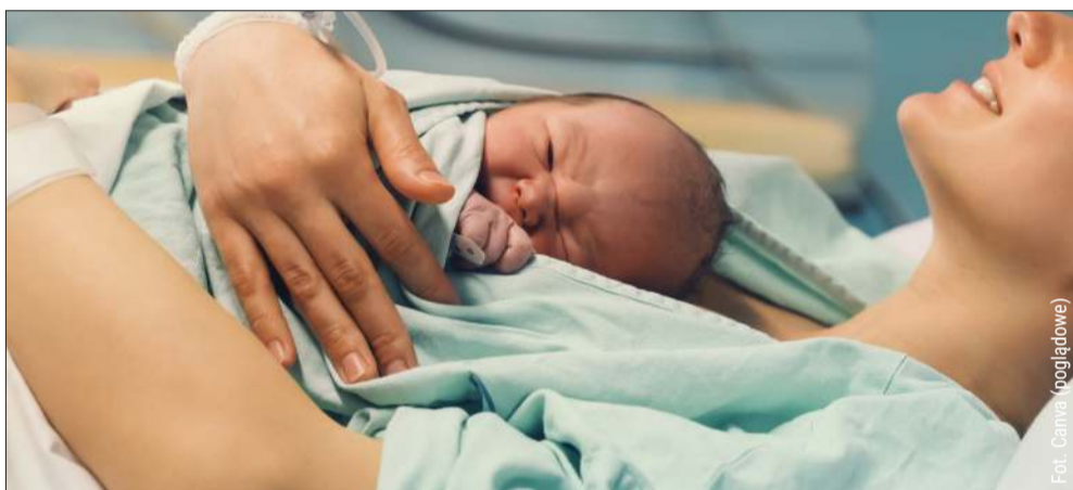
Likwidują porodówkę blisko Kolbuszowej. Kobiety będą rodzić dalej od domu.