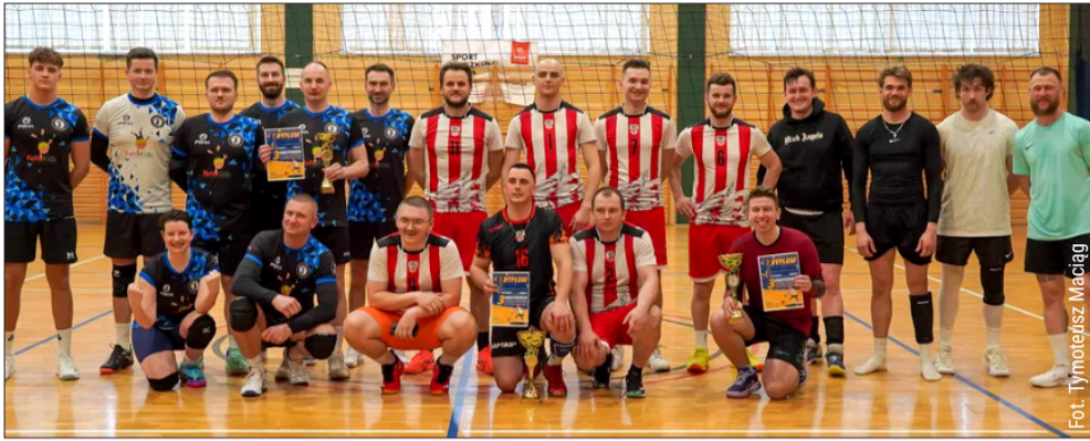
W Cmolasie odbył się turniej siatkówki.

W sobotę, 28 marca, na parkiecie sali i hali sportowej w Cmolasie, odbył się III Amatorski Turniej Piłki Siatkowej o Puchar Wójta Gminy Cmolasy. Rozgrywki rozpoczęły się o godzinie 9:00, a zakończyły przed 17:00.