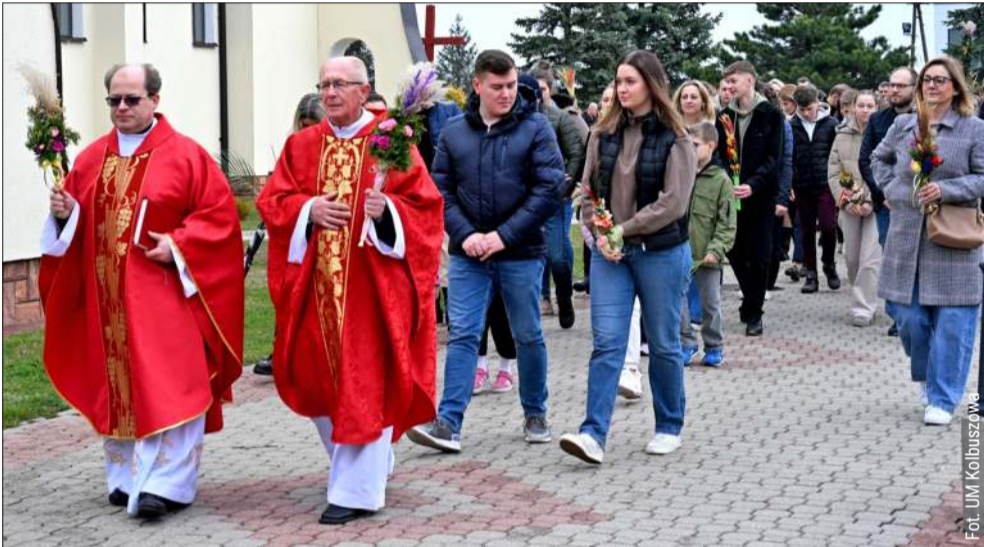
KOLBUSZOWA. Także wierni z parafii Św. Brata Alberta wzięli udział w procesji.

Choć w różnych miejscach uroczystości miały nieco inny charakter, jedno było wspólne – obecność mieszkańców i atmosfera, której nie da się odtworzyć nigdzie indziej. bp