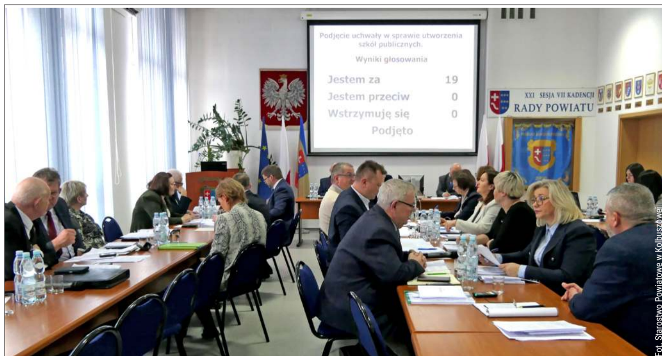
Radni Rady Powiatu Kolbuszowskiego jednogłośnie podjęli uchwałę o utworzeniu szkół specjalnych w Kolbuszowej Dolnej oraz ich połączeniu w Zespół Szkół Specjalnych.