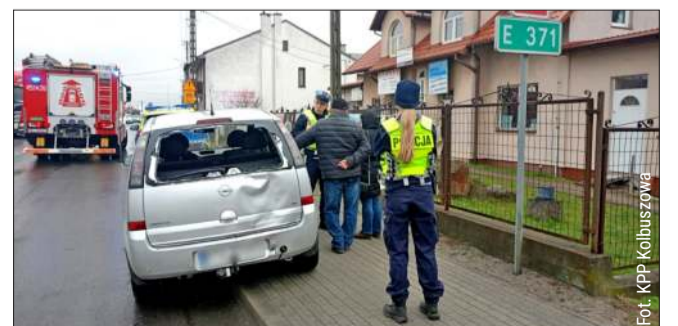
Do stłuczki doszło na krajowej „dziewiątce”.

Wyrazy głębokiego współczucia oraz słowa otuchy i wsparcia dla