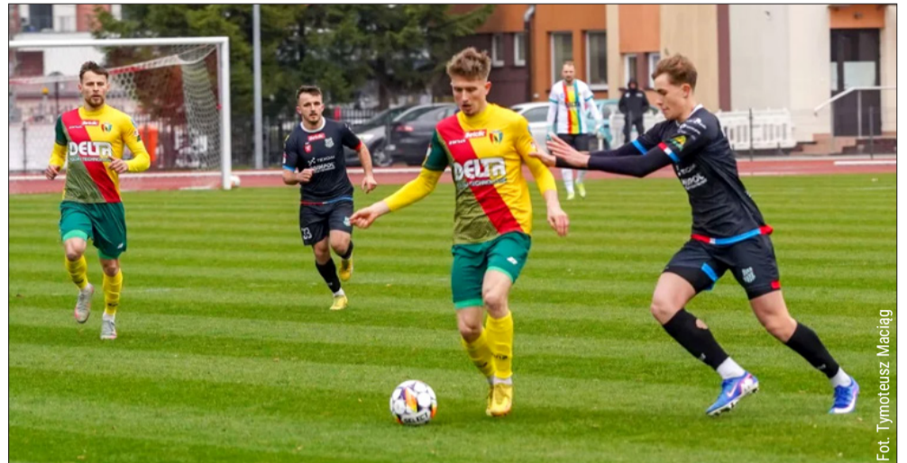
Fot. Tymoteusz Macieąg

łowi Musikowi, a ten, mimo asysty obrońcy na plecach, zachował zimną krew i wy-