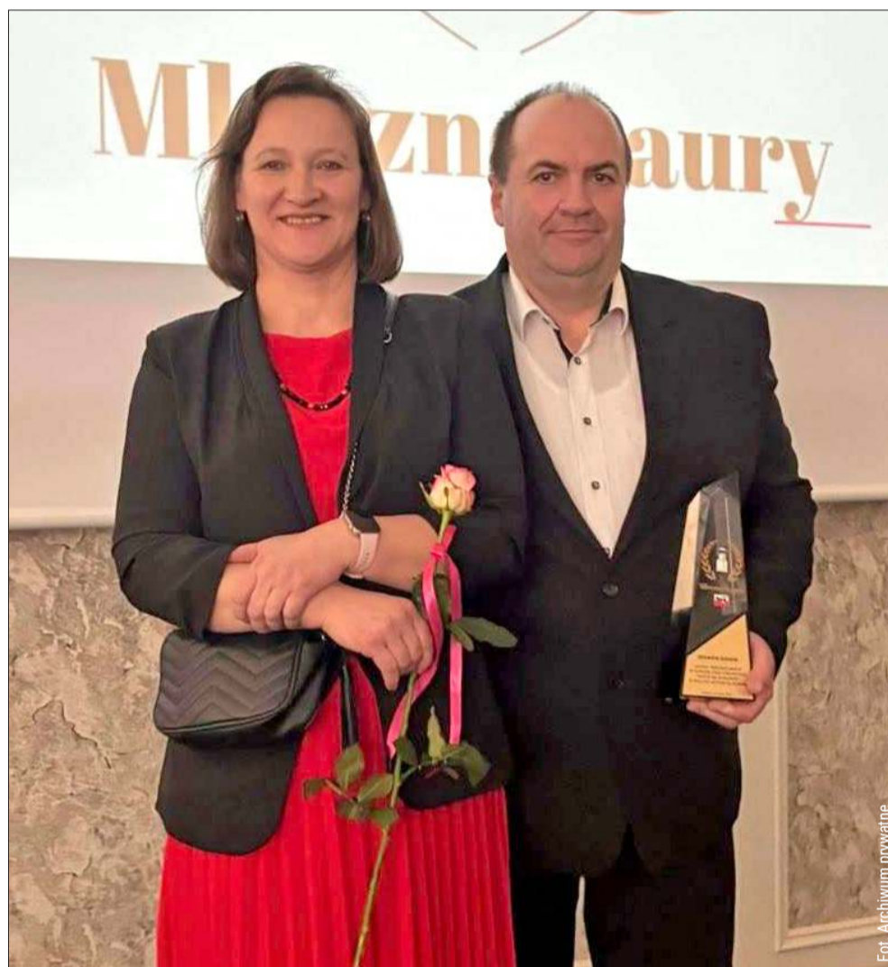
Rolnicy z powiatu kolbuszowskiego mogą poszczycić się nagrodami i wysokimi osiągnięciami w hodowli.