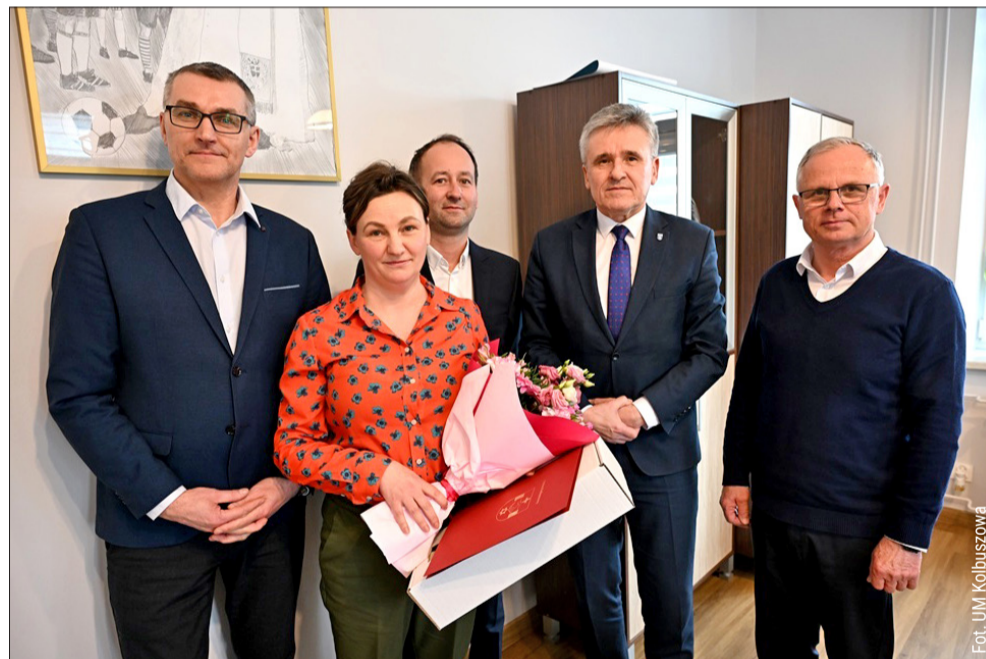
Nie była obojętna. Bohaterska interwencja pracownicy MGOPS w Kolbuszowej.