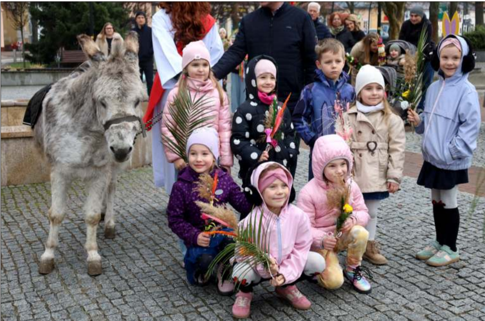
KOLBUSZOWA. Jedną z największych atrakcji był osiołek, który uczestniczył w uroczystościach.