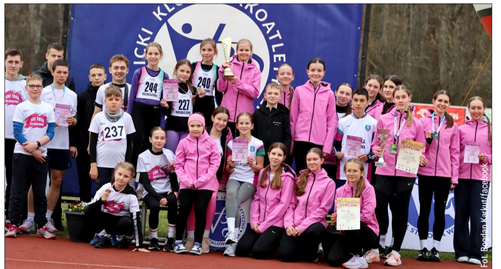
UKS Tiki-Taka rywalizował w biegach przełajowych.

Gratulacje dla wszystkich biegaczy i trenerów! Takie wyniki to najlepsza wizytówka sportowej ambicji naszego regionu. tg