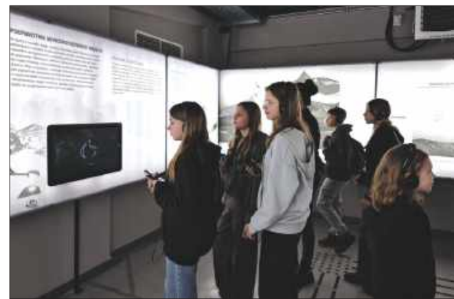
Wycieczka do Carbonarium pozwoliła poznać zagadnienia związane z węglem

Warto podkreślić, że ferie przyniosły w Lubomi nie tylko wycieczki. Także