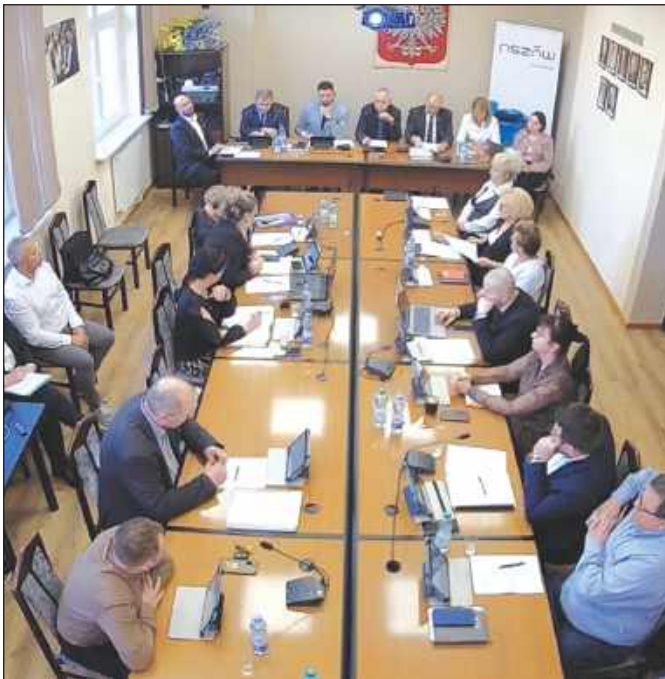
■ Pytania na temat cyberataku padły na sesji rady miejskiej 5 marca.

Burmistrz w odpowiedzi stwierdził, że przeniesienie referatu nie miało wpływu na atak cybernetyczny. – Moim zdaniem przeniesienie referatu nie miało wpływu na to, co się wy-