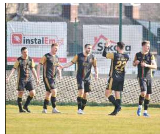
■ Czarni Gorzyce pokonali na własnym stadionie Zameczek Czernica