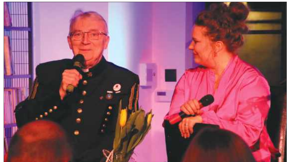
■ Wieczór autorski w nowej siedzibie biblioteki odbył się w piątek 7 marca.

– Nie jestem tutaj żadnym przebierańcem. 18 lat temu, podczas uroczystości św. Barbary w naszej bazylice otrzymałem od górników ten mundur. Było to jedno z największych wyróżnień w moim życiu. Bardzo wysoko sobie to cenię i postanowiłem się dzisiaj tak właśnie ubrać w to miejsce i ten wieczór wy-