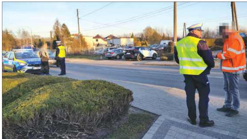
■ Śledczy badają okoliczności wypadku, w którym poszkodowana została 3-letnia dziewczynka.