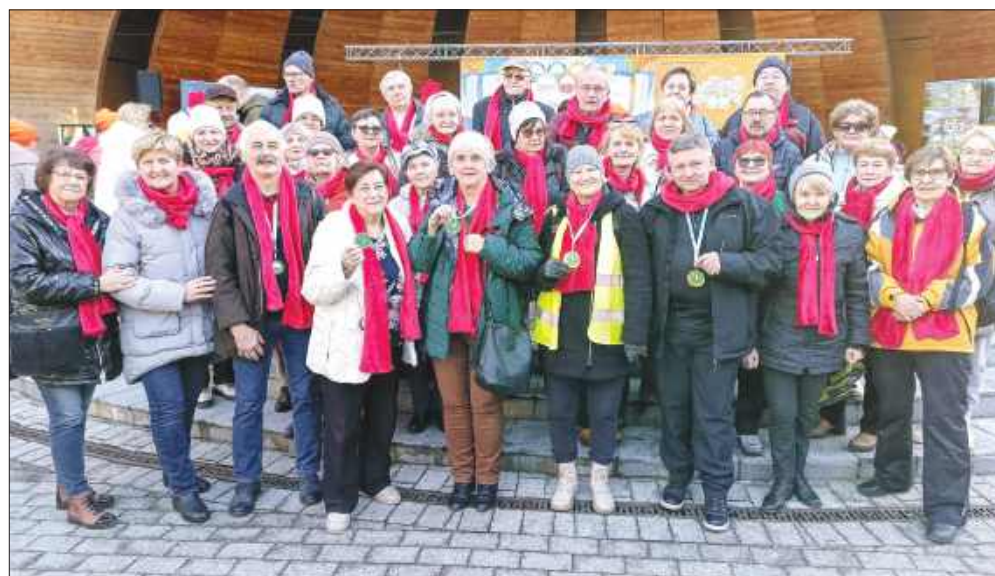
■ Seniorzy z Wodzisławia Śląskiego w Rabce-Zdroju

WODZISŁAW ŚL. Wydarzeniu odbyło się w Rabce-Zdroju. Wzięło w nim udział 450 uczestników z całej Polski i zagranicy, a łącznie do Rabki przybyło ponad 700 osób. Wśród sportowców nie zabrakło również reprezentantów Wodzisławskiego Uniwersytetu Trzeciego Wieku, którzy pokazali wielkiego ducha walki i zdobyli aż pięć medali.