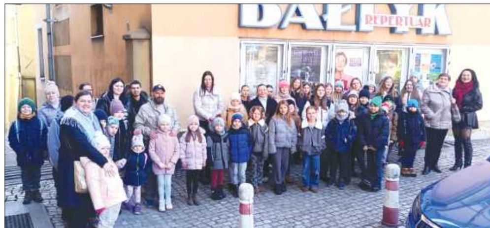
Wyjazdy do Kina Bałtyk pozwoliły zobaczyć „Akademię Pana Kleksa” oraz film „Mufasa”

Uczestnicy wycieczek podczas ferii wybrali się także niedaleko, bo do Rybnika i Jastrzębia-Zdroju, oglądając bardzo ciekawe miejsca. Pierwszym z nich 26 lutego było Edukatorium Juliusz w Rybniku. - Była to wspaniała okazja do nauki i zabawy, gdzie uczestnicy mieli szansę na ciekawe doświadczenia i zdobycie nowych umiejętności. Dzięki różnorodnym atrakcjom edukacyjnym, wszyscy spędzili czas w inspirujący sposób. Dziękiujemy Edukatorium JULIUSZ za gościnność i świetną organizację! - podkreślają organizatorzy wycieczki. Drugi z lokalnych wyjazdów odbył się 28 lutego. Wtedy celem wycieczki było Carbonarium w Jastrzębiu-Zdroju, czyli miejsce, gdzie można dowiedzieć się wszystkiego o węglu – od pierwiastka