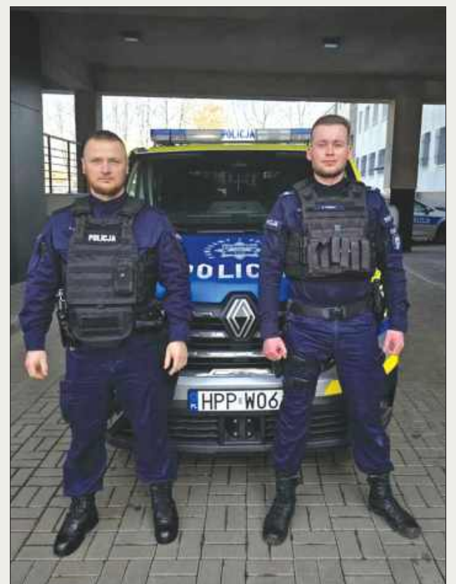
■ Dzięki szybkiej i skutecznej reakcji policjanci uratowali mężczyznę życie.