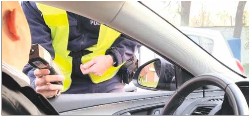
■ Kontrola trzeźwości kierującego pojazdem, zdjęcie ilustracyjne

Następnie zestawiliśmy je z liczbą ludności miast i powiatów. W ten sposób sprawdziliśmy, gdzie policjanci zatrzymują najwięcej kierowców po użyciu lub nietrzeźwości w odniesieniu do liczby mieszkańców.