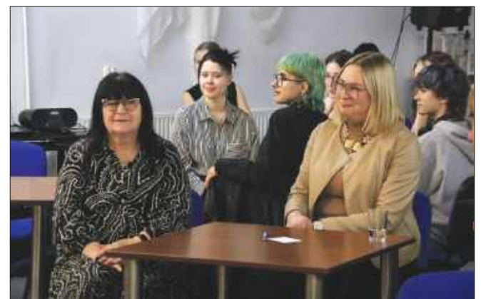
■ W finisażu udział wzięto wielu sympatyków sztuki