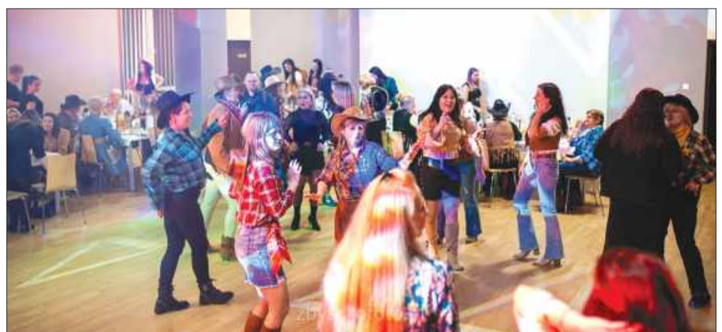
■ Babski Comber w Niebooczowach zorganizowano w stylu country