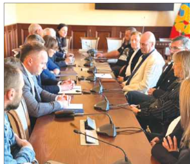
■ Spotkanie z właścicielami firm transportowych przyniosło zapowiedź obniżenia stawek podatkowych