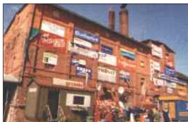
Druaga edycja Targów Eko-