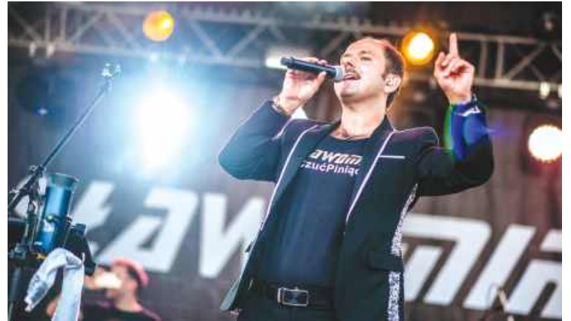
■ Jedną z gwiazd niedzielного koncertu na Dni Wodzisławia Śląskiego będzie Sławomir, czyli autor hitu disco polo „Miłość w Zakopanem”

Organizatorzy NMNZ przygotują również drugą scenę z plażą, gdzie odbywać się będzie dyskoteka w stylu reggae. Na starówce zaplanowano w ramach Dni Wodzisławia dodatkowe atrakcje dla najmłodszych, m.in. Teatr "Scena Kalejdoskop" oraz bańkowe show i animacje.