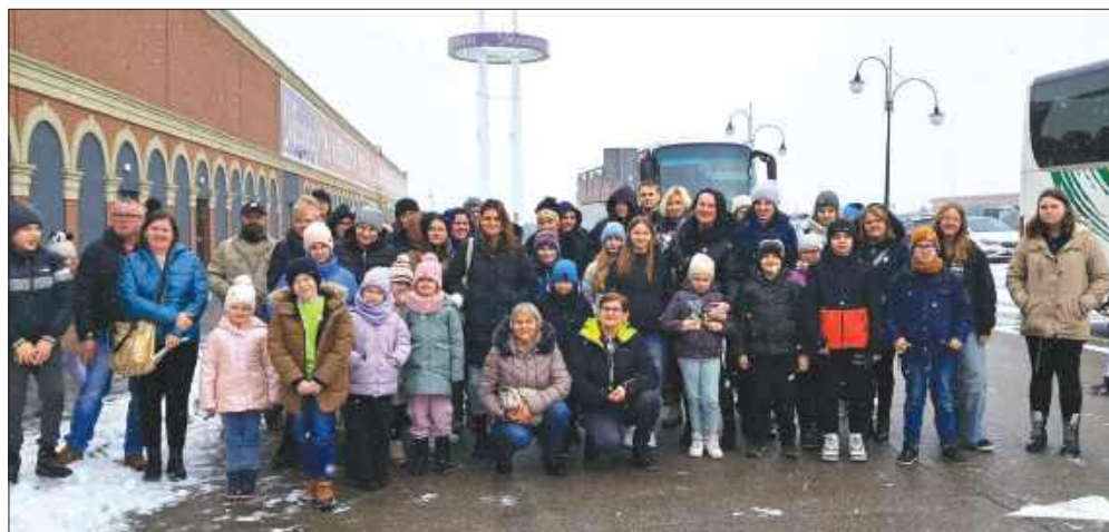
Uczestnicy wyjazdu do Parku Rozrywki Mandoria

obecnego w kosmosie po zastosowanie węgla kopalnego w przemyśle. - W trakcie wizyty mieliśmy okazję zapoznać się z historią węgla kamiennego oraz procesami związanymi z jego wydobywaniem, a także poznać tajniki pracy górników. Miejsce to okazało się nie tylko edukacyjne, ale również pełne niezwykłych doświadczeń, które pozwoliły nam lepiej zrozumieć bogatą tradycję regionu. Wspólnie odkrywaliśmy tajemnice górnictwa, zwiedzając wystawy oraz uczestnicząc w interaktywnych atrakcjach, które dostarczyły nam wielu niezapomnianych wrażeń – zapewniają pracownicy GOKSiR Lubomia.