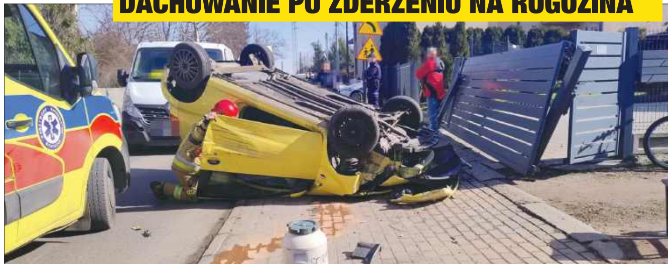
■ Policjanci apelują do kierowców o uwagę i ostrożność!

RADLIN We wtorek wczesnym popołudniem w Radlinie doszło do kolizji z udziałem dwóch pojazdów osobowych. Samochód uszkodzany dachował.