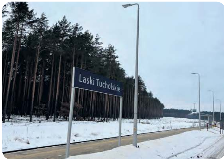
Laski Tucholskie to przystanek na linii kolejowej numer 215 relacji Laskowice Pomorskie – Bąk.

Czytelnik w rozmowie z „Tygodnikiem” uzupełnił, że jego