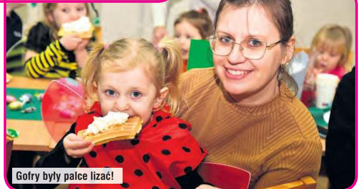
Gofry były palce lizać!