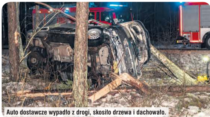
Auto dostawcze wypadło z drogi, skosiło drzewa i dachowało.

Spokojny wieczór skończył się jednak ok. godz. 22:00 w miej-