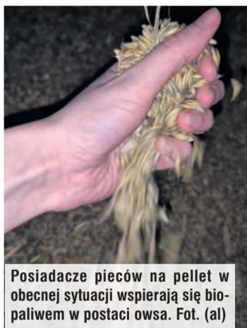
Posiadacze pieców na pellet w obecnej sytuacji wspierają się biopaliwem w postaci owsa.

Na początku sezonu grzewczego za tonę pelletu w Kapoście trzeba było zapłacić 1300-1400 zł brutto. Na chwilę obecną cena wynosi 1700 zł brutto. To stosunkowo niewielka podwyżka, ponieważ jak informują nasi Czytelnicy, w niektórych punktach sprzedaży cena wzrosła nawet do 2800 zł.