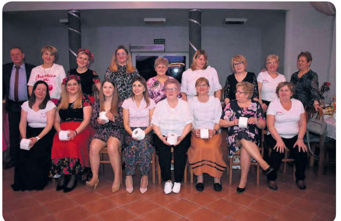
W ramach sobotniego wydarzenia przeprowadzono bardzo różnorodny konkursy i zabawy, które służyły integracji.