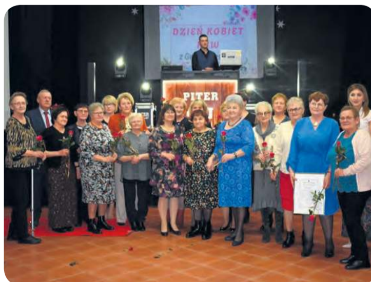
Najbardziej liczną reprezentację stanowiło KGW w Kęsowie.