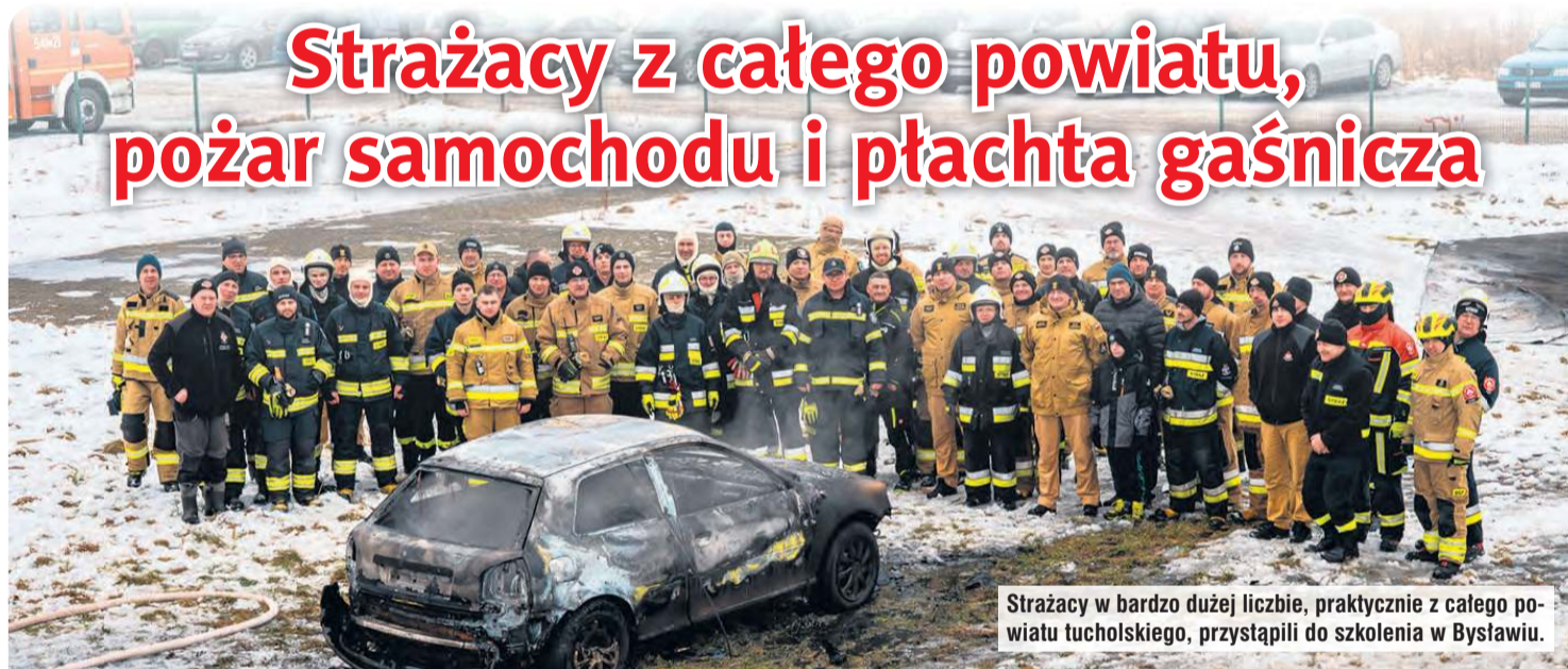
Strażacy w bardzo dużej liczbie, praktycznie z całego powiatu tucholskiego, przystąpili do szkolenia w Bysławiu.