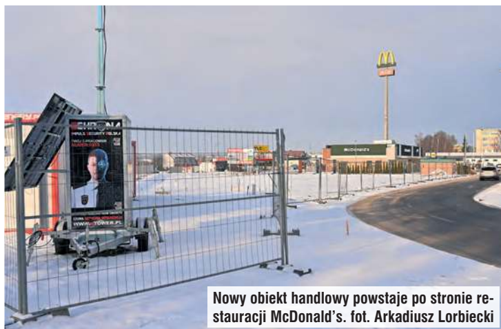
Nowy obiekt handlowy powstaje po stronie restauracji McDonald's.

Na poznanie szczegółów, które z sieciówek zagospodzą w Tucholi, przyjdzie nam poczekać. Dopytujemy, co z bu-