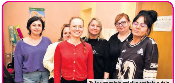
To ta wspaniała szóstka zadbała o dziecięce podniebienia, serwując gofry.