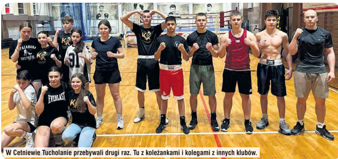
W Cetniewie Tucholanie przebywali drugi raz. Tu z koleżankami i kolegami z innych klubów.