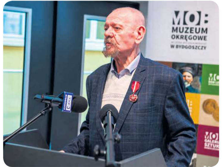
Artysta z Przymuszewa nie zwalnia tempa, cały czas tworzy, a na horyzoncie kolejna wystawa jego prac.

– Powtarzając za moją żoną: nie ma kontynentu na świecie, z wyjątkiem Antarktydy, na któ-