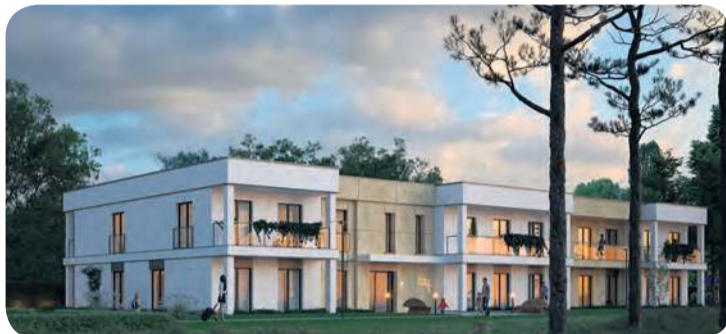
Wizualizacja budynku wielorodzinnego w Bystawiu. fot. Społeczna Inicjatywa Mieszkaniowa KZN Kujawy i Pomorze Sp. z o.o.

z siedzibą w Brodnicy. Odbędzie się ono 19 lutego (czwartek) o godzinie 18:00 w Urzędzie Gminy w Śliwicach.