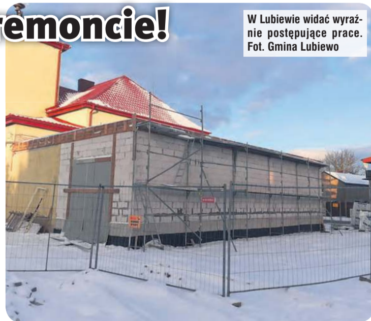
W Lubiewie widać wyraźnie postępujące prace.

Do wykonania w najbliższym czasie pozostały: modernizacja instalacji: elektrycznej, c.o. i wentylacyjnej, termomodernizacja budynku, montaż no-