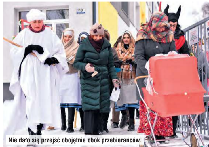
Nie dało się przejść obojętnie obok przebierańców.