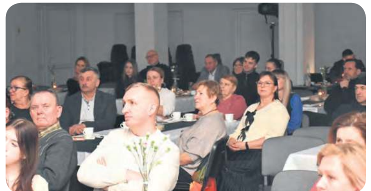
Niedzielny koncert zgromadził niemałą widownię.