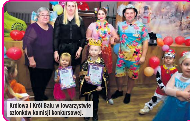
Królowa i Król Balu w towarzystwie członków komisji konkursowej.