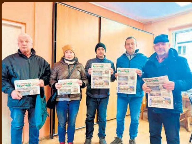
W czwartek przed godz. 9:00 ustawiła się z gazetami kolejka naszych czytelników.