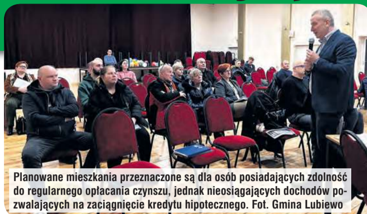
Planowane mieszkania przeznaczone są dla osób posiadających zdolność do regularnego opłacania czynszu, jednak nieosiągających dochodów pozwalających na zaciągnięcie kredytu hipotecznego.

Prezes Stocki przedstawił podstawowe informacje dotyczące realizowanej inwestycji oraz