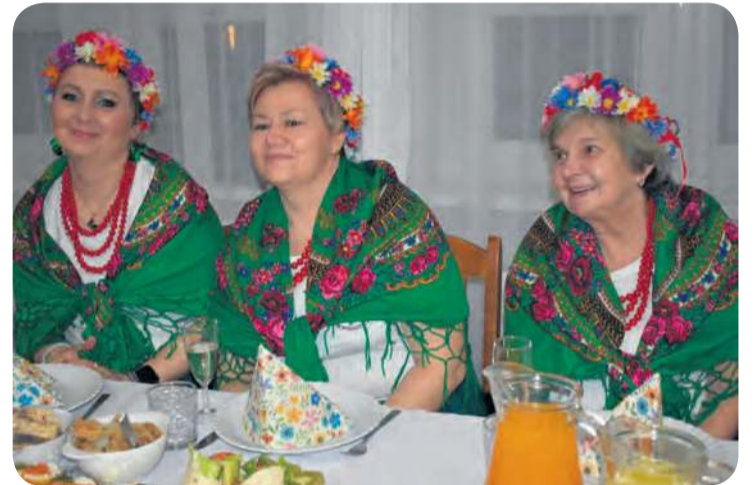
Reprezentacja KGW w Wieszczytach w swoich pięknych strojach.

W trakcie sobotniej imprezy na ręce pań trafiły symboliczne