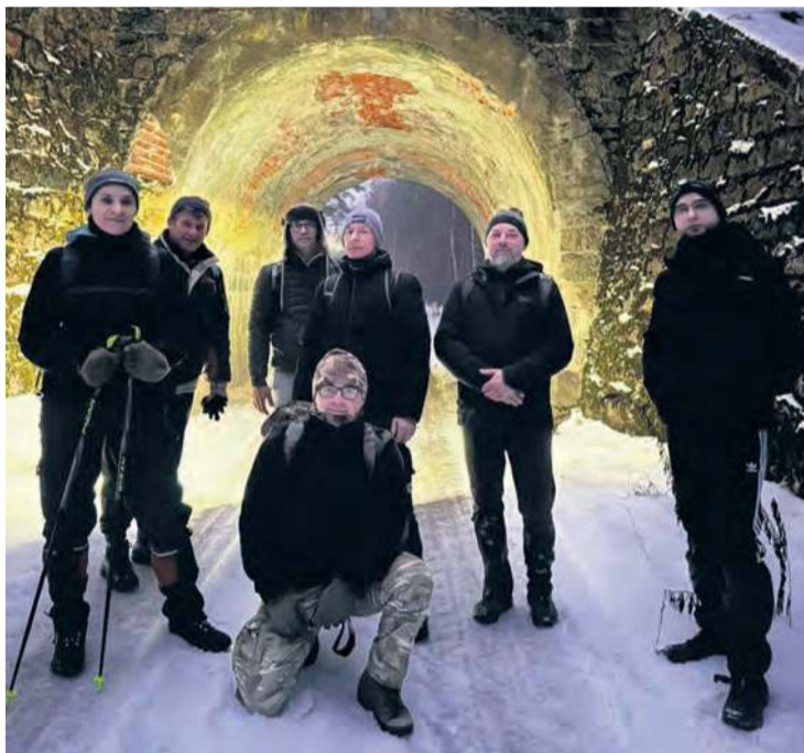
Najbliższa lekcja o historii i naturze z serca Borów Tucholskich odbędzie się już 21 lutego (sobota).