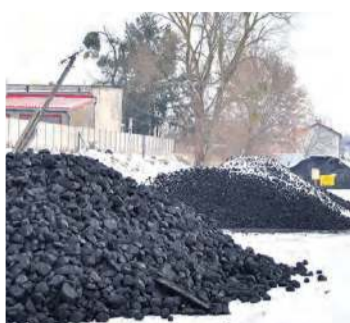
Tucholski Kapost spodziewa się dostawy pelletu pod koniec przyszłego tygodnia. Obecnie na składzie dostępny jest węgiel.

– Zaczęliśmy posiłkować się dostawami z Belgii, żeby zapewnić sprzedaż na bieżą-