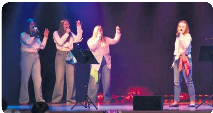
10-osobowa grupa artystów pracowała m.in. nad interpretacją utworów.