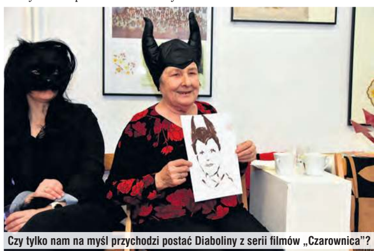
Czy tylko nam na myśl przychodzi postać Diaboliny z serii filmów „Czarownica”?