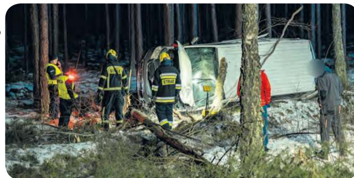
Oględziny służb po zdarzeniu, do którego doszło 13 lutego ok. godz. 22:00.

nujących strażaków, zespół ratownictwa medycznego i jedno auto dostawcze leżące daleko poza drogą. Widać było, że wypadając z niej, ścięło przynajmniej dwa drzewa, a na innych się