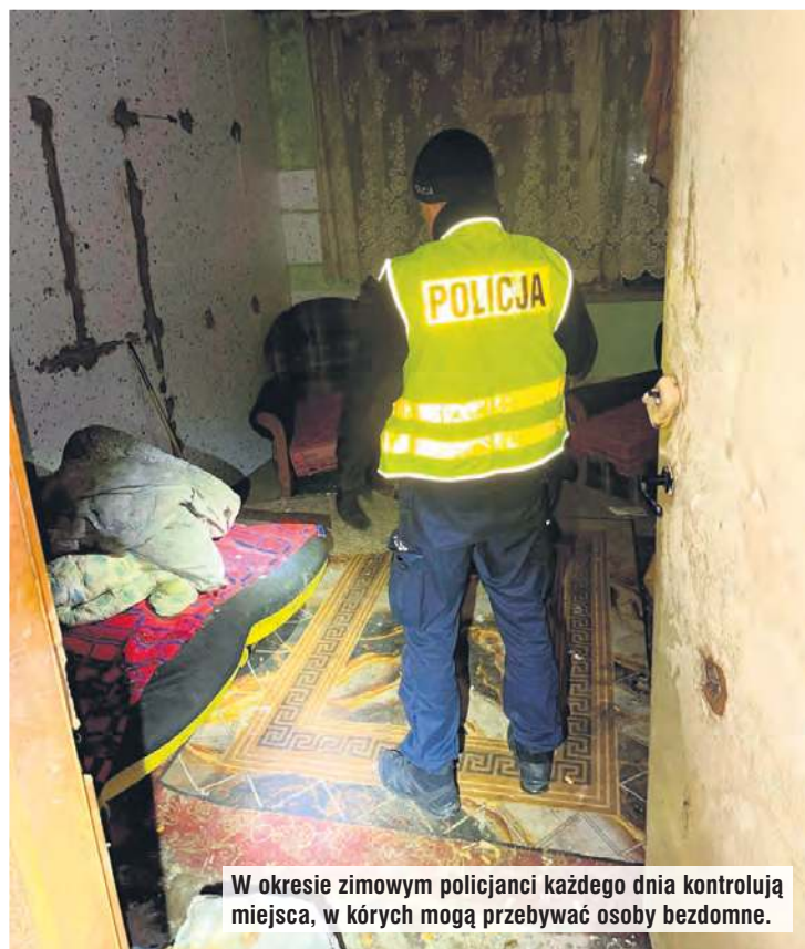
W okresie zimowym policjanci każdego dnia kontrolują miejsca, w których mogą przebywać osoby bezdomne.

– Przybyli na miejsce ratownicy stwierdzili, że temperatura ciała 36-latek wynosi około 34 stopni Celsjusza, co oznacza stan wychłodzenia organizmu i konieczność hospitalizacji – do-