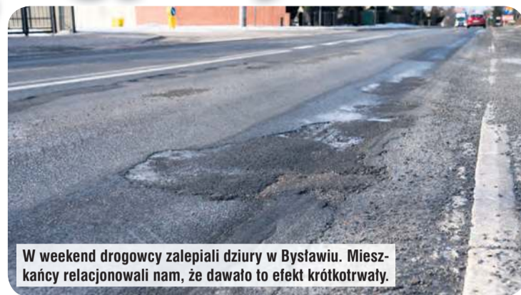
W weekend drogowcy zalepiali dziury w Bysławiu. Mieszkańcy relacjonowali nam, że dawało to efekt krótkotrwały.