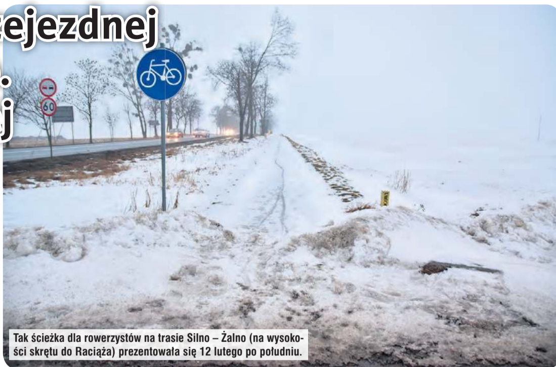
Tak ścieżka dla rowerzystów na trasie Silno – Żalno (na wysokości skrzyżowania do Raciąża) prezentowała się 12 lutego po południu.

– W ostatnim kwartale ubiegłego roku, jeszcze przed pierwszymi opadami śniegu, Zarząd Dróg Wojewódzkich w Bydgoszczy otrzymał od nas dokumenty związane z przekazaniem tej ścieżki w związku z zakończeniem trwałości projektu. Przez ostatnich pięć lat zajmowaliśmy się jej utrzymaniem. W odpowiedzi ZDW zasłonił się warunkami pogodowymi, czego nie rozumiem. Jak warunki atmosferyczne mogą przeszkadzać w odbiorze własnego składnika majątko-