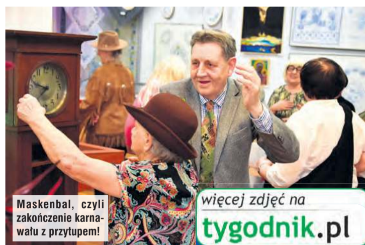
Maskenbal, czyli zakończenie karnawału z przytupem!