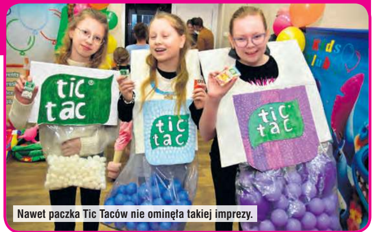
Nawet paczka Tic Taców nie ominęła takiej imprezy.

Organizatorzy wydarzenia zapewnili słodki poczęstu-