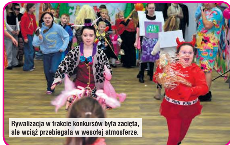
Rywalizacja w trakcie konkursów była zacięta, ale wciąż przebiegała w wesołej atmosferze.