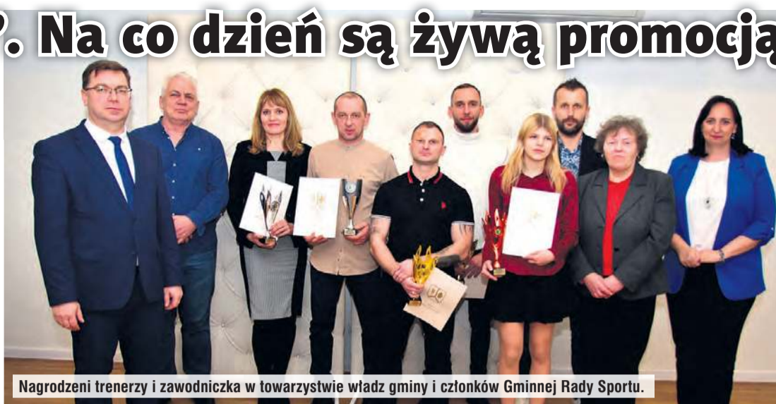
Nagrodzeni trenerzy i zawodniczka w towarzystwie władz gminy i członków Gminnej Rady Sportu.