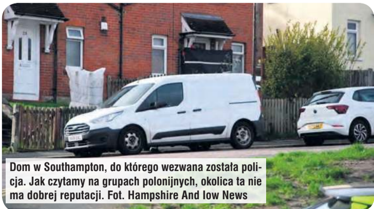
Dom w Southampton, do którego wezwana została policja. Jak czytamy na grupach polonijnych, okolica ta nie ma dobrej reputacji.

Informacja oparta na reprezentatywnym przykładzie: całkowita kwota kredytu 25 000,00 zł, okres kredytowania 36 miesięcy, raty równe kapitałowo-odsetkowe w wysokości 769,17 zł, roczne zmienne oprocentowanie nominalne 6,99% (stanowi sumę wartości WIBOR 6M, który obecnie stanowi 3,81% i marży Banku w wysokości 3,18 p.p.) kwota odsetek za cały okres kredytowania 2 689,95 zł, prowizja za udzielenie kredytu 0,00% całkowitej kwoty kredytu. Przy przyjęciu wyżej wymienionych parametrów RRSO wynosi 7,21%, całkowita kwota do zapłaty, stanowiąca sumę całkowitej kwoty kredytu oraz całkowitego kosztu kredytu wynosi 27 689,95 zł. Ostateczne warunki kredytowania uzależnione są od wyniku oceny wiarygodności i zdolności kredytowej Klienta, daty wypłaty kredytu oraz terminu regulowania zobowiązania kredytowego. Przykład sporządzony na datę 2.02.2026 r.