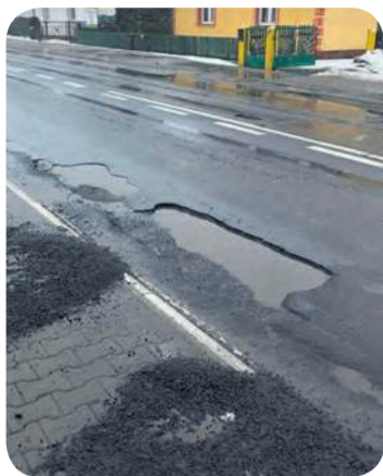
Niebezpieczne dziury na drodze wojewódzkiej w Bysławiu w piątek 13 lutego. Doszło tu do serii uszkodzeń opon i kół.

– W sobotę (14 lutego) wykonywane były tymczasowe naprawy masą na zimno. Możemy stosować tę mieszankę przy minusowych temperaturach przy głębszych ubytkach. Zaplanowany jest też solidny remont cząstkowy wczesną wiosną z użyciem standardowej