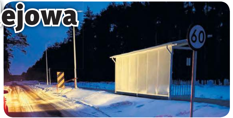
Przystanek Laski Tucholskie został wyremontowany we wrześniu 2024 r. W grudniu tego samego roku zbudowano oświetlenie peronu.