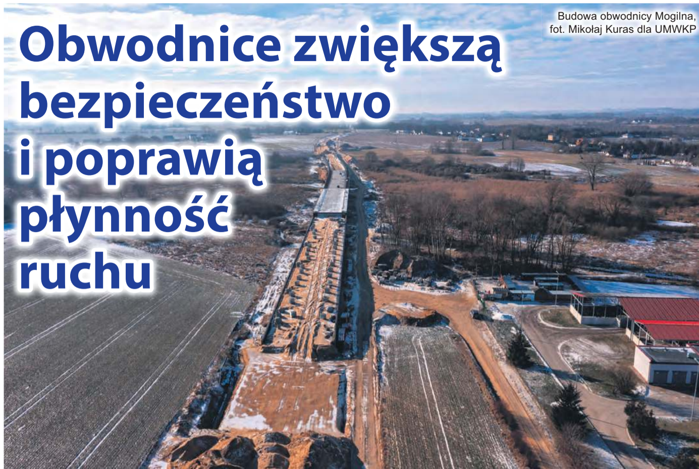
Budowa obwodnicy Mogilna