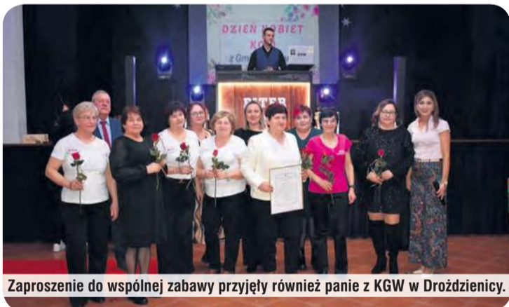
Zaproszenie do wspólnej zabawy przyjęły również panie z KGW w Drożdzienicy.