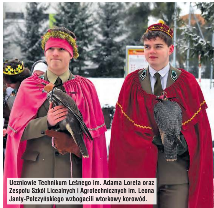
Uczniowie Technikum Leśnego im. Adama Loreta oraz Zespołu Szkół Licealnych i Agrotechnicznych im. Leona Janty-Polczyńskiego wzbogacili wtorkowy korowód.

więcej zdjęć na tygodnik.pl filmy na facebook.com/tygodniktucholski