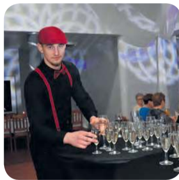
Męska obsługa spisala się wzorowo!

gażują w ciągu roku jest jeszcze cała masa.