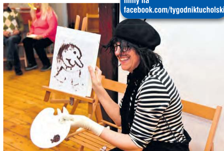
Francuska sztuka uliczna.

Jak na bal przystało, w jego trakcie można było skosztować