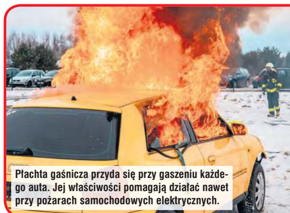
Płachta gaśnicza przyda się przy gaszeniu każdego auta. Jej właściwości pomagają działać nawet przy pożarach samochodowych elektrycznych.