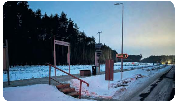
Powodem braku oświetlenia jest... mróz.

zainteresowanie problemem wynika również z tego, że stacja w Laskach Tucholskich została zmodernizowana, dlatego zdziwił się brakiem świecących lamp.