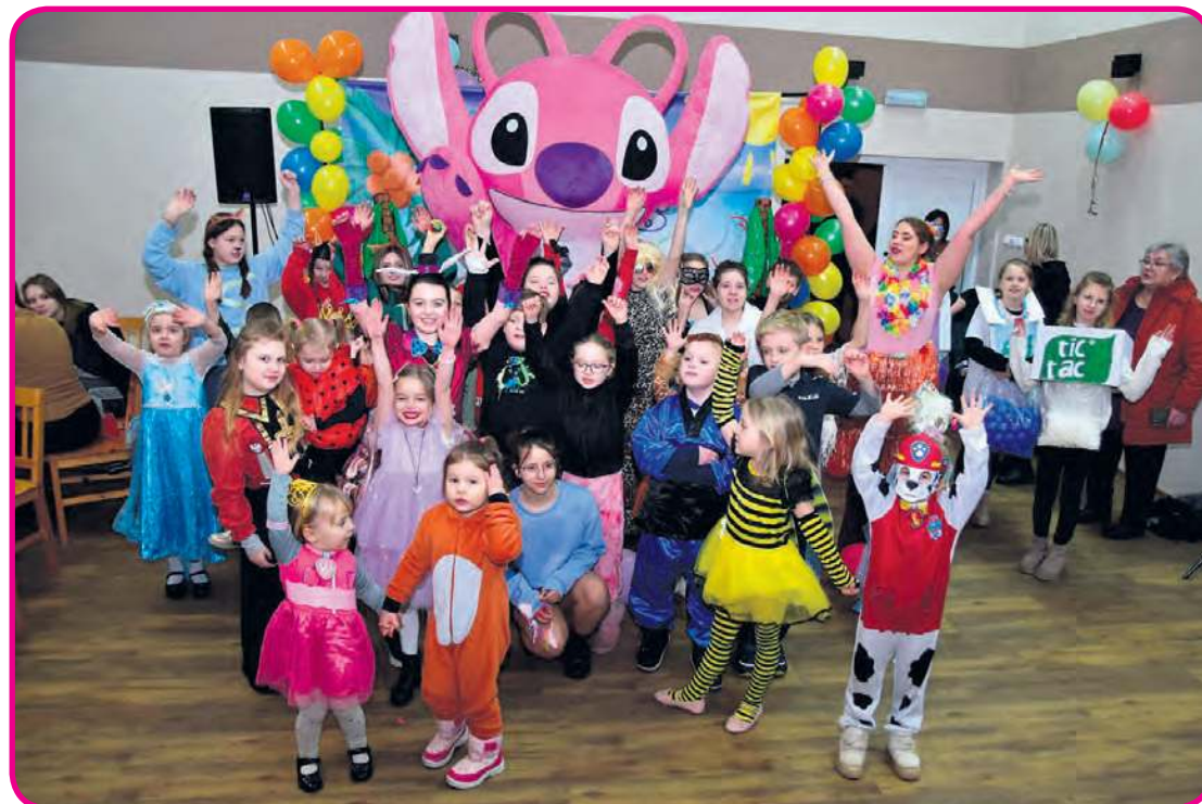
Razem z dziećmi bawiła się wielka maskotka Angel.