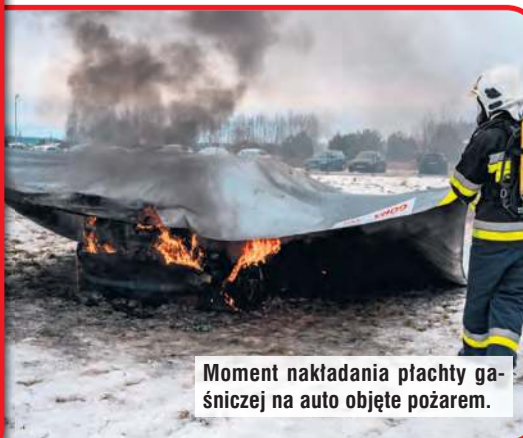
Moment nakładania płachty gaśniczej na auto objęte pożarem.