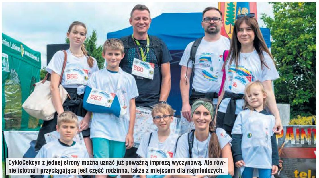
CykloCekcyn z jednej strony można uznać już poważną imprezą wyczynową. Ale równie istotna i przyciągająca jest część rodzinna, także z miejscem dla najmłodszych.