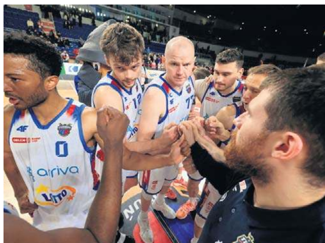
Twarde Pierniki mają dziesięć zwycięstw na koncie i nie zamierzają się zatrzymywać w tym sezonie

Torunianie z sześciu ostatnich meczów cztery rozegrali we własnej hali z Dzikami Warszawa, Górnikiem Wałbrzych, Śląskiem Wrocław i Arką Gdynia, dwa wyjazdy to Gliwice i Sopot. Nie jest to łatwy terminarz, ale też Twarde Pierniki stały się specjalistami od niespodzianek. Jakże teraz szkoda dwóch przegranych w ostatnich akcjach meczów w Słupsku i Ostrowie, bo już teraz Arriva Lotto byłaby na dziesiątym miejscu. ©P