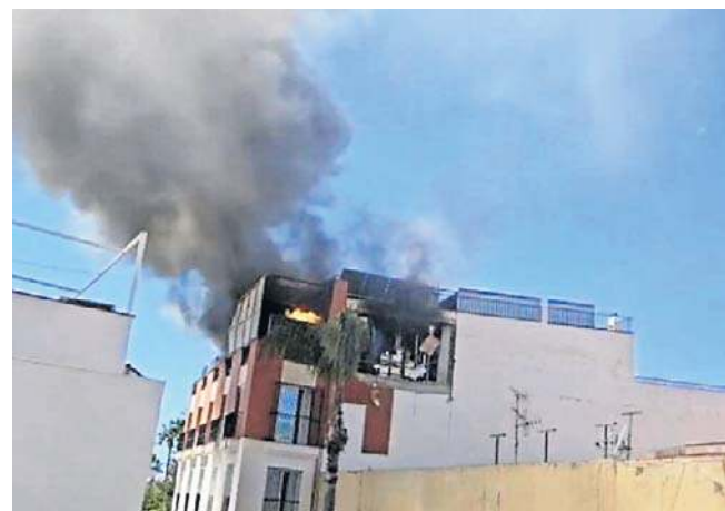
Mówi się o cudzie, że nikt nie zginął podczas pożaru w hiszpańskim mieście Almunecar