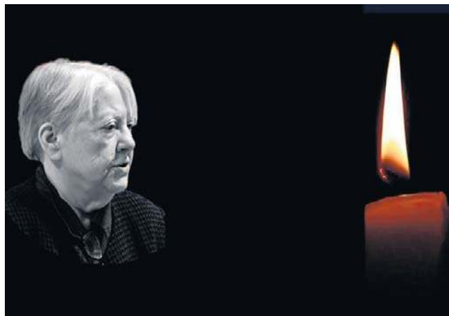
Uroczystości pogrzebowe profesor Magdaleny Niedzielskiej odbędą się w środę, 1 kwietnia

Uroczystości pogrzebowe rozpoczną się 1 kwietnia o godz. 12 mszą w kościele na Rybakach. Ceremonia pogrzebowa odbędzie się na cmentarzu parafialnym przy ul. Wybickiego 78-80. ©