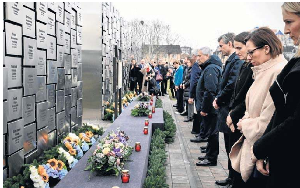
Ministrowie złożyli znicze pod pomnikiem ofiar zbrodni w Buczy i oddali hołd pamięci Ukraińców, brutalnie zamordowanych w tym miejscu cztery lata temu

„To scenariusz, który Rosja stosuje wszędzie tam, gdzie