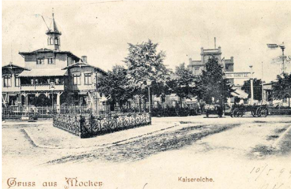
Cesarski dąb i latarnie przed zakładami Borna, czyli na dzisiejszym skrzyżowaniu Grudziądzkiej i Kościuszki w Toruniu

„Mieszkaniec Mokrego nie będzie już żył obok toruńskiego patrycjusza jako odrabiający pańszczyzną plebejusz czy pół-