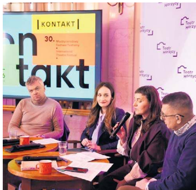
Prezentacja programu 30. Międzynarodowego Festiwalu Teatralnego „Kontakt” w Toruniu

W programie tegorocznego „Kontakt” jest 11 spektakli