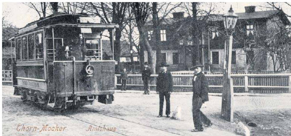
Urząd Gminy Mokre. Budynek stoi do dziś przy ulicy Kościuszki 24

Wiosenne przeprowadzki spowodowane były tym, że podczas zaborów umowy najmu mieszkań podpisywano na pół roku.