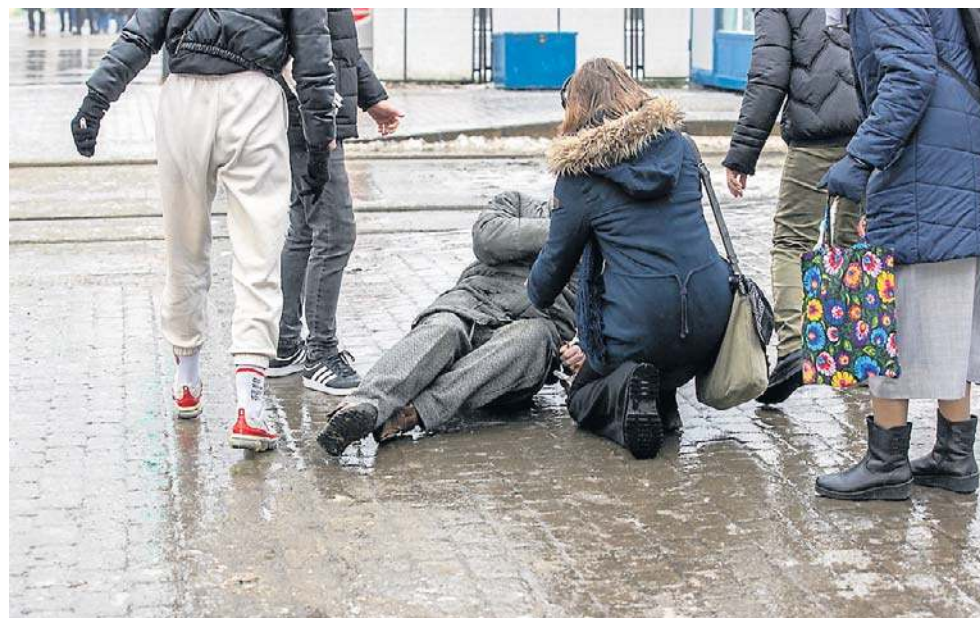
Zagrozenie upadkami rośnie z wiekiem. Przyczyniają się do niego zmiany fizjologiczne, jak utrata masy mięśniowej, osteoporoza i problemy z narządami zmysłów

- W ciągu ostatnich kilkunastu lat nastąpiły poważne zmiany w rodzaju wypadków, które najbardziej zagrażają ży-