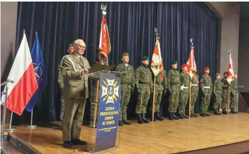
Przemawia przedstawiciel Związku Oficerów Rezerwy RP