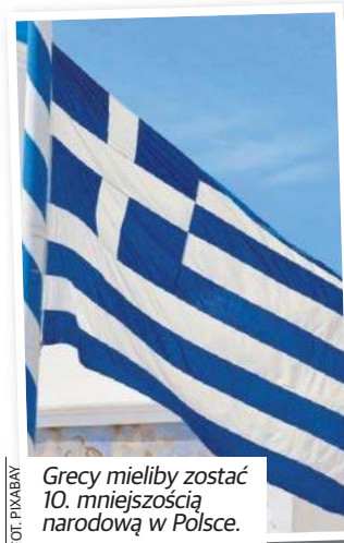
Greki mieliby zostać 10. mniejszością narodową w Polsce.

Widać, że Greki od dawna są z nami. Jest to ważna część naszego społeczeństwa. Myślę, że rozpoczęcie tej dyskusji, która -