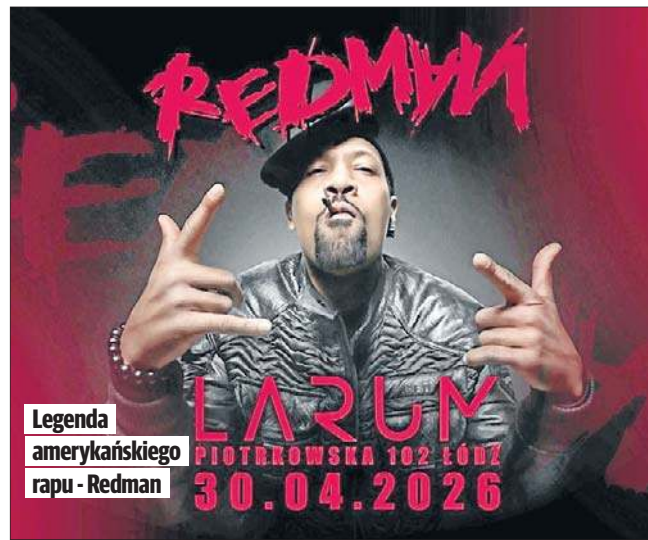
Legenda amerykańskiego rapu - Redman

Występ przed Redmanem to dla nich nie tylko prestiż, ale też spełnienie jednego z wielu dziecięcych marzeń.