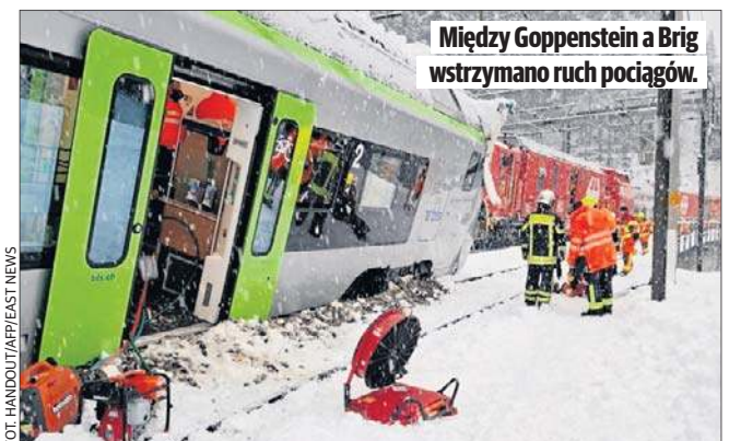
Między Goppenstein a Brig wstrzymano ruch pociągów.

KE w opublikowanym raporcie przyjrzała się temu, jak kraje członkowskie radzą sobie z realizowaniem zobowiązań dotyczących bezpieczeństwa ruchu drogowego. W każdym państwie do 2030 r. liczba ofiar śmiertelnych wypadków drogowych ma zmniejszyć się o połowę w stosunku do 2019 r. Z najnowszych danych wynika, że w 2024 r. w wypadkach drogowych w UE zginęło 19,9 tys. osób, co oznacza spadek liczby ofiar śmiertelnych o 440 osób i 2 proc. w porównaniu z 2023 r.