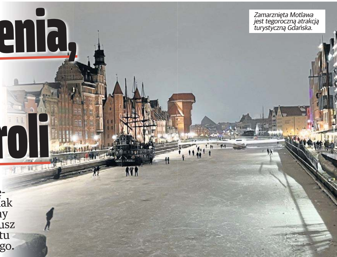
Zamarznięta Motława jest tegoroczną atrakcją turystyczną Gdańska.