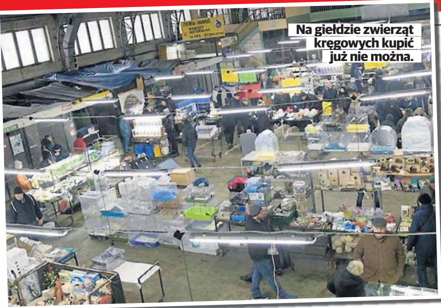
Na giełdzie zwierząt kregowych kupić już nie można.

• Doda skończyła 42 lata. Jak się zmieniła jej estradowy wizerunek? STR. 13