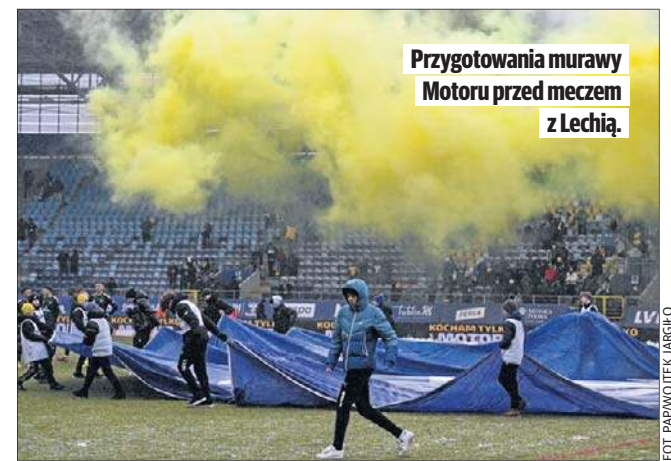
Przygotowania murawy Motoru przed meczem z Lechią.

Piłkarze Pogoni Szczecin wyprzedzili w tabeli Widzew. Łodzianie zajmują teraz 15 miejsce, a pod nimi w strefie spadkowej są: Arka Gdynia, Legia Warszawa i Termalika Nieciecza.