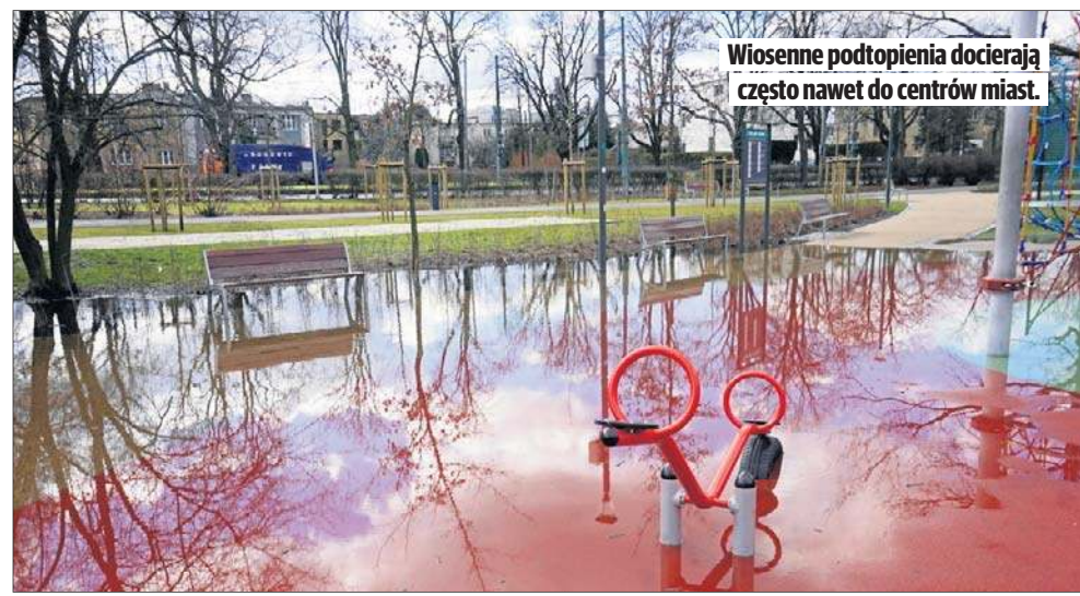
Wiosenne podtopienia docierają często nawet do centrów miast.

może zaobserwować, że granice między porami roku coraz częściej się zacierają. Znika na przykład przedwiosnie, trudno jest rozdzielić właściwy koniec zimy od początku wiosny i tak dalej. Czy znaczy to, że lepiej już było? Niekoniecznie. Żyjemy co prawda w bardziej dynamicznej sytuacji, ale mamy technologie, wiedzę i narzędzia, by się do niej zaadaptować. Musimy jednak też zaakceptować to, że świat, który pamiętamy z dzieciństwa nie wróci. Nie dlatego, że ktoś nam go zabrał, a dlatego, że fizyka zjawisk w atmosferze działa według swoich zasad, które są niezmiennie. Zasady fizyki, które kiedyś zostały odkryte, obowiązują do dziś i są niepodważalne. Dlatego zamiast nostalgii wolę po prostu pragmatyzm. Klimat się zmienia - to fakt, ale to, czy lepiej już było, zależy od tego, jak mądrze zareagujemy. Jeśli potraktujemy tę zmianę jako wyzwania, a nie wyrok, wcale nie musi być gorzej. Może być po prostu inaczej i od nas zależy, czy będzie to dla nas korzystne.