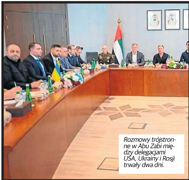
Rozmowy trójstronne w Abu Zabi między delegacjami USA, Ukrainy i Rosji trwały dwa dni.

„Ważne, aby zaplanowane w Genewie negocjacje były skuteczne, i dziękuję Stanom Zjednoczonym Ameryki za konstruktywne podejście. Poruszyliśmy również kwestię kolejności działań. Istotne jest, aby nastąpił postęp w sprawach gwarancji bezpieczeństwa oraz odbudowy gospodarczej” - napisał prezydent Ukrainy po monachijskim spotkaniu z szefem amerykańskiej dyplomacji Markiem Rubio.