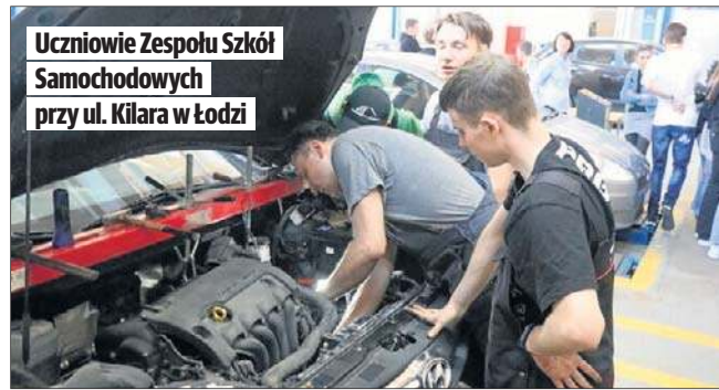
Uczniowie Zespołu Szkół Samochodowych przy ul. Kilara w Łodzi