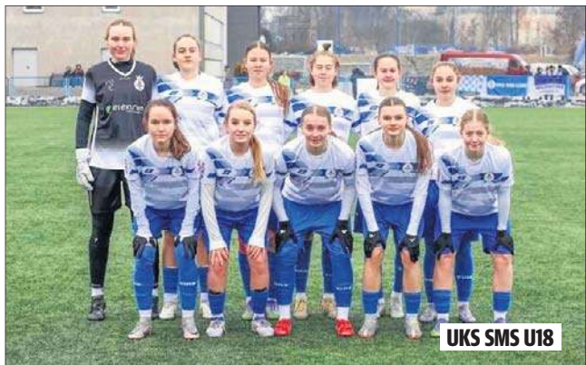
UKS SMS U18