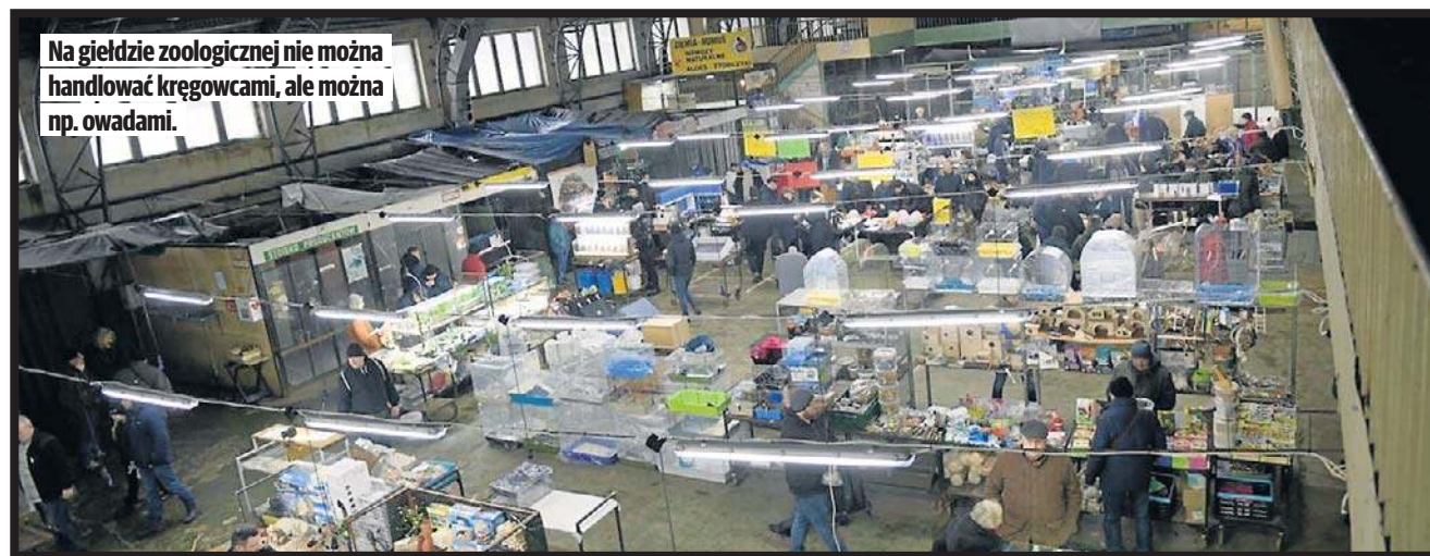
Na giełdzie zoologicznej nie można handlować kręgowcami, ale można np. owadami.

Na terenie MOSiR od prawie 2 lat organizowane są nielegalne targi zwierząt. Dopiero po skargach, które wpłynęły do inspektoratu weterynarii w styczniu, wprowadzono zakaz.