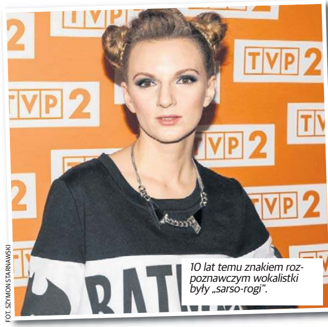
10 lat temu znakiem rozpoznawczym wokalistki były „sarso-rogi”.

No tak. Ale dwie twarze to na pewno za mało jak na moje życie. (Śmiech)