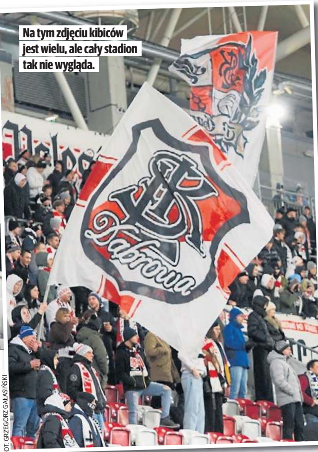
Na tym zdjęciu kibiców jest wielu, ale cały stadion tak nie wygląda.