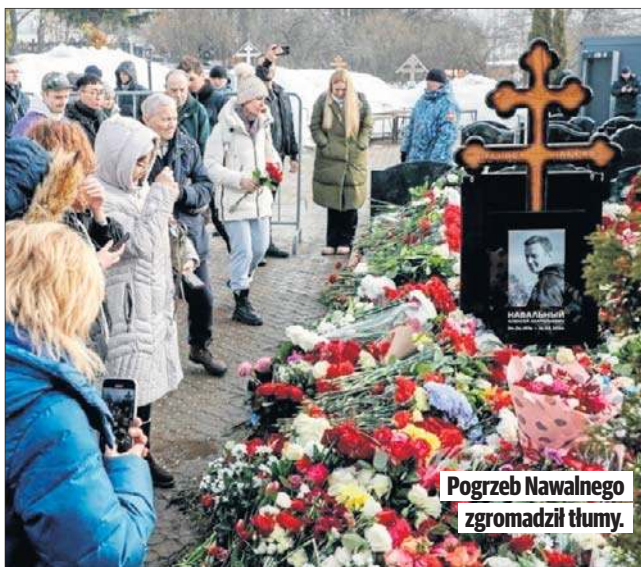
Pogrzeb Nawalnego zgromadził tłumy.

Dodała: - Myślę, że to potrwa jakiś czas, ale odkryjemy, kto to zrobił (...). Oczywiście pragniemy, by doszło do tego w naszym kraju i by sprawiedliwość triumfowała.