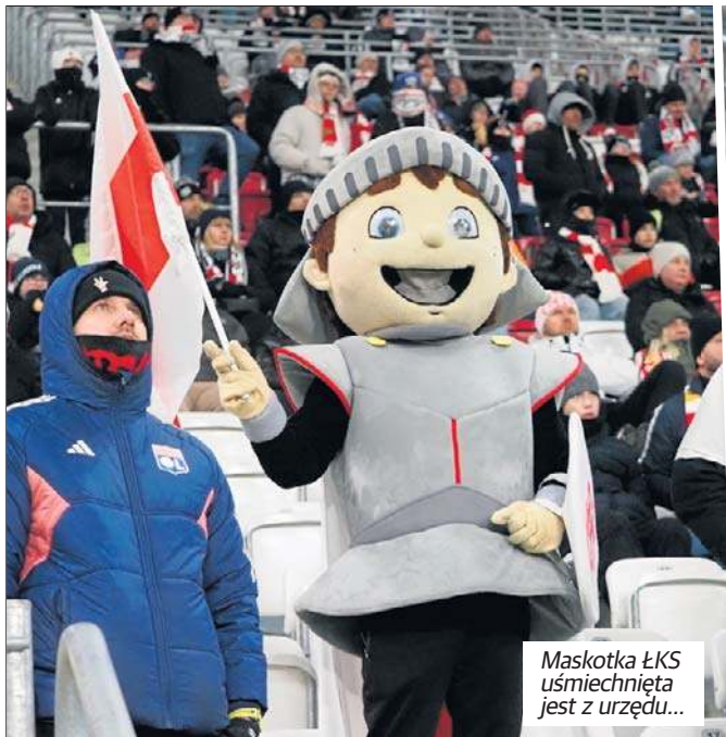
Maskotka ŁKS uśmiechnięta jest z urzędu...