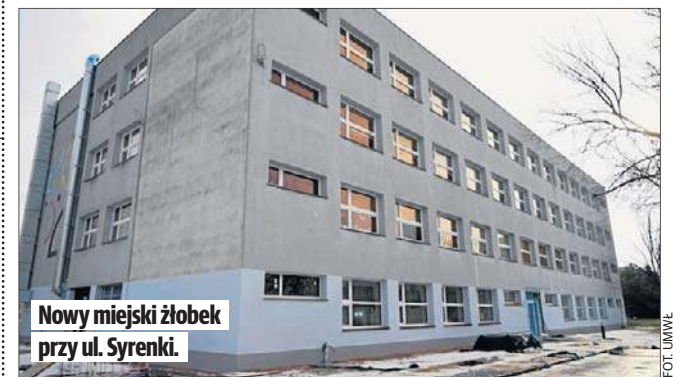
Nowy miejski żłobek przy ul. Syrenki.

Powstanie droga przeciwpożarowa, chodniki, 10 miejsc parkingowych oraz wiata śmietnikowa z zielonym pnączem. Drzewa i krzewy w dotychczasowym otoczeniu zostaną zachowane.