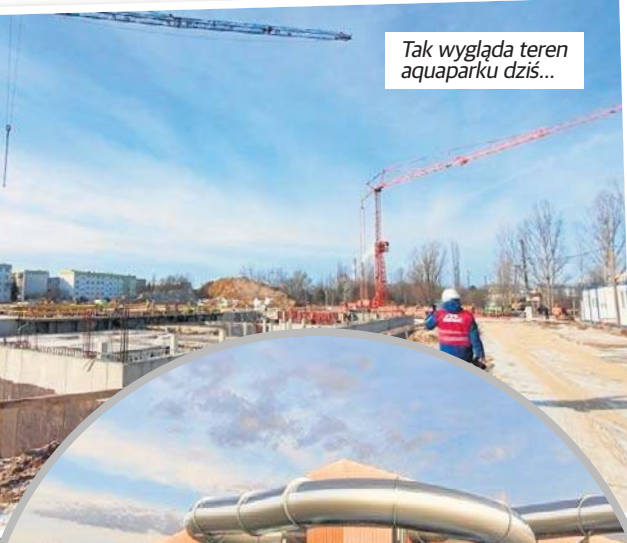
Tak wygląda teren aquaparku dziś...

- Trwają prace związane z przeniesieniem rur i instalacji ciepłowniczych, które znajdowały się w miejscu budowy. Dzięki temu teren za budynkiem będzie dostępny, a w przyszłości będzie można rozbudować aquapark, na przykład o ba-