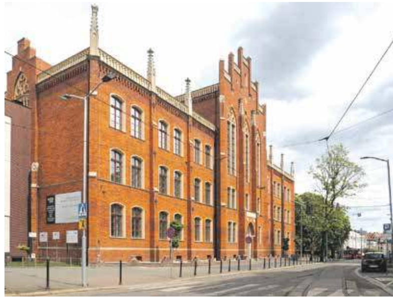
Wyremontowany gmach i aula. Na jubileusz szkoła prezentuje się pięknie

Zjazd absolwentów Państwowej Ogólnokształcącej Szkoły Muzycznej i II stopnia im. Fryderyka Chopina w Bytomiu odbędzie się w sobotę 18