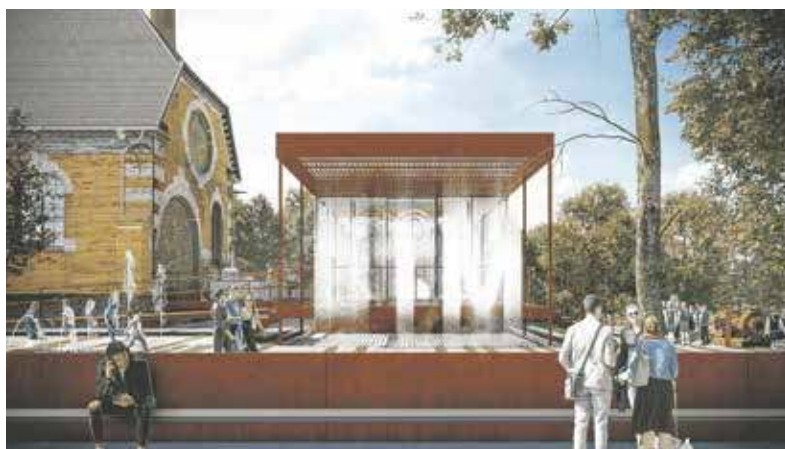
Koncepcje opracowane przez Medusa Group są niezwykle ciekawe

Rewitalizacja będzie głęboka. W jej efekcie powstanie nowoczesne, interaktywne centrum edukacyjne, którego misją będzie budowanie świadomości ekologicznej i nauka świadomego