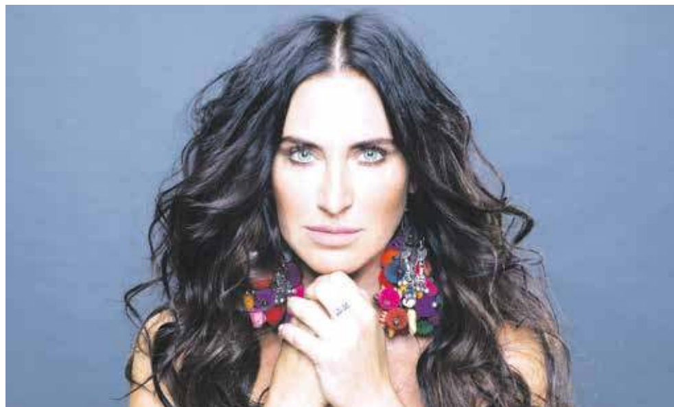
Kayah tym razem przedstawi jazzowe wersje swych piosenek