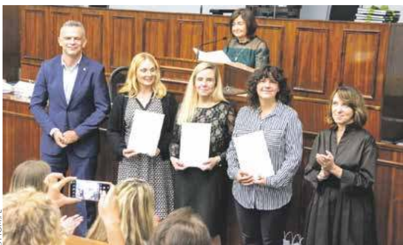
Nauczyciele z dyplomami za zdobycie awansu zawodowego