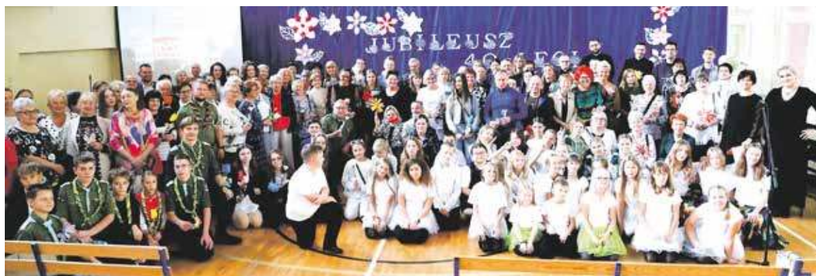
Szkoła w Miechowicach

BYTOM. PRZYSZEDŁ NOWY ROK SZKOLNY, A WRAZ Z NIM POWAŻNE ZMIANY W PRAWIE OŚWIATOWYM. DOTYCZĄ ONE ZARÓWNO UCZNIÓW, JAK I NAUCZYCIELI.