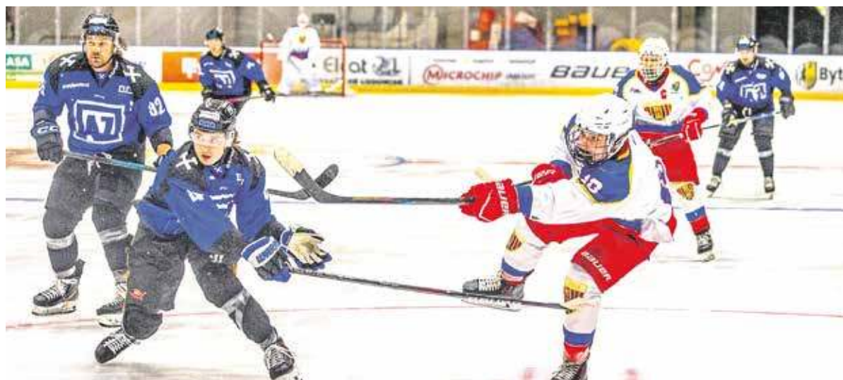
Czy bytomscy hokeiści poradzą sobie w THL?