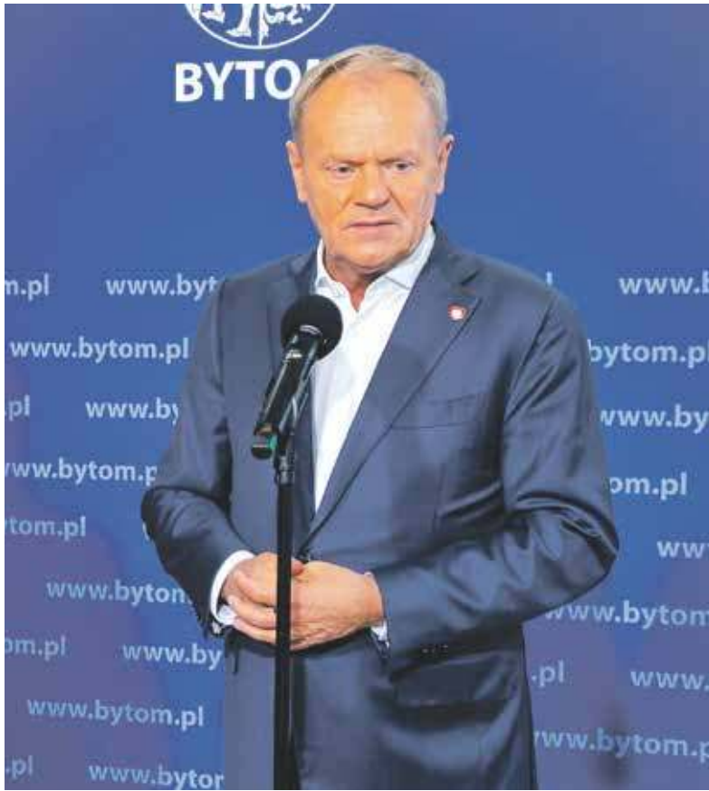
Premier Tusk obiecał w Bytomiu specjalne pieniądze dla Bytomia. No to czekamy...

A potem padają najważniejsze z naszego punktu widzenia i jakże pięknie brzmiące słowa: - Przyjechałem dzisiaj powiedzieć pre-