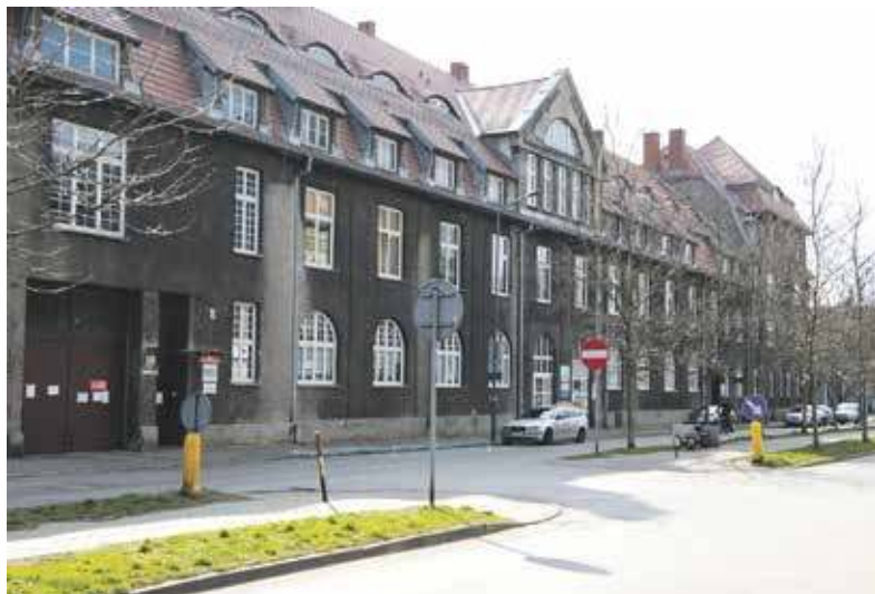
Po remoncie placówka zmieni swoje oblicze

Zgodnie z przyjętym planem wszystkie prace powinny dobiec końca w czerwcu 2026 roku. Firma działa