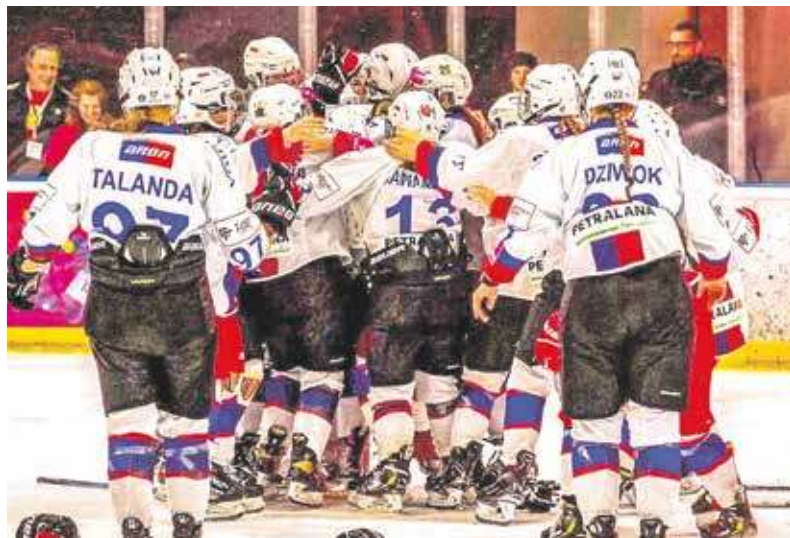
Czy niebiesko-czerwone będą się cieszyć z kolejnego mistrzostwa?

BYTOM. KIBICE HOKEJA DŁUGO MUSIELI CZEKAĆ, ALE W KOŃCU SIĘ DOCZEKALI. BRONIĄCE TYTUŁU MISTRZA POLSKI I STARAJĄCE SIĘ O TO, BY GO ZDOBYĆ PO RAZ PIĘTNASTY, A JEDENASTY Z RZĘDU ZAWODNICZKI POLONII BYTOM ZAINAUGUROWAŁY SEZON W MINIONĄ NIEDZIELĘ. PANOWIE Z KOLEI PO 6 LATACH WRACAJĄ DO THL, A WIĘC EKSTRAKLASY. PIERWSZY MECZ ROZEGRAJĄ 12 WRZEŚNIA, ALE NAJPIERW SPOTKAJĄ SIĘ ZE SWOIMI FANAMI.