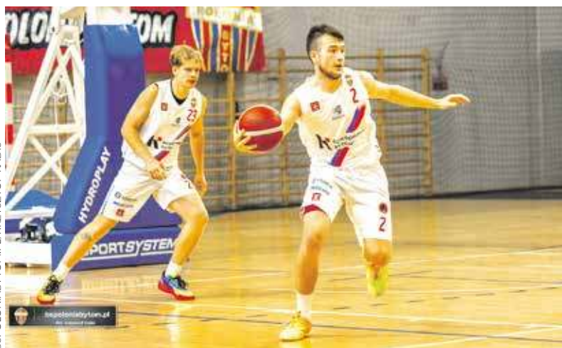
Na razie w sparingach idzie niebiesko-czerwonym bardzo dobrze

Kilkanaście dni zostało do inauguracji sezonu koszykarskiego w 2. Lidze Mężczyzn. Przygotowująca się do niego całkowicie odmieniona Polonia Bytom rozegrała w minionym tygodniu dwa kolejne sparingi. Obydwa zwycięskie.