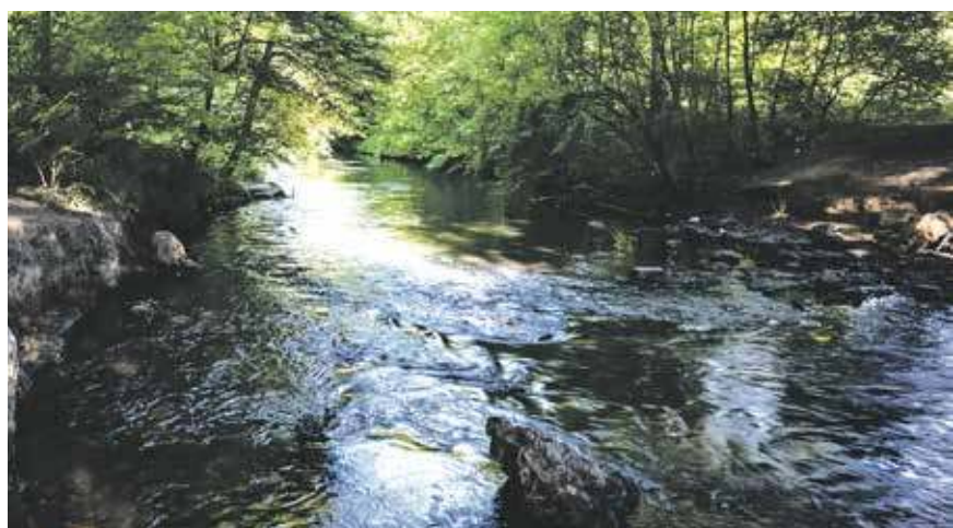
Bytomka płynie przez kilka śląskich miast

Jak zadbać o rzekę Bytomkę? Jak ją chronić, a jednocześnie wykorzystać do celów rekreacyjnych? Odpowiedzi na te pytania poszukają uczestnicy warsztatów organizowanych przez Górnośląsko-Zagłębiowską Metropolię.