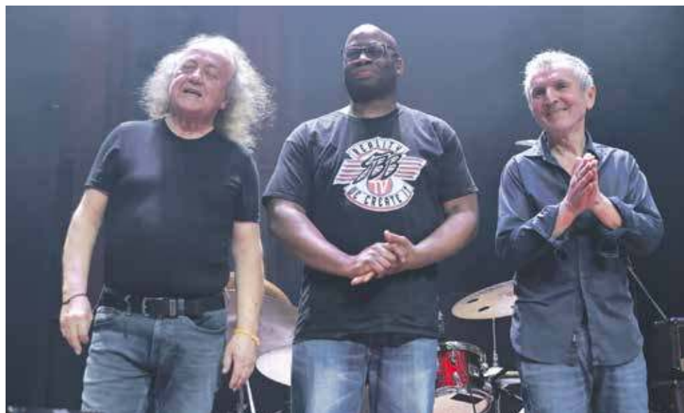
Zespół SBB kiedyś w BeCeKu organizował swoje próby. W październiku wróci do tego miejsca

Zaledwie kilka dni po tej uczcie, bo już 10 października o godz. 19 czeka nas kolejna. Tym razem zaprosi na nią legendarny zespół rocka progresywnego SBB, czyli Silesian Blues Band, a później Szukaj, Burz, Buduj. Krytycy uznali SBB najlepszym zespołem muzycznym ostatniego 50-lecia w Polsce. Dziś to trójka muzyków grających pod wodzą Józefa Skrzeka (vocal, instrumenty kla-