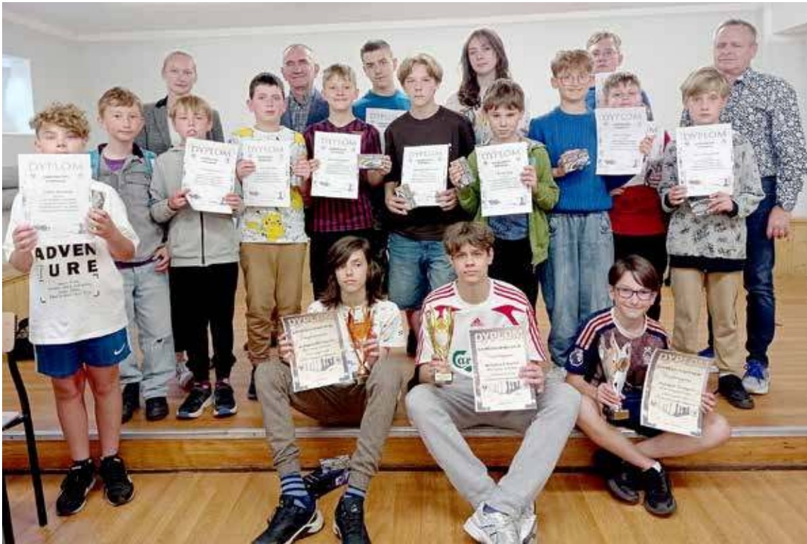
W rywalizacji uczestniczyło 16 uczestników