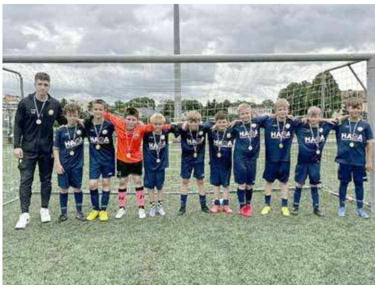
Zawody pierwszej piłki nasza drużyna tym razem rozegrała na stadionie w Łobzie

Doświadczony nauczyciel z kilkunastoletnim stażem udzieli korepetycji z matematyki w okres wakacyjnym, w milej i pogodniej atmosferze. Tel. 609 396 570