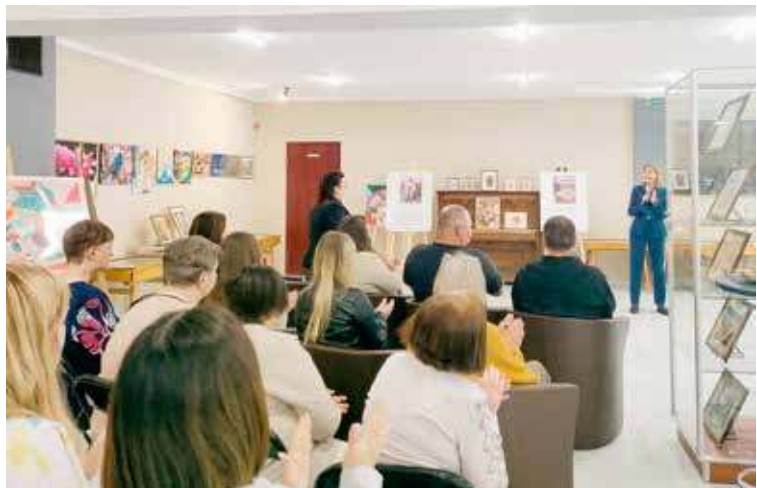
Wystawę obejrzeć można nie tylko w trakcie zorganizowanego wernisażu