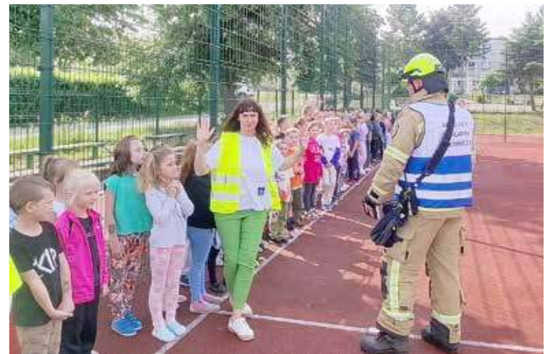
Uczniowie dotarli już do miejsca ewakuacji

W trakcie treningu uczono się m.in. sprawnej ewakuacji budynku, lokalizowania potencjalnych zagrożeń, a także