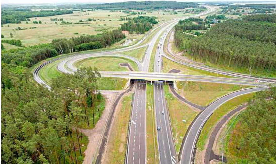
Ruch na odcinku Dargobądz-Troszyn drogi ekspresowej S3 odbywa się obecnie jedną nitką. Będzie to niewystarczające w okresie wakacyjnym.

Teraz, w czerwcu 2025 roku, lider konsorcjum (PRD Nowogard) budującego odcinek drogi ekspresowej S3 apeluje do Prezesa Rady Ministrów o pilne doprowadzenie do dokapitalizowania kontraktu oraz zagwarantowanie pokrycia nadzwyczajnych, niemożliwych do przewidzenia w 2020 roku kosztów inwestycji. Bez tego kontynuacja prac w terminie pozwalającym na pełną przejezdność trasą S3 przed wakacjami staje pod znakiem zapytania, a kolejnym firmom pracującym na kontrakcie firm grożą poważne