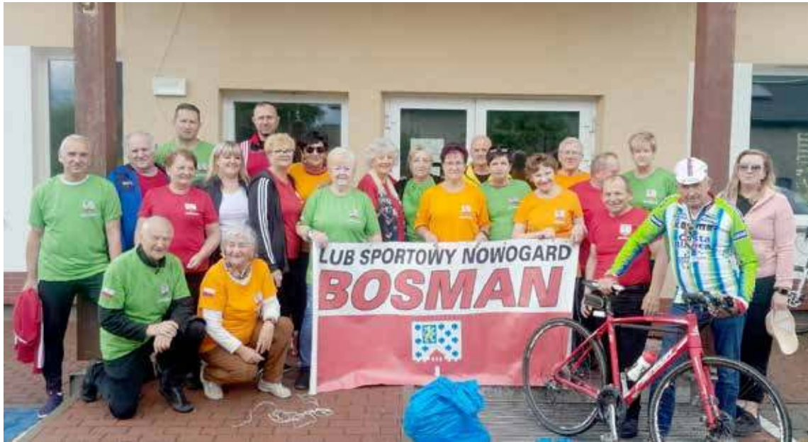
Bosman zameldował się tym razem w Wyszomierzu

Wyjazd do Wyszomierza nastąpił o godz. 11 sprzed domu harcerza. I tu na linii startu stanęła grupa 20-osobowa. Trasa prowadziła nad jeziorem ścieżką rowerową, następnie przez Olchowo i na ostatniej prostej doszło do zapowiadanej zbiórki śmieci z drogi i poboczy. Tutaj pojawiło się ogromne zaskoczenie, gdyż w okolicach Wyszomierza zebrana została najmniejsza liczba odpadów od kilku lat, a w zasadzie od czasu, gdy grupa po to pierwszy podjęła się tego zadania. Zebrano zaledwie trzy nieduże woreczki. Z pewnością duża zasługa w tym samych mieszkańców, którzy z dbałością podchodzą do ochrony środowiska i utrzymania porządku, co można wskazać jako wzór do naśladowania. Zadanie polegające na rowerowych wyprawach zostało dofinansowane z budżetu Gminy Nowogard w