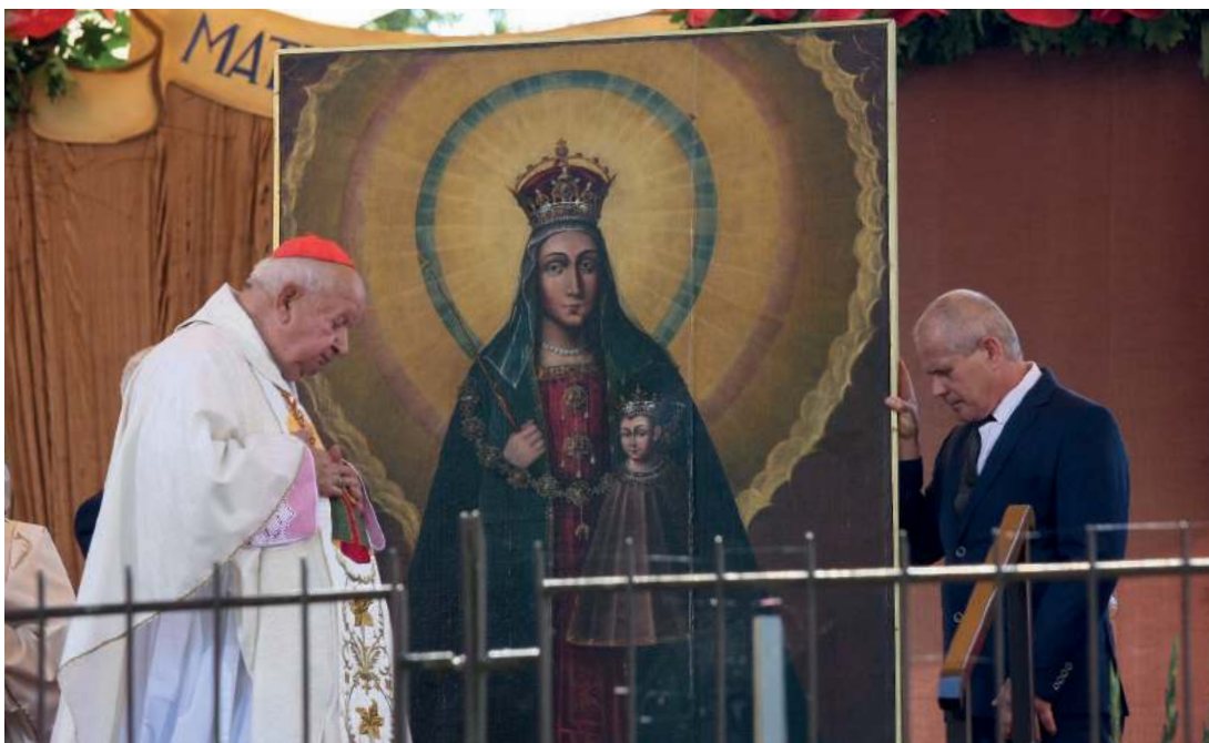
Tuż przed koronacją.