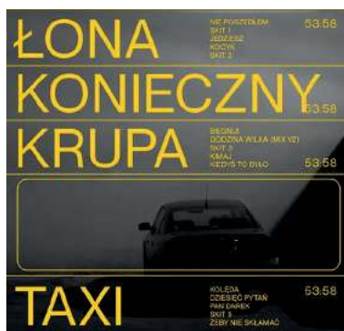
„Łona”, Konieczny, Krupa, TAXI, Def Jam Recordings

Nostalgia, jazz i światła nocy, bo noc jest tym żywiołem, który odsłania ukryte warstwy miasta. Samochód może wydawać się bezpieczną kryjówką, a jednak mimo zaporowanej szyby nie sposób uciec od mroków tego, co na zewnątrz. Gdzieś w tle uliczne zamieszki albo historia taksówkarza Saszy, który musiał z bratem zdecydować, który z nich opuści Polskę i pojedzie bronić Chersonia. ■