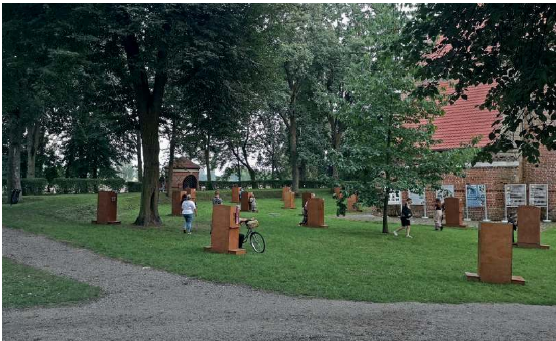
Spowiedź na kodeńskich łąkach. Niezwykły obrazek sierpniowego odpustu u ojców oblatów.

Synoptycy obiecują, że dziś słupki rtęci znowu przekroczą 30 stopni Celsjusza. Prowadząca po leniwej równinie droga co rusz zaprasza nas do zielonych lasów. Spomiędzy liściastych gałęzi drzew raz po raz widać przeciskające się uparcie promienie słoneczne. Nie wszystkim się udaje. Dzięki temu w lesie czuć kojący chłód. Odpocznienie. Nie na długo jednak. Kawałek za prawosławnym cmentarzem w Zaborowie las się kończy. Perspektywa naraz się rozszerza. Przed nami widać już zielonkawą kościelną wieżę z połyskującym w słońcu złotym krzyżem. To Kodeń. Będziemy tam za trzy minuty. A nie, przepraszam. Spoglądam na nawigację. Wyznaczona trasa jest w tej chwili cała na czerwono. Tuż przed miejscowością czeka nas 10-minutowy korek. To jest ten jedyny dzień w roku, gdy nawet ta podlaska wieś musi doświadczyć tego, czym jest powolna jazda i stanie na zderzaku poprzedzającego nas auta.