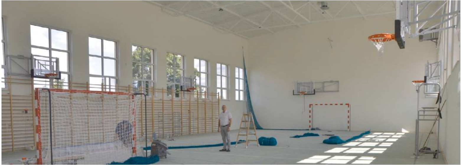
Prace nad budową hali są kontrolowane przez wójta gminy

Sala gimnastyczna będzie w pełni wyposażona w nowoczesny sprzęt sportowy, co pozwoli na prowadzenie zajęć wychowania fizycznego na najwyższym poziomie. Uczniowie na pewno