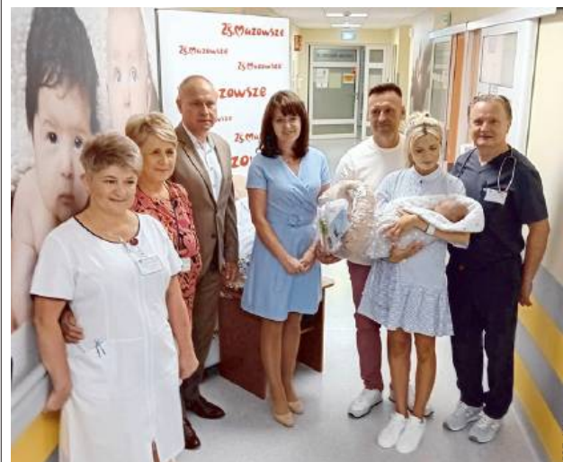
Pierwsza wyprawka wręczona!