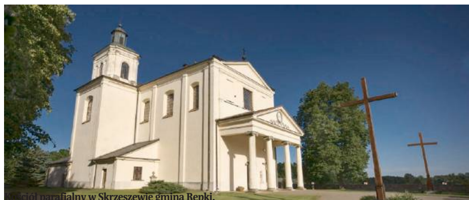
Kościół parafialny w Skrzyszewie gmina Repki.