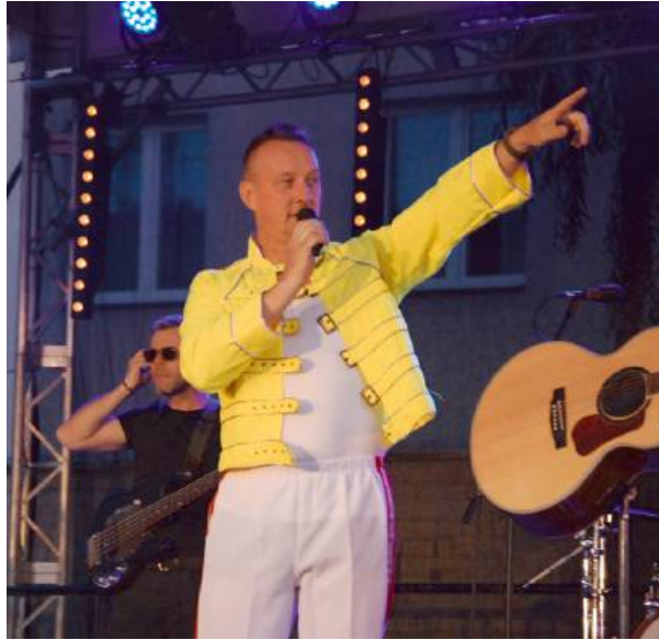
SilkQueen specjalizuje się w interpretacji utworów Queen.

Przed nami jeszcze jeden koncert w programie VIII Letniego Festiwalu pod Muralem. 26 czerwca (piątek) o godz. 21.00 zaprezentuje się zespół Czarnina - czteroosobowy skład grający akustycznie tradycyjne melodie romskie, bałkańskie czy bliskowschodnie, reinterpretowane i aranżowane na nowo. Warto się wybrać! PA