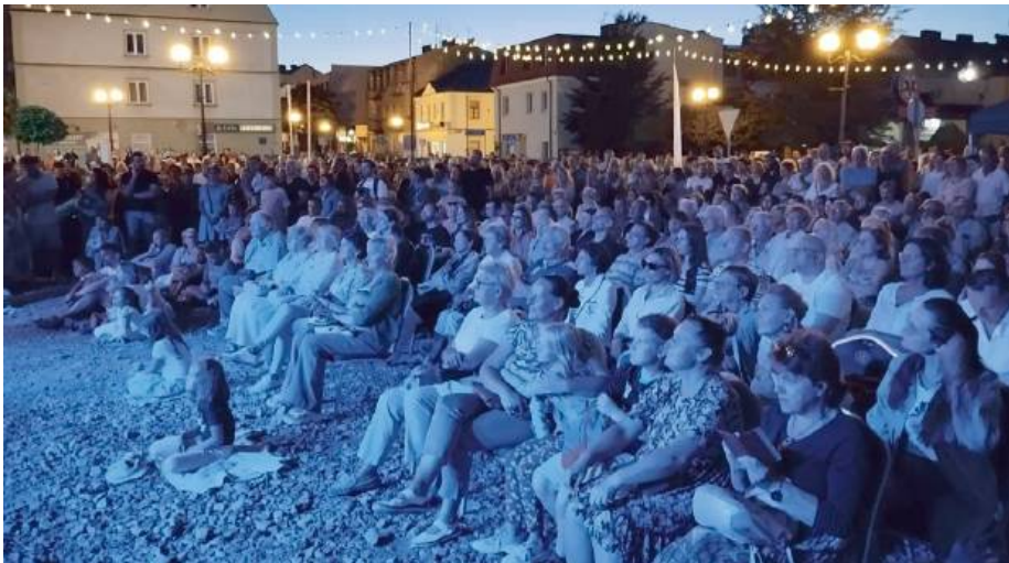
To widowisko z pewnością należy do tych, które zostaną w pamięci na długo.