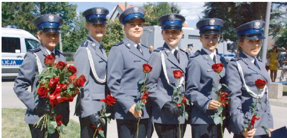
Pięć piękna ma w policyjnych szeregach silną reprezentację!

Komendant wojewódzki wspominał w swojej przemowie także o pracownikach cywilnych i rodzinach funkcyj-