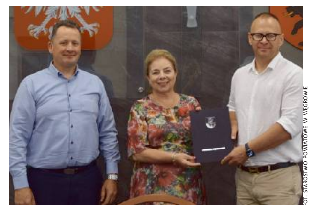
Umowa przewiduje wykonanie czterech zadań.

Czwarte zadanie, polegające na modernizacji drogi powiatowej nr 4259W ul. Nadrzecznej