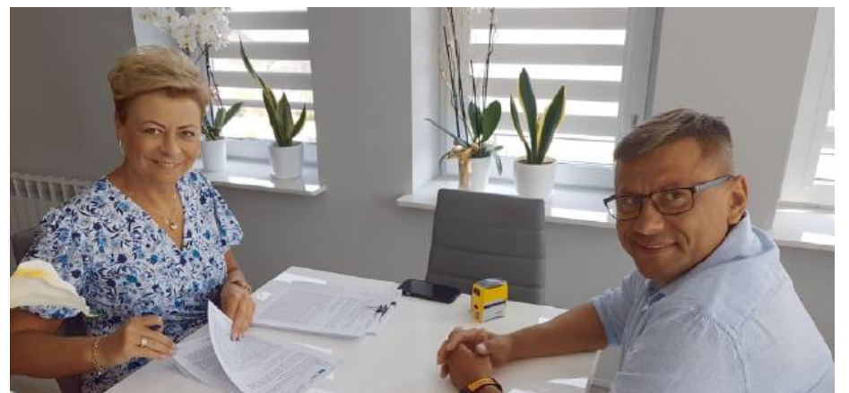
Podpisanie umowy z wykonawcą, prezesem firmy ZIS Łuka

Widać w gminie Mokobody, ani pracownicy, ani pani wójt nie mogą narzekać na stagnację i nudę. A każda, kolejna podpisana umowa uświadamia mieszkańców w przekonaniu, że dokonali dobrego, rozwojowego dla gminy wyboru. RED