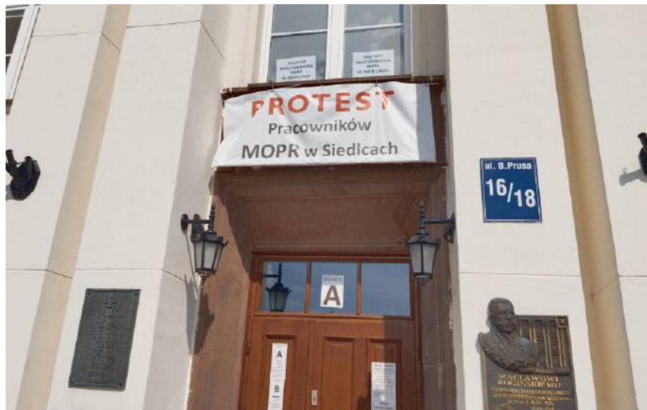
Czy dojdzie do tego, że pracownicy odejdą od biurki i nie będą przyjmować interesantów?

Spór zbiorowy trwa już od 19 lutego, natomiast 8 marca odbyło się spotkanie w ramach rokowań, które zakończyło się fiaskiem. - Rokowania przebiegły w atmosferze dosyć dużego zrozumienia dla potrzeby wzrostu płac ze strony dyrektora pla-