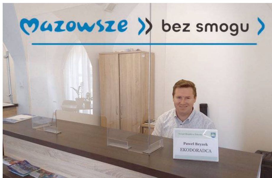
Ekodoradca już na swoim stanowisku pracy

Stanowisko Ekodoradcy znajduje się na parterze budynku Urzędu Miejskiego obok Kasy. Kontakt telefoniczny pod numerem 25 629 93 80. MAT.PRAS.