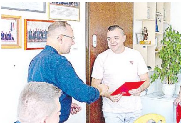
Radni swoją funkcję będą pełnić społecznie do 2029 roku