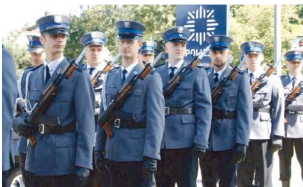
Panów policjantów również nie brakuje.