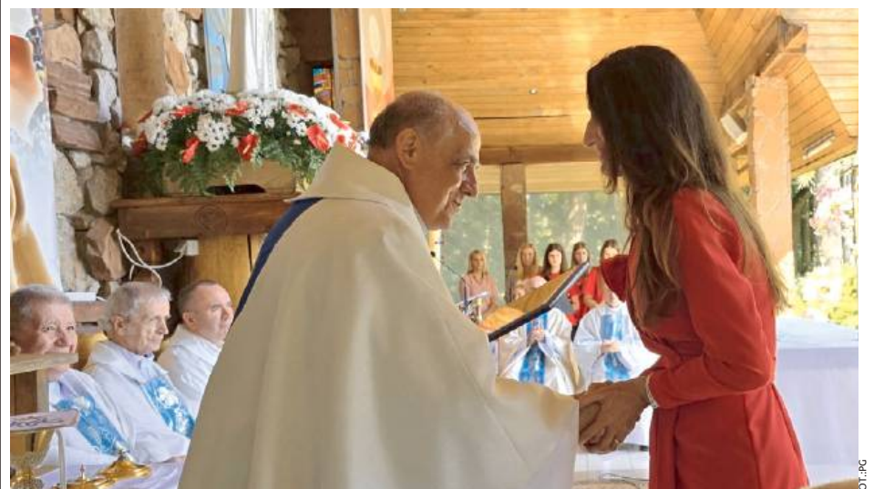
Gratulacje przekazała również starosta powiatu garwolińskiego

Po uroczystej mszy świętej odbył się piknik rodzinny z atrakcjami dla dzieci oraz pysznościami serwowanymi przez KGW, a na zakończenie wydarzenia niezapomniana potańcówka.