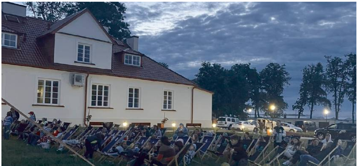
Spotkania przy blasku gwiazd cieszą się ogromnym zainteresowaniem