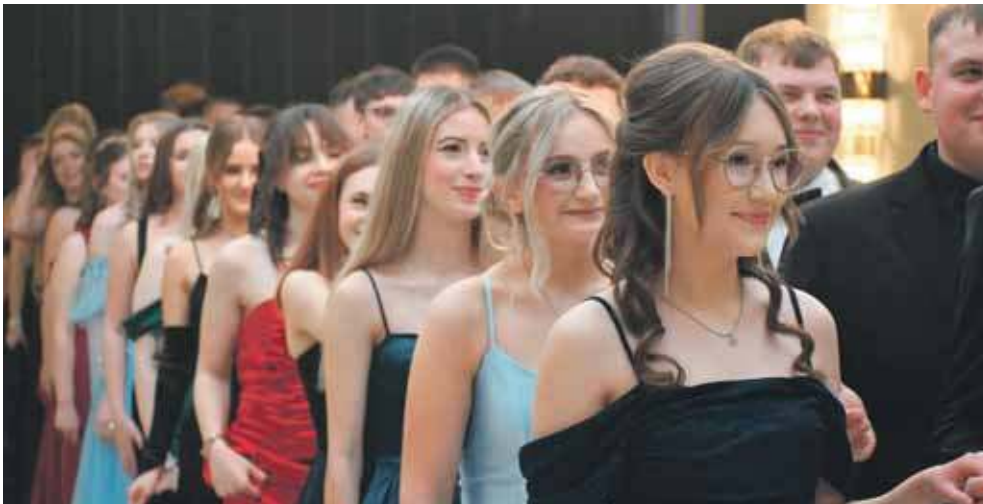
Studniówka w Paniówkach. Najpierw polonez

16 stycznia zajrzeliśmy na studniówkową zabawę, którą zorganizowali uczniowie Zespołu Szkół Centrum Kształcenia Rolniczego w Nakle Śląskim. Odbędzie się w Białym Domu w podgliwickich