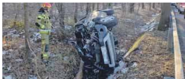
65-letnia mieszkanka Zabrza straciła panowanie nad renault