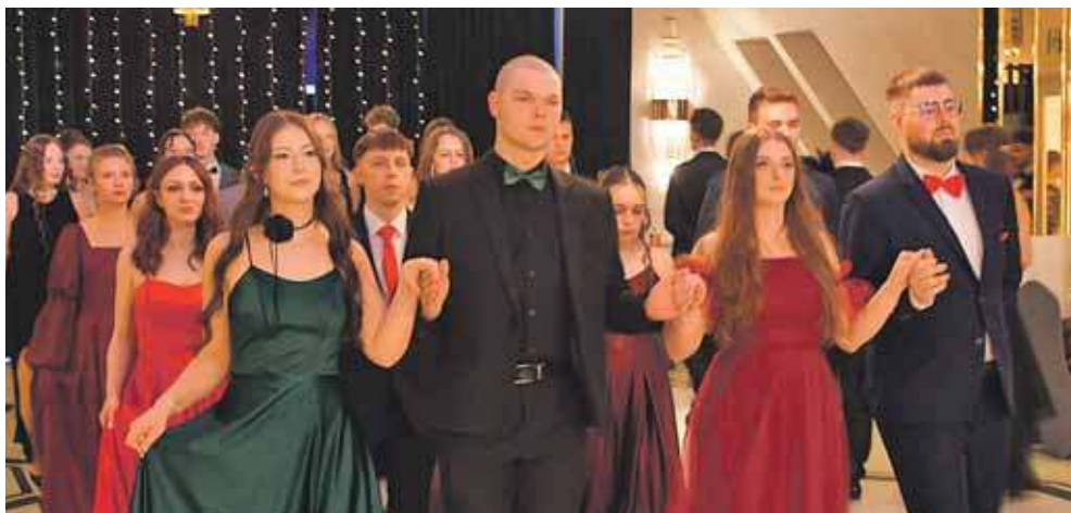
Poloneza czas zacząć

W niedzielę, 25 stycznia w eleganckich wnętrzach Białego Domu w Paniówkach odbyła się studniówka uczniów Zespołu Szkół Chemiczno-Medycznych i Ogólnokształcą-