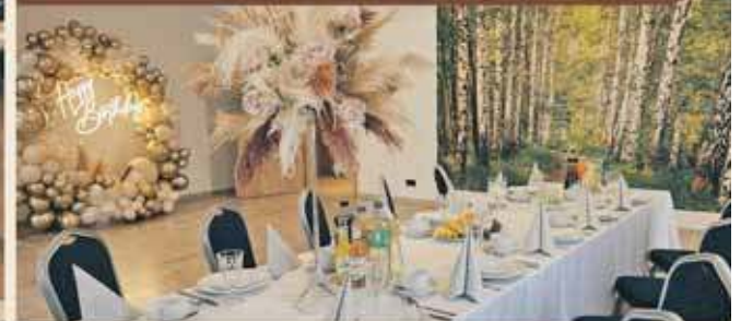
Sala Kominkowa 25-38 osób