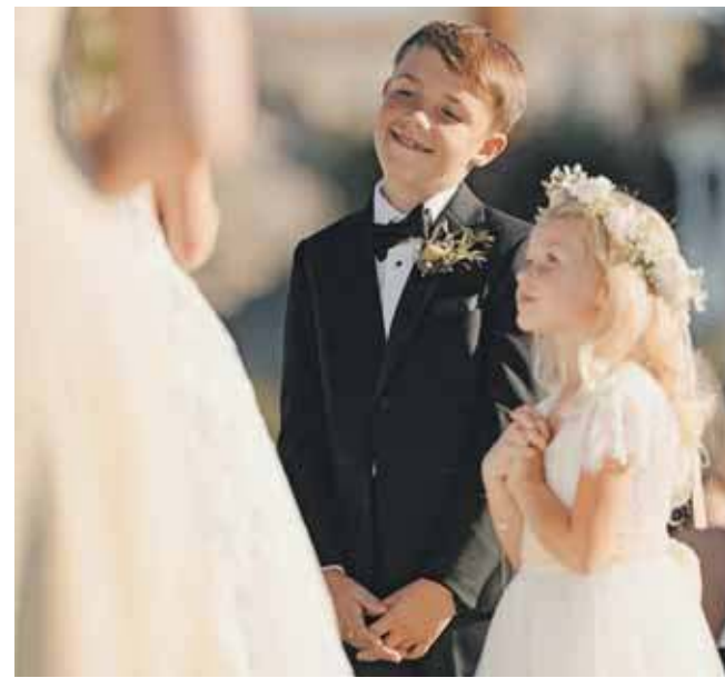
Coraz częściej zdarza się, że młode pary decydują się urządzać wesele bez udziału dzieci

Ważne, by zachować się taktownie przy zapraszaniu gości bez dzieci. Uprzedzić o tym dostatecznie wcześniej, żeby był czas na zapewnienie im opieki. Na zaproszeniach młodzi czasem wpisują, że wesele jest tylko dla dorosłych lub mniej oficjalnie – że dozwolone jest od lat 18.