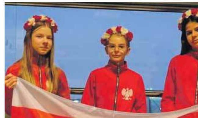
Zawodniczki ze Studia Gwiazd Radzionków wzięły udział w Anto Cup 2026 w Paryżu