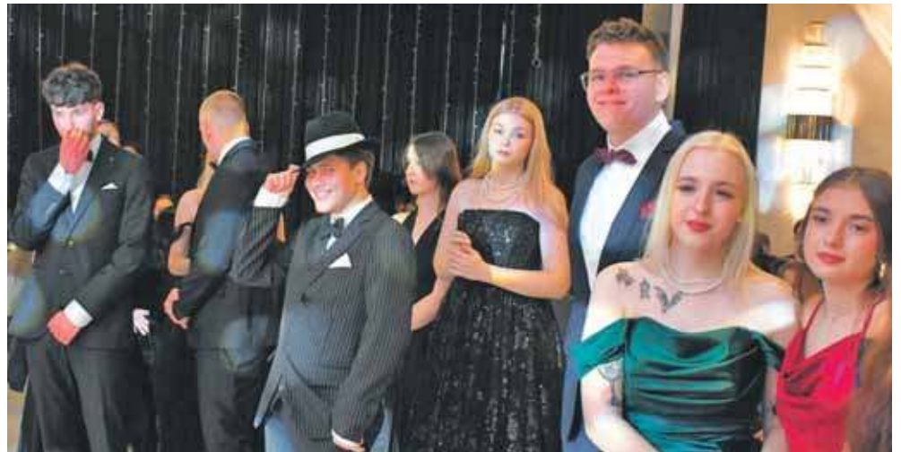
Organizatorami i jednocześnie uczestnikami studniówki byli uczniowie klas maturalnych: technik weterynarii, technik rolnik wraz z technikiem żywienia i usług gastronomicznych oraz technik hodowca koni wraz z technikiem mechanizacji rolnictwa i agrotechniki

Zanim rozpoczęła się wspólna zabawa, uczniowie zatańczyli tradycyjnego polo-