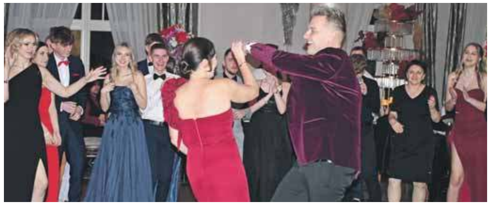
Później było już tylko głośniejszy, szybciej i weselszy