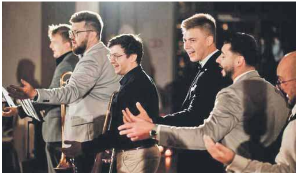
Zespół potrafi też dać show na weselu, ale to już zupełnie inna opowieść

O muzycznych trendach na ślubach, oczekiwaniach