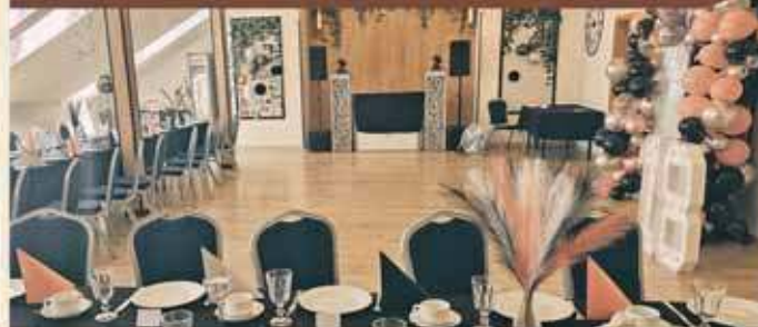
Sala LoVe 50 osób