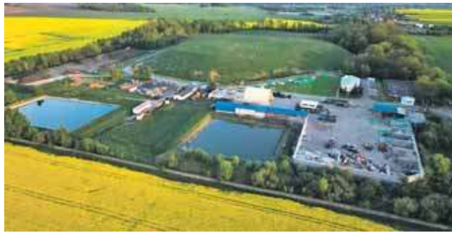
Wysypisko ma być mniej uciążliwe dla mieszkańców

Jest jeszcze II etap, jednak będzie realizowany po zakończeniu negocjacji z Narodowym Funduszem Ochrony