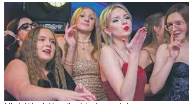
Młodość i radość, to dla wielu pierwszy bal