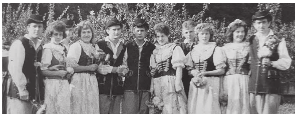
Ktoś rozpoznaje się na zdjęciu?

Więcej zdjęć na www.gwarek.com.pl . (ESP)