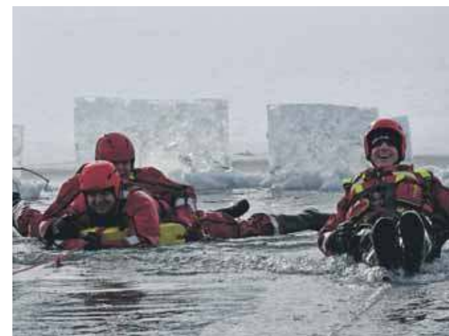
Woda miała ok. 4 st. C