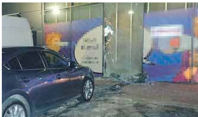
Badanie wykazało, że kierujący był trzeźwy

Policjanci z wydziału ruchu drogowego komendy w Tarnowskich Górach wyjaśnili okoliczności zdarzenia, do którego doszło na jednym z parkingów przy ulicy Zagórskiej w Tarnowskich Górach. Kierujący samochodem osobowym wjechał w witrynę sklepową w nowym centrum handlowym S1.