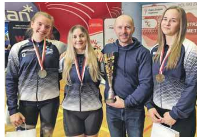
Reprezentantki UKS Olimpijczyk nie miały sobie równych również w rywalizacji zespołowej

Dobry start zanotowały zawodniczki UKS Olimpijczyk Nowe Chechło podczas Mistrzostw Polski w Ergometrach Kajakowych, które odbyły się 17 stycznia w Poznaniu. Reprezentantki klubu z powiatu tarnogórskiego wróciły z zawodów z pięcioma medalami, potwierdzając wysoką formę i sportowy charakter.