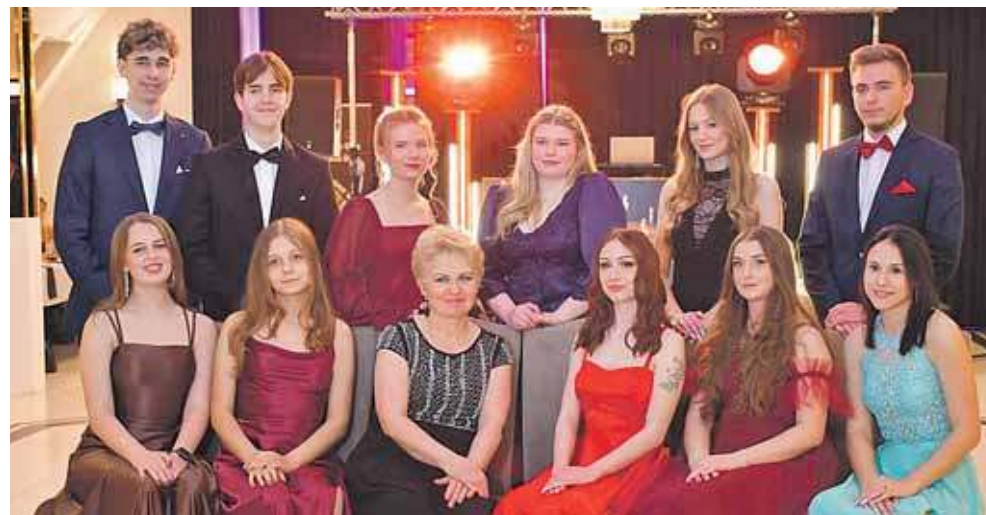
Pamiętką ze studniówki będzie też zdjęcie klasowe