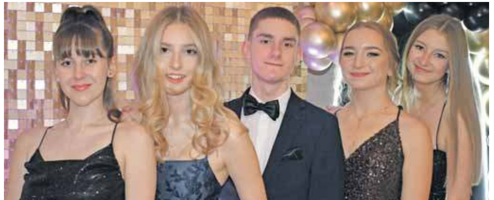
Młodzież bawiła się w piekarskiej Rezydencji