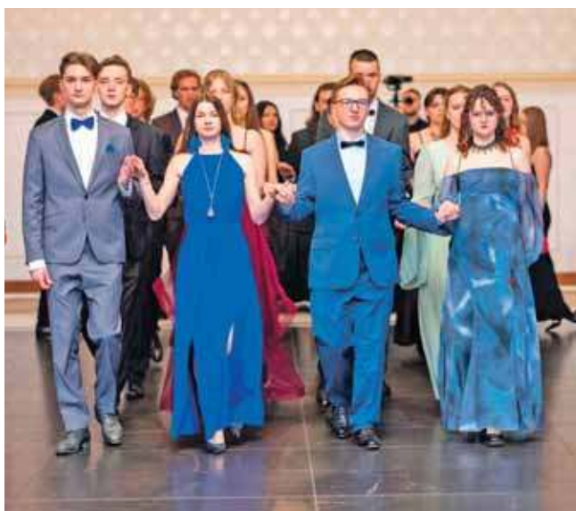
Elegancki polonez na dobry początek

Bal studniówkowy mają już za sobą także uczniowie Zespołu Szkół Technicznych i Ogólnokształcących w Tarnowskich Górach.