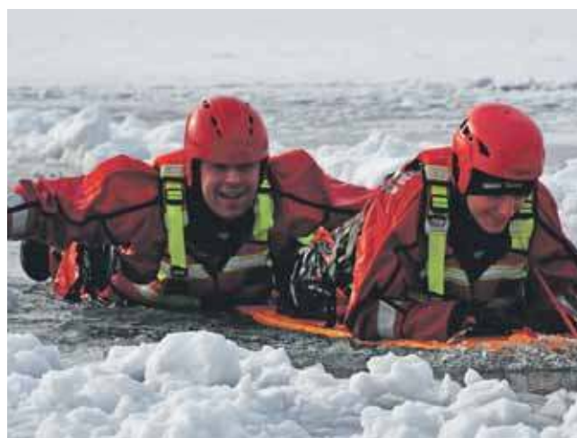
W ćwiczeniach uczestniczyli strażacy z JRG Tarnowskie Góry oraz z JRG Radzionków

W ćwiczeniach nad Nakłem-Chechłem uczestniczyli strażacy z JRG Tarnowskie Góry oraz z JRG Radzionków. Część sprzętu, z którego korzystali, przydaje się zarówno w ratownictwie lodowym, jak i wodnym. To, co na pewno jest inne, to ubiór – teraz wchodzili do wody w kombinizonach chroniących przed wychłodzeniem. Woda miała tylko 4°C. (EKA)