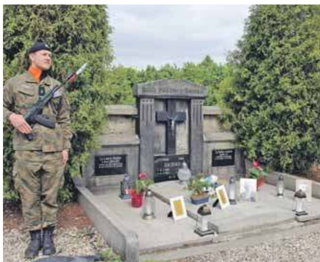
Znakiem pamięci „Tobie Polsko” m.in. oznaczono groby powstańców śląskich na cmentarzu parafialnym w Radzionkowie

Informacje można zgłaszać telefonicznie – 32 207-08-03, 32 207-08-00 lub mailowo: grobypowstancowslaskich@ipn.gov.pl. (ESP)