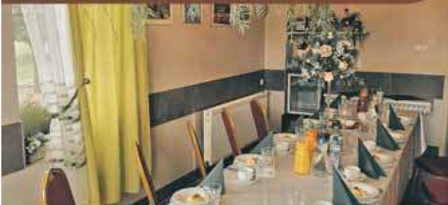
Sala Leśna 20 osób