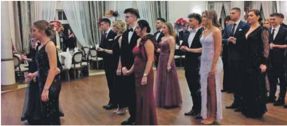
Na początek tradycyjny polonez

Sezon studniówkowy trwa w najlepsze. Kilka dni temu, 17 stycznia, swój bal mieli maturzyści z Zespołu Szkół Gastronomiczno-Hotelarskich w Tarnowskich Górach. Ten wyjątkowy dla młodzieży wieczór rozpoczął się tradycyjnie, a później było już tylko głośniejszy, szybciej i weselszy.