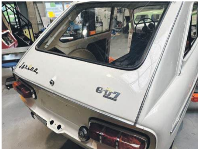
Z tyłu charakterystyczna klapa