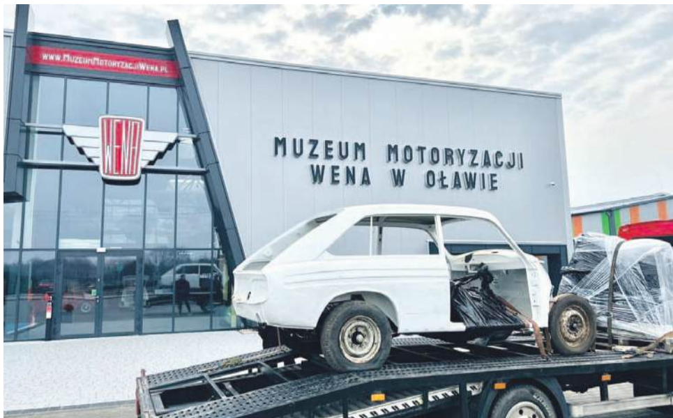
W marcu 2004 prototyp trafił do muzeum