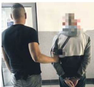
Dzięki szybkim i skutecznym działaniom mundurowych mężczyzna został zatrzymany i usłyszał już zarzuty.

Mundurowi z oławskiej drogówki zatrzymali młodego mężczyznę, który nie mając prawa jazdy i będąc pod wpływem alkoholu, kierował samochodem marki Kia. Swoją „podróż” zakończył w polu kukurydzy. Teraz o jego losie zadecyduje sąd - grozi mu kara do 3 lat więzienia oraz wysoka grzywna.