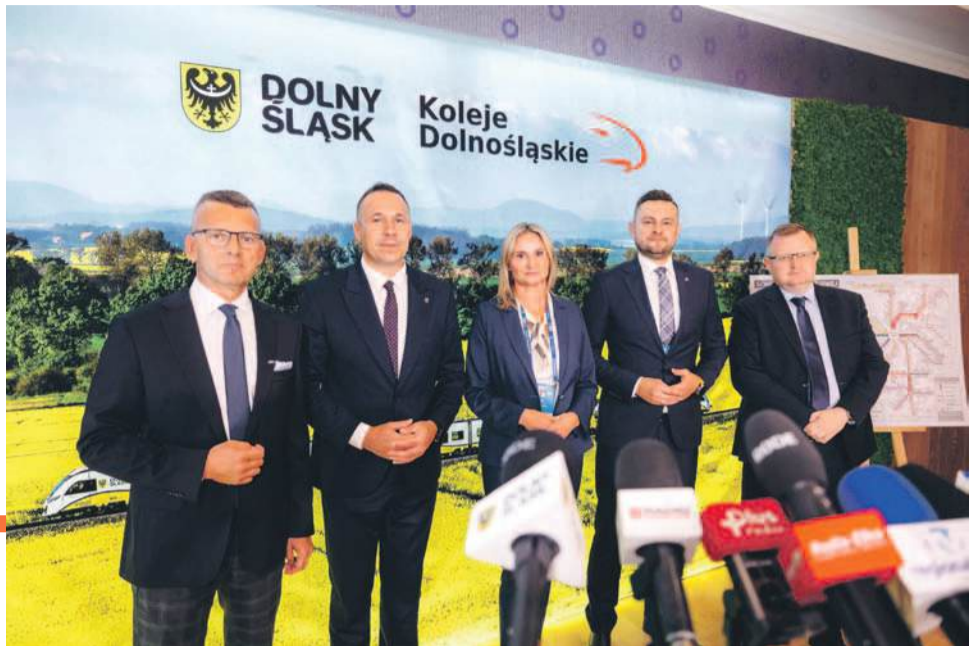
Podczas konferencji prasowej poznaliśmy szczegóły nowej oferty samorządowego przewoźnika

Dolny Śląsk stał się w ostatnich latach centrum prawdziwej kolejowej rewolucji. Stało się tak za sprawą samorządowego programu rewitalizacji nieczynnych linii oraz prężnemu rozwojowi spółki Koleje Dolnośląskie, która bije rekordy popularności i stała się liderem regionalnych przewozów pasażerskich w Polsce. Podczas konferencji prasowej zaprezentowano nowe kierunki, na których będziemy mogli zobaczyć pociągi samorządowego przewoźnika.