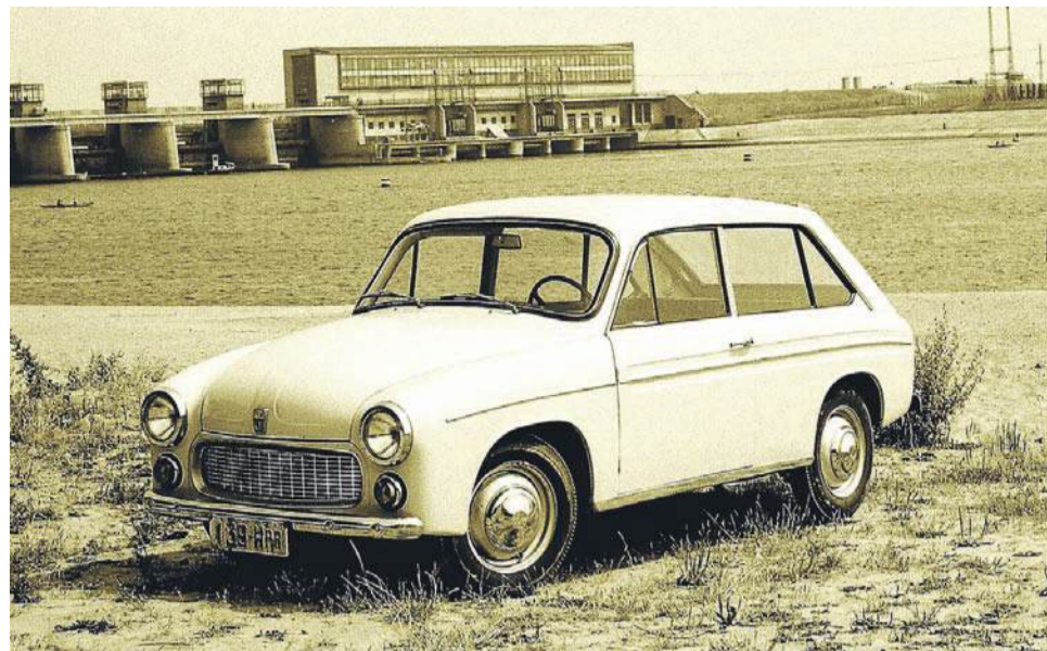
Tak wyglądała, gdy jeszcze można było marzyć, że wejdzie do produkcji