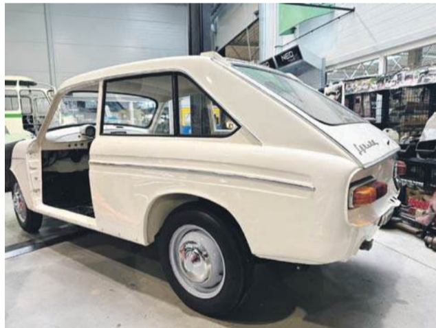
Tak wygląda z boku