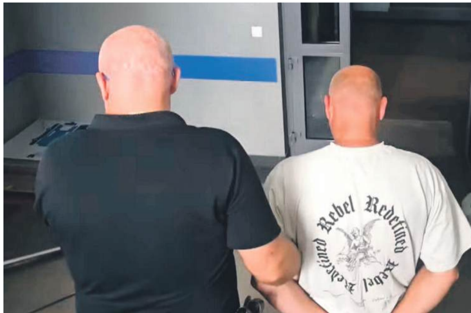
46-latek usłyszał zarzuty znieważenia i naruszenia nietykalności cielesnej lekarza w związku z pełnieniem obowiązków służbowych. Odpowie także za znieważenie na tle narodowościowym oraz czyn o charakterze chuligańskim. Mężczyzna przyznał się do winy