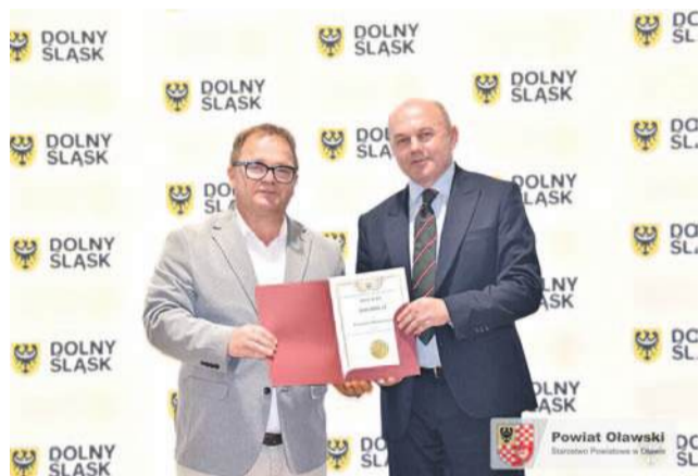
Na zdjęciu - wicemarszałek województwa dolnośląskiego Wojciech Bochnak wręcza staroście oławskiemu Markowi Szponarowi dokument potwierdzający dotację w ramach „Dolnośląskiego Funduszu Rozwoju Bazy Sportowej 2025”.

Powiat Oławski otrzymał 300 tys zł na modernizację boiska wielofunkcyjnego przy Centrum Kształcenia Zawodowego i Ustawicznego w Oławie. Obiekt zostanie dostosowany do gry w siatkówkę.