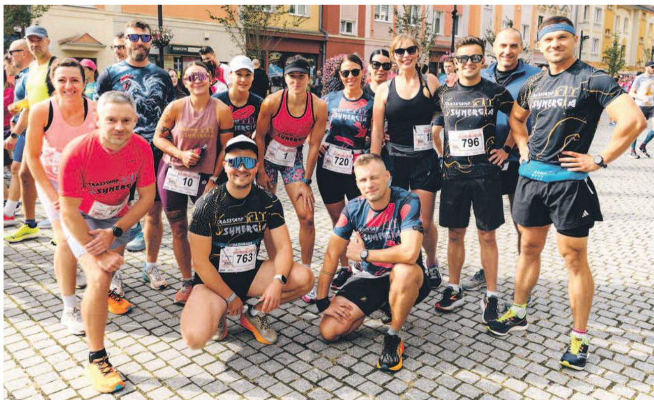
Tuż przed startem, wspólna fotka