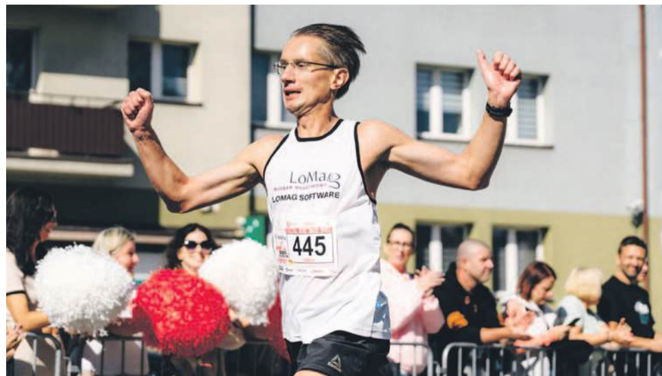
Ostatnie kroki do mety i... radość