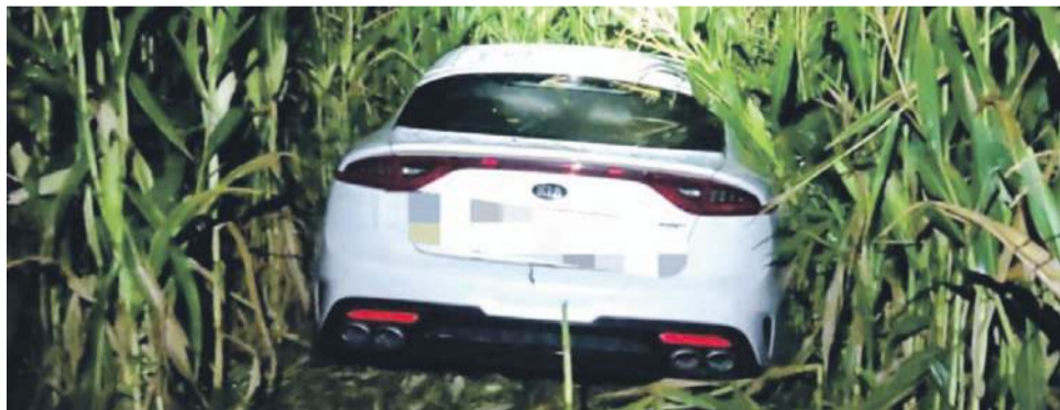
„Podróż” zakończył w polu kukurydzy...

Takie zachowanie to przykład skrajnej nieodpowiedzialności - alkohol znacząco obniża refleks, ocenę sytuacji i koordynację, stwarzając śmiertelne zagrożenie. Na szczęście tym razem nikt nie ucierpiał, jednak sytuacja mogła skończyć się tragicznie. (CK)