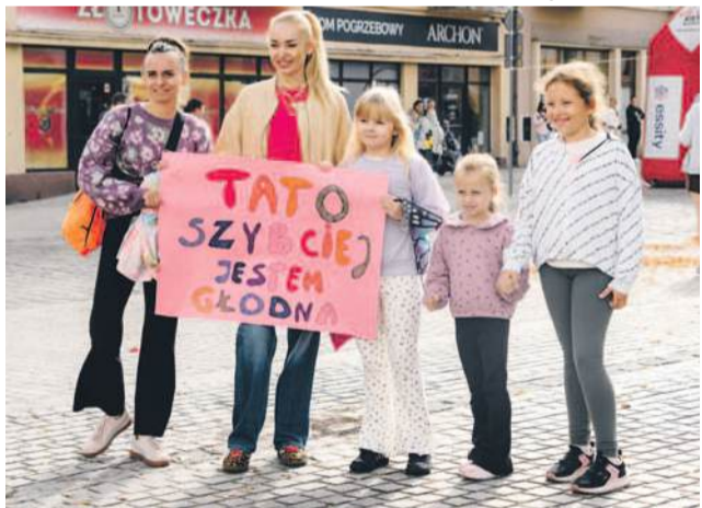
Dobra motywacja to podstawa

TEKST I FOT.: KAMIL TYSA ktysa@gazeta.olawa.pl