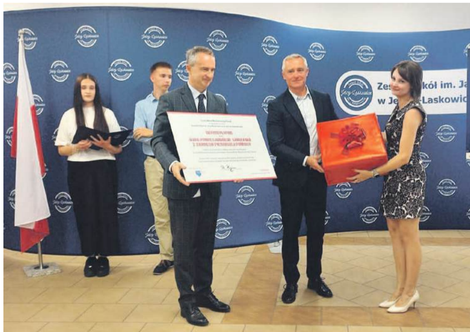
Toyota, obejmując opieką nowy kierunek, przekazała szkole defibrylator oraz sfinansowała szkolenia z pierwszej pomocy dla uczniów i nauczycieli