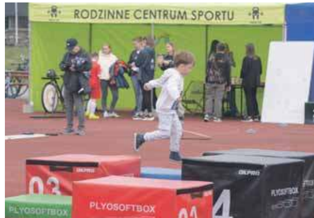
Na mieszkańców czekała sportowa strefa Spartan Team