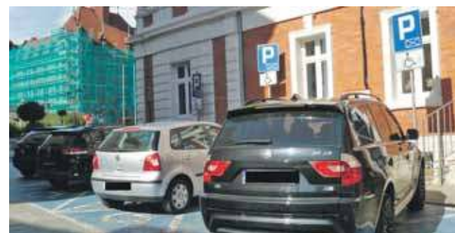
Czytelnik mówi, że miejsca parkingowe dla niepełnosprawnych większość czasu są zajęte

Nasz czytelnik interweniował już w tej sprawie w urzędzie miejskim w Tarnowskich Górach. We wniosku wskazał