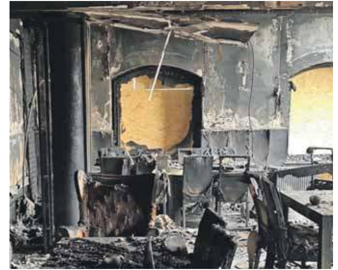
Straty są ogromne