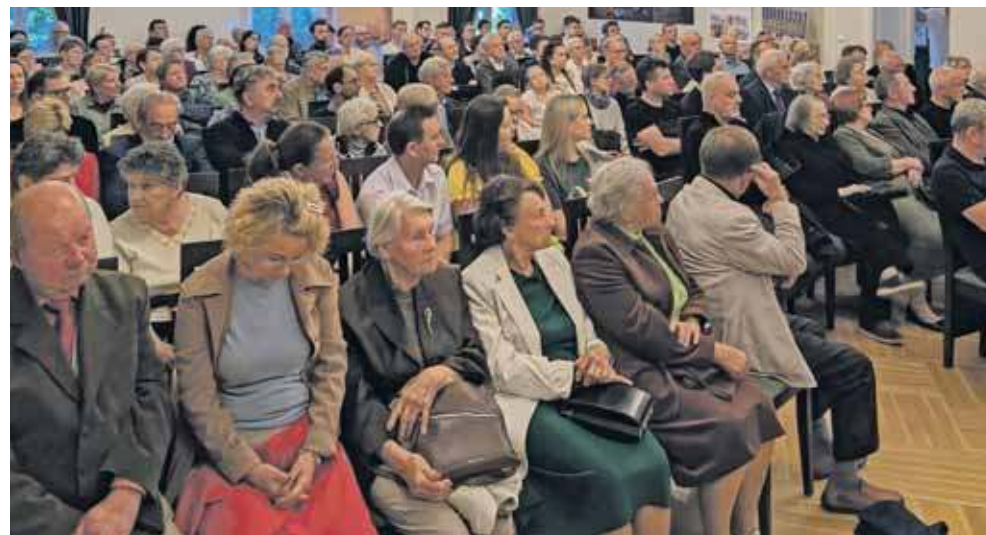
Ku zaskoczeniu organizatorów, sala wypełniła się po brzegi, co świadczy o ogromnym zainteresowaniu historią regionu

Istnieją również przesłanki, że na leśny cmentarz mogły trafić szczątki przeniesione z mauzoleum w Świerkłańcu. Po wojnie doszło do profanacji szczątków