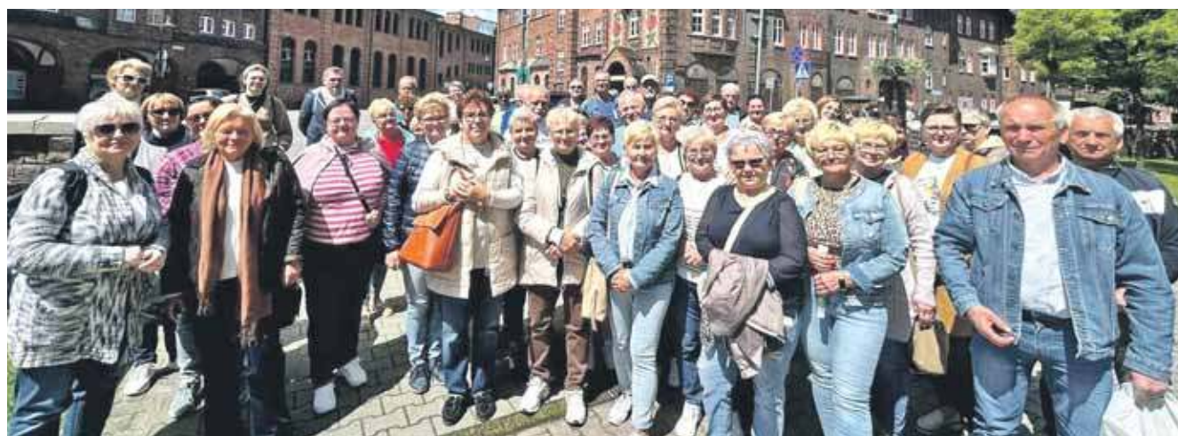
50 osób wzięło udział w wycieczce do katowickiego Nikiszowca

To właśnie to stowarzyszenie zorganizowało wyjazd, w ramach realizacji zadania „Nikiszowiec-Nickischschacht osiedle górników kopalni Giesche”. Uzyskało grant z budżetu powiatu tarnogórskiego, wsparcia udzieliła też rodzima gmina Świerklaniec. (ESP)