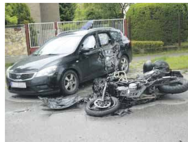
Motocyklista jest ciężko ranny