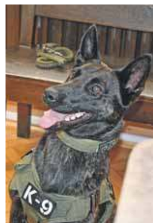
Psia gwiazda nocy sądów

Dzieci musiały znaleźć pomieszczenia, w których były togi i zdobyć 6 pieczętek. Dzięki temu zdobywały hasło, co razem upoważniało je do odbioru nagrody.