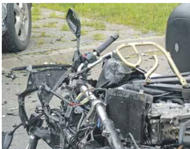
Motocykl został bardzo zniszczony