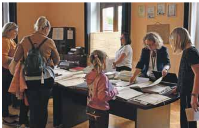
W sali konferencyjnej przygotowano bardzo ciekawą wystawę poświęconą historii sądownictwa

Każdy gość sądu otrzymał ulotkę z opisem trasy zwiedzania, na grupy czekali przewodnicy. Można było zobaczyć m.in. salę rozpraw, błękitny pokój przesłuchań dla dzieci, zasiąść w fotelu prezesa sądu, spojrzeć na świat zza krat celi – pokoju zatrzymań czy zajrzeć do archiwum – w zasadzie do jego małej części, bo wszystkie archiwalne dokumenty mają 6 km długości i przechowywane są w czterech miejscach.