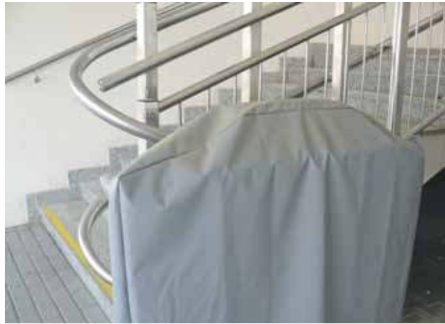
Platforma dla osób niepełnosprawnych jest sprawna, ale można z niej korzystać tylko w asyście osób przeszkolonych do jej obsługi

Spółdzielnia Mieszkanio-wa Gwarek w Tarnowskich Górach dwukrotnie składała Poczcie Polskiej propozycję zamiany obecnie zajmowanego lokalu na piętrze Pawilonu Słoneczników 41 na lokal na parterze w tym samym budynku. Jednak pocztowcy odmówili. Było to w maju i listopadzie 2023 roku, teraz proponowany