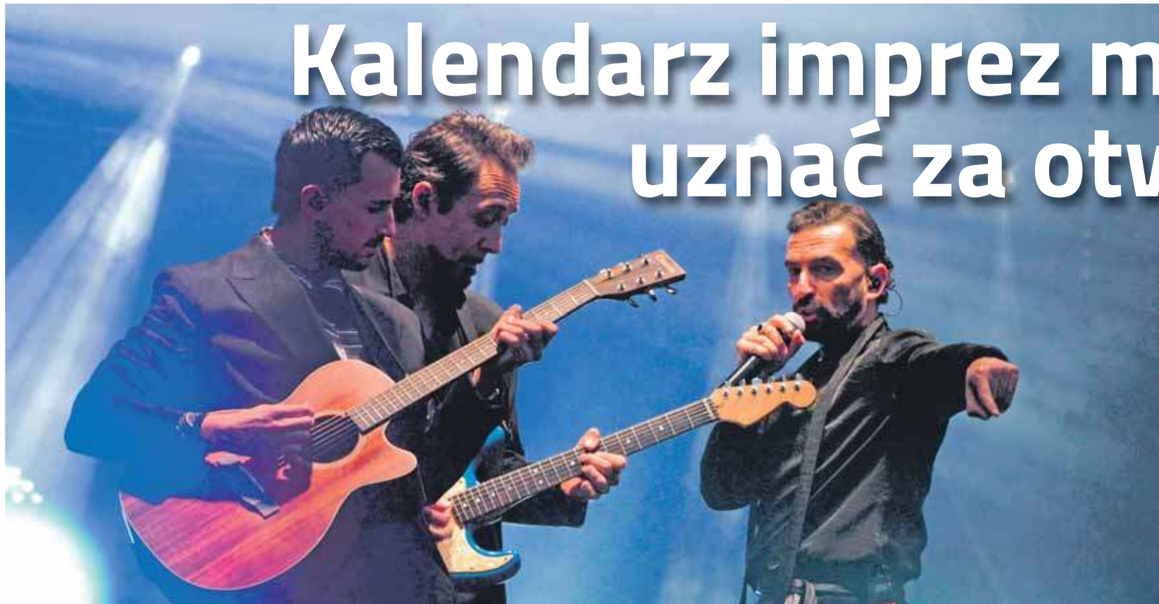
Na scenie włoski zespół Scena Muta