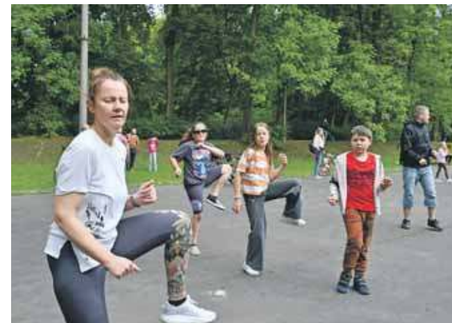
Energetyczna zumba na dobry początek

Energetyczna zumba wielopokoleniowa, porady dietetyka i emocje związane z loterią – to tylko część atrakcji, które w sobotę, 24 maja, czekały na uczestników pikniku „Szafa pełna zdrowia”.