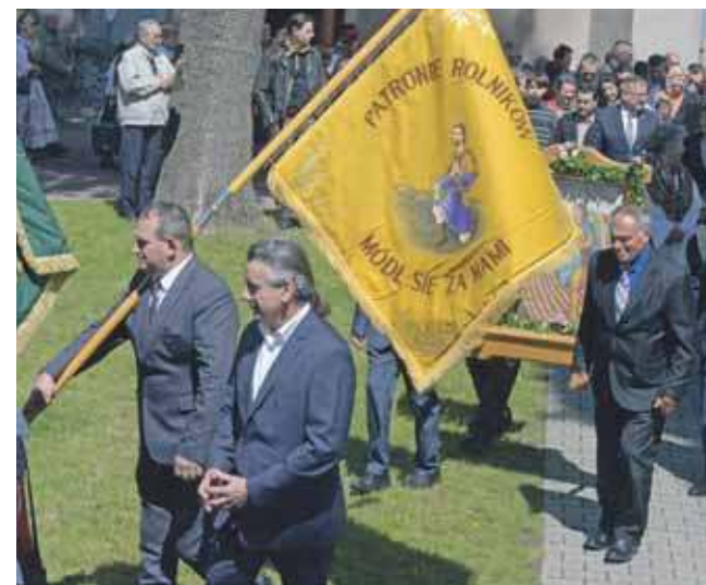
Pielgrzymka odbyła się z okazji wspomnienia św. Izydora Oracza – patrona rolników