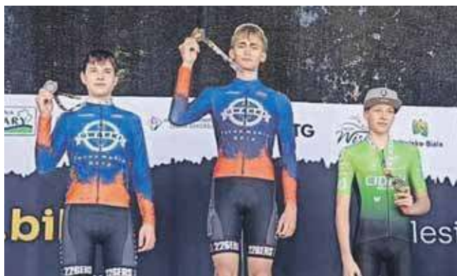
Rowerzyści w granatowo-pomarańczowych koszulkach 12 razy stawali na podium