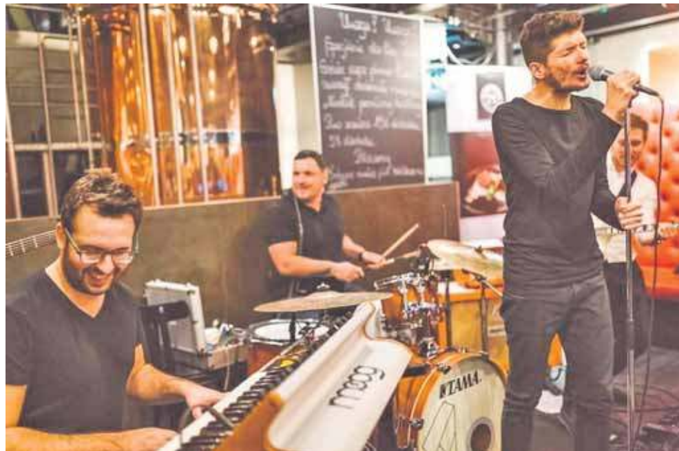
Do precastingów w 6 miastach Polski zgłosiło się kilka tysięcy wykonawców

W 2018 roku przychodzi czas na wydanie płyty oraz trasę koncertową po wszystkich dużych miastach Polski. Grają jako support punkrockowej grupy Happy Sad. Znów boją się, czy ich ładna muzyka się przyjmie.