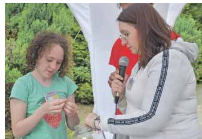
Najwięcej emocji towarzyszyło loterii z ciekawymi nagrodami