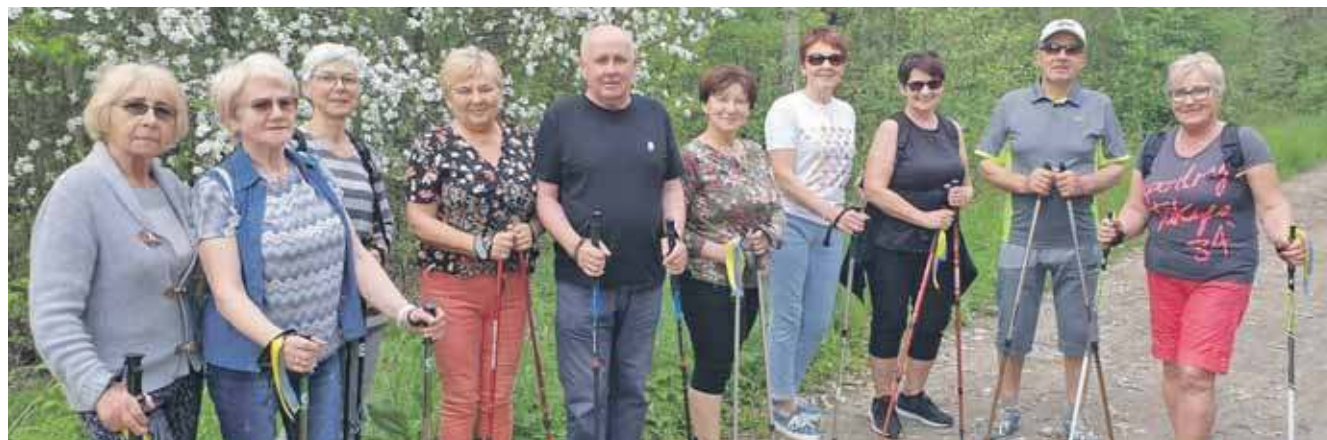
Ossiańskie Stowarzyszenie Seniorów Człapingowcy zachęca do aktywności fizycznej