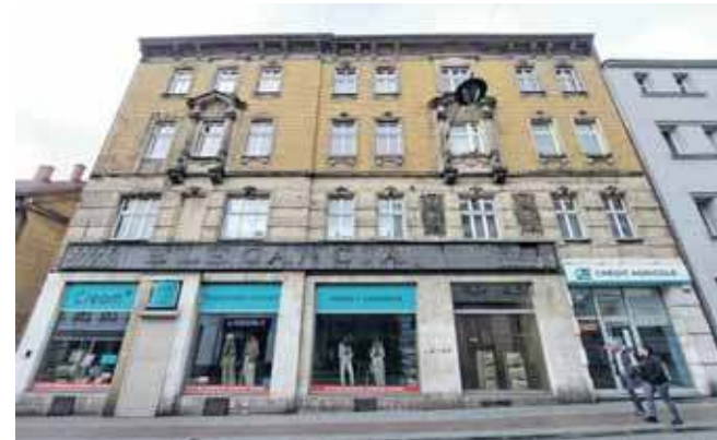
Kamienica z około 1885 roku skrywa fascynującą historię związaną z żydowską społecznością miasta i przemianami społeczno-gospodarczymi przełomu XIX i XX wieku

Fasada budynku została zaprojektowana z dbałością o detale. Drugie piętro wyróżnia się oknami w osiach 2 i 6, które są ujęte jońskimi półkolumnami i zwieńczone trójkątnymi frontonami. Pierwsze piętro zostało ozdobione