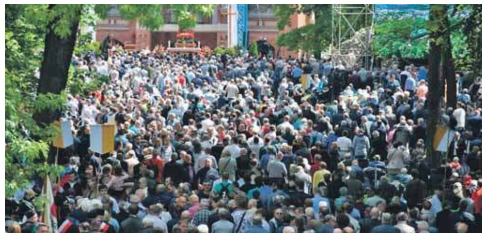
Pielgrzymka Mężczyzn i Młodzieńców do Matki Bożej Piekarskiej zgromadziła w tym roku około 80 tysięcy osób

Tegoroczna pielgrzymka zgromadziła około 80 tysięcy uczestników, w tym całe rodziny, od dziadków po wnuki, którzy od pokoleń pielgrzymują do Piekar Śląskich. Prawie z każdej parafii powiatu tarnogórskiego wyruszyły do Piekar Śląskich piesze bądź rowerowe grupy mężczyzn i młodzieńców, gdzie wspólnie z pielgrzymami z całego regionu świętowali i uczestniczyli we wspólnej modlitwie.