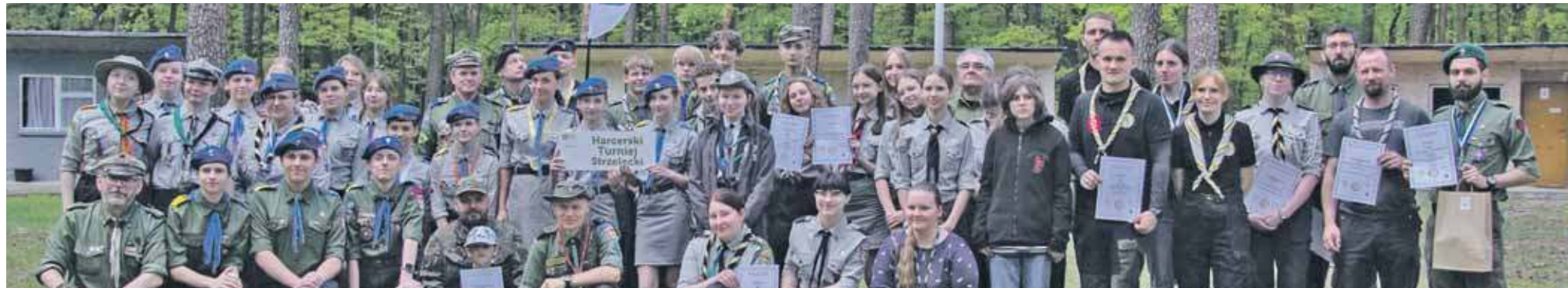
Pamiętkowe zdjęcie uczestników turnieju

Harcerski Turniej Strzelecki odbył się w maju w ośrodku harcerskim Borowiany.