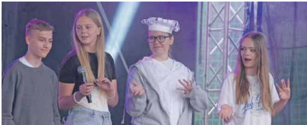
Kulturę i tradycję Włoch przedstawili uczniowie Publicznej Szkoły Podstawowej nr 1 w Kaletach