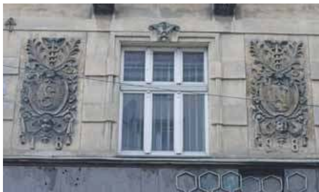
Dekoracja fasady kamienicy. Można na niej dostrzec monogram „SN” nawiązujący do imienia i nazwiska właściciela budynku

Na podstawie danych z gminy żydowskiej można stwierdzić, że Noher aktywnie uczestniczył w życiu żydowskiej społeczności