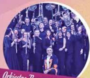
Orkiestra Reprezentacyjna Gminy Miasteczko Śląskie

CENTRUM SPORTU I REKREACJI W MIASTECZKU ŚLĄSKIM, UL. SPORTOWA 1