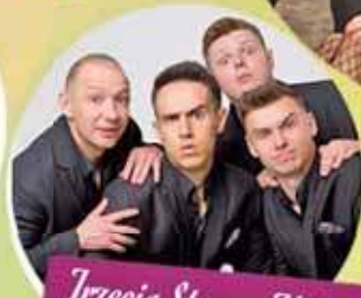
Trzecia Strona Medalu