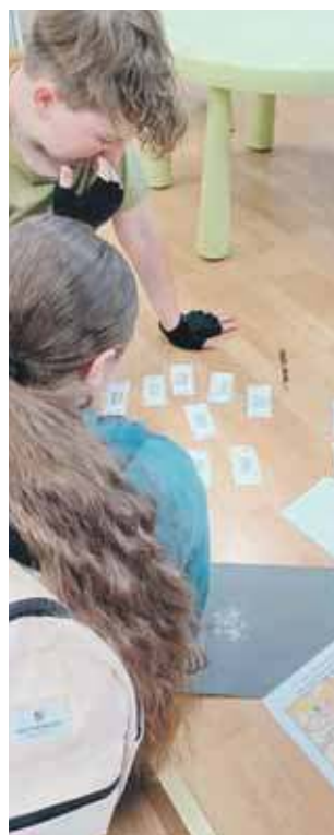
Etap powiatowy przybrał formę minigry miejskiej