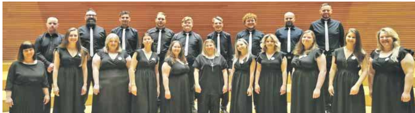
Chór Rozrywkowy Dafne na scenie sali koncertowej w Akademii Muzycznej w Katowicach