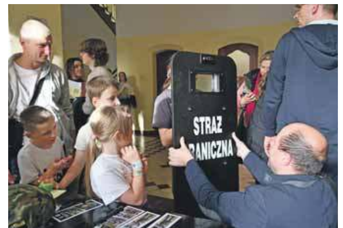
Nie tylko dzieci świetnie się bawiły

Ponadto w sądzie pojawili się strażnicy graniczni, każdy mógł na przykład wykonać swoje odciski palców, było i spotkanie z psem wyszkolonym do wykrywania materiałów wybuchowych. Zwierzę było wyjątkowo cierpliwe, kiedy wiele dzieci robiło sobie pamiątkowe zdjęcia.