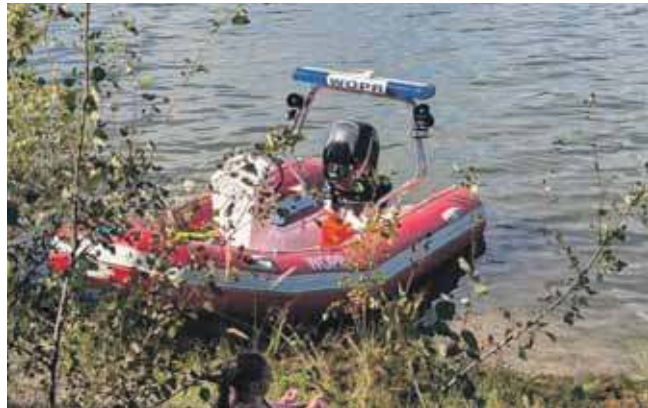
Świerklaniec od wielu lat ściśle współpracuje z WOPR-em

Wyjaśnia, że cena wzrosła, gdyż w maju wielu ratowników już ma zatrudnienie na czas wakacji i żeby zachęcić ich do pracy nad zalewem