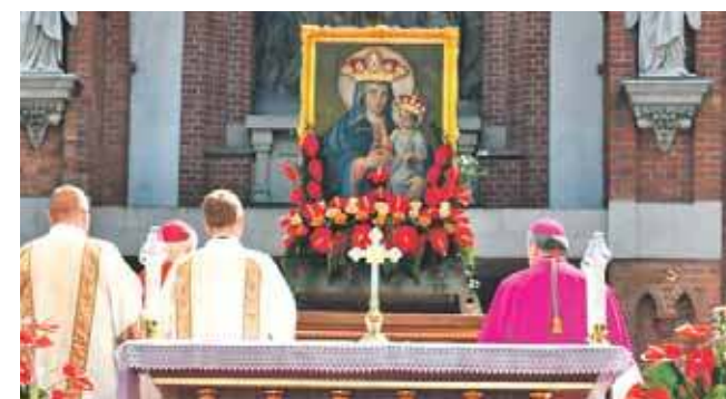
Główne uroczystości odbyły się na piekarskiej Kalwarii

Pielgrzymkowej tradycji towarzyszyły stoiska i kramy wzdłuż ulicy Bytomskiej, można było kupić piekarskie pierniki, a także wiele innych regionalnych przysmaków. Oczywiście nie zabrakło też stoisk z zabawkami dla dzieci. Tak zwane „budy” do dzisiaj cieszą się dużym zainteresowaniem, szczególnie ze strony młodszej części pielgrzymów. (RB)