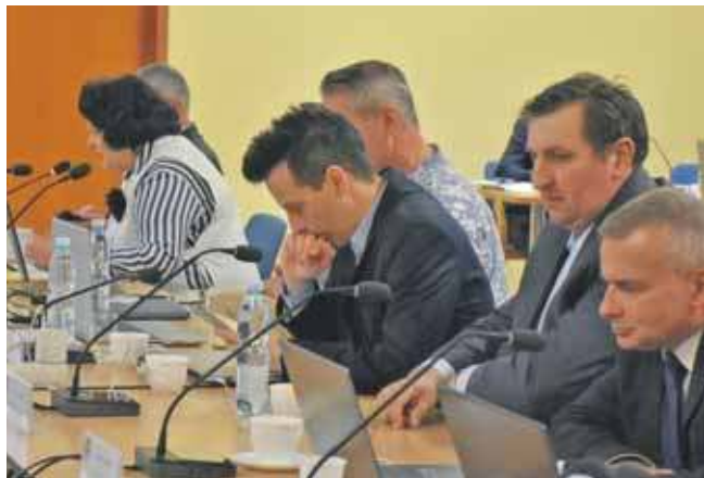
Radni powiatowi nie chcą rezerwatu w parku Repeckim

Wyniki głosowania: uchwałę poparło 16 radnych, 7 było przeciw, 1 wstrzymał się od głosu, 1 nie brał udziału w głosowaniu.