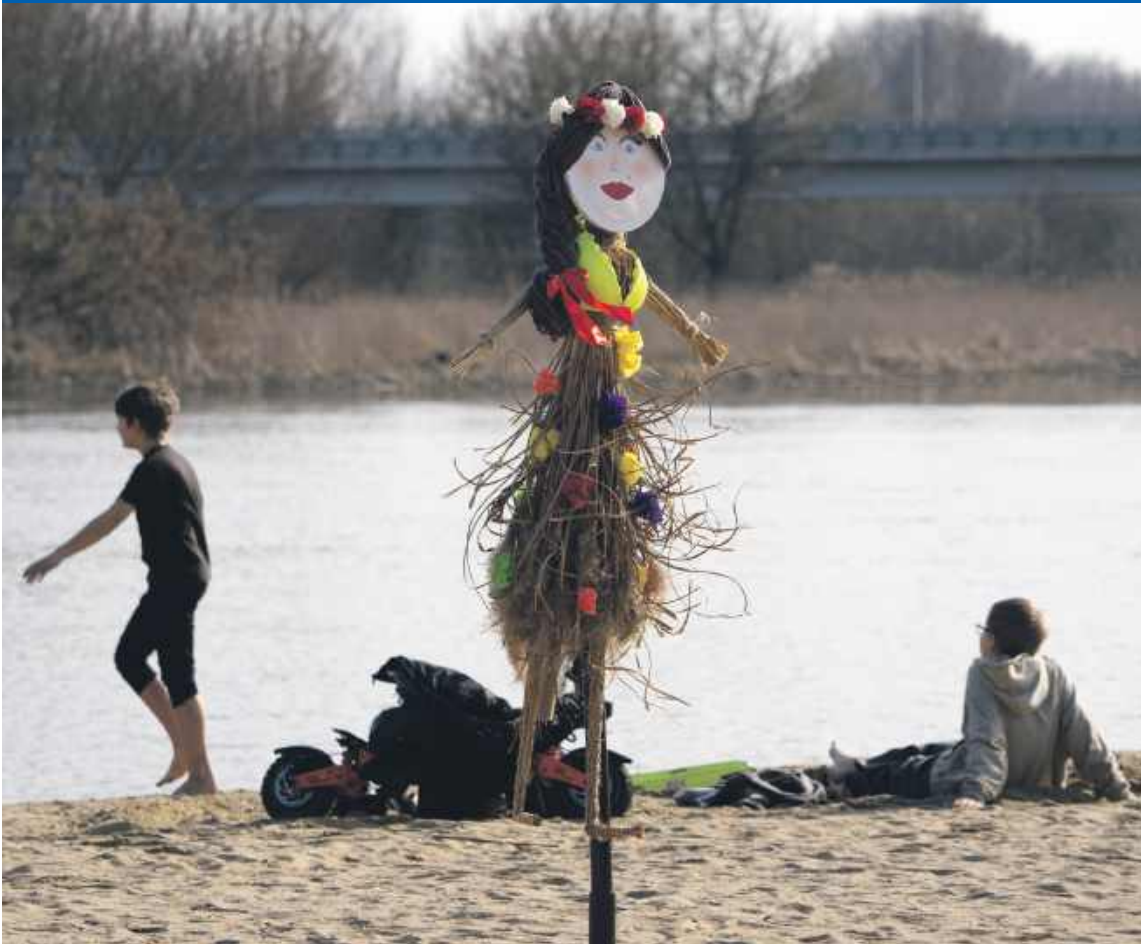
Pułtusk 2026: Słoma, wianek i pełna biodegradowalność – ostre zasady nowego looku plażowego.