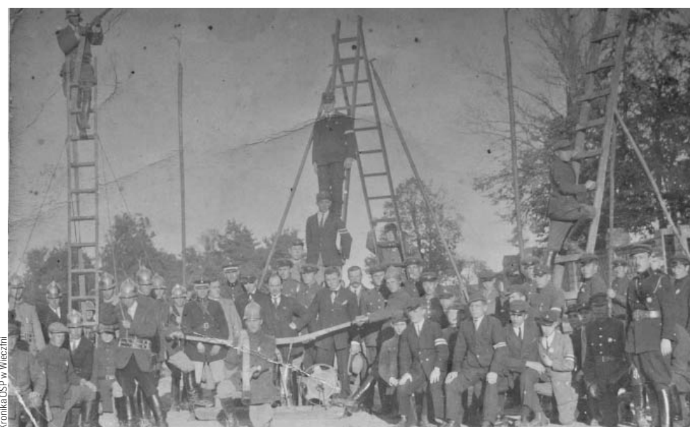
Pokaz sprawności strażaków z OSP na placu między remizą, a kościołem. Wieczfnia, lata 30. XX wieku. W środku w jasnym płaszczu, za pompą stoi R. Drapczyński

następnie ręcznej syreny. Zaś w 1949 r. straż (...) otrzymała ręczną syrenę wirowo - korbową, a w roku 1962 (...) elektryczną syrenę na dach (...) remizy. Pierwszą motopompę OSP w Wieczfni otrzymała po wojnie z tzw. ziem odzyskanych.