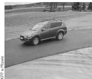
KPP w Mławie