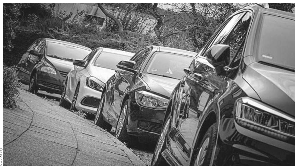
Dziewięciu na 10 kierowców oczekiwałoby, żeby profesjonalnie przygotowana historia pojazdu była standardem na rynku, dołączona do każdej oferty sprzedaży

Proceder cofania licznika przed sprzedażą pojazdu wciąż jest jedną z najczęściej występujących nieprawidłowości. Z badania autoDNA i Mind & Roses „Fakty i mity rynku aut używanych” wynika, że w 2024 roku odnotowano ponad 65,5 tys. przypadków rozbieżności wskazań drogomierza. Celem takiego oszustwa jest przede wszystkim zwiększenie atrakcyjności pojazdu, a tym samym sztuczne zawyżanie jego wartości. Dla kupującego oznacza to stratę nawet ponad 16 tys. zł za każde 100 tys. km cofniętego licznika w przypadku popularnych, kilkuletnich samochodów. Kolejnym