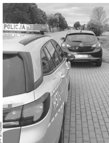
KPP w Mławie