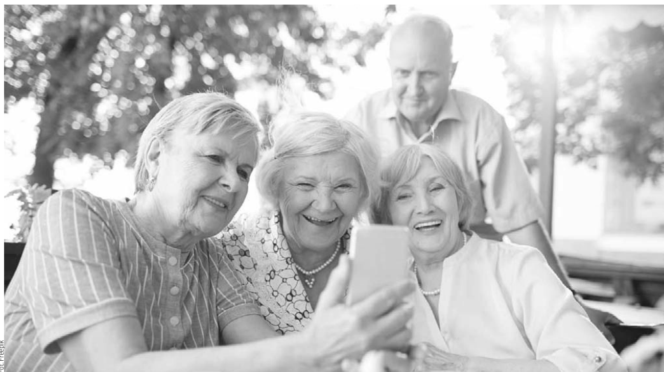
Coraz więcej seniorów chętnie spędza czas w klubach seniora lub na uniwersytetach trzeciego wieku