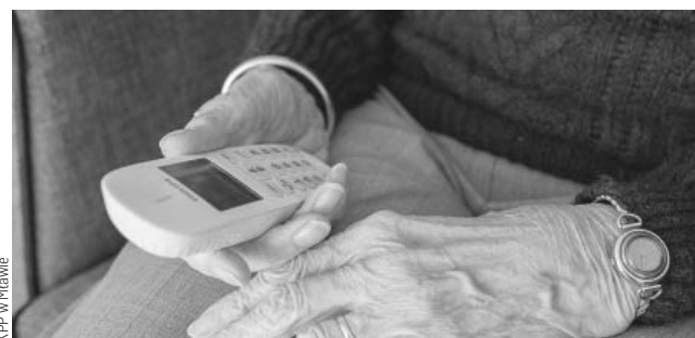
KPP w Mławie

Oszuści, działający metodą „na policjanta”, wykorzystują element zaskoczenia i silne emocje starszej osoby. Tym razem ich ofiarą padła 78-letnia mieszkanka Mławy. Seniorka straciła swoje oszczędności, które odkładała przez wiele lat. Była przekonana, że wpłaca kaucję za aresztowaną synową, która potrafiła ciężarną kobietę. Oddała przestępcom kopertę z oszczędnościami życia. Trzy dni później zorientowała