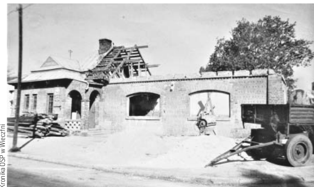
Rozbudowa remizy w Wieczfni, w latach 1988-1989.

(...) Od pierwszych lat działalności, aż do 1939 r. straż posiadała jednokonne, dwukołowe beczki do wody. Do pożaru wyjeżdżano konnymi pojazdami wyznaczonymi w ramach podwoj z Wieczfni wraz z sikawką ręczną, wężami parciowymi i bosakami. We IX 1939 r. Zarząd Związku OSP w Mławie przyznał jednostce auto z motopompą o nazwie <<Stach>> (...). Przed wybuchem wojny w 1939 r. OSP w Wieczfni było w pełni zorganizowaną jednostką. (...) Okupant zniszczył osiągnięcia, wprowadził straż była czynna, ale jej działalność ograniczała się do gaszenia pożarów, w ogóle działalność odbywała się pod egidą władz okupacyjnych (...). W 1945 r. wznowiono działalność OSP w Wieczfni i zaczęto na nowo gromadzić sprzęt pożarniczy. W 1946 r. strażacy wyjechali w poszukiwaniu auta do pow. nidzickiego. Po znalezieniu wraka auta, wyremontowali go i adaptowali do potrzeb OSP.