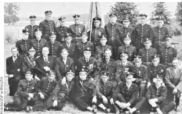
40- lecie istnienia straży w Wieczfni, 1962 r.