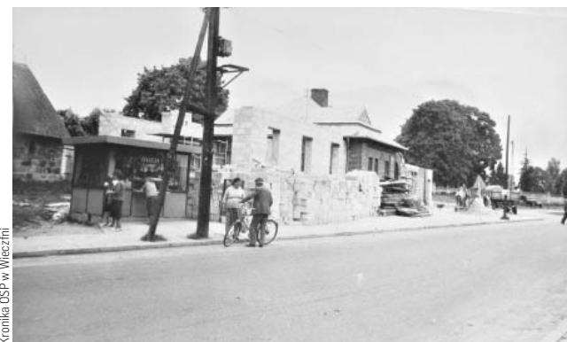
Rozbudowa remizy w Wieczfni, w latach 1988-1989.