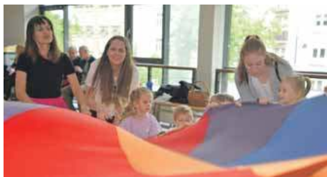
Zabawy dla dzieci w sali baletowej

10 maja w sali baletowej były zabawy ruchowe dla dzieci i rodziców, a w sali widowiskowej występy taneczne i wokalne. Zastrzeliliśmy na próby przed wielkim show i byliśmy pod wrażeniem talentu seniorów. Dla części z nich był to sceniczny debiut.