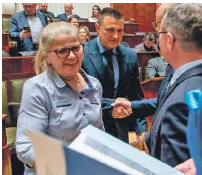
Z pieniędzy po raz kolejny może się cieszyć sołectwo Mikołeska

To ciąg dalszy rozwoju sołectwa minirynek. W 2020 r., również w ramach Ini-