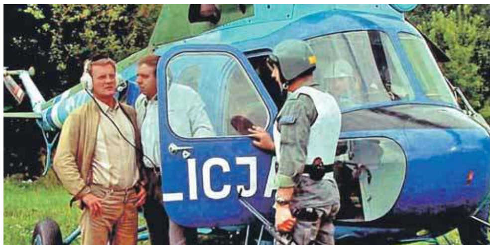
Kadry z filmu „07 zgłoś się” z udziałem śmigłowca MI-2 – reż. Krzysztof Szmagier / Produkcja: Studio Filmowe „Kadr”

Największą sławę maszynie przyniosły występy w produkcjach filmowych. Widzowie z pewnością pamiętają go z serialu kryminalnego „07 zgłoś się” oraz filmu „Zamknąć za sobą drzwi”. W trakcie służby śmigłowiec nosił oznaczenia – początkowo numer boczny 452, a następnie 4522.