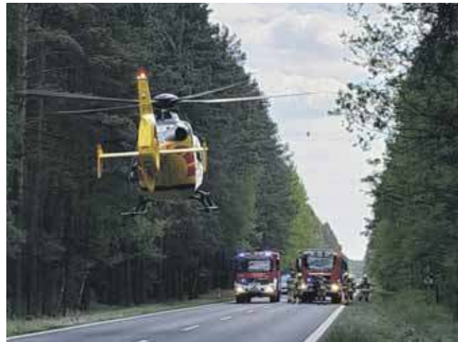
DK 11 była przez pewien czas zamknięta dla ruchu. Na miejscu lądował śmigłowiec LPR

W akcji uczestniczyli OSP Koty, OSP Tworóg, JRG Tarnowskie Góry, JRG Lubliniec, zespół ratownictwa medycznego, lotnicze pogotowie ratunkowe, policja. (MIR)