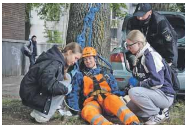
Organizatorzy nieraz udowodnili już, że potrafią wymyślić sceny i zadania, które zaskoczą uczestników

Był też m.in. wypadek dziecka na hulajnodze, upadek z wysokości, zaśląbnięcie kierowcy czy akcja poszukiwawcza. – Ważne, żeby młodzi ludzie wiedzieli, jak się zachować w sytuacji kryzysowej