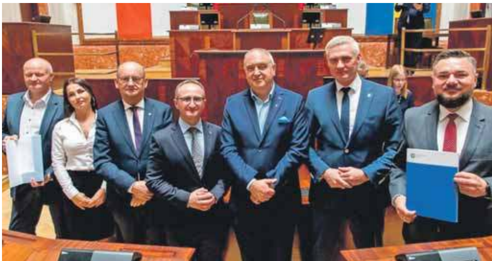
Z gminy Świerklaniec dofinansowanie dostały dwa sołectwa – Nakło Śląskie i Nowe Chechłto

W sali Sejmu Śląskiego 12 maja wręczono umowy na dofinansowania projektów w ramach Inicjatywy Sołeckiej. Pieniądze dostaną m.in. Nowe Chechłto, Nakło Śląskie i Mikołeska.