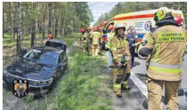
Samochodem podróżowały dzieci w wieku 2 i 6 lat

We wtorek doszło do niebezpiecznej sytuacji na DK 11 koło Kotów. Samochód, którym przewożono dwójkę dzieci, wpadł do rowu. Policjanci z Tarnowskich Gór ustalili, że 77-latek z Gliwic, prowadząc volkswagena, zasłabł za kierownicą i zjechał z jezdni do przydrożnego rowu. Oprócz niego w samochodzie znajdowała się jego 37-letnia córka wraz ze swoimi dziećmi w wieku 2 i 6 lat.