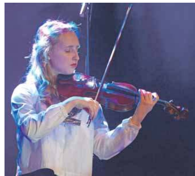
Na scenie pojawili się wychowankowie placówki

mu podejściu kadry pedagogicznej, specjalistów oraz całego personelu otrzymują wsparcie i pomoc, aktywnie uczestniczą we wszystkich zajęciach, uroczystościach i imprezach organizowanych na terenie placówki oraz w środowisku lokalnym, mogą się w pełni rozwijać.