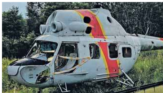
Po rozwiązaniu 103 Pułku Lotniczego MSWiA śmigłowiec trafił do Lotnictwa Straży Granicznej, a później służył jako obiekt szkoleniowy na poligonie

Obecnie muzeum w Zbrośławicach prowadzi intensywne poszukiwania brakujących elementów konstrukcji, które zostały uszkodzone lub zdemontowane na przestrzeni lat. Zbiórka na portalu zrzutka.pl ma na