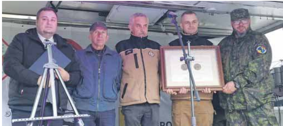
Muzeum Ratownictwa w Krakowie zostało nagrodzone brązowym medalem Polonia Minor przyznawanym przez zarząd województwa małopolskiego. Wręczenie odbyło się podczas Nocy Muzeów w Zbrośławicach

Innym unikatowym eksponatem jest PZL Sokół. To jedyny egzemplarz tego helikoptera, który można oglądać w muzeach. Muzeum Ratownictwa w Krakowie sprowadziło tę polską konstrukcję maszyną z... Hiszpanii. Śmigłowiec służył na Wyspach Kanaryjskich. Ponieważ placówka muzealna