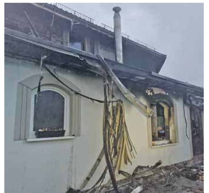
Straty materialne są duże

Na razie nie jest znana przyczyna pożaru. Na miejscu był już biegły, teraz mundurowi czekają na jego