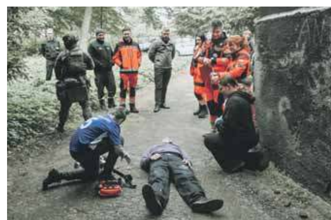
Przy „Plastyku” padły strzały

Podstawowa nr 4 w Jastrzębiu-Zdroju, II m. – Szkoła Podstawowa w Rusinowicach, III m. – Szkoła