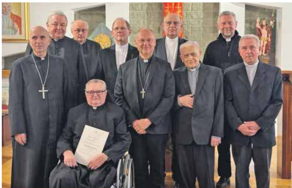
Dziewięciu zasłużonych kapłanów diecezji gliwickiej otrzymało tytuł kapelana Jego Świątobliwości, nadany jeszcze przez śp. papieża Franciszka