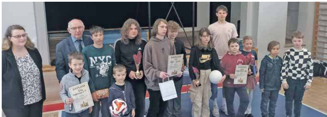
W Radzionkowie odbyły się mistrzostwa w szachach