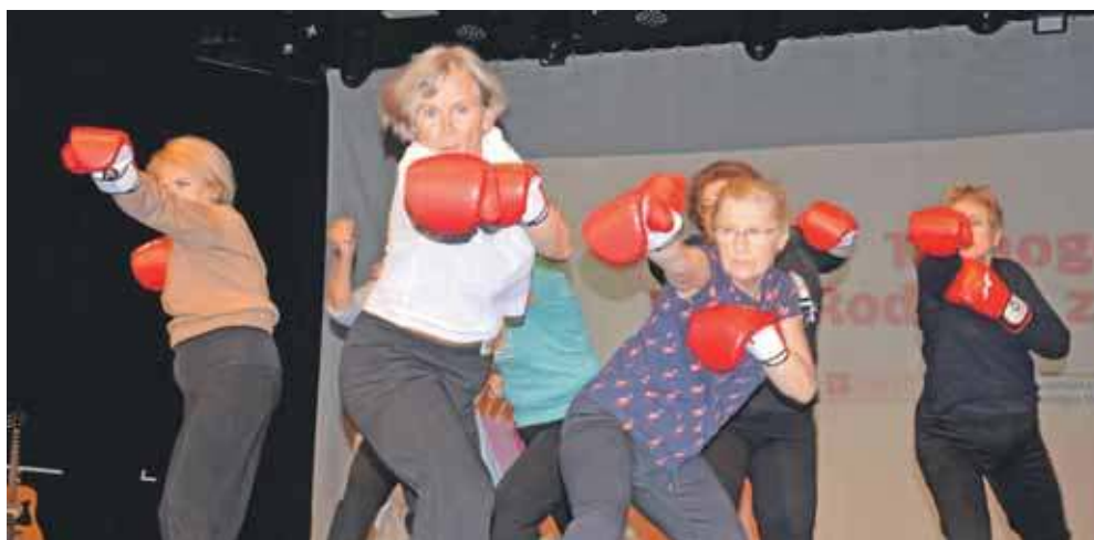
Próba układu tanecznego, czyli seniorki i „King Bruce Lee Karate Mistrz”