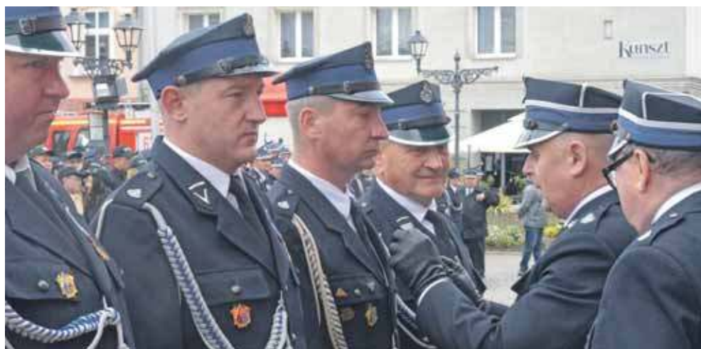
Obchody Dnia Strażaka to okazja do wręczenia odznaczeń i wyróżnień