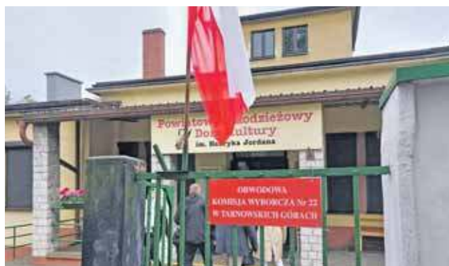
W Tarnowskich Górach frekwencja wyniosła 67,25 proc.

Rafał Trzaskowski wygrał w Tarnowskich Górach – 37,68 proc. głosów, w Krupskim Młynie – 28,26 proc., Ożarówicach – 31,27 proc., Świerklańcu – 36,14 proc. i Zbrośławicach – 34,29 proc.