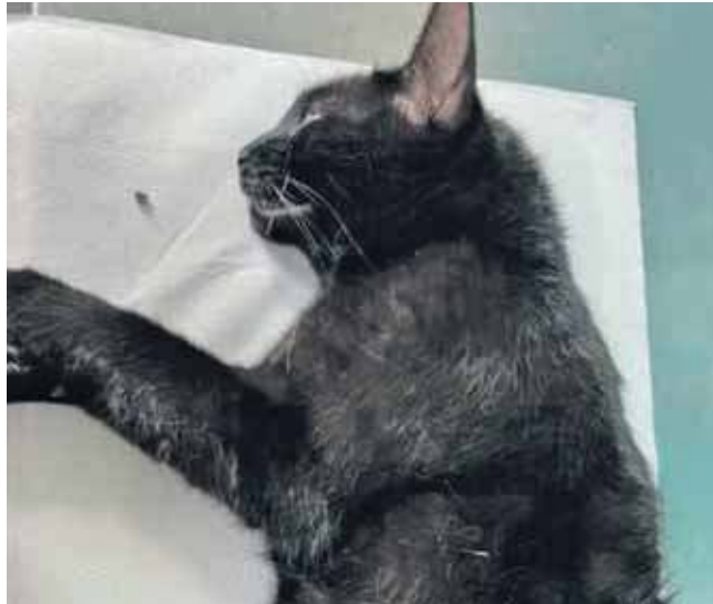
Kot jest już po operacji

Wskazuje, że do zdarzenia doszło w rejonie ul. Krasickiego i Słowackiego w Tworogu. – Uważajcie na swoje koty. Na osobę, która wskaże tego, kto strzelał, czeka nagroda – mówi mieszkaniec Tworoga. Jeżeli ktoś ma informacje w tej sprawie, może dzwonić pod numer telefonu 501-307-752. (ESP)