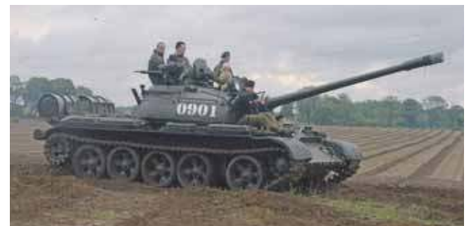
Największym zainteresowaniem cieszyły się przejażdżki sprzętem wojskowym, w tym czołgiem T-55

różnych grup rekonstrukcji historycznej. Byli też modelarze.