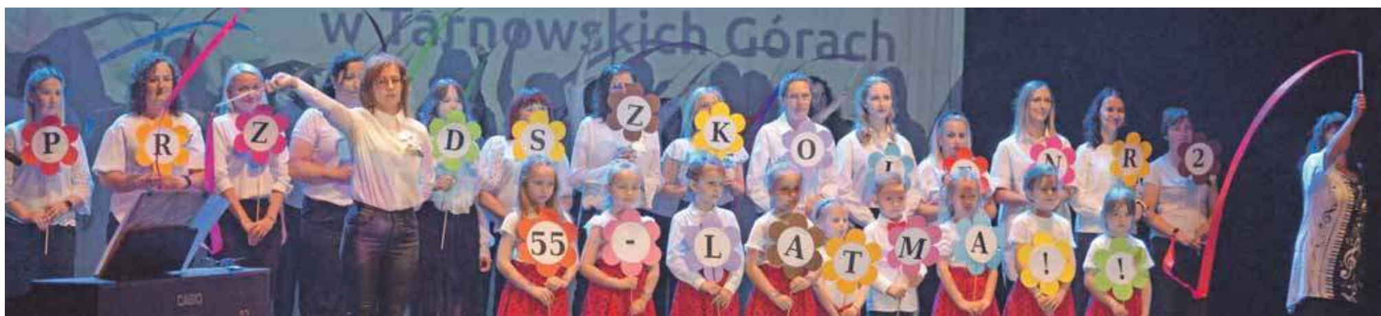
Na scenie wystąpiły razem przedszkolaki, wychowankowie, nauczyciele i rodzice