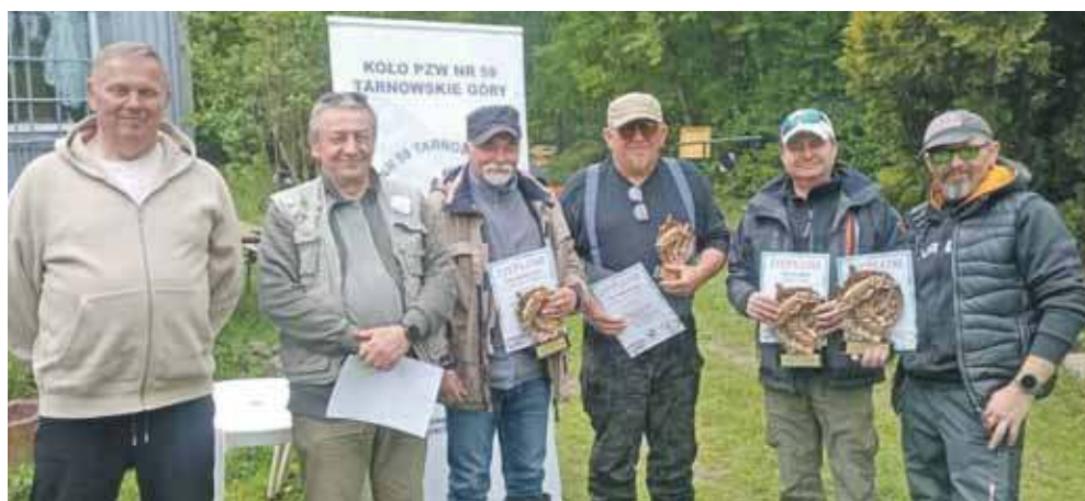
Wygrały „Złote Algi”