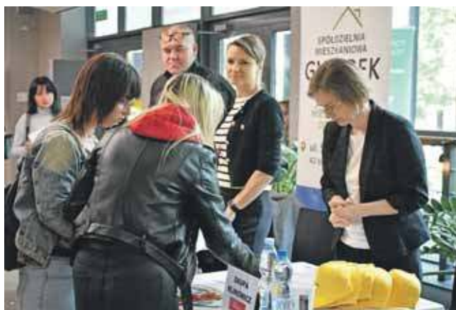
Targi odbyły się w minioną środę, 14 maja. Zgromadziły blisko 30 pracodawców

Wśród ofert przeważały propozycje skierowane do mężczyzn. Pracodawcy szukali między innymi: mechaników i elektromechaników samochodowych, pracowników budowlanych, mon-