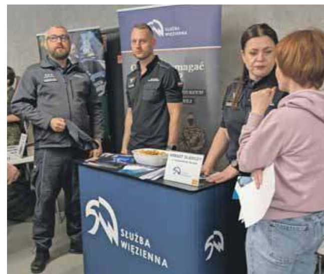
Swoje stoisko miała służba więzienna

osób starszych czy pracowników biurowych. (EKA)