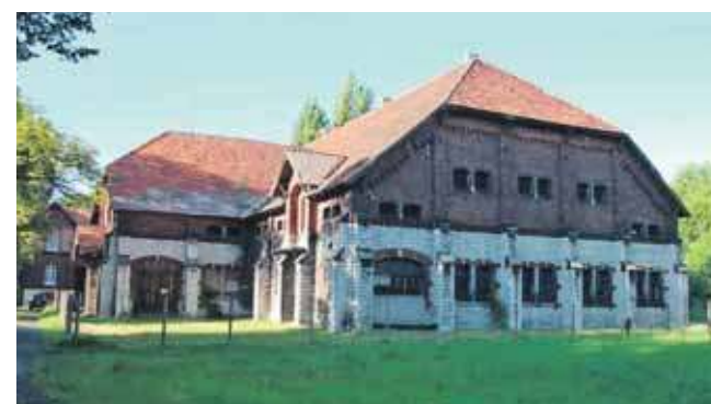
Czy samorząd będzie musiał zapłacić za folwark Donnersmarcków?

Dodaje, że równoległe trwają rozmowy dotyczące potencjalnej sprzedaży folwarku – to jedno z rozważanych rozwiązań. – Jednocześnie bacznie śledzimy wszelkie możliwości