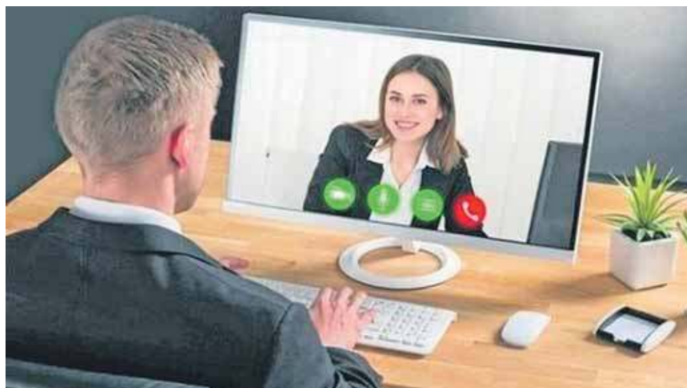
Bez wychodzenia z domu można porozmawiać ze specjalistą ZUS