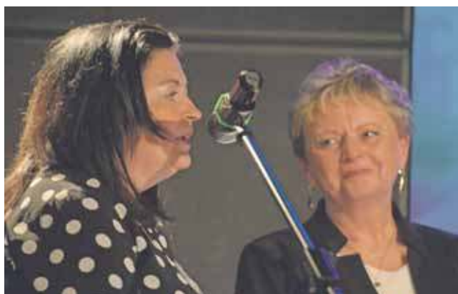
Na zakończenie gali ustawiła się długa kolejka osób chcących złożyć życzenia jubilatowi. Wśród nich byli obecni i emerytowani pracownicy oświaty

Od 1982 roku placówka prowadzi grupę dla dzieci z niepełnosprawnościami, które mogą korzystać z wielu zajęć dodatkowych oraz terapii wspomagających ich rozwój. Przedszkole posiada