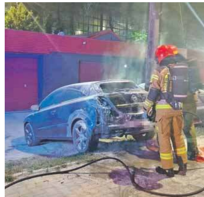
Służby wezwano w środku nocy