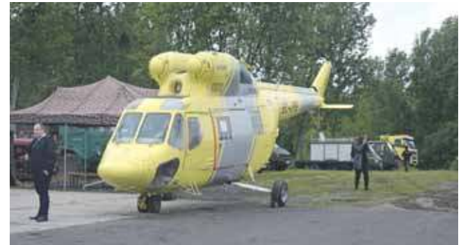
Unikatowym eksponatem jest PZL Sokół. To jedyny egzemplarz tego helikoptera, który można oglądać w muzeach

Podczas Nocy Muzealnej w Zbrośławicach można było także oglądać wyposażenie i porozmawiać z członkami