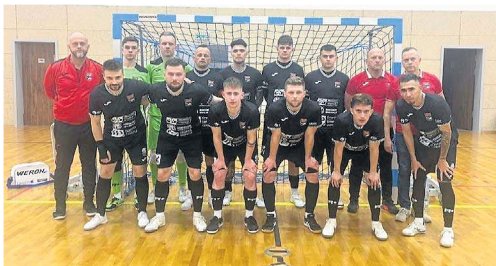
Drużyna Team Lębork przed występem z Wiarą Lecha Poznań

Zespół z Lęborka wciąż zajmuje 3. miejsce w tabeli, a w najbliższy weekend powalczy na parkiecie Futbolu Białostok. Do końca rundy zasadniczej Team zagra też z AZS Gdańsk, Jagiellonią Białostok (oba u siebie) i Bonito w Białymstoku. ©