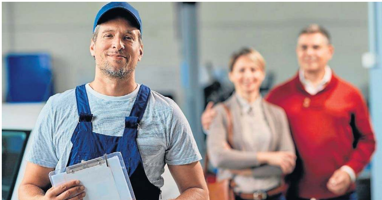
Potwierdzaniem okresów naszej aktywności zawodowej zajmuje się ZUS

przepisy o zleceniu, wykonywania umowy agencyjnej, współpracy z osobą wykonującą umowę zlecenia, inną umowę o świadczenie usług lub umowę agencyjną, pozostawania członkiem rolniczej spółdzielni produkcyjnej, pozostawania członkiem spółdzielni kółek rolniczych;