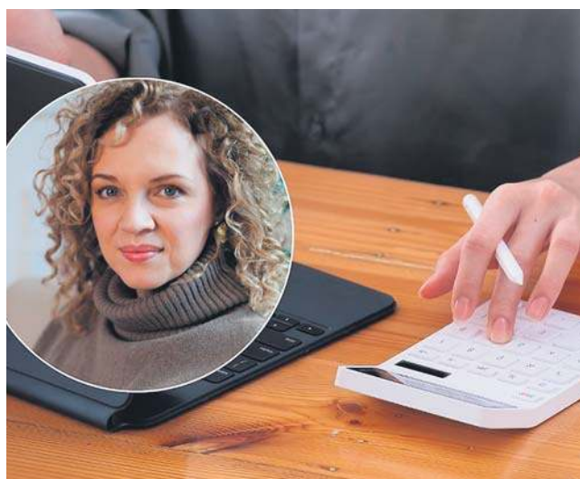
Kobiety w Polsce stanowią zaledwie 8-9 procent aktywnie inwestujących

Uważam, że AI jest świetnym narzędziem w rękach ludzi, którzy wiedzą, co z nim robią. Jeśli tej świadomości nie ma, AI nie zastąpi rzetelnej wiedzy. W finansach powtarzam, że to jest ważne, żeby wiedzieć, do czego używamy narzędzia. Można z wykorzystaniem AI przeanalizować dużą liczbę danych i wyciągnąć wnioski, ale trzeba wiedzieć, co robimy i po co. Zadanie pytania w stylu „Oto moje cele, ułóż mi strategię” to już problem. Nie ma uniwersalnego schematu dla każdego człowieka. Jeśli natomiast mamy już przemyślaną strategię i chcemy coś uprościć, wtedy narzędzie może pomóc. Może zrobić raport, przeszedź