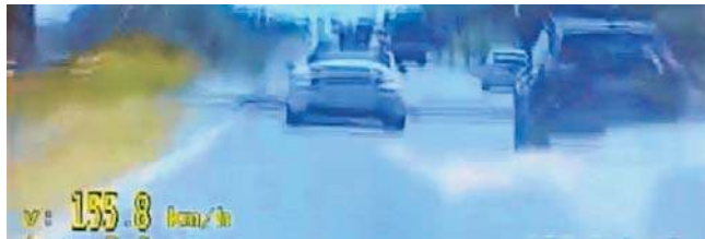
Tego kierowcę ukarano mandatem za przekroczenie dozwolonej prędkości w terenie zabudowanym o 85 km

Badania wskazują za główną przyczynę wypadków Polsce właśnie nadmierną prędkość. Polityka represji za wykroczenia w ruchu drogowym musi postępować. Z prostej przyczyny - każdy z nas przystępując do kar obowiązuje, nawet jeżeli one są wysokie. A chodzi o to, by rygor niósł ze sobą stały efekt odstraszający. Tu oczywiście w grę powinna wchodzić też skuteczność egzekwowania kar. Kara więzienia - drastyczna, powinna eliminować pewien procent zachowań niebezpiecznych, które wynikały ze swego rodzaju „odporności mentalnej” na obecne sankcje. Chodzi np. o pewną grupę osób bardzo majątnych, z łatwością uzyskujących środki finansowe, np. ze swojej działalności w internecie. Część z tych osób kupuje bardzo drogie auta, o dużej mocy, przy czym ich umiejętności prowadzenia są znikome. Mandat karny, np. o wysokości 10 tys. zł, nie jest dla nich czymś strasznym, nawet jeśli trzeba takich mandatów zapłacić kilka.