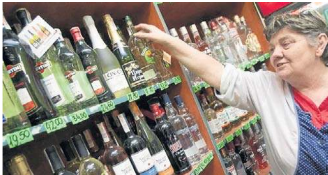
„Schowanie” alkoholu w sklepach może nie wpłynąć na spadek sprzedaży impulsywnej tych produktów

Do kupowania w sposób impulsywny i nieplanowany skłaniają przede wszystkim akcje promocyjne i możliwość nabycia większej liczby produktów za niższą cenę. „Zakupy pod wpływem okazji wielopakowych mają największe znaczenie dla konsumentów w wieku