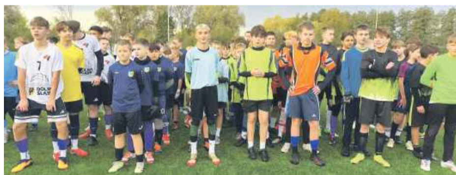
Do rywalizacji przystąpiło 180 zawodników