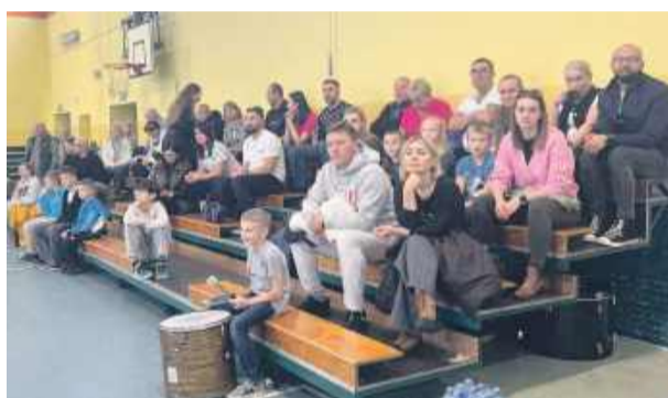
Na trybunach pojawiło się wielu sympatyków siatkówki

ale także rodzinny i przyjazny charakter. Dla młodych siatkarek ze Strzelina był to kolejny krok w zdobywaniu cennego doświadczenia na wojewódzkim poziomie rywalizacji. Po kilku latach przerwy młodzieżki Tygrysów wracają na siatkarskie parkiety Dolnego Śląska z nową energią, pasją i wielkimi ambicjami!