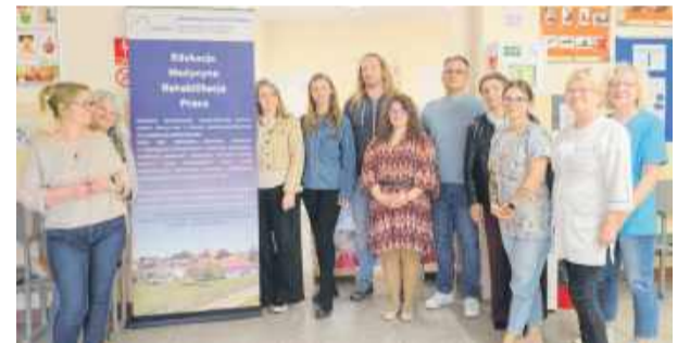
W Ośrodku Zdrowia w Przewornie odbyły się „Dni Zdrowia Psychicznego”.

angażuje się w nie w ramach własnej pracy. – Robimy to z potrzeby serca i poczucia obowiązku wobec mieszkańców. To nie jest projekt dotowany, a współpraca między naszymi placówkami – mówi.