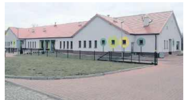
W budynku przedszkola w Kondratowicach zostaną wygospodarowane pomieszczenia na żłobek

W zamian w budynku przedszkola mają zostać wygospodarowane pomieszczenia na żłobek. Gmina