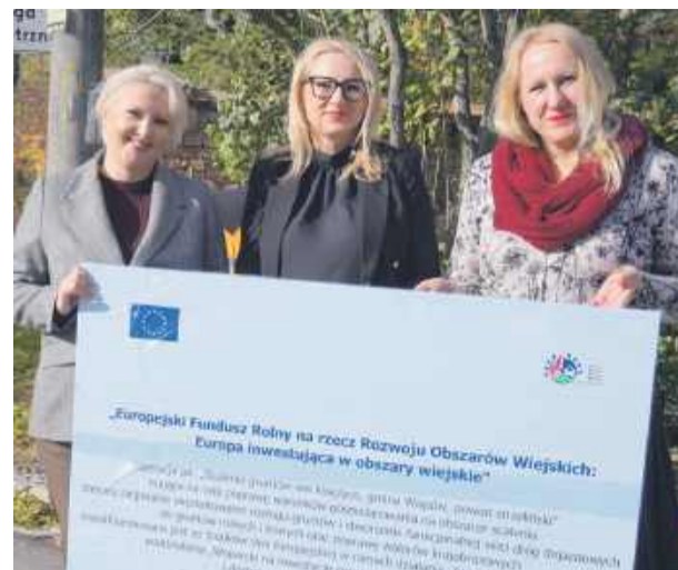
Przedstawicielki Zarządu Powiatu Strzeleńskiego z tablicą informacyjną w Księżycach