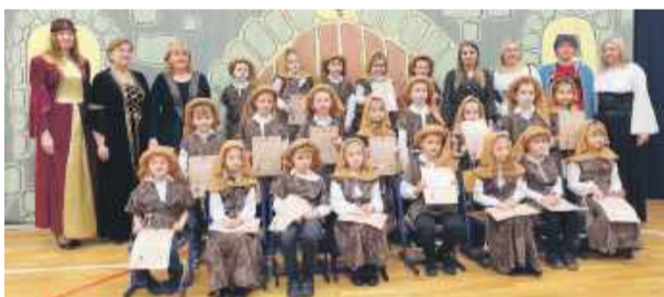
Klasa 1 A