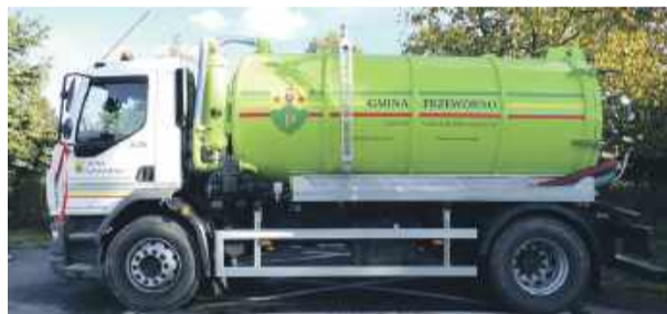
Nowy samochód asenizacyjny kosztował 630 tys. zł

Jak informuje Tomasz Ciecierski, kierownik Referatu Rozwoju i Funduszy Zewnętrznych, środki na zakup pojazdu pozyskano w ramach projektu współfinansowanego z Unii Europejskiej w ramach Programu Rozwoju Obszarów