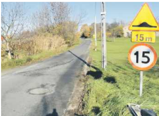
Od roku znaki, m.in. na ul. Akacyjnej w Gęsińcu, informują o czymś, czego nie ma

Nie sposób zgodzić się z tezą, że działania polegające na korektach i zmianach w organizacji ruchu drogowego w miejscowości Gęsiniec, polegające m.in. na budowie nowych progów zwalniających, można nazwać „bałaganem” czy „błędami”. Są one rezultatem dialogu władz gminy Strzelin z mieszkańcami miejscowości Gęsiniec, którzy wraz z sołtysiem wsi w licznych, ustnych i pisemnych, interwencjach wskazywali na potrzebę rozwiązania problemu nadmiernej