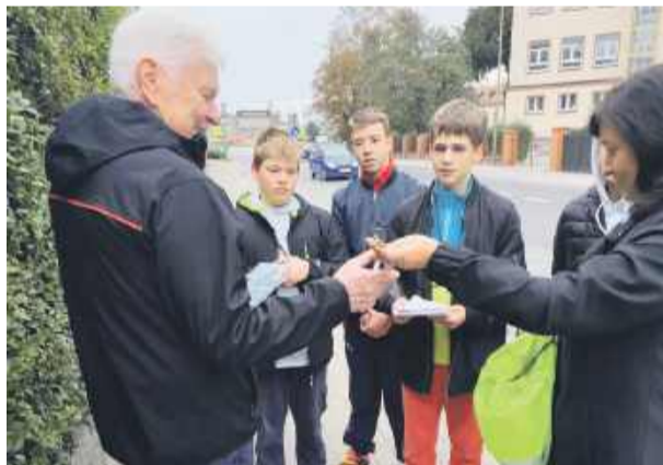
Uczniowie strzelińskiego MOS-u rozdawali ulotki i odblaskowe gadżety.