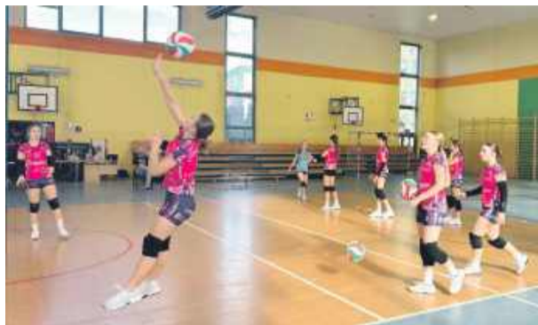
Młode siatkarki ze Strzelina podczas rozgrzewki

należą się rodzicom naszych zawodniczek, którzy przygotowali pyszny poczęstunek dla uczestników i gości turnieju. Dzięki nim wydarzenie miało nie tylko sportowy,