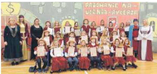
Klasa 1 B