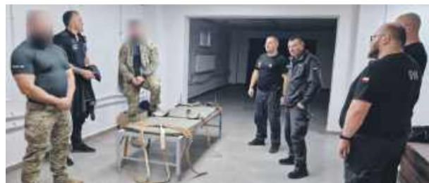
Treningi wzmacniają współpracę i komunikację między strażnikami więziennymi.

Strażnicy uczyli się zachowania spokoju podczas akcji i opanowywania stresu. Kolejnym punktem ćwiczeń było