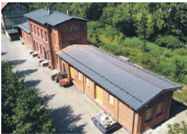
W ramach pierwszego etapu remontu wykonano nowy dach.

Usług Społecznych przy pozyskaniu dofinansowania z zewnątrz – mówił szef gminy. – Jestem już po spotkaniu z panią kierowniczką Gminnego Ośrodka Pomocy Społecznej Renatą Borowicz i z panem, który będzie pisał wniosek. Wniosek zostanie złożony jeszcze w tym roku. Jeżeli pozyskamy środki, to ok. 15% z wnioskowanej kwoty, a opiewa ona na kilka milionów, zostanie przeznaczonych na kwestie