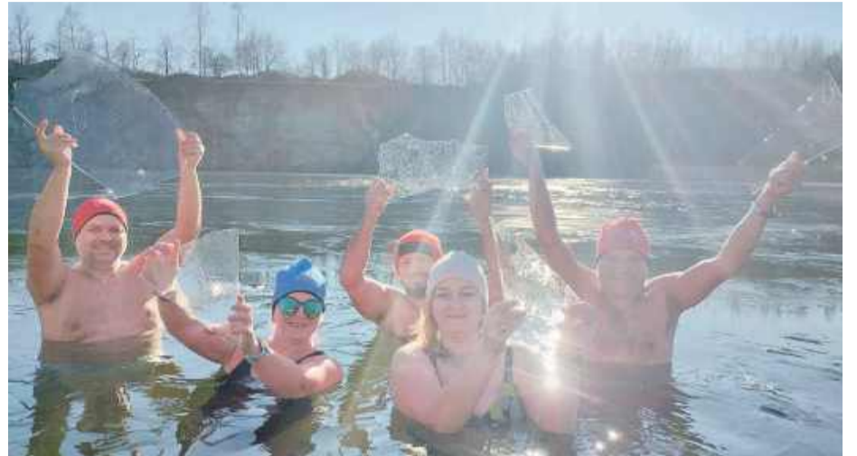
Strzelińskie morsy to ludzie, którzy z zimnych kąpeli czerpią nie tylko zdrowie, ale i radość

- Zgadza się. Od lat nasze spotkania są organizowane tak, żeby w dzień wolny znaleźć chwilę i zrobić coś dla zdrowia. W Klubie Morsa w Strzelinie spotkania przebiegają w przyjaznej i wbrew pozorom ciepłej atmosferze (śmiech). Spotykamy się regularnie w niedziele o godzinie 16 w Białym Kościele. Jest to dla nas taki wyznacznik regularności i nie trzeba obawiać się, że nikogo nie będzie, bo zawsze ktoś jest. Sam udział w morsowaniu w naszej grupie jest bezpłatny, natomiast za wstęp