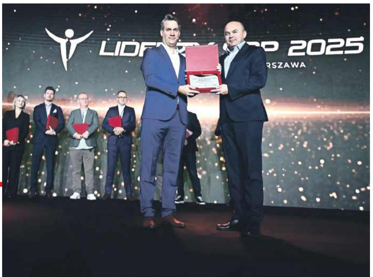
Wicemarszałek Wojciech Bochnak z prestiżową nagrodą „Lider polskiego sportu”

Lider Polskiego Sportu - laureatem tak brzmiącego plebiscytu został samorządowiec ziemi strzelińskiej i Wicemarszałek Województwa Dolnośląskiego Wojciech Bochnak. To ogromne wyróżnienie nie tylko dla samego triumfatora, ale i dla całego regionu, ponieważ polityk z Kondratowic to jedyny w całej Polsce samorządowiec, który został uhonorowany tą prestiżową nagrodą.