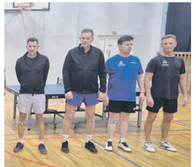
Pierwszy zespół Granitu rywalizuje w trzeciej lidze

stosunku 10:6. Zawodnicy drugiej drużyny zaprezentowali ambitną postawę i skuteczność w kluczowych pojedynkach, co pozwoliło im dopisać do tabeli kolejne punkty. W VII lidze rywalizują najmłodszy zawodnicy