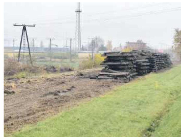
Trwają prace związane z odtworzeniem linii kolejowej nr 319 relacji Strzelin – Łagiewniki.

W jakiej perspektywie czasowej na torę wrócą pociągi osobowe? – Czas jest trudny do określenia, bo dalszy odcinek linii od Łagiewnik do Kobierzyc jest jeszcze niezrealizowany. W przypadku tej inwestycji jesteśmy na etapie podpisania umowy z wykonawcą. W Ko-