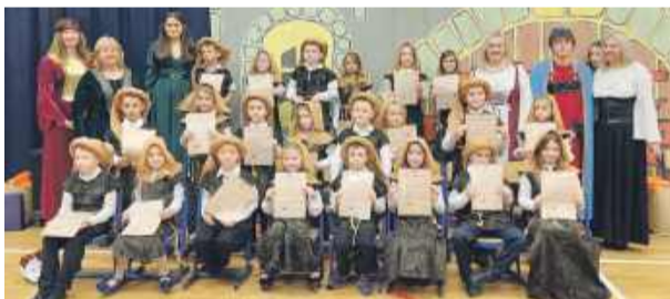
Klasa 1 C