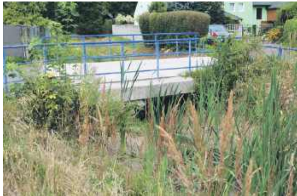
Potok Nieszkowicki w Kazanowie ma zostać udrożniony