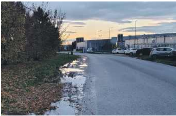
Ul. Kazimierza Wielkiego po zmroku i kałuże na poboczu