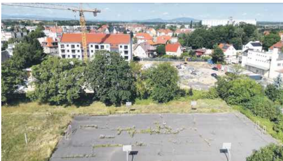
Obecny stan boiska przy LO w Strzelinie z lotu ptaka

dofinansowanie w wysokości 800 tys. zł zarówno z Ministerstwa Sportu i Turystyki jak i dolnośląskiego Urzędu Marszałkowskiego. Gmina Strzelin uczyniła działkę, przeznaczoną na realizację inwestycji, co oznacza, że z nowoczesnego kompleksu będą mogli korzystać nie tylko uczniowie, ale też mieszkańcy miasta i okolic. Tym samym uda się zrealizować inwestycję, o której od wielu lat mówiła dyrekcja strzelińskiego Liceum oraz jego uczniowie.