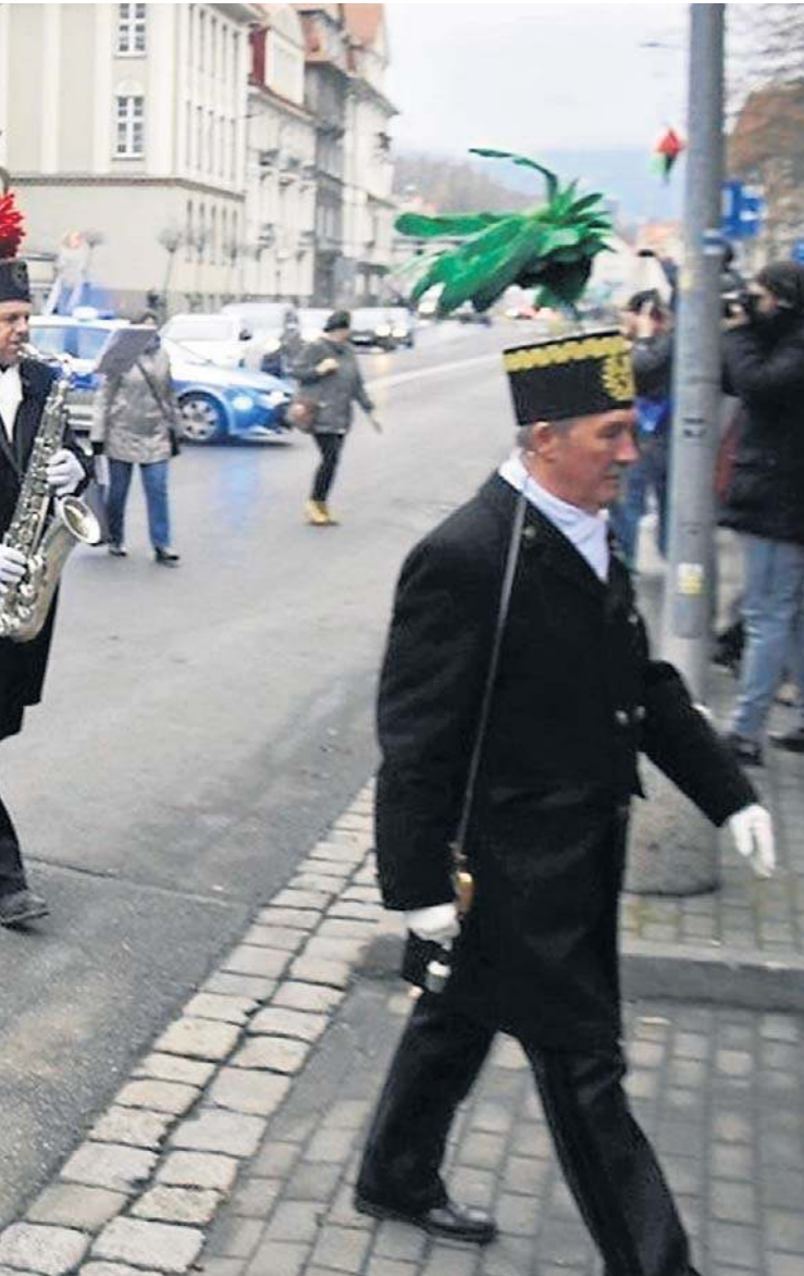
omnik Pamięci Górnictwa Wałbrzyskiego przy al. Wyzwolenia.