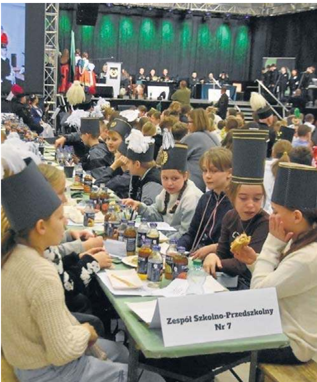
W Sali Łańcuszkowej Starej Kopalni zebrały się setki uczniów wałbrzyskich szkół wraz z opiekunami.