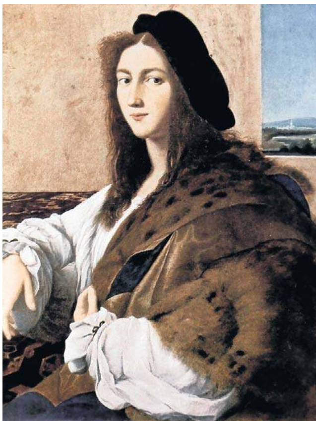
„Portret młodzieńca” Rafaela Santi.

O jego wojennych losach wiadomo tyle, że tuż przed wybuchem wojny w 1939 roku został ukryty w majątku Czartoryskich w Sieniawie, m.in. z obrazem Leonarda da Vinci. Skrytka została jednak splądrowana i jeszcze w tym samym roku portret trafił do Berlina - w przyszłości miał się znaleźć w planowanym przez Hitlera w Linzu muzeum sztuki. Nigdy ono jednak nie powstało. Obraz został wpisany do specjalnego katalogu zabytków przejętych przez Niemców na terenie Generalnego Gubernatorstwa, gdzie otrzymał numer 141. Z Berlina w 1943 roku „Młodzieniec” wrócił do Krakowa - przejęty