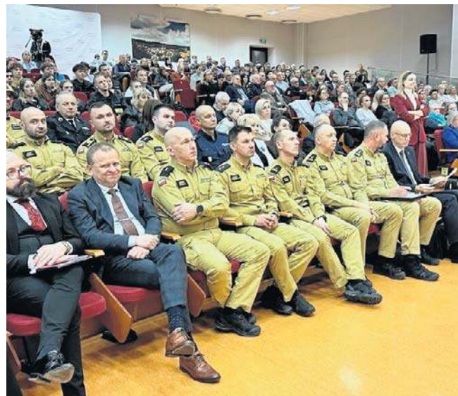
Spotkanie z wojewodą zorganizowano w auli ANS w Wałbrzychu w ramach akcji Bezpieczny Dolny Śląsk.

Codziennie na wschodniej granicy kilka tysięcy osób próbuje ją sforsonować, są tam dowożeni przez reżim Łukaszenki. Prowokują nasze służby. Na zachodniej granicy są monitorowane próby utworzenia tras przetrwania nielegalnych migrantów ze wschodu.