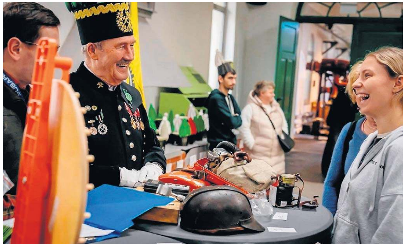
Szycha Rodzinna w Starej Kopalni była elementem wałbrzyskiego Festiwalu Tradycji Górniczych Barbórka 2025.