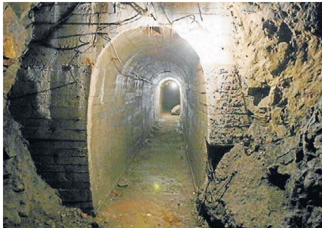
Złoty pociąg ma się znajdować w starannie zamaskowanym tunelu na terenie Nadleśnictwa Świdnica.

ma się znajdować tunel, rosną tzw. starolasy, które podlegają ochronie.