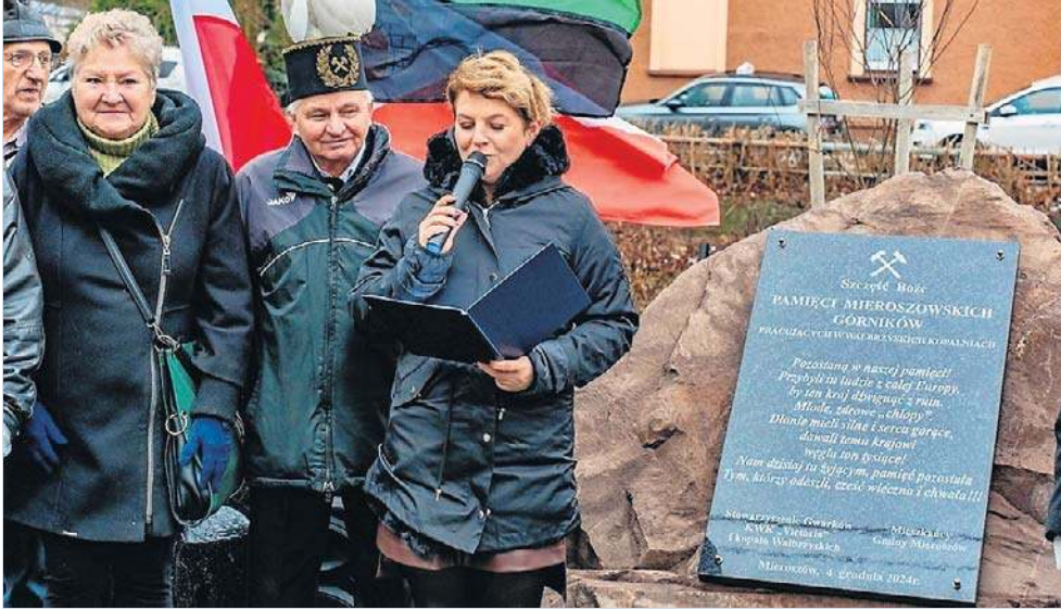
W Mieroszowie złożono kwiaty pod tablicą, upamiętniającą miejscowych górników.