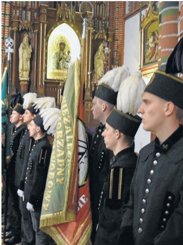
Święto górników co roku jest obchodzone w Wałbrzychu bardzo uroczystie. Zawsze zaczyna się w kościele.