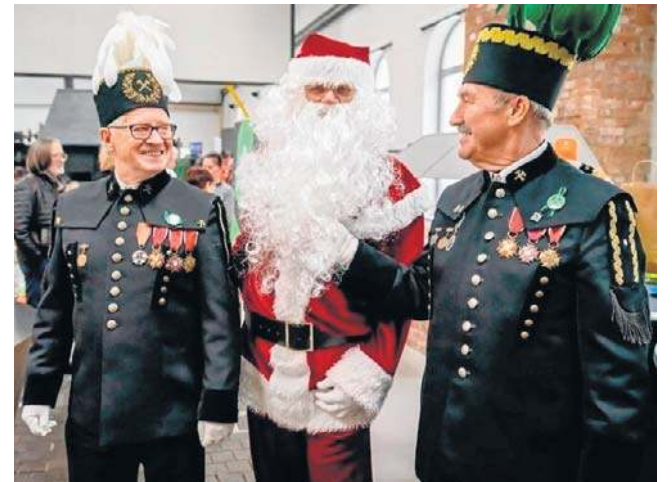
W Starej Kopalni zjawił się św. Mikołaj, a na uczestników czekało mnóstwo atrakcji, warsztatów i aktywności.