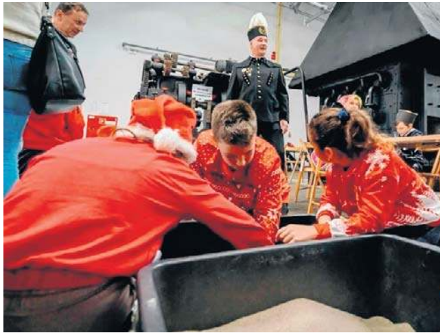
Barbórkowe święto to nie tylko świetna zabawa. To także sposób na pielęgnowanie górniczych tradycji.