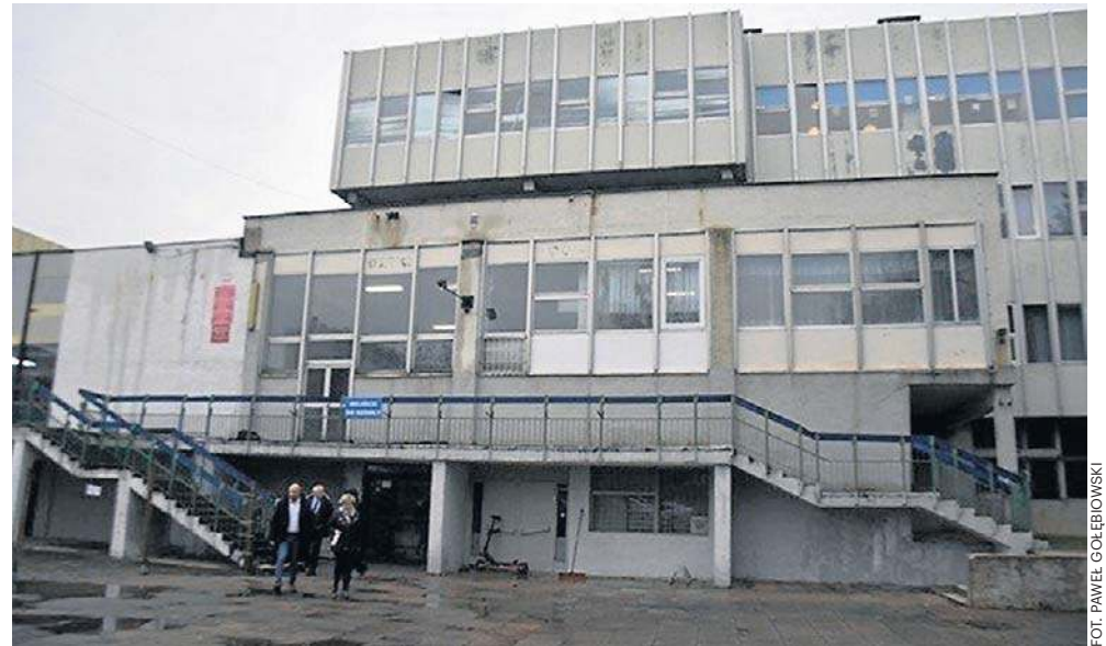
Ze starego budynku SP nr 21 nie da się już zrobić nowoczesnej szkoły. Musi powstać nowy.

się, że trzeba budować, bo z tego budynku nie da się już zrobić nowoczesnej szkoły. Udało się pozyskać pieniądze ze środków europejskich - Funduszu Sprawiedliwej Transformacji, przeznaczone dla ośrodków pogórnich. Miasto wniesie 15 procent wkładu.