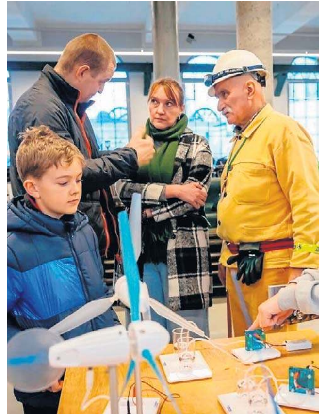
Barbórkowe spotkanie w Starej Kopalni znakomicie służyło budowaniu trwałych więzi między pokoleniami.