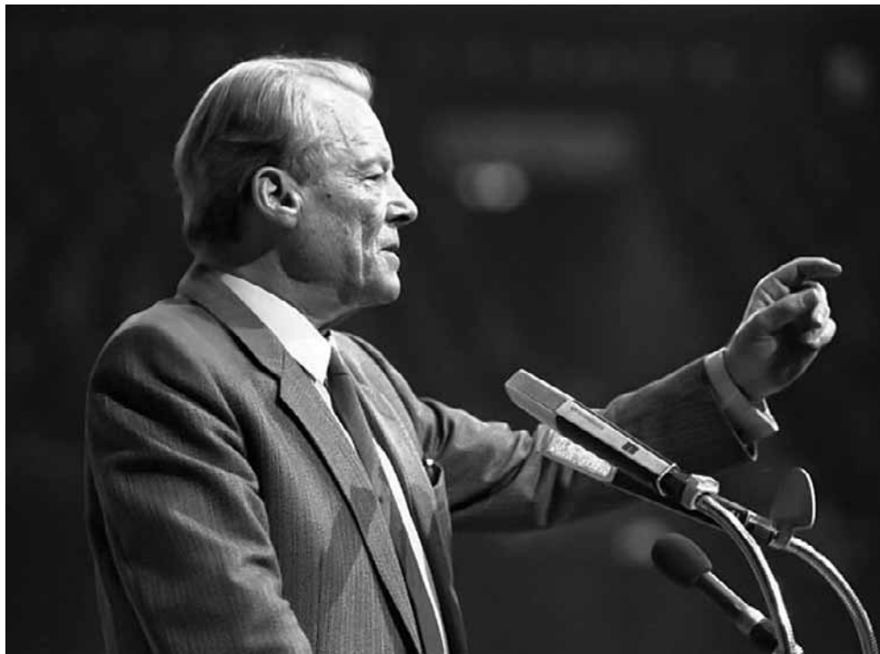
Polityka Willy'ego Brandta szła w poprzek tzw. doktryny Hallsteina. Zgodnie z nią, RFN nie utrzymywała stosunków dyplomatycznych z państwami, uznającymi NRD.

Gdy spojrzymy w „Kalendarium stosunków polsko-niemieckich w XX wieku” zamieszczone na gov.pl, czyli oficjalnej stronie polskiego rządu