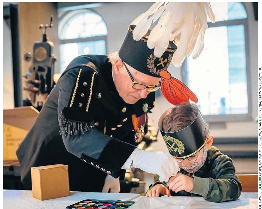
Dzieci świetnie radziły sobie z zagadkami, odpowiadając np. na pytanie, co to jest czako.