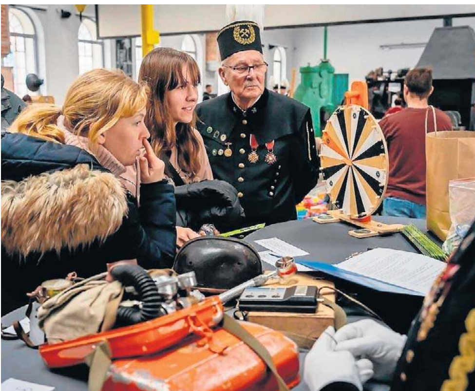
Nie zabrakło górniczych ciekawostek. Na przykład: co górnik zabierał ze sobą pod ziemię?