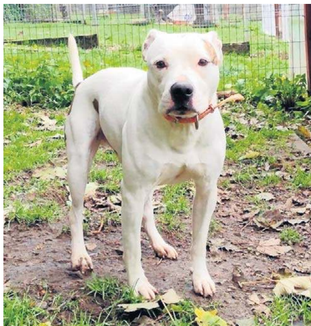
Najbliższa okazja do spotkania z podopiecznymi wałbrzyskiego schroniska będzie w sobotę, 20 grudnia.

- Jeżeli nawet będzie to pięćset osób z psem, przekażemy pół tony karmy - zapewnia Ka-