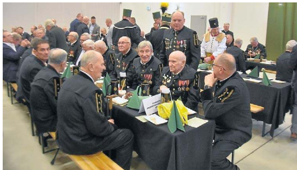
W Starej Kopalni zorganizowano Karcznię Piwną. W Barbórkę musi być taka zabawa!