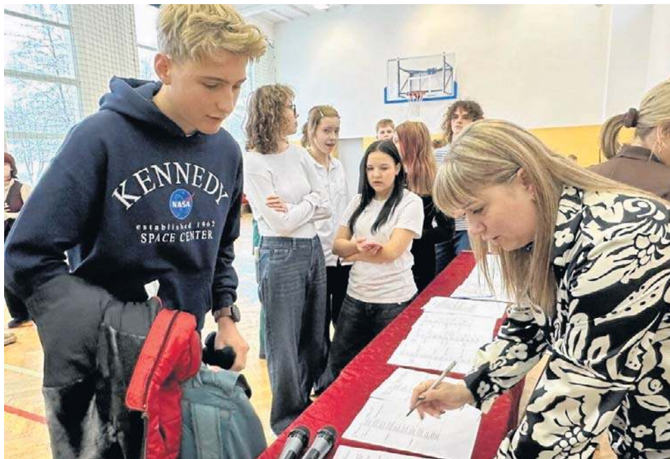
Udział w mistrzostwach brali głównie uczniowie szkół podstawowych oraz średnich.