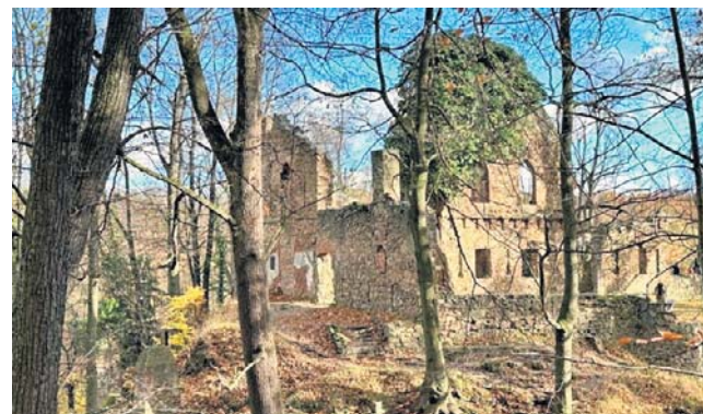
Zamek Stary Książ w Wałbrzychu jest idealnym celem na jesienny spacer. Roztaczają się z niego piękne widoki!

Nic tak nie poprawia humoru, jak ruch na świeżym powietrzu. Pogoda nie jest może wymarzona, ale też nie najgorsza, biorąc pod uwagę porę roku. Warto wziąć kurtkę przeciwdeszczową (może lekko pokropić), porządne buty i wybrać się na spacer. Najlepiej leśnymi ścieżkami.