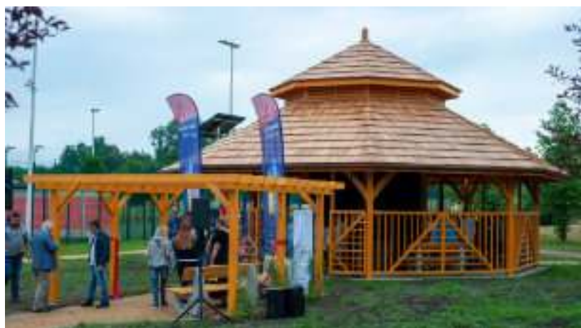
► Tężnia na Orliku w Maciejowie

taką samą dawkę jodu co kilka dni pobytu nad morzem. Solankowa bryza nawilża i pobudza do produkcji śluzu górne drogi oddechowe, które dzięki temu szybciej pozbywają się zanieczyszczeń. Zawarty w bryzie jod sprzyja m.in. prawidłowemu funkcjonowaniu tarczycy. Inhalacje stosowane u zdrowych ludzi zwiększają odporność organizmu. GOR