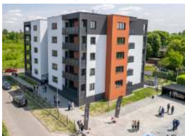
► Budowa nowoczesnego bloku przy ul. Żeromskiego