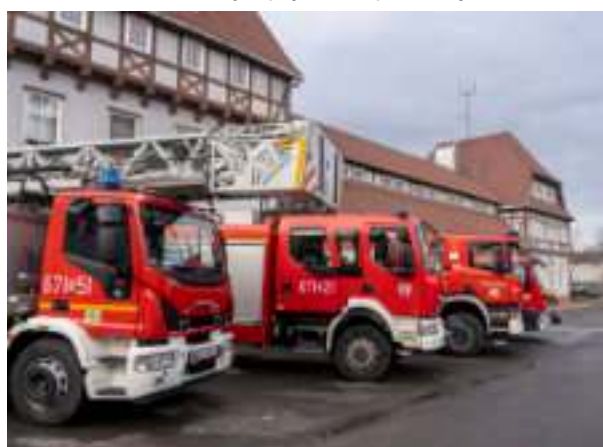
► Remont komendy Państwowej Straży Pożarnej