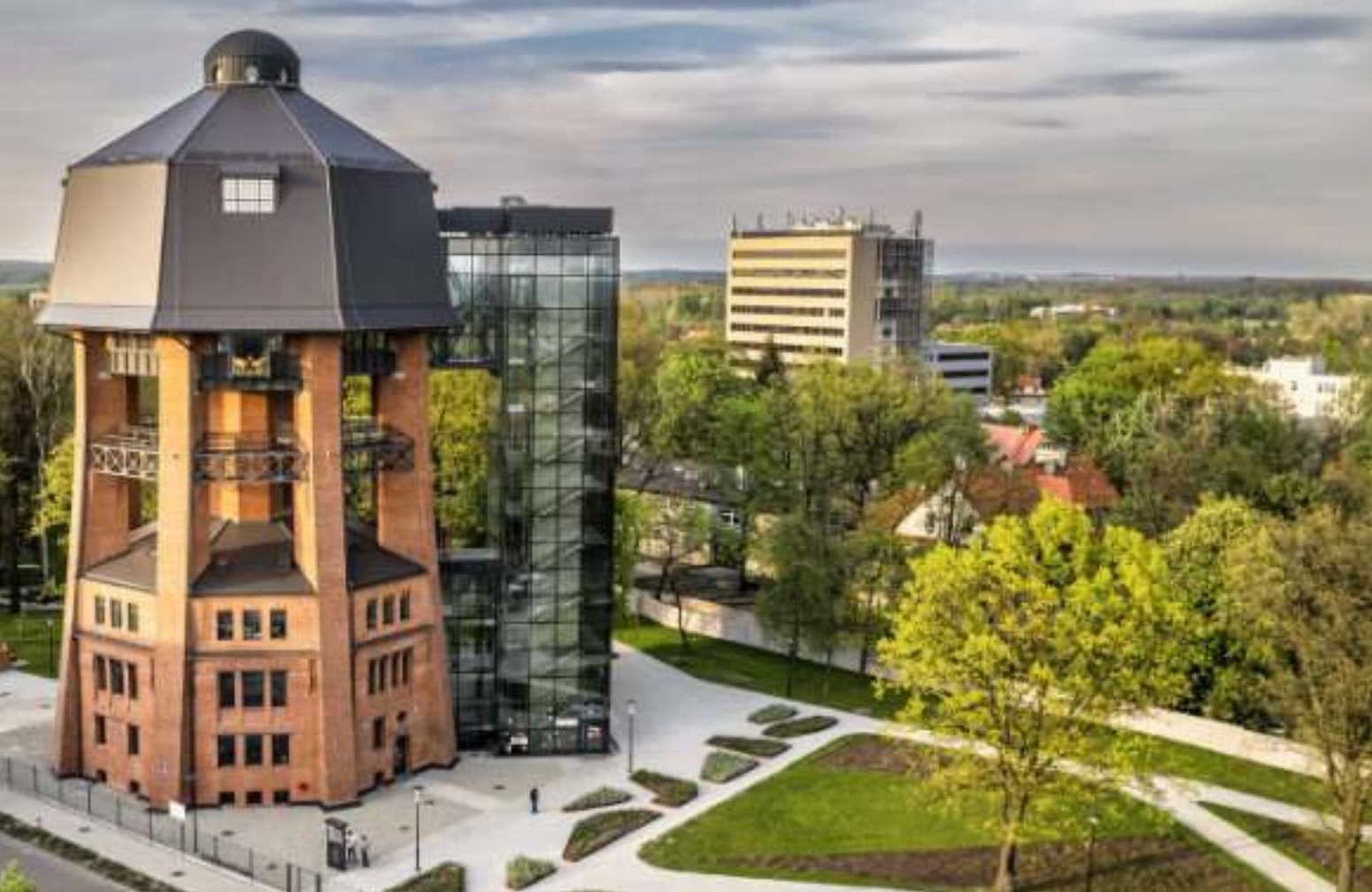
► Zrewitalizowana wieża ciśnień przy ul. Zamoyskiego to jedna z najważniejszych inwestycji minionego roku

przez gości, gdyż na każdą wydaną tam złotówkę przypadają cztery kolejne pozostawione w branżach okołoturystycznych, takich jak transport, gastronomia, hotelarstwo, usługi itd. Ponadto w zrewitalizowanych przestrzeniach odbywa się wiele imprez dla mieszkańców. Wspomnijmy choćby Carnall Festival czy Carbon Festival. Oczywiście, przyjeżdżają wtedy do Zabrze ludzie z całej Polski, ale niewątpliwie jest zabrzeńskich. Dzięki temu, że mamy tak niezwykłą przestrzeń, wiele firm i instytucji angażuje się w te przedsięwzięcia.