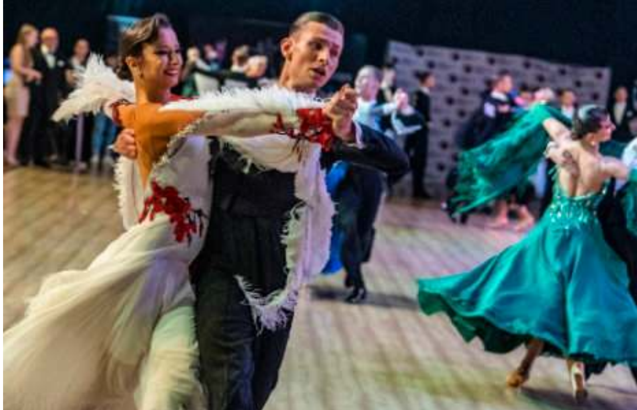
► Zachwycające popisy tancerzy podczas zabrańskich zawodów

NAJLEPSZE PARY TANECZNE EUROPY SPOTKAŁY SIĘ W ZABRZU