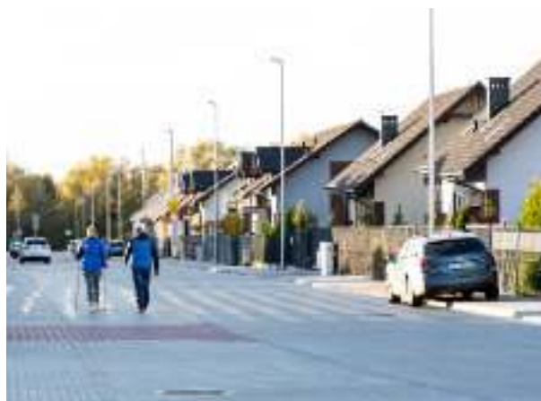
► Budowa nowych dróg w Grzybowicach