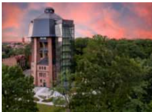
► Rewitalizacja wieży ciśnieni przy ul. Zamoyckiego