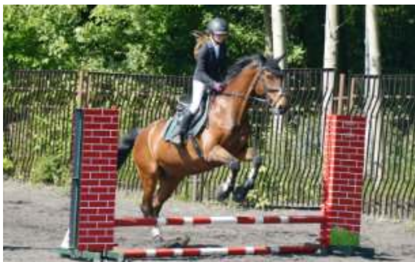
► W zawodach wzięło udział ponad 40 osób