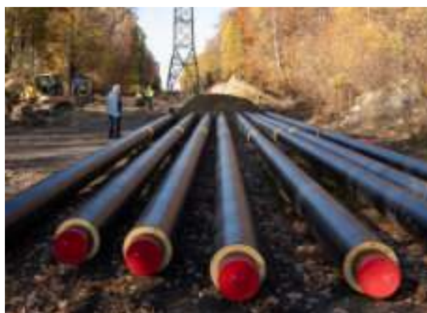
► Budowa sieci ciepłowniczej w Rokitnicy i Helence