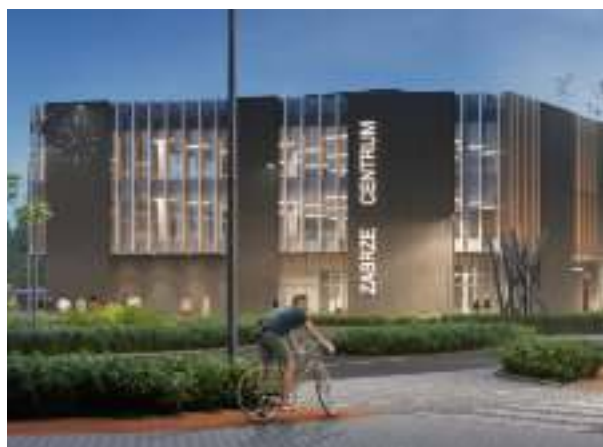
► Budowa centrum przesiadkowego przy ul. Goethego