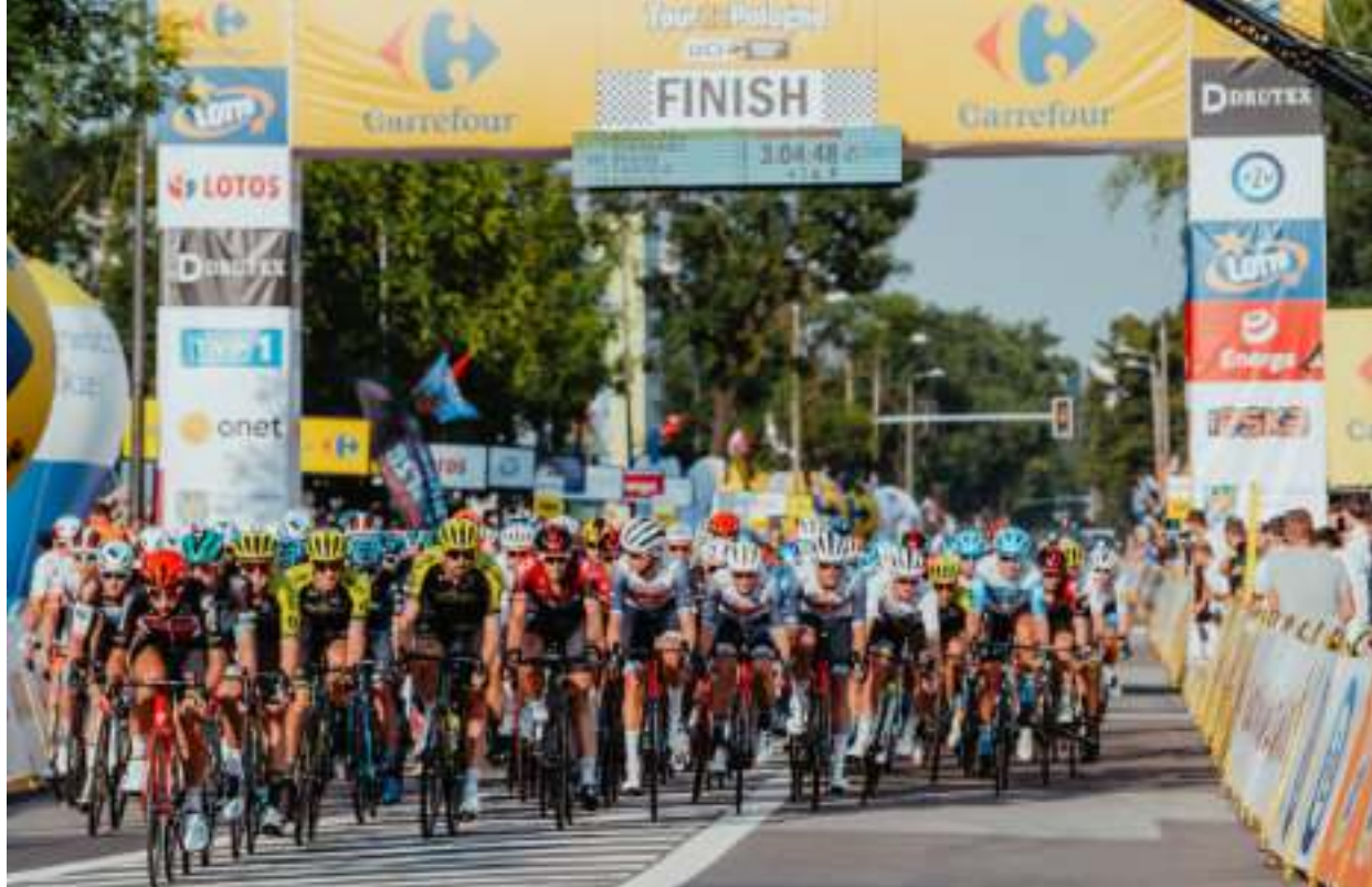
► Kolarze na ulicach Zabrze

NAJLEPSI KOLARZE ŚWIATA PONOWNIE POJAWIĄ SIĘ W NASZYM MIEŚCIE