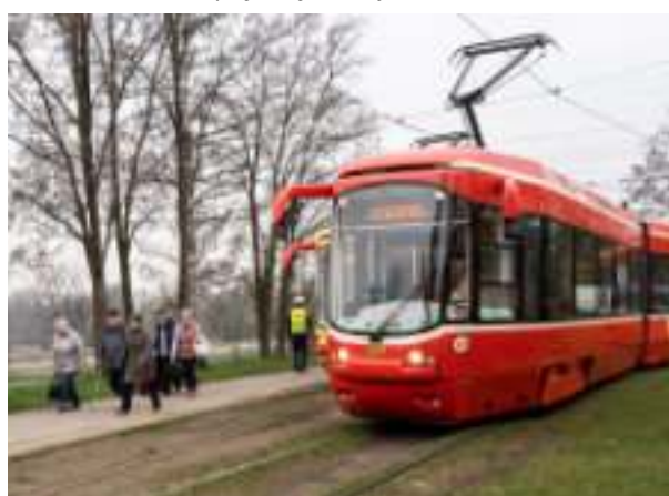
► Modernizacja kolejnych odcinków torowisk tramwajowych