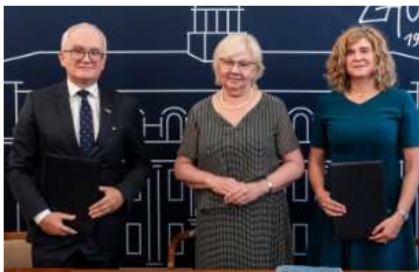
► Podpisanie umowy z wykonawcą czwartej trybuny

12 miesięcy ma wykonawca na zrealizowanie inwestycji