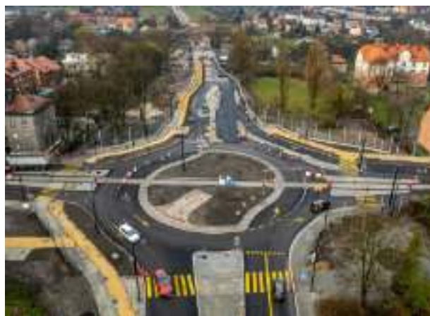
► Przedłużenie alei Korfantego