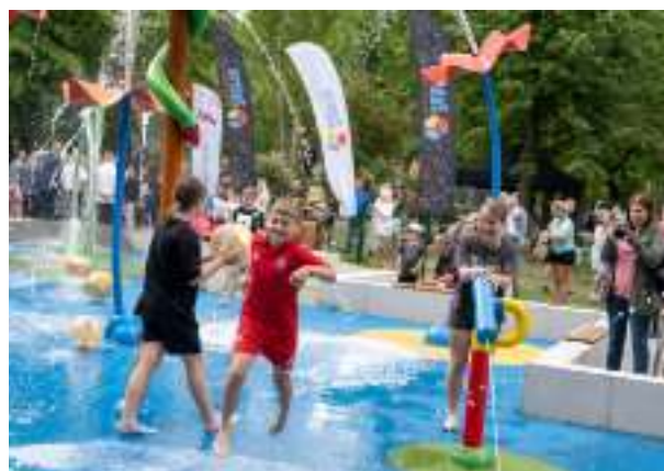
► Wodny plac zabaw na osiedlu Janek