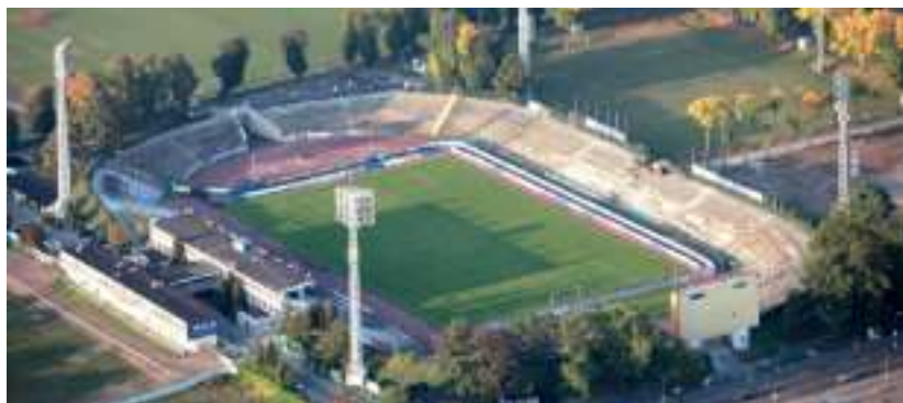
► Tak wyglądał stary obiekt przy ul. Roosevelta