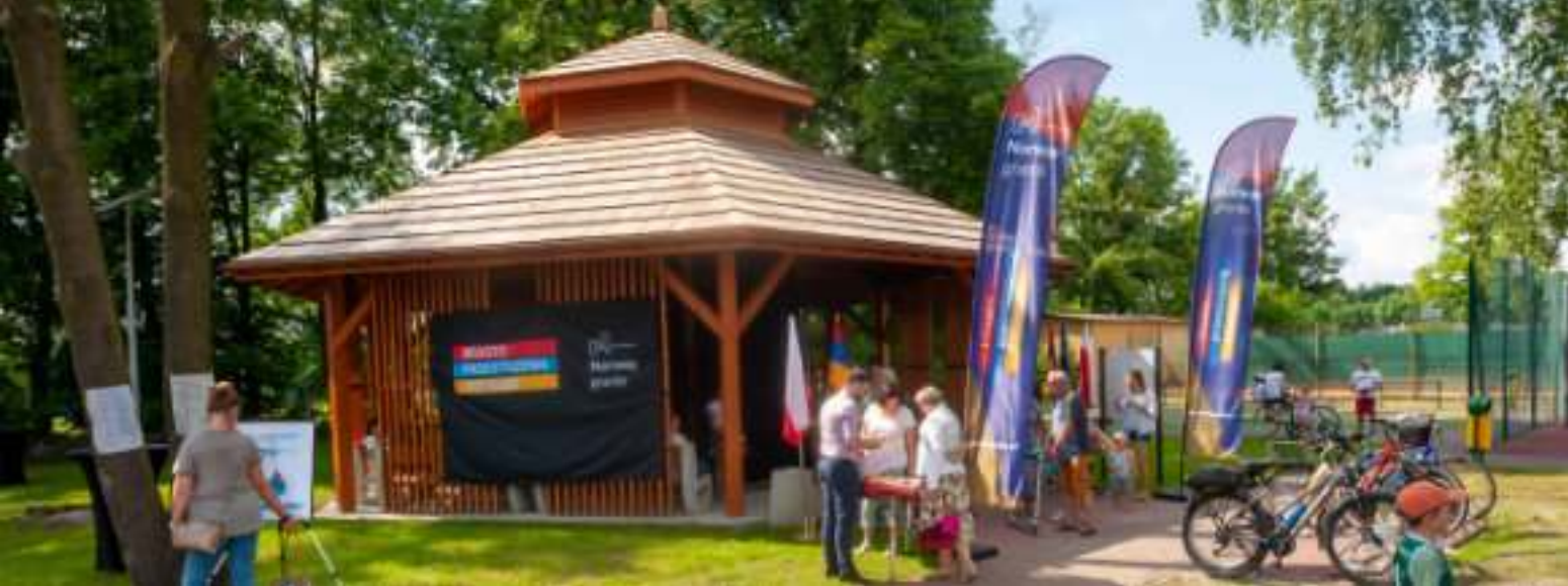
► Tężnia solankowa na terenie Dzielnicowego Ośrodka Kultury w Kończycach

TO PIERWSZE TEGO TYPU OBIEKTY W NASZYM MIEŚCIE