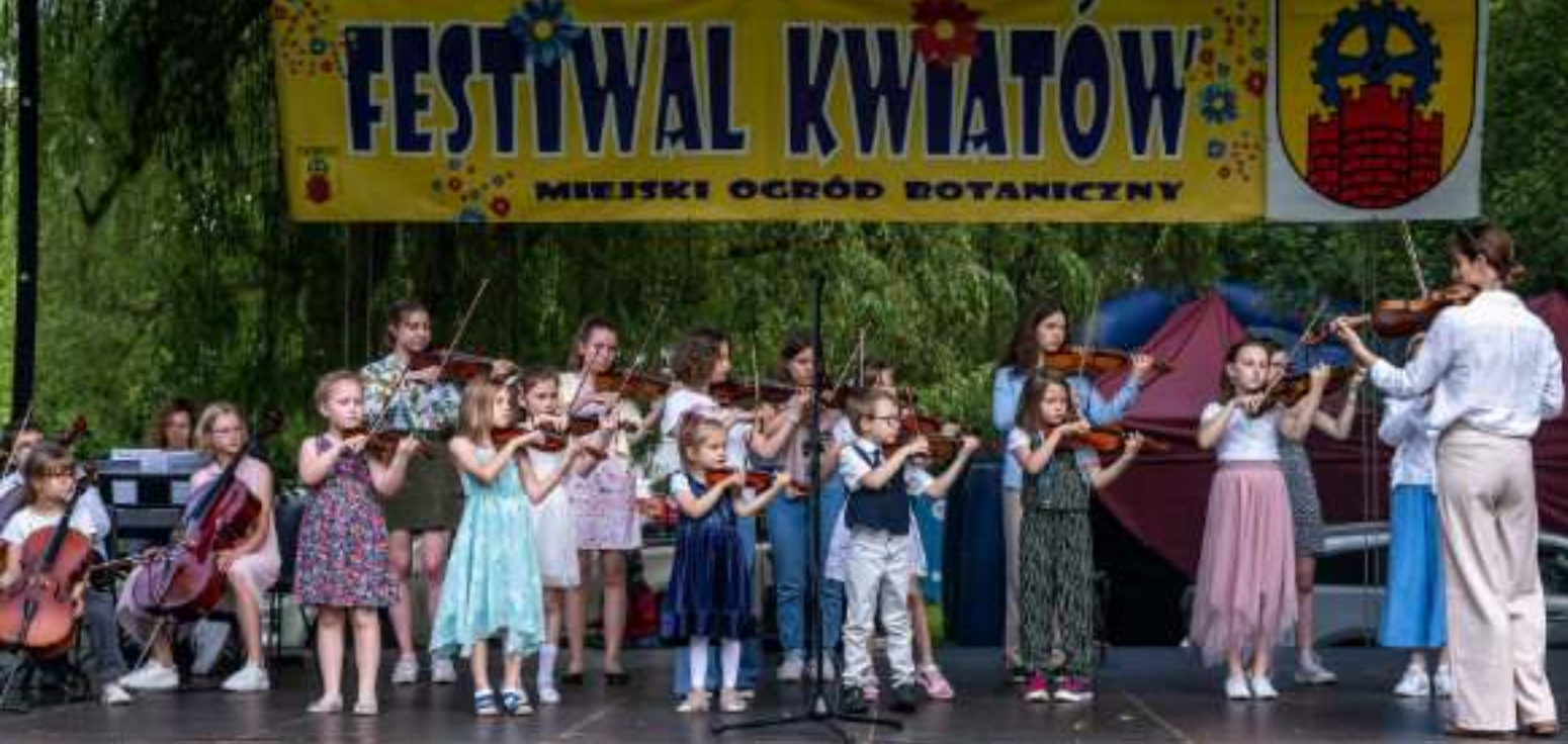
► Występy na festiwalowej scenie

WYJĄTKOWE WYDARZENIE W MIEJSKIM OGRODZIE BOTANICZNYM