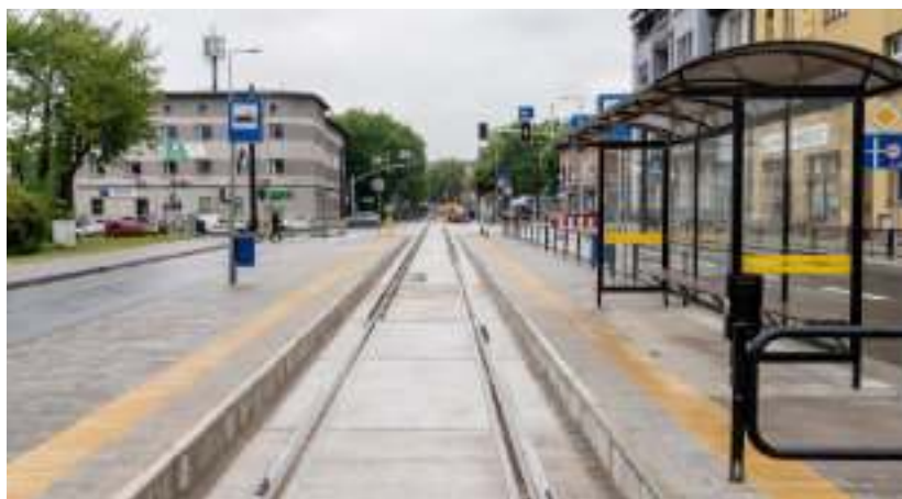
► Peron dla pasażerów tramwajów

Ta inwestycja w znacznym stopniu wpłynęła na poprawę bezpieczeństwa i usprawniła przejazd w tym miejscu. W czerwcu zakończyła się przebudowa skrzyżowania ulic Tarnopolskiej, Chopina i Kościuszki w Mikulczycach.