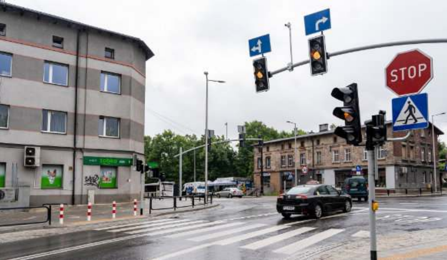
► Tak prezentuje się przebudowane skrzyżowanie

ZAKOŃCZYŁA SIĘ WAŻNA INWESTYCJA DROGOWA W MIKULCZYCACH