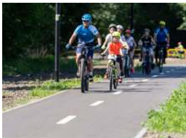
► Budowa ścieżki rowerowej między Rokitnicą a Mikulzycami