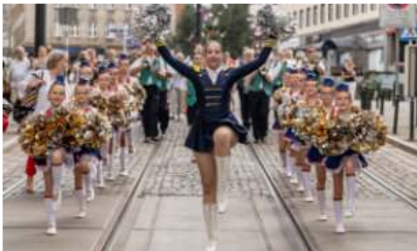
► Przemarsz poprowadziły mażoretki

rem polskiej jazzowej muzyki orkiestrowej w II połowie XX wieku. Był jednym z twórców festiwalu w Sopocie, Opolu i Kołobrzegu. Tworzył muzykę teatralną i filmową. GOR