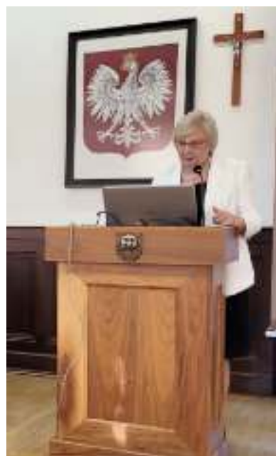
► Prezydent Małgorzata Mańka-Szulik podczas czerwcowej sesji absolutorijnej

Ponad 200 mln zł przeznaczono w ubiegłorocznym budżecie miasta na inwestycje. To o ponad 66 mln zł więcej niż rok wcześniej. Wśród najważniejszych inwestycji realizowanych w 2022 r. znalazła się m.in. rewitalizacja wieży ciśnień przy ul. Zamoyckiego, budowa centrów przesiadkowych przy ul. Goethego i w Rokitnicy, przedłużenie alei Korfantego, budowa nowoczesnego schroniska dla zwierząt w Biskupicach czy geoparku w Grzybowicach. Prowadzone były termomodernizacje kolejnych szkół i przedszkoli, przybyło miejsc służących rekreacji mieszkańców. Podczas sesji zaprezentowany został raport o stanie miasta za 2022 r.