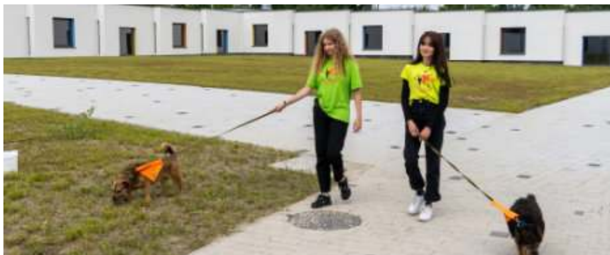
► Podopieczni schroniska na spacerze z wolontariuszkami