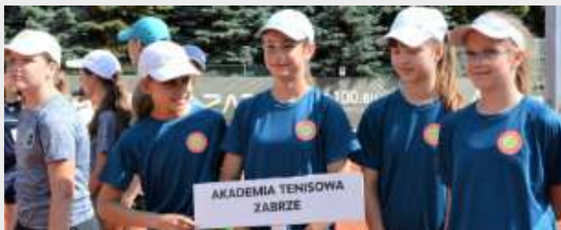
► Reprezentacja Akademii Tenisowej Zabrze