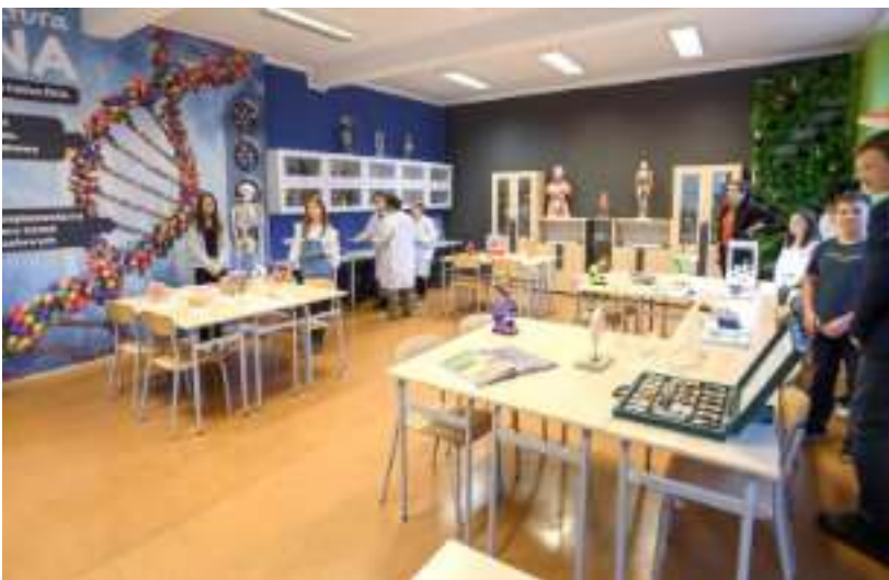
Jedna z działających już w Zabrzu zielonych pracowni

„Zielona Pracownia” to w efekcie dwa kompatybilne konkursy: na stworzenie projektu oraz na wykonanie pracowni. Łącznie w obu konkursach można było zdobyć w tym roku nawet 60 tys. zł. Konkurs „Zielona Pracownia_Projekt” ma na celu utworzenie projektu szkolnej pracowni, na potrzeby nauk przyrodniczych, biologicznych, ekologicznych,