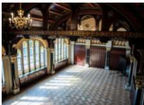
► Remont gmachu Muzeum Górnictwa Węglowego przy ul. 3 Maja