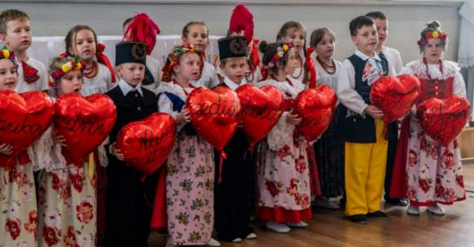
► Wychowankowie Przedszkola nr 3 zaprezentowali gościom przygotowany program artystyczny