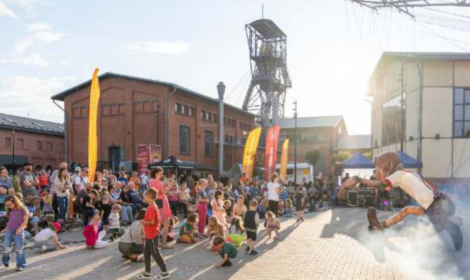
► Strefa Carnall Sztolni Królowa Luiza Fot. UM Zabrze