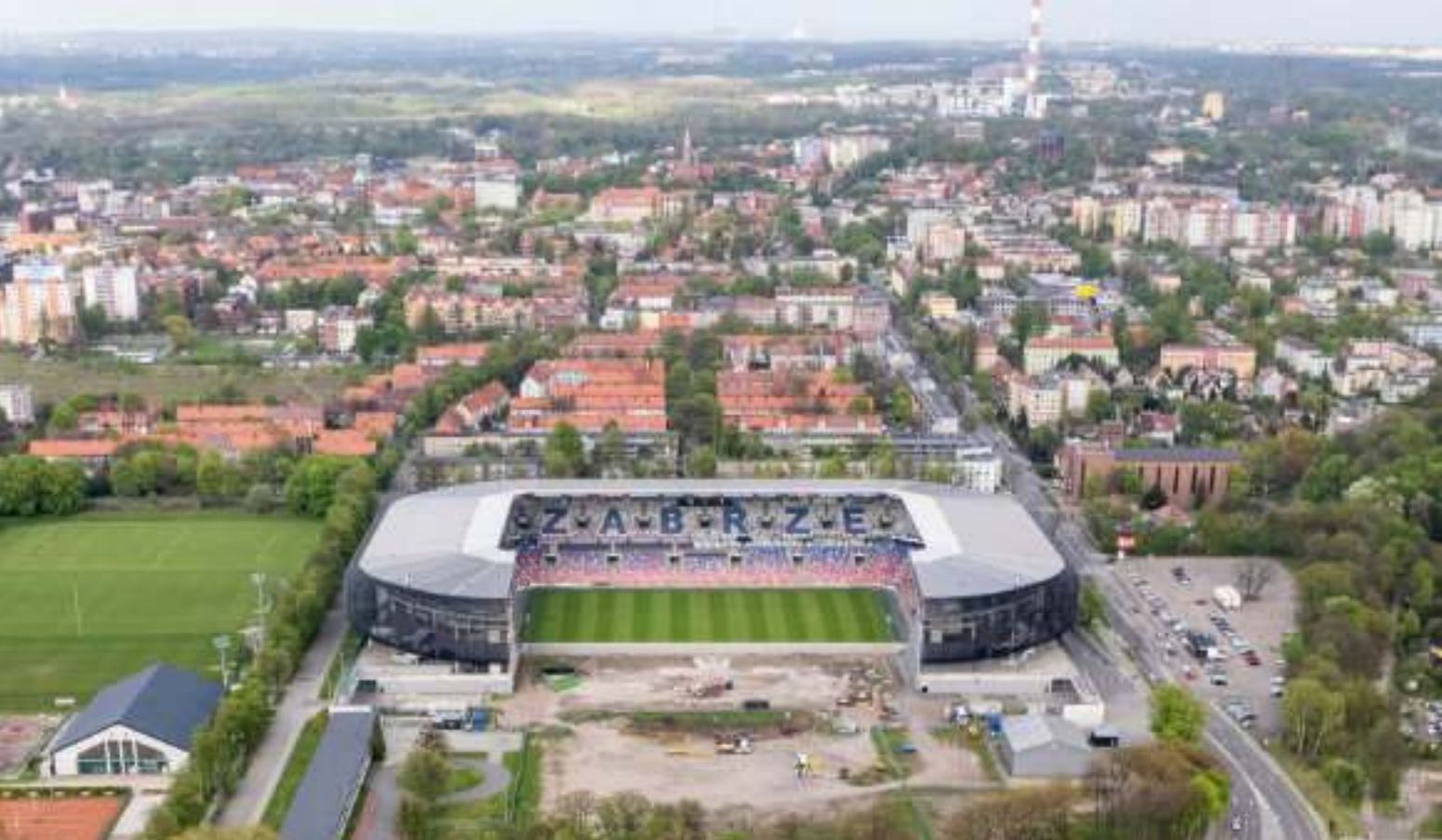
► W ostatnich tygodniach wyburzona została stara trybuna stadionu

PODPISANO UMOWĘ DOTYCZĄCĄ DOKOŃCZENIA BUDOWY STADIONU PRZY UL. R