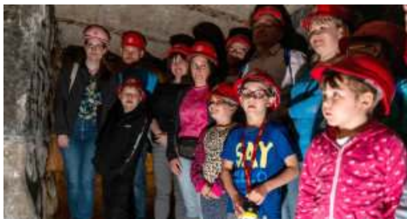
► Niezwykła podróż w podziemia

taki „Kosmiczna podróż Guliwera”. Organizatorzy zaprosili też na wystawę fotograficzną „Wytatuowani Śląskiem” oraz pokaz mody „Ach te lata minione”. GOR