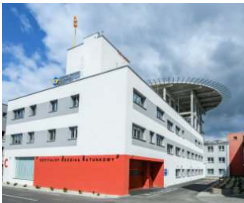
► Szpitalny Oddział Ratunkowy w Szpitalu Miejskim