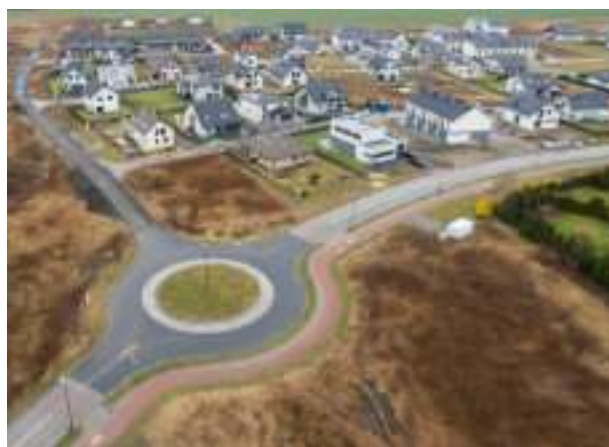
► Rozbudowa sieci dróg na osiedlu Słoneczna Dolina