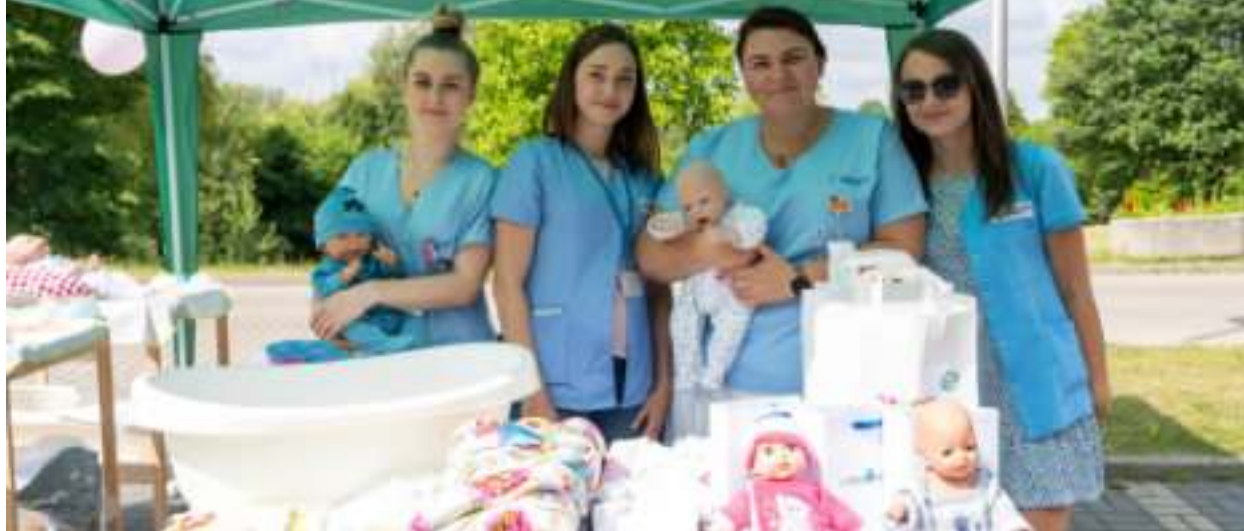
► Goście Dnia Otwartego mogli spotkać się z personelem szpitala i uzyskać odpowiedzi na nurtujące ich pytania