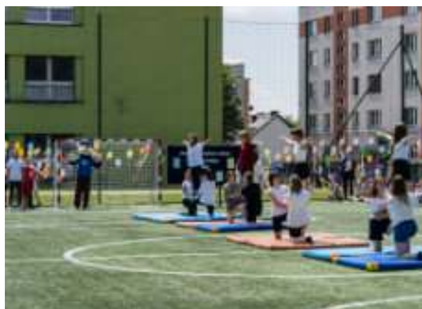
► Budowa boiska z bieżnią przy SP nr 14