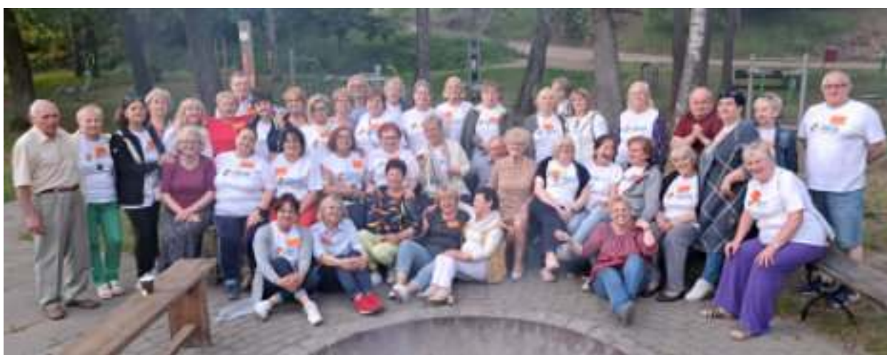
► Pamiątkowe zdjęcie uczestników wycieczki

Przez trzy dni gościła w Pile 30-osobowa grupa seniorów z Zabrze. Nasi mieszkańcy mieli okazję poznać lokalne atrakcje i wymienić się doświadczeniami z przyjaciółmi z północnej Polski.