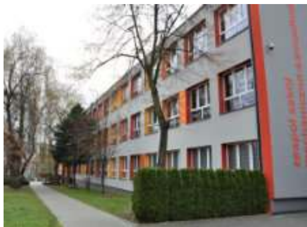
► Termomodernizacja kolejnych szkół i przedszkoli