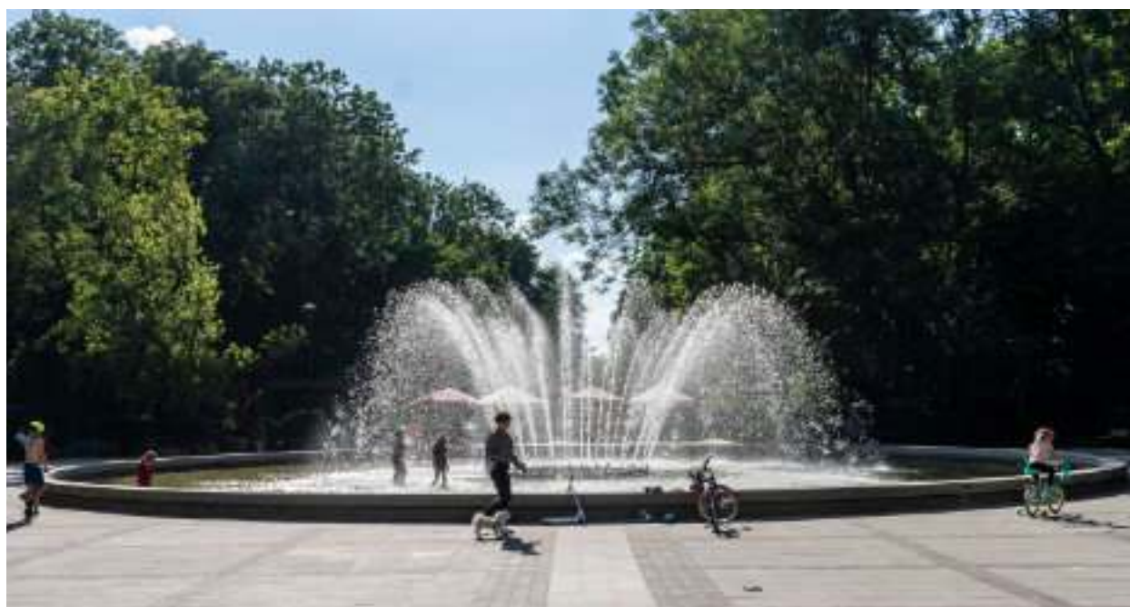
► Odtworzona na podstawie archiwalnych dokumentów fontanna w Parku Miejskim przy ul. Dubiela

Jeżeli mieszkańcy obdarzą mnie zaufaniem, to nadal zamierzam pracować dla Zabrza. Zaczynałam swoją pierwszą kadencję w sytuacji bardzo trudnej. Ogromne bezrobocie, brak inwestycji, pozamykane instytucje kultury, przemysł węglowy poddano procesowi