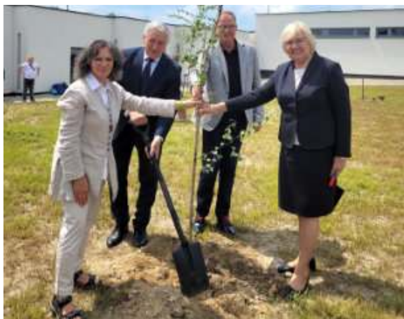
► Podczas uroczystego otwarcia zasadzono symboliczne drzewo

1,5 mln zł miasto dołożyło ze swojego budżetu