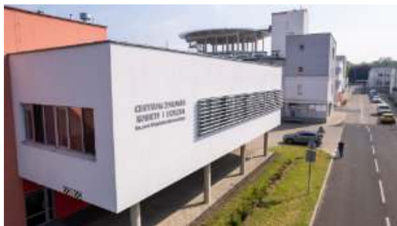
► Centrum Zdrowia Kobiety i Dziecka