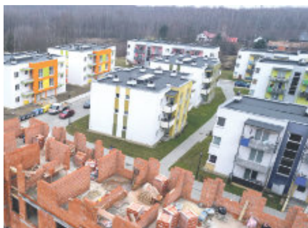
► Rozbudowa osiedla przy ul. Żywieckiej