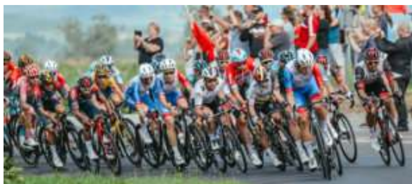
► Finałowy etap będzie miał 167 km długości