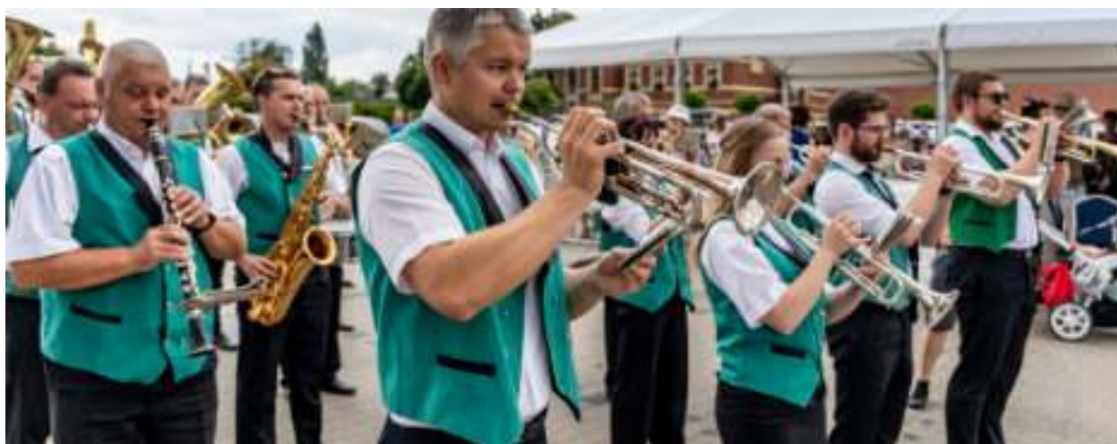
► Czerwcowy festiwal jest okazją do posłuchania górniczych orkiestr regionu

Barwny korowód, który wyruszył z placu Wolności w stronę Centrum Handlowego Platan, zainaugurował XVIII Zabrzeński Festiwal Orkiestr Dętych im. Edwarda E. Czernego. Muzycznej uczcie towarzyszyły pokazy tańca mażorettek „Pantera” z Młodzieżowego Domu Kultury w Gliwicach.