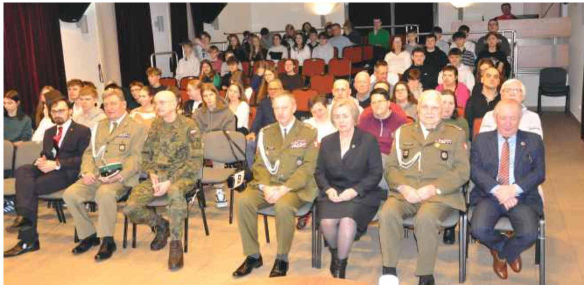
Relacja dźwiękowa: https://nowodworski.info/wyklenci-choc-niezlomni

KSIAZKI. Duchowa busola katolickiej rodziny