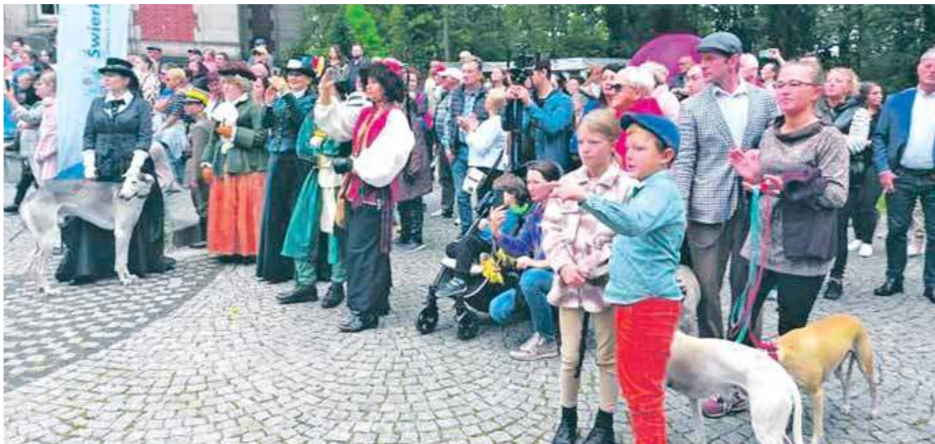
Hubertus organizowany jest w Świerklańcu od ćwierćwieku