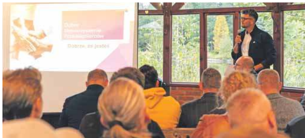
Zainteresowanie inicjatywą rośnie – jak podkreślają organizatorzy, frekwencja na kolejnych spotkaniach systematycznie się zwiększa

– Tylko 3 procent Polaków myśli dziś o otwarciu firmy, co w dłuższej perspektywie może mieć negatywne skut-