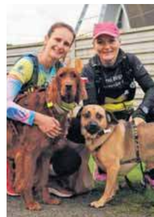
Dogtrekking to świetna forma aktywności z psem

My też wystartowaliśmy w biegu i świetnie się bawiliśmy. Trasa była dobrze przy-