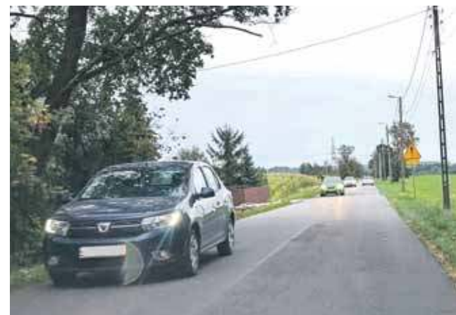
Mieszkańcy skarżą się na duży ruch

runków technicznych do ich montażu. Zabudowania znajdują się zbyt blisko drogi, a przepisy nie pozwalają w takim przypadku na ich