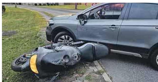
Pościg skończył się w Miedarach. Wjechał motorem w nieoznakowany radiowóz

W niedzielę wieczorem, 28 września, wywiadowcy patrolowali rejon Strzybnicy. Wtedy zauważyli motocyklistę. Mężczyzna był im znany – funkcjonariusze wiedzieli, że nie ma uprawnień do kierowania. Kiedy nakazali mu się zatrzymać, ten zaczął uciekać na swoim suzuki w stronę centrum Tarnowskich Gór.