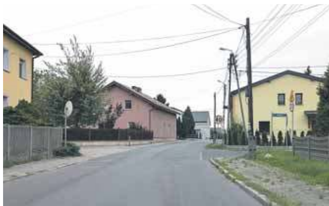
Zabudowa znajduje się zbyt blisko jezdni, by montować progi zwalniające – argumentuje zarządca

Jak wynika z odpowiedzi, wniosek o fotoradar powinien być poprzedzony analizami. Chodzi o wykazanie, czy montaż urządzenia ma uzasadnienie. Wniosek taki powinien złożyć albo Główny Inspektorat Transportu Drogowego, albo zarządca drogi – czyli w tym przypadku powiat. Czy samorząd to