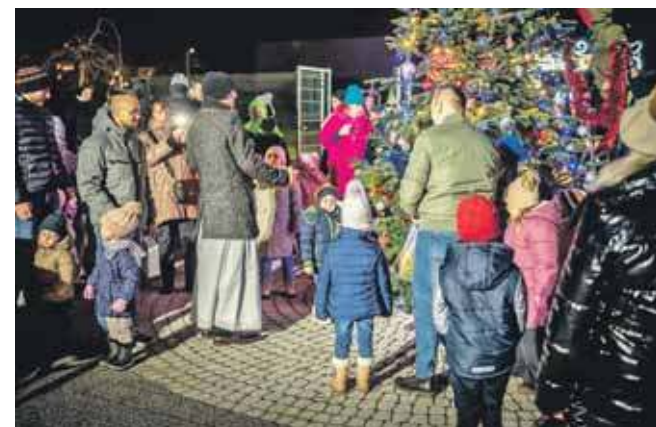
Z funduszu sołectwiego miało być finansowane m.in. strojenie choinki, ale jednym głosem propozycja przepadała