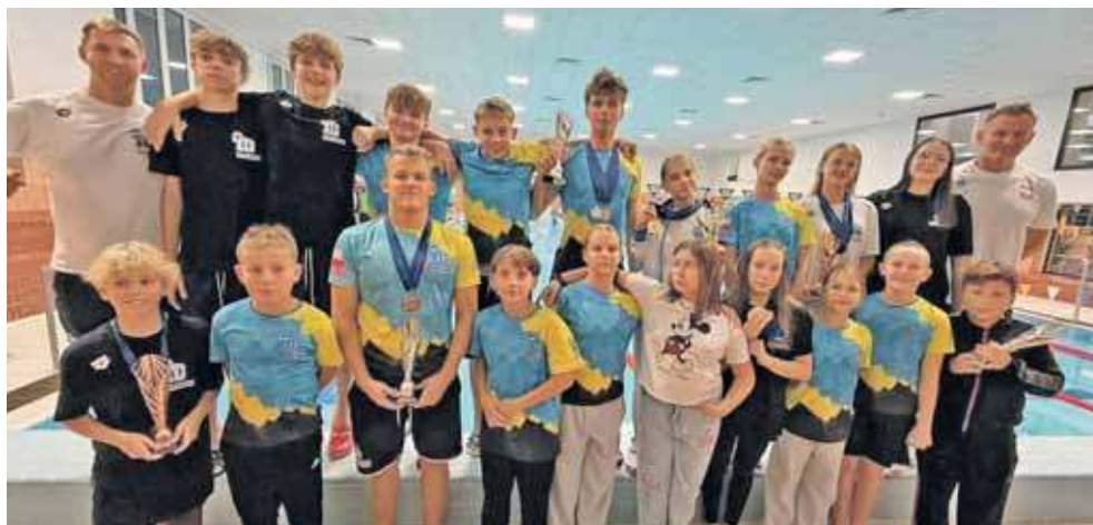
Zawodnicy MKS Park Wodny Tarnowskie Góry wrócili z międzynarodowych zawodów w Kopřivnicy z imponującym dorobkiem

Pucharowe wyróżnienia w klasyfikacji generalnej za najlepszy wynik otrzymali: