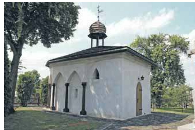
Zabytek został odrestaurowany zgodnie z arkanami sztuki. Niestety, złodzieje ukradli miedziane rynnny

I Tarnogórski Dogtrekking zorganizowało stowarzyszenie Okiem Wilka Team, a partnerami byli Stowarzyszenie Miłośników Ziemi Tarnogórskiej i urząd miejski w Tarnowskich Górach. (ESP)