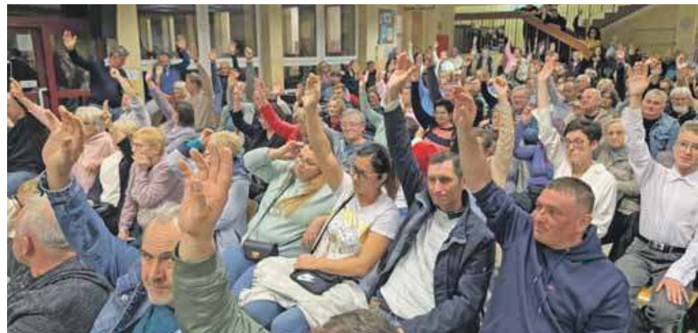
Mieszkańcy podczas zebrania wiejskiego zagłosowali przeciwko farmom fotowoltaicznym

konywała, że awantura jest przedwczesna, bo ostateczny kształt planu zależy od mieszkańców: – Dopiero teraz, podczas wyłożenia planu, mogę poznać wasze oczekiwania i preferencje. To jest projekt miejscowego planu zagospodarowania. Państwa uwagi, które można składać do 7 listopada, wskażą kierunek, w jakim sołectwo ma się rozwijać – mówiła. Z sali padło też pytanie: „Co pani prywatnie sądzi o farmach fotowoltaicznych?” – Prywatnie? One nie są mi do niczego potrzebne – odpowiedziała Zyga, za co otrzymała oklaski. – Nie widzę powodu, dla którego w gminie miałyby być kilkaset hektarów fotowoltaiki i kilkaset hektarów