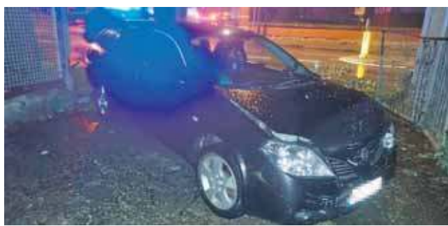
Świadek, chcąc pomóc kierowcy, podszedł do samochodu i wyczuł od mężczyzny woń alkoholu. Odebrał mu kluczyki i powiadomił policję

Za spowodowanie kolizji otrzymał mandat w wysokości 1000 zł i 10 punktów karnych. To jednak dopiero początek jego kłopotów. Mężczyzna odpowie przed sądem za jazdę w stanie nietrzeźwości. Grozi mu nie tylko wysoka kara, ale także przepadek samochodu. (EKA)