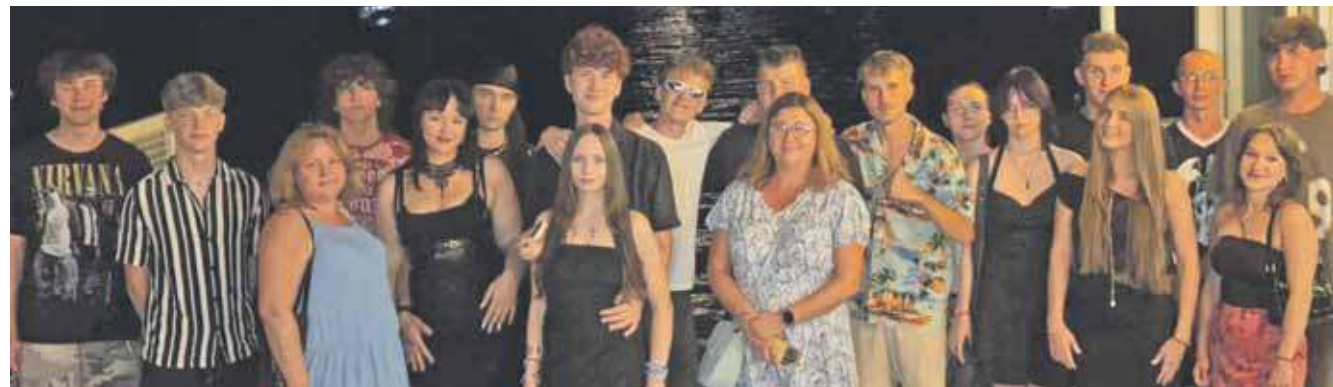
– Z jednej strony uczymy się fachu, z drugiej – tworzymy wspomnienia, które zostaną z nami na zawsze – mówi jedna z uczestniczek praktyk

Budowlanka z kolei zadbała o kompleksowe przygotowanie językowo-kulturowe