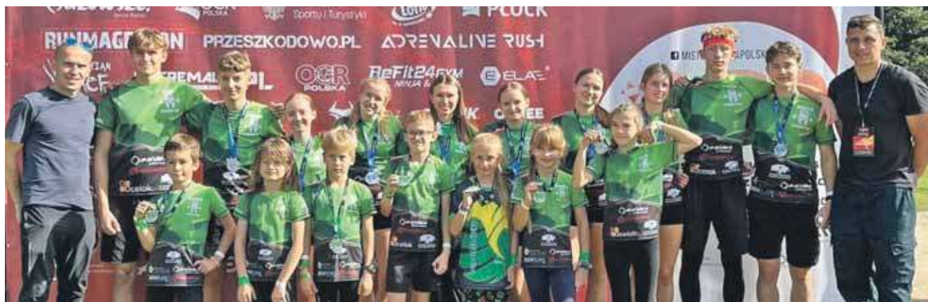
Spartan Team Kalety wywalczyli aż 15 medali podczas Mistrzostw Polski w biegach przeszkodowych 2025