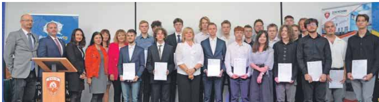
30 września uroczysto podsumowano praktyki zawodowe uczniów Mechanika w Hiszpanii

Na przełomie maja i czerwca 19 uczniów kształcących się w zawodach technik informatyk, technik programista i technik mechatronik odbyło miesięczne praktyki zawodowe w Granadzie w Hiszpanii. Wszystko było dla nich bezpłatne, dofi-