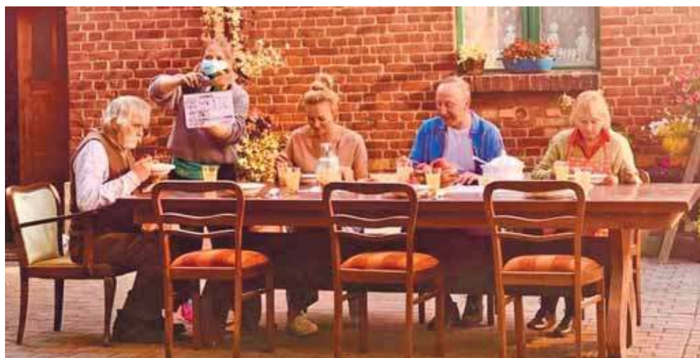
Jedna z filmowych scen kręcona przy ul. Wodnej w Piekarach Śląskich