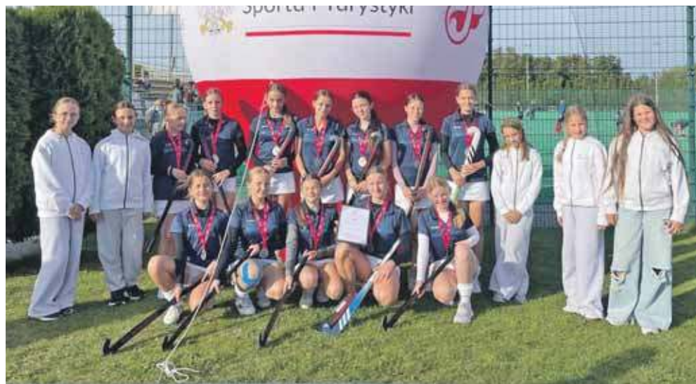
Drużyna LUKS Jedyńka Miasteczko Śląskie zdobyła srebrny medal Mistrzostw Polski Młodzików