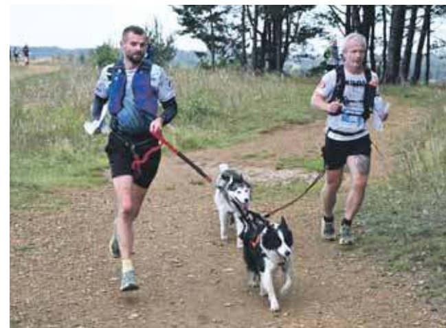
Trasa wiodła m.in. przez Hałdę Poptuczkową