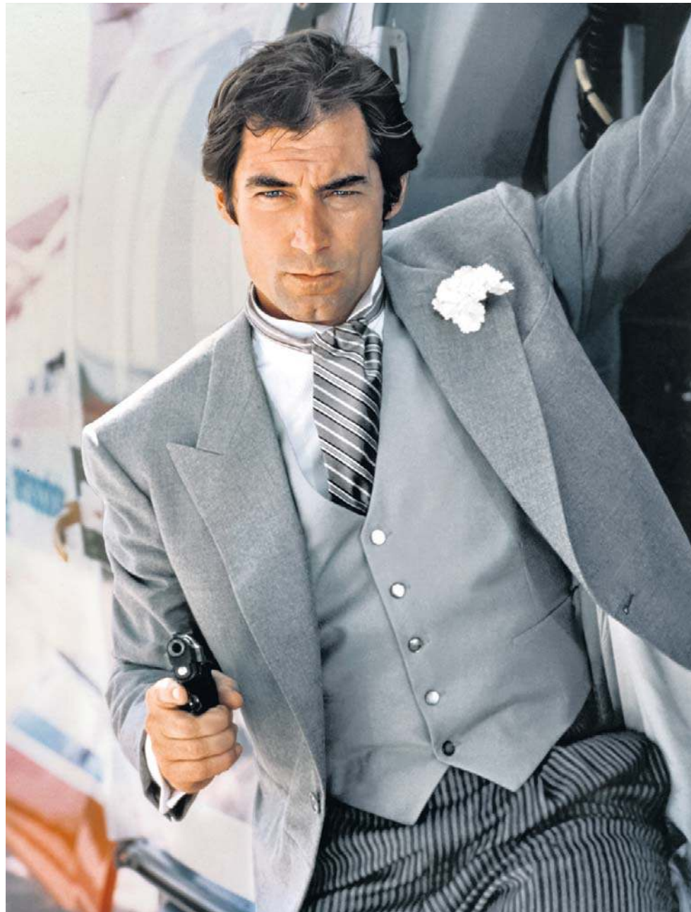
Timothy Dalton nie chciał grać Jamesa Bonda w latach 70. Począł ponad dekadę, wcześniej wcielając się w pana Rochesterą w serialu BBC „Jane Eyre”

Kariera Timothy'ego Daltona przed Bondem potoczyła się tak, że właściwie mało kto wiedział, jak naprawdę wygląda. Zadebiutował, mając dwadzieścia lat, a potem przez kolejne dwadzieścia grał role głównie w filmach historycznych czy kostiumowych. Ostatnio dużo mówiło się o „Wichrowych Wzgórzach” Emerald Fennell, a przecież