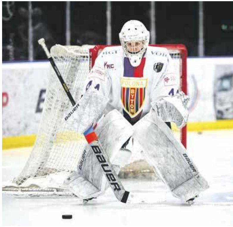
Od postawy bytomskich bramkarek wiele będzie zależało w najbliższych meczach

W środę, 18 lutego nasze zawodniczki zmierzą się z Atomówkami GKS Tychy. Pierwsze spotkanie rozegrane zostanie w Tychach o godz. 19. W sobotę, 21 lutego przyjdzie czas na rewanż w Bytomiu. Trzeba wygrać dwa spotkania, by wejść do finału. W drugim półfinale rywalizującą parę tworzą Stoczniovec Gdańsk oraz Kojotki Naprzód Janów. Zdaniem niemal wszystkich fachowców od żeńskiego hokeja bytomianki i janowianki z łatwością