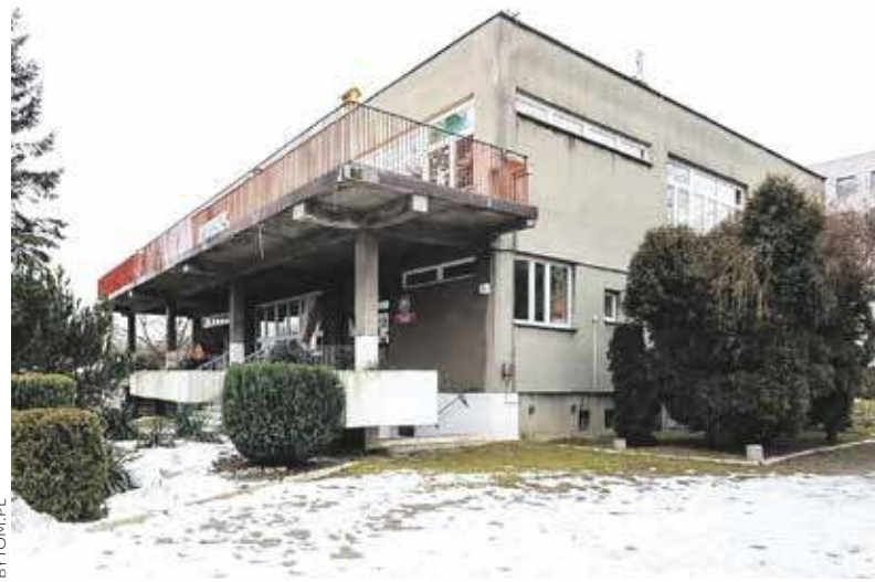
Miechowskie przedszkole zostanie zmodernizowane

MIECHOWICE. BUDYNEK PRZEDSZKOLA MIEJSKIEGO NR 44 PRZY ULICY REPTOWSKIEJ ZOSTANIE KOMPLEKSOWO OCIEPLONY. INWESTYCJA ZOSTAŁA DOFINANSOWANA ZE ŚRODKÓW UNIJNYCH.