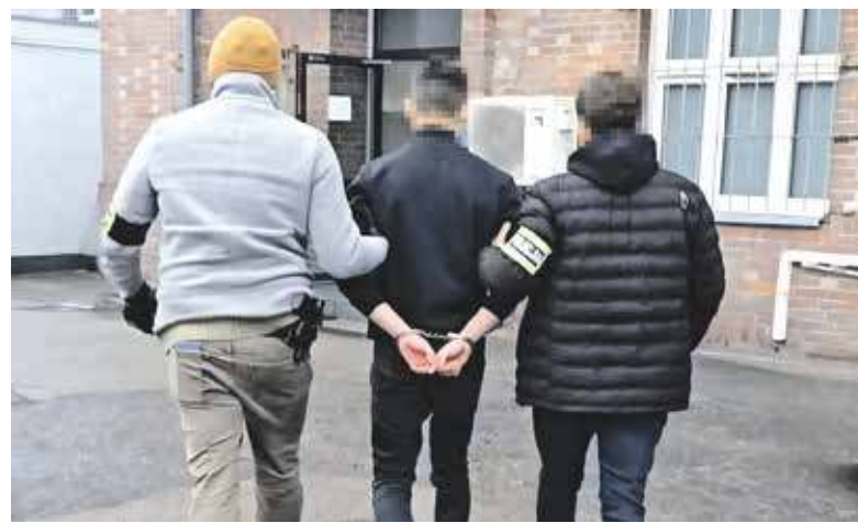
Młodzi bandyci szybko znaleźli się w rękach policji. Nie wiedzieć czemu nie trafili jednak do aresztu

Powiadomieni o tych bulwersujących zdarzeniach mundurowi z komi-