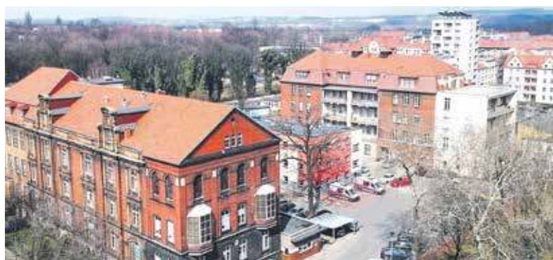
Miasto znowu musiało dosypać swojemu szpitalowi

Po raz kolejny władze Bytomia musiały szeroko zaczerpnąć z budżetu, by doraźnie poratować podległy gminie Szpital Specjalistyczny nr 1 przy ulicy Żeromskiego. Tym razem otrzymał on 3 miliony złotych. To pozwoli pokryć stratę netto za rok 2022. Niestety, tylko częściowo.