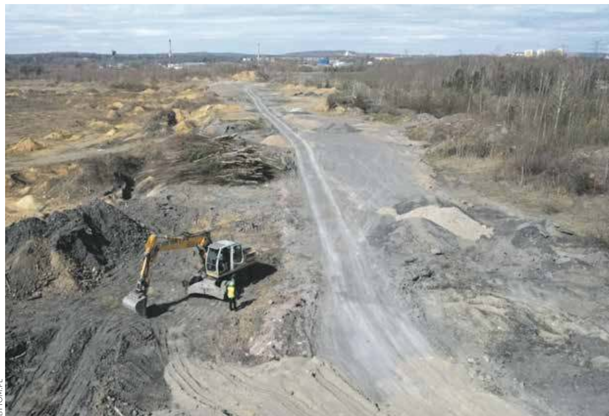
Na działkach przy ulicy Magdaleny nielegalnie składowano odpady

BYTOM. PO KILKU LATACH MOZOLNEGO I WYMAGAJĄCEGO PRZEPROWADZENIA SPECJALISTYCZNYCH BADAŃ ŚLEDZTWA KATOWICKA PROKURATURA OKRĘGOWA SKIEROWAŁA DO SĄDU AKT OSKARŻENIA PRZECIWKO BYŁEMU PREZESOWI BYTOMSKIEJ AGENCJI ROZWOJU INWESTYCJI. JEJ ZDANIEM MIAŁ OD DOPUŚCIĆ DO NIELEGALNEGO SKŁADOWANIA ODPADÓW PRZY ULICY MAGDALENY, CO STWORZYŁO ISTOTNE ZAGROŻENIE DLA ŚRODOWISKA NATURALNEGO.