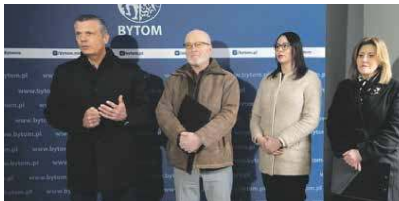
Konferencja odbyła się w lokalu użytkowym przy Piekarskiej

Owi przedsiębiorcy mają prowadzić we wspomnianych lokalach działalność gospodarczą. Wybór jest spory: od 20 do aż 90 mkw. Najemca musi wyremontować wydzierżawio-