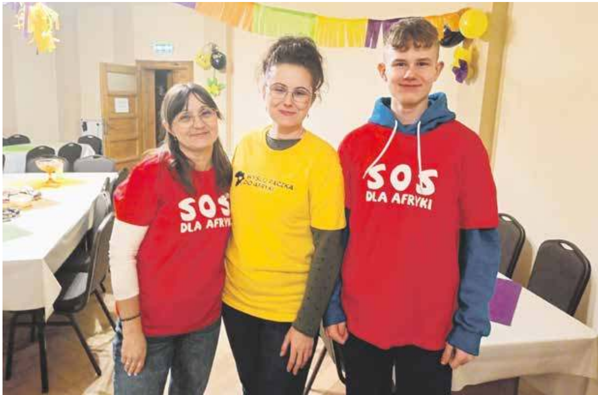
Zjedz pączka i równocześnie... zrób coś dobrego dla dzieci w Afryce