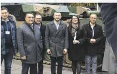
Wizyta w zakładach Bumar Łabędy