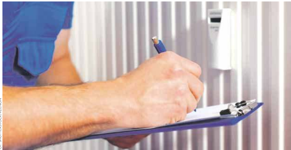
Według ekspertów, najważniejsze to utrzymać stałą temperaturę w pomieszczeniach, na przykład 19-20 stopni

BYTOM. ZIMA W TYM ROKU BYŁA... ZIMĄ. I OSTRZEGAMY - JESZCZE SIĘ NIE SKOŃCZYŁA. TO NA PEWNO ODBIJE SIĘ NA NASZYCH PORTFELACH. CZY JEST JESZCZE MOŻLIWOŚĆ, ABY ZAOSZCZĘDZIĆ?