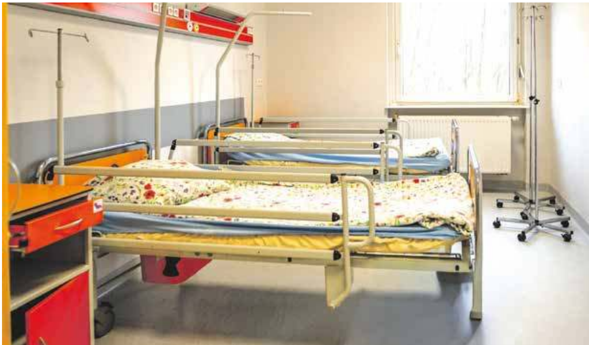
Oddział pediatrii w szpitalu na Batorego już jest wyremontowany

Modernizacja została podzielona na trzy etapy, realizowane na przestrzeni dwóch lat. Pierwszy, zrealizowany w 2023 roku, objął kompleksową modernizację czwartego pię-