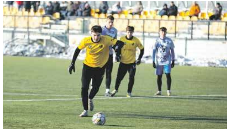
Cidry wygrały sparing i pozyskały nowych zawodników

Zima wróciła, ale piłkarze grać muszą. Jedni już o ligowe punkty, drudzy zaś wciąż sparingowo.