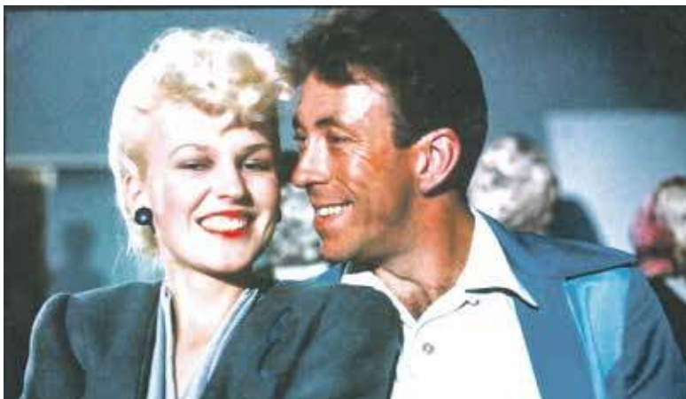
W australijskiej produkcji filmowej w duecie ze Steve'm Bisleyem znanym z filmu Mad Max