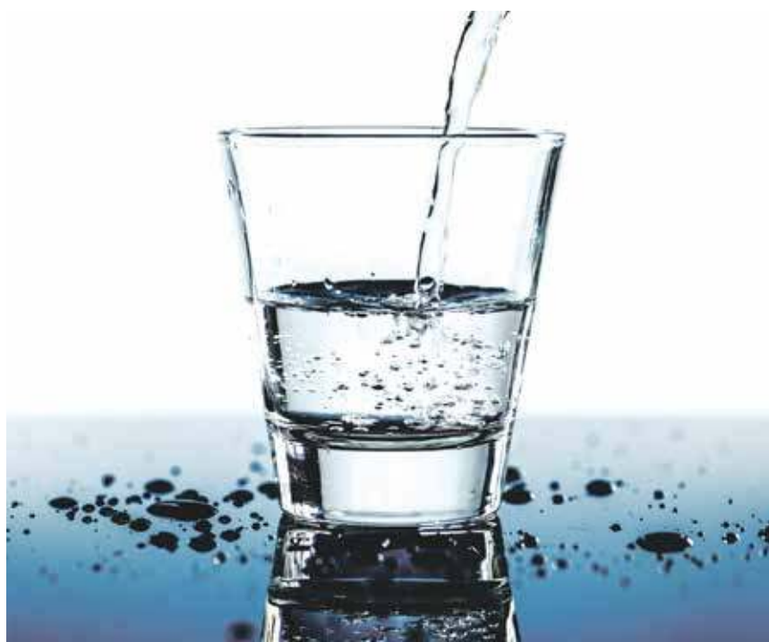
Nie sposób sobie wyobrazić spokojnego życia bez stałego dostępu do wody

Jakie są warunki wsparcia ze strony Funduszu? Dotacja do inwestycji w wysokości do 30 procent kosztów (samorządy), a do tego obowiązkowa pożyczka min. w wysokości dotacji. Możliwa jest też dotacja do 20 proc kosztów (spółki), a do tego obowiązkowa pożyczka min. w wyso-