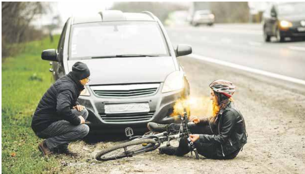
Miałeś wypadek w drodze do pracy? Skorzystaj z pomocy ZUS

Zasiłek chorobowy przysługujący po takim wypadku, także za okres pobytu