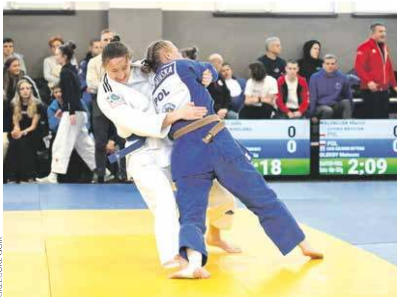
Zawody Pucharu Polski przyniosły naszym dżudokom 6 medali

Dwie ważne imprezy rozgrywano w ostatnim czasie w hali dżudo Czarnych Bytom przy ulicy Łużyckiej. Obydwie przyniosły temu klubowi wiele sukcesów.