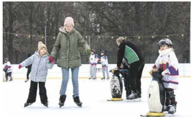
We Bytoniu bez zima na ślīdzziuchach pojeździecie we parku

Na pewno na ślīdzziuchach niy pojedzie ślimtok, bo by durś ślimtoł, a jak by się łobaloł na lód, to juz by