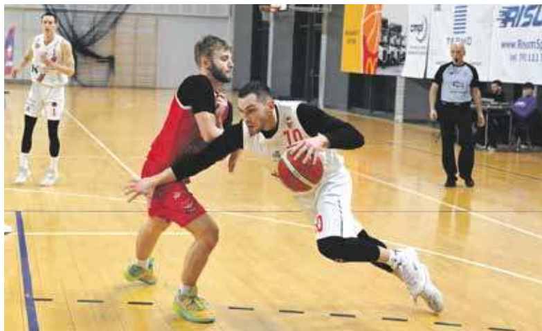
Zagłębie Sosnowiec nie zatrzymało Polonii

10 lutego w szombierskiej hali Na skarpie nasi roznieśli gliwiczanie. Taki wynik można było od początku przewidzieć, bo bytomianie są liderem tabeli, natomiast goście pałętają się na jej końcu, a do tego w składzie mają sporo dopiero rozpoczynających przygodę z koszykówką nastolatków.