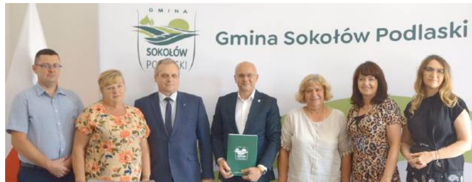
Podczas podpisania umów obecni byli również mieszkańcy