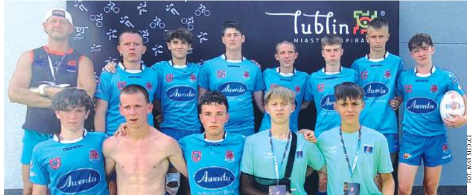
Kadeci Pogoni Siedlce w finałach Ogólnopolskiej Olimpiady Młodzieży zajęli szóste miejsce.