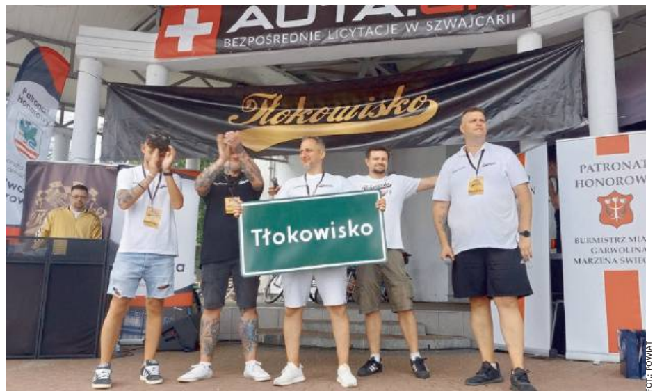
Co roku liczba uczestników bije rekord