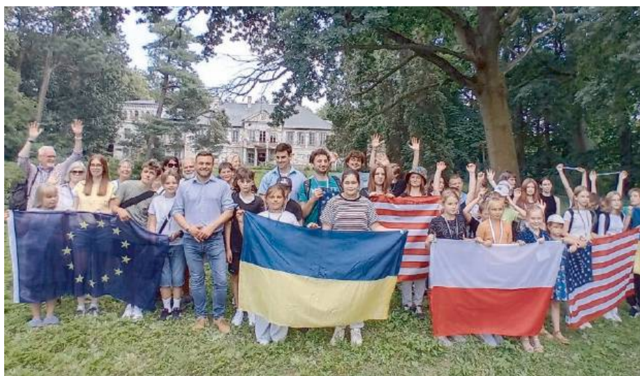
Specjalnie dla uczestników warsztatów otwarto bramy do parku w Mordach.