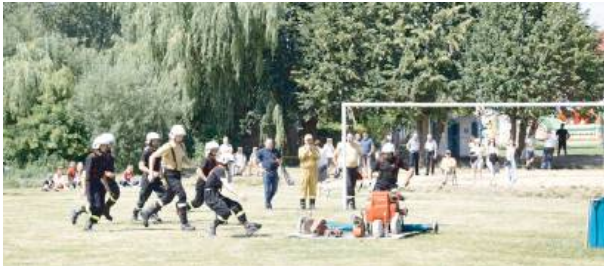
Niedawno rywalizowali w zawodach, a już niedługo dostaną pojazd

Wartość projektu wynosi 1,8 mln zł, a wysokość wkładu Funduszy Europejskich to 1,5 mln zł.