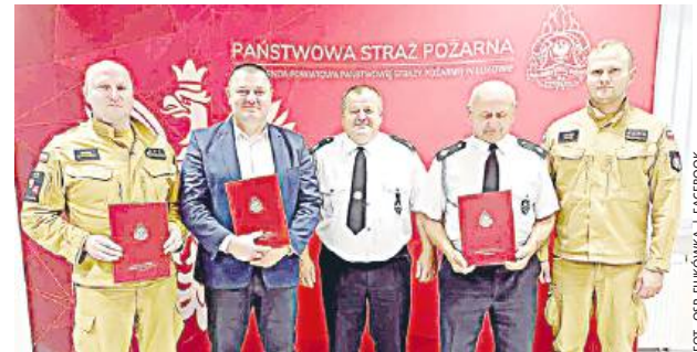
OSP Fiukówka dysponuje odpowiednim wyposażeniem i posiada określoną liczbę wyszkolonych druhów oraz systemu łączności powiadamiania i alarmowania. Dlatego jest w systemie KSRG.