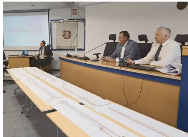
Urzednicy miejscy wysłuchali, jakie są potrzeby rowerzystów.

Włodarz zapowiedział również, że przewidziane są pewne fundusze m.in. od władz Mazowsza oraz marszałka województwa na realizację ścieżek rowerowych, dlatego miasto przystąpiło do opracowania wstępnych programów, które