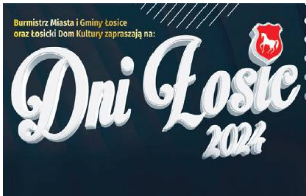
Tegoroczne Dni Łosic zapowiadają się ciekawie.

W sobotę, 20 lipca, impreza rozpocznie się od I Łosickiego Moto Pikniku. Od godziny 16:00 uczestnicy będą mogli podziwiać pokazy najlepszych pojazdów strefy klasyków, akcją ratowniczą OSP, a także skorzy-