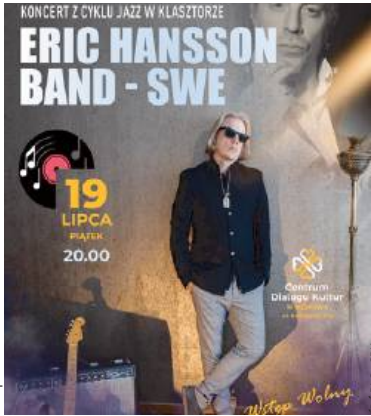
Z cyklu „Jazz w klasztorze”...

Wydarzenie zostało sfinansowane ze środków STOART - Związek Artystów Wykonawców