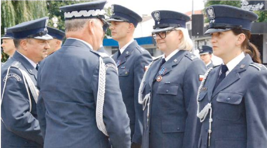
Funkcjonariusze otrzymali „Za zasługi dla więziennictwa” oraz awanse na wyższe stopnie zawodowe.

Funkcjonariusze służby więziennej otrzymali „Za zasługi dla więziennictwa” oraz awanse na wyższe stopnie zawodowe.