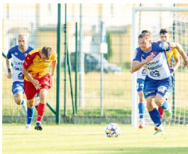
Pogoniści wygrali sparing na zakończenie przygotowań do 1 ligi.