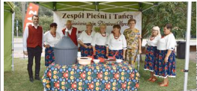
Drylowanie wiśni to punkt obowiązkowy festiwalu!