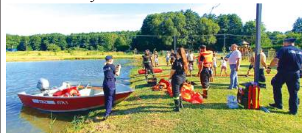
Warsztaty z bezpieczeństwa nad wodą w Platerowie.

W ramach Akcji Bezpieczne Wakacje, dzieci z gminy Platerów miały okazję 9 lipca dowiedzieć się w jaki sposób prawidłowo udzielać pierwszej pomocy. Omówiono postępowanie z osobą, która straciła przytomność oraz zaprezentowano jak wygląda pozycja boczna ustalona, umożliwiająca utrzymanie drożności dróg oddechowych. Ponadto we współpracy z Komendą Powiatową Policji oraz Ochotniczą Strażą Pożarną w Platerowie omówiono zasady bezpiecznego wypoczynku oraz zaprezentowano specjalistyczny sprzęt wykorzystywany w ratownictwie na obszarach wodnych.