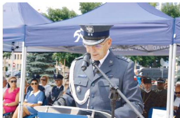
„Nasza służba wymaga nie tylko od nas specjalistycznej wiedzy...”

– Święto służby więziennej to szczególne święto bo i służba jest szczególna. Każdego dnia bez światelka w tunelu, bez błysku fleszy bronicie naszego bezpieczeństwa. Bezpieczeństwa mieszkańców, bo dzięki temu że jesteście w służbie więziennej przestępów nie chodzi po naszych drogach i ulicach. Wasza służba jest bardzo wymagająca, bo przecież każdego dnia każdego dnia borykacie się z trudnymi sytuacjami, ze stresem i trzeba zawsze szybko podejmować decyzje. Z tego miejsca chciałabym Wam bardzo podziękować. Podziękować za służbę i za to, że jesteście na straży bezpieczeństwa. Oczywiście często zapominamy o tych ze służby więziennej. Nie dostrzegamy Was tak bardzo jak powinniśmy. Życzę Wam abyście czuli każdego dnia, że mieszkańcy Mazowsza doceniają to co robicie. (...) Drodzy funkcjonariusze służby więziennej gratuluję Wam odznaczeń, awansu i życzę Wam abyście zawsze wiedzieli jak wiele jest ludzi, że dostrzegają waszą rolę