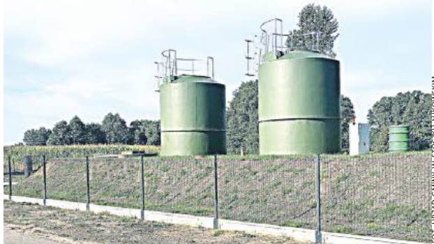
Pierwszy etap inwestycji kosztował ponad 4,5 mln zł.