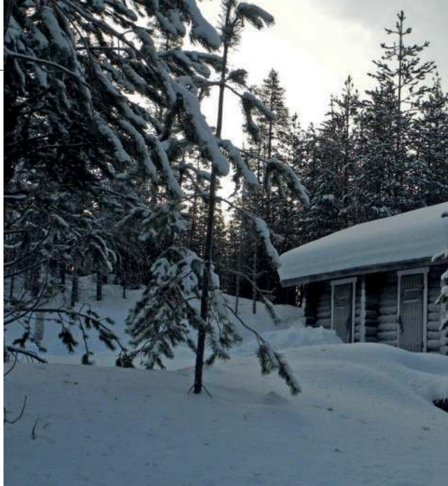
Podczas nocy polarnej dzień trwa ledwo kilka godzin. A światło jest jakby zza mgłą.

– Ludzie naoglądają się wprawdzie zdjęć zorzy w internecie i potem są zdziwieni – uśmiecha się szeroko mój rozmówca. – Pamiętamy bowiem, że to, co widać na zdjęciach, to efekt bardzo długiego czasu naświetlania. Trwającego często ponad jedną minutę. Tak powstałe zdjęcie musi siłą rzeczy odbiegać od tego, co my widzimy gołym okiem na żywo. Sama bowiem zorza to coś ruchomego. Można ją porównać do takiej delikatnej poświaty, która mieni się na niebie. Wygląda to oczywiście bardzo pięknie, ale nigdy tak, jak na tych sławnych zdjęciach.