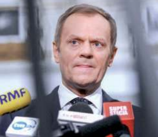
Neodziennikarze Tuska awansują / 54

Raport Państwowej komisji ds. badania wpływ rosyjskich... / 4