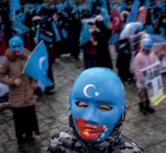
UE czerpie korzyści z przymusowej pracy w Chinach / 70