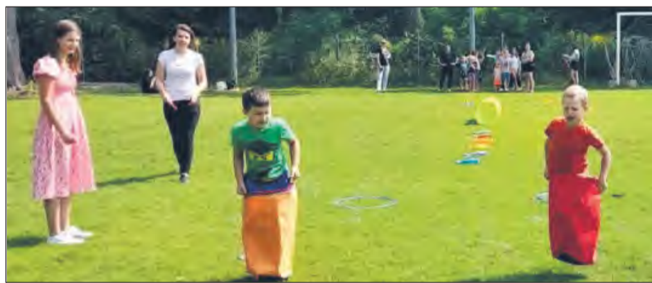
Rozrywka z elementami rywalizacji spodobała się maluchom w Rososzy. Na zdjęciu konkurs skakania w workach