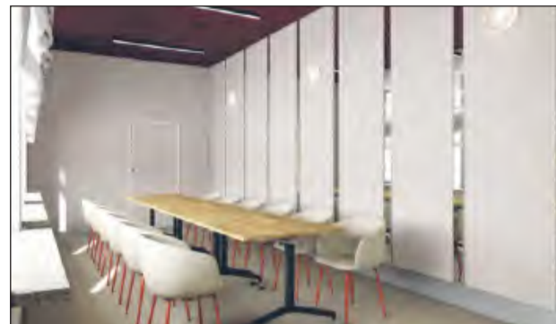
✚ Sala konferencyjna

Całość zadania ma zamknąć się kwotą 9,7 mln zł. Gmina otrzymała środki zewnętrzne w ramach programu rewitalizacji obszarów zdegradowanych - dotacja z funduszy europejskich wyniosła 8,2 mln zł, a budżet państwa dołożył niemal milion złotych. Brakujące środki pochodzą z budżetu gminy. Zgodnie z harmonogramem, miasto ma czas na realizację zadań do końca przyszłego roku.