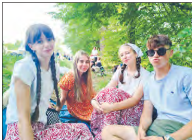
➤ Pielgrzymka to przede wszystkim ogromny wysiłek, dlatego tak ważne są odpoczynki na trasie