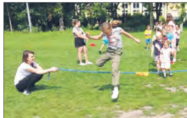
Jedną z atrakcji na pikniku w Rososzy było przeskakowanie ponad liną. Zadanie tylko z pozoru należało do łatwych. Za każdym razem sznur znajdował się coraz wyżej

Dyrektor OPS potwierdza, że plany na kontynuację