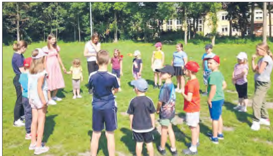
Na początku pikniku, opiekunki z „Kuzni Uśmiechu” zapraszały wszystkie dzieci do zabawy w kole. Była to okazja do zapoznania się i wstępnej integracji. Na zdjęciu najmłodszy mieszkający Rososzy w towarzystwie pedagogów z placówki wsparcia