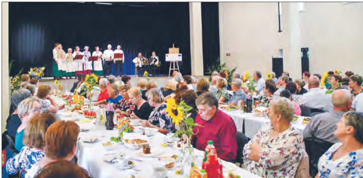
➤ Łącznie wsparciem zostanie objętych 90 mieszkańców gminy Ułęż (75 kobiet i 15 mężczyzn), którzy ukończyli 60 lat. Projekt potrwa do końca czerwca 2027 roku

nowano szereg bezpłatnych zajęć. Seniorzy będą mogli uczestniczyć w treningach radzenia sobie ze stresem, warsztatach z gospodaro-