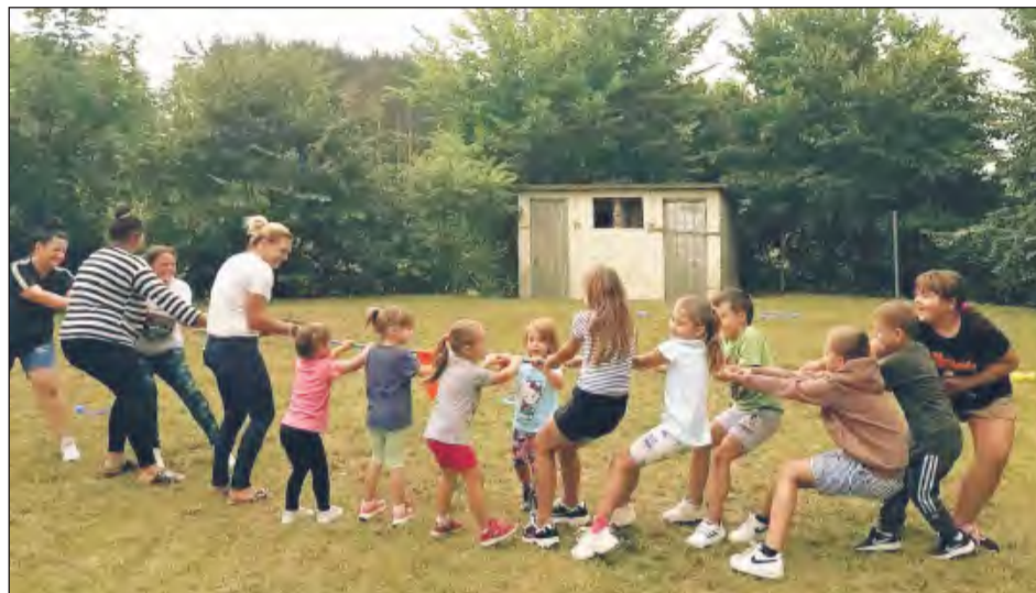
Która drużyna okaże się silniejsza? Wystarczyło kilka chwil i kropli potu, by wszystko stało się jasne. Na zdjęciu uczestnicy pikniku w Swatach podczas jednej z zabaw

Gry, konkursy, malowanie twarzy i zabawy na świeżym powietrzu – tak wyglądały plenerowe spotkania dla rodzin, które w ostatnich dniach zorganizował Ośrodek Pomocy Społecznej w Rykach