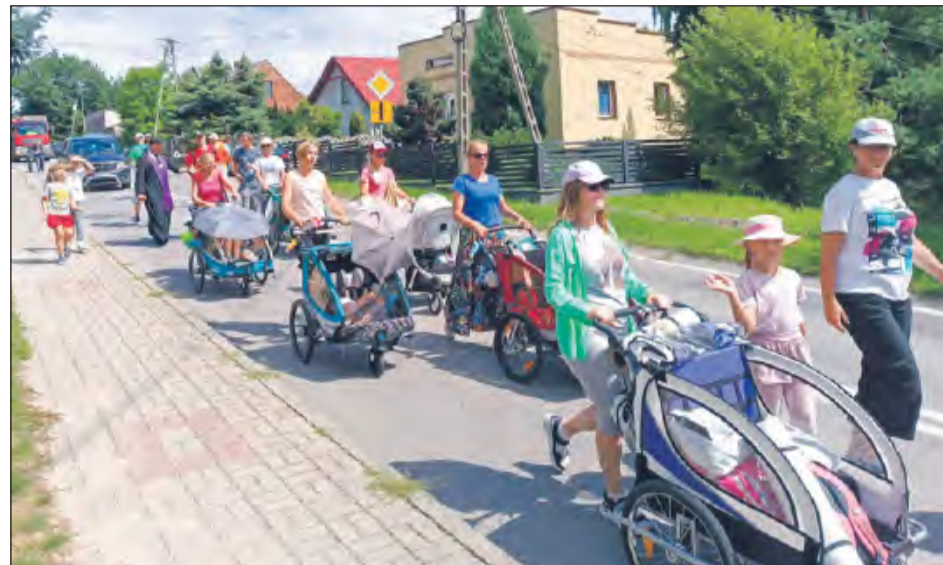
➤ Jak co roku, na pątnicznym szlaku spotkać można całe pokolenia. Wiele osób pielgrzymuje rodzinnie, dając świadectwo wiary swoim dzieciom