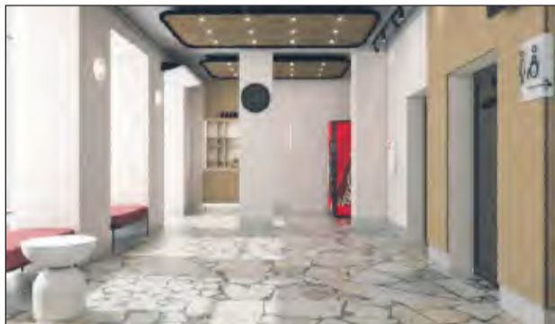
✚ Tak ma wyglądać kino Renesans w Rykach po modernizacji: Hol

Swoje oblicze zmieni kino „Renesans” i park miejski na Jarmołówce, a dzieci i młodzież otrzymają długo wyczekiwany skatepark. Do końca przyszłego roku w Rykach zostaną przeprowadzone trzy duże prospołeczne inwestycje