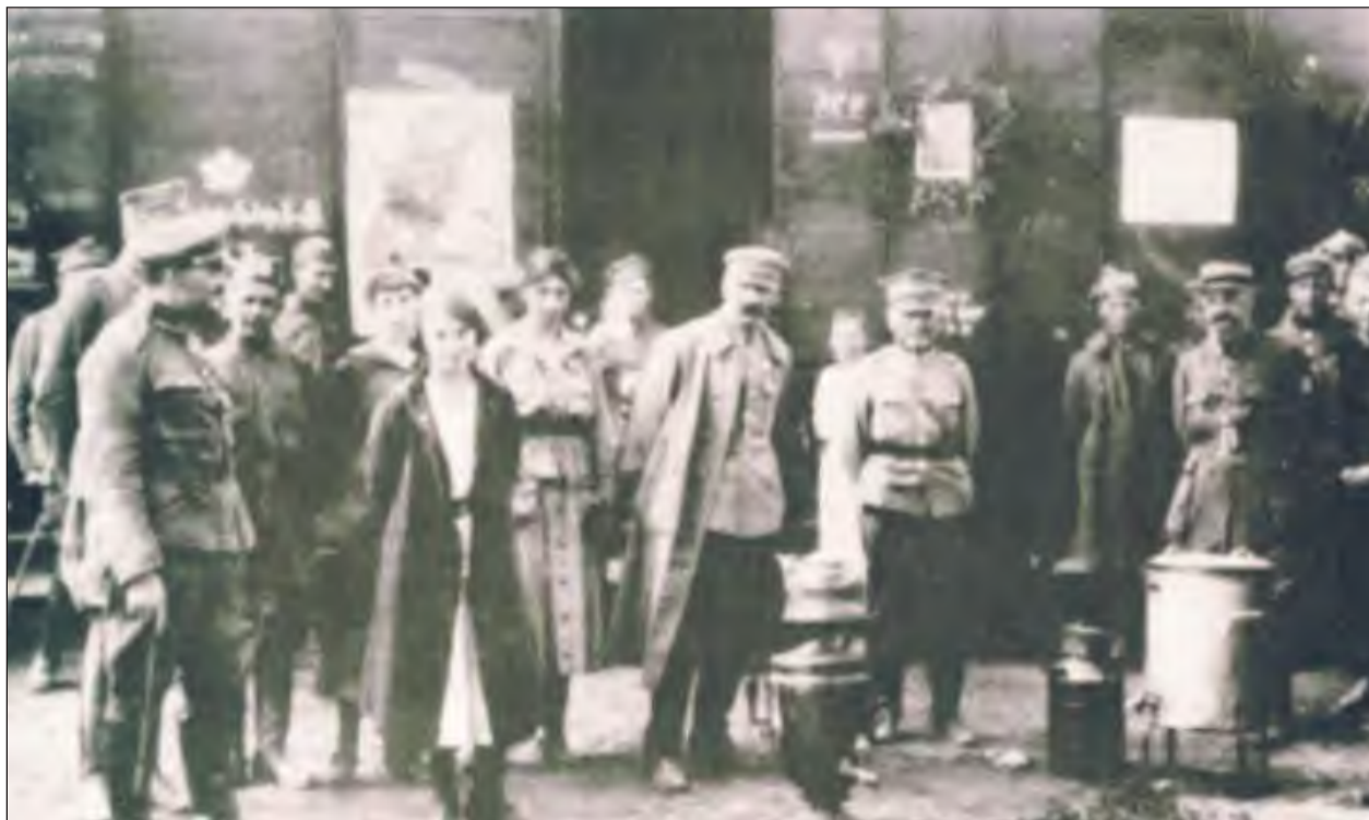
Podczas jednego z pobytów w Dęblinie, Józef Piłsudski został sfotografowany wraz z gen. Leonardem Skierskim i żołnierzami na stacji kolejowej

Wyznaczone miejsca żołnierze zajęli w nocy z 12 na 13 sierpnia, mając za sobą ponad stukilometry marszu. Do kontrnatarcia została wytypowana 4 Armia dowodzona przez gen. dyw. Leonarda Skierskiego. W jej skład wchodziło pięć dywizji, m.in. dobrze wy-