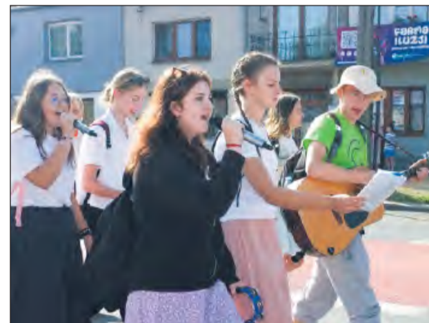
➤ Dzięki sekcji muzycznej pielgrzymom idzie się zdecydowanie łatwiej