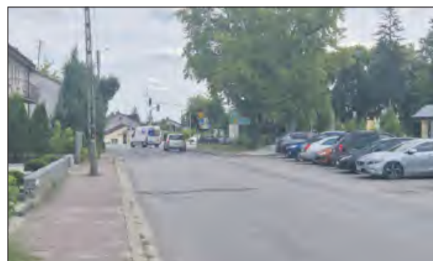
➤ Pierwszy etap modernizacji ulicy Swatowskiej w Rykach ma kosztować 13 mln zł.

Samorządy z terenu powiatu ryckiego planują duże inwestycje drogowe. Gminy Ryki, Nowodwór, Ułęż, Kłoczew oraz starostwo powiatowe przygotowują wnioski o dofinansowanie na łączną kwotę ponad 45 milionów złotych