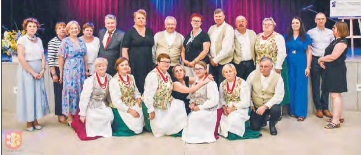
➤ O część artystyczną zadbał zaproszony do Ułęży zespół „Czerniczanki z Kapelą”