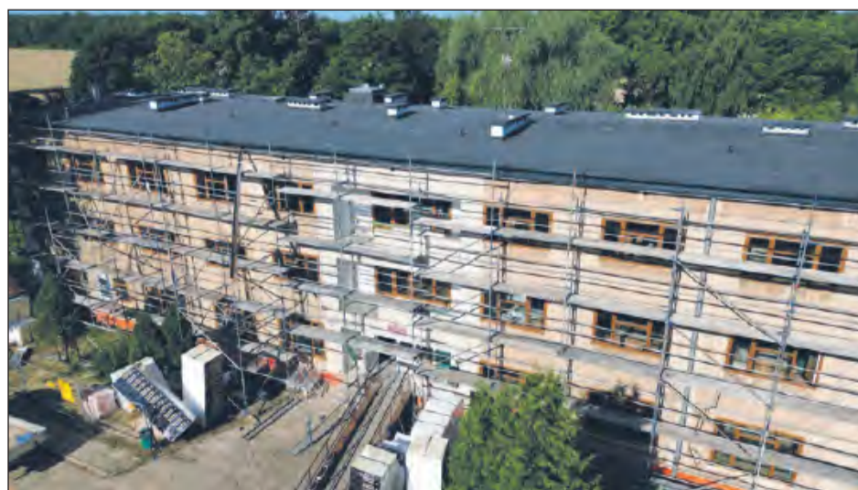
➤ W Zespole Szkół im. Hrabiego Kajetana Kickiego w Sobieszynie-Brzozowej gruntowną modernizację przechodzi internat

W Zespole Szkół Zawodowych nr 2 im. Marii Dąbrowskiej w Dęblinie realizowane są dwa duże zadania. Pierwsze z nich to termomodernizacja warsztatów szkolnych i montaż odnawialnych źródeł energii. - Zamontowano już pompy ciepła oraz nowoczesny