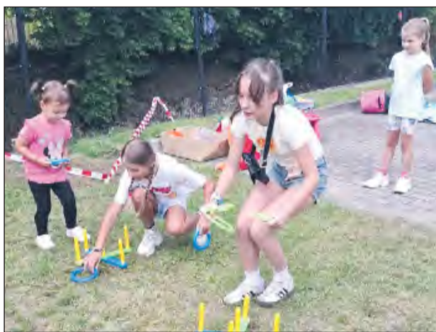
W niektórych zabawach trzeba było wykazać się sprawnością i logicznym myśleniem. Między innymi w ten sposób piknik upływał dzieciom ze Swat

Gry, konkursy, malowanie twarzy i zabawy na świeżym powietrzu – tak wyglądały plenerowe spotkania dla rodzin, które w ostatnich dniach zorganizował Ośrodek Pomocy Społecznej w Rykach