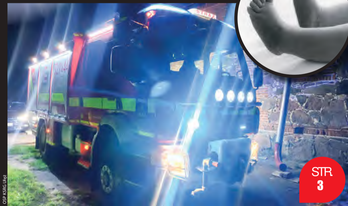
OSP KSRC Ułęż

Płócienna torba z ciałem nowo narodzonego dziecka leżała w budynku starej chlewni na terenie byłej Spółdzielni Rolniczej w Ułężu. Policja zatrzymała w tej sprawie 31-letnią kobietę