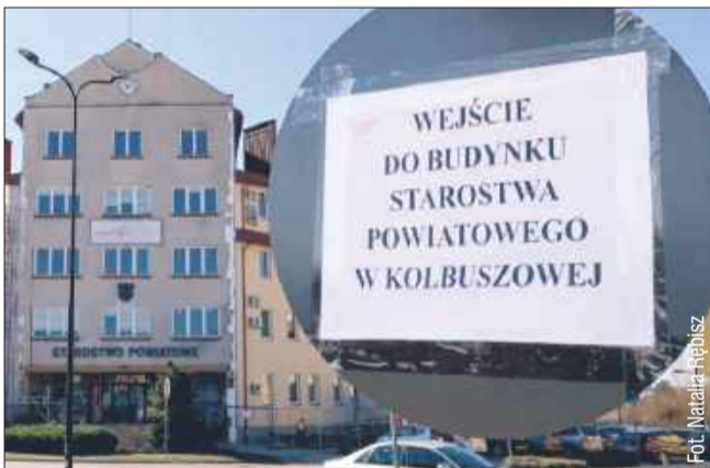
W Starostwie Powiatowym w Kolbuszowej trwa remont.

W Kolbuszowej trwa kompleksowy remont budynku starostwa powiatowego. Prace mają na celu nie tylko poprawę estetyki, ale przede wszystkim zwiększenie energooszczędności obiektu. Dzięki wsparciu z funduszy zewnętrznych w wysokości 95% modernizacja stała się możliwa.