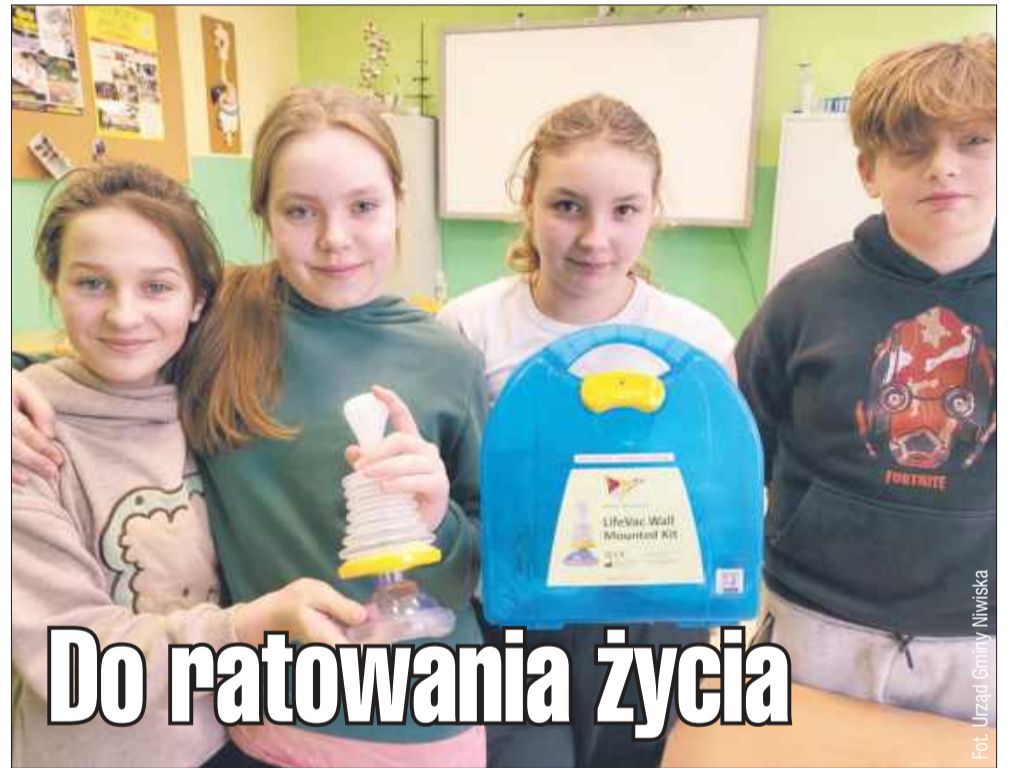
Uczniowie dowiedzieli się, jak w razie potrzeby prawidłowo używać urządzenia.

W szkołach na terenie gminy Niwiska pojawiły się urządzenia, które mogą uratować życie w sytuacjach zagrożenia zdrowia uczniów. LifeVac pozwala skutecznie pomóc w przypadku zadławienia.