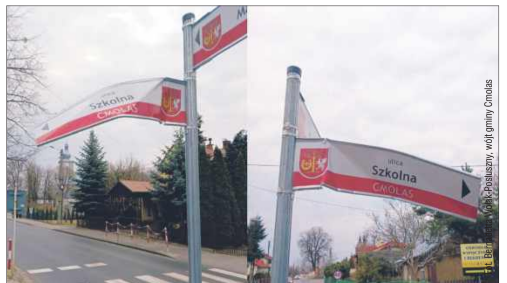
Osoba, która zniszczyła tablice w Cmolasie, przyznała się do winy i poniesie konsekwencje.

Wydarzenie miało swoje szczęśliwe zakończenie, bowiem sprawca uszkodzenia tablicy zgłosił się do urzędu, przyznając się do błędu. Jak informuje wójt,