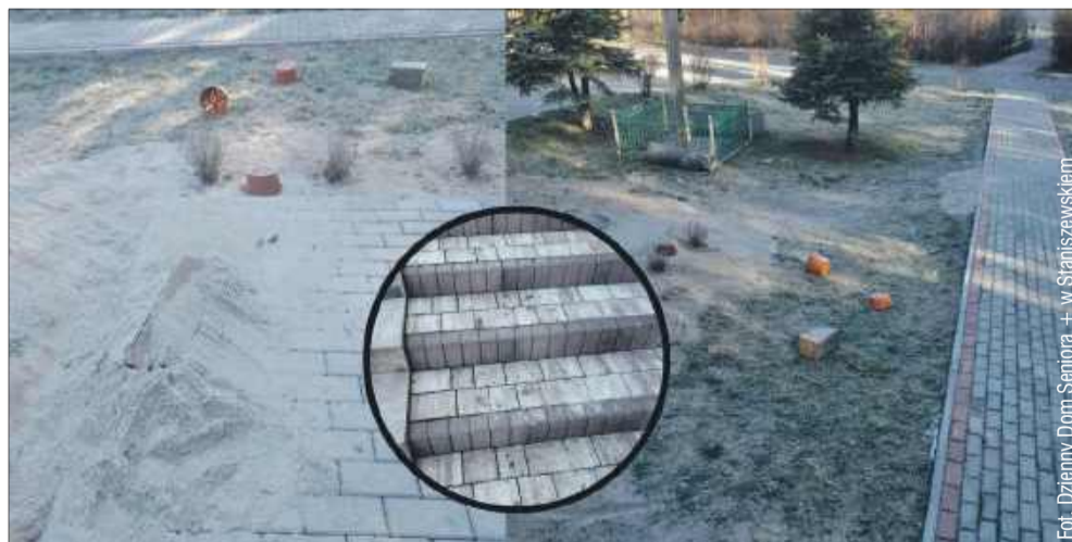
Grupka chłopców zrobiła sobie z placu obok budynku DDS+ miejsce spotkań i dziwnych zabaw.

Niepokojące sygnały dochodzą z Dziennego Domu Seniora w Staniszewskim, działającego na terenie gminy Raniżów. Placówka opublikowała na swoim profilu społecznościowym apel, w którym alarmuje o powtarzających się aktach wandalizmu.