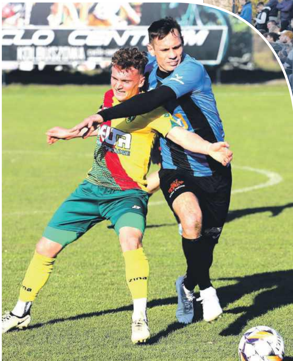
Sokół nie dał się pokonać i doprowadził do remisu.