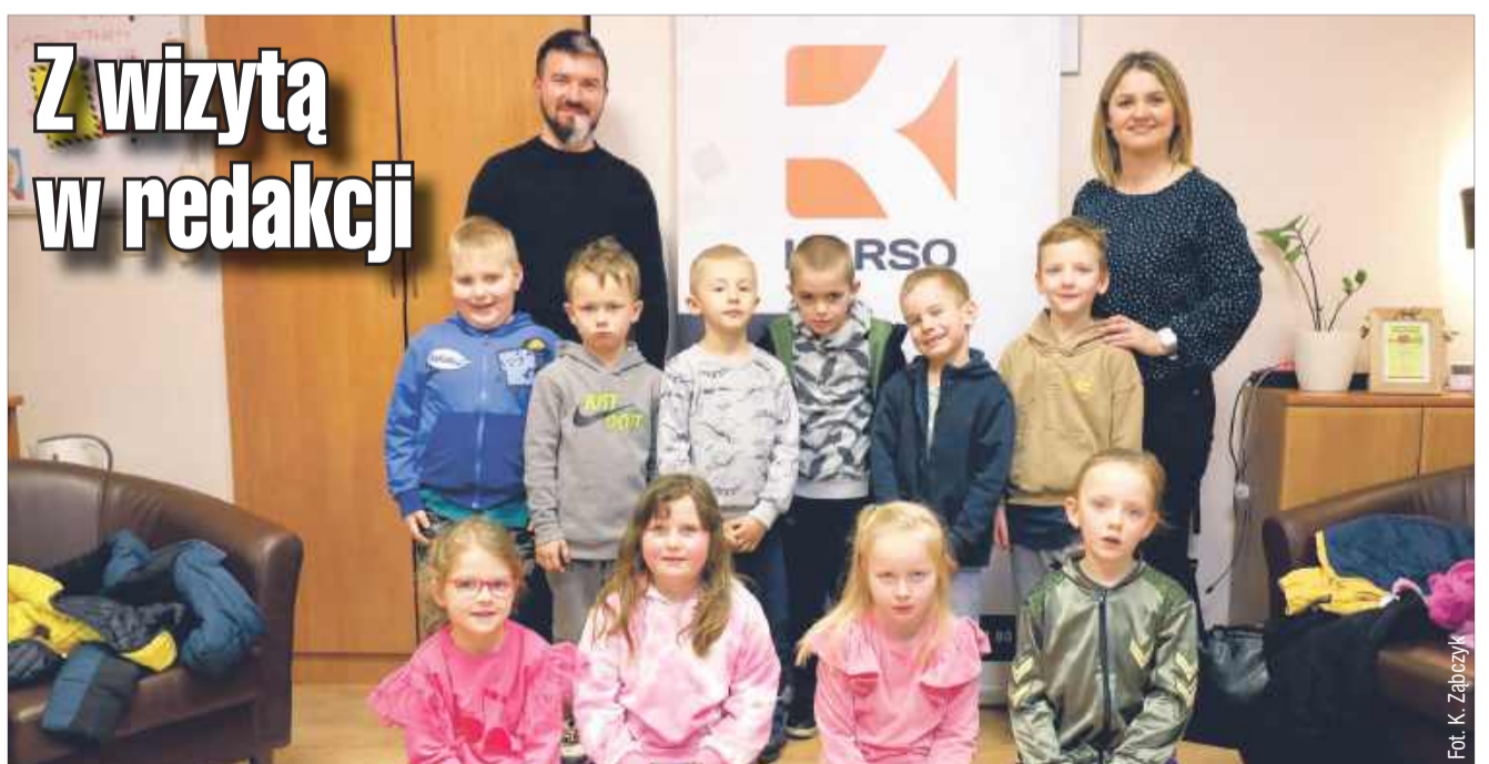
Takie wizyty lubimy! Kilka dni temu odwiedzili nas zerówkowicze ze Szkoły Podstawowej nr 1 w Kolbuszowej. Mieliśmy okazję opowiedzieć najmłodszym, jak wygląda praca dziennikarza i jak powstaje gazeta.