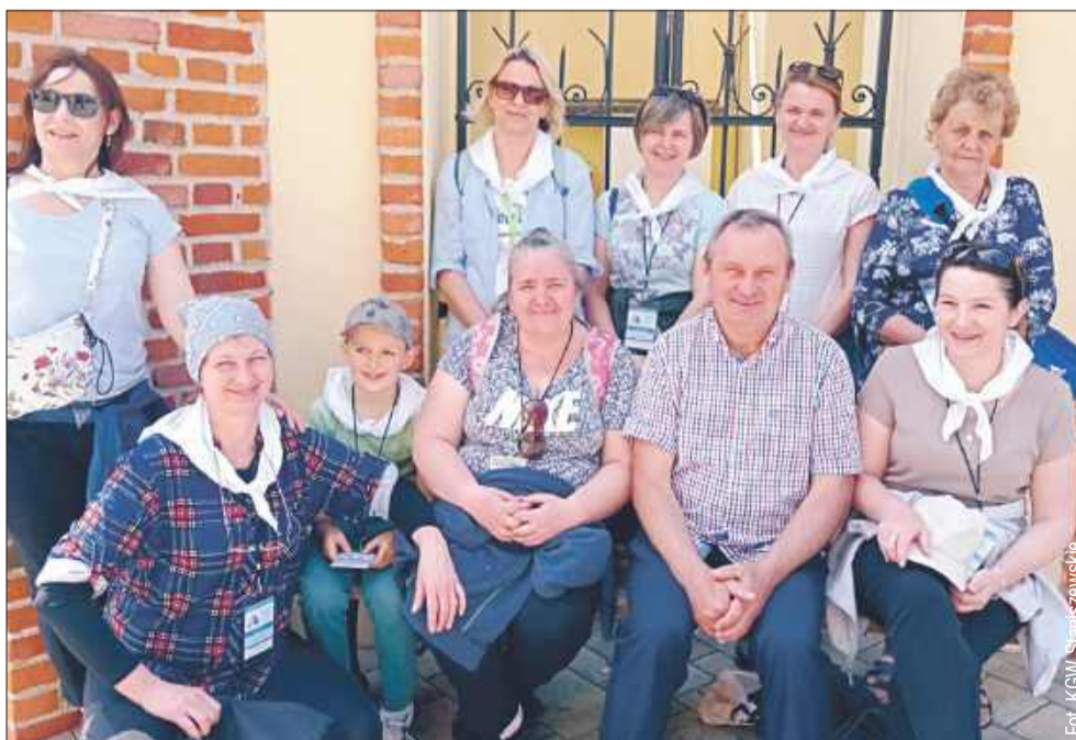
Koło Gospodyń Wiejskich ze Stanisławskiego prężnie działa i cały czas się rozwija.