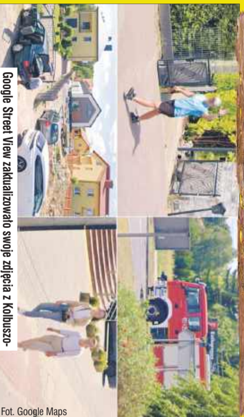
Google Street View zaktualizowało swoje zdjęcia z Kolbuszowej, ukazując najnowsze ujęcia z lipca 2024 roku.