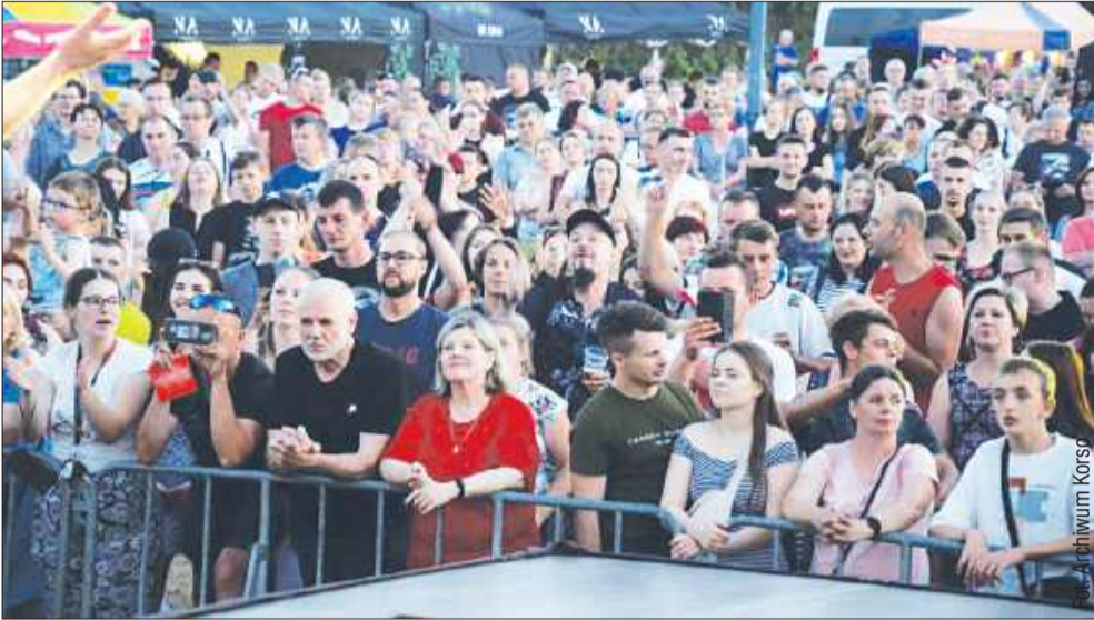
Co roku Święto Miasta przyciąga tłumy mieszkańców i przyjezdnych. Z pewnością tak będzie i w tym roku.

Lato 2025 w Kolbuszowej zapowiada się niezwykle gorąco – i to nie tylko za sprawą temperatury. Mieszkańców czeka prawdziwa uczta muzyczna i kulturalna, która rozciągnie się