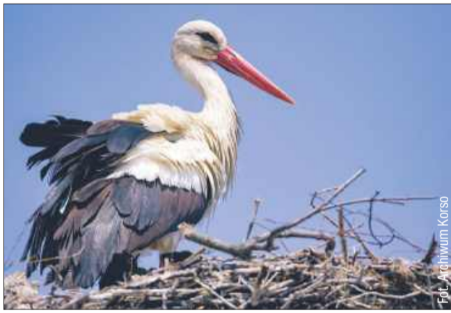
Pierwsze bociany powróciły już do swoich gniazd.

Bociany wracają z dalekiej podróży. Niektóre z nich pokonują nawet ponad 10 tysięcy kilometrów, przylatując do nas z południowej Afryki. Ich droga wiedzie przez pustynie, morza i góry. Na trasie napotykają wiele zagrożeń, od niesprzyjającej pogody, przez