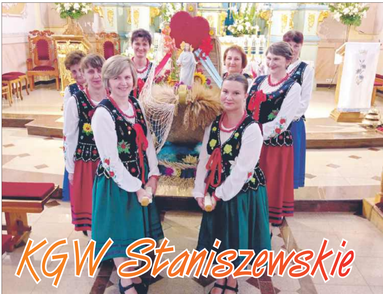
KGW angażuje się w przeróżne wydarzenia, które odbywają się w gminie Raniszów i nie tylko.