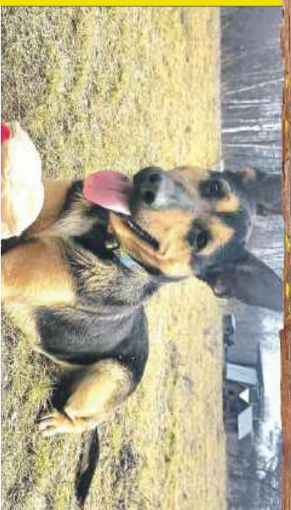
Gacek. Młody piesek w typie owczarka niemieckiego krótkowłosego o charakterze stróża i najlżejszego przyjaciele rodziny. Umiebla spacer i towarzyszywo człowieka. Jest bardzo grzeczny. Przebywa w przytulisku w Nowej Dębie. Tel. 572 269 777.