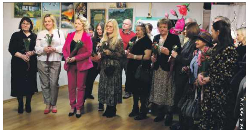
Artyści zaprezentowali swoje amatorskie, lecz piękne i wyjątkowe prace.