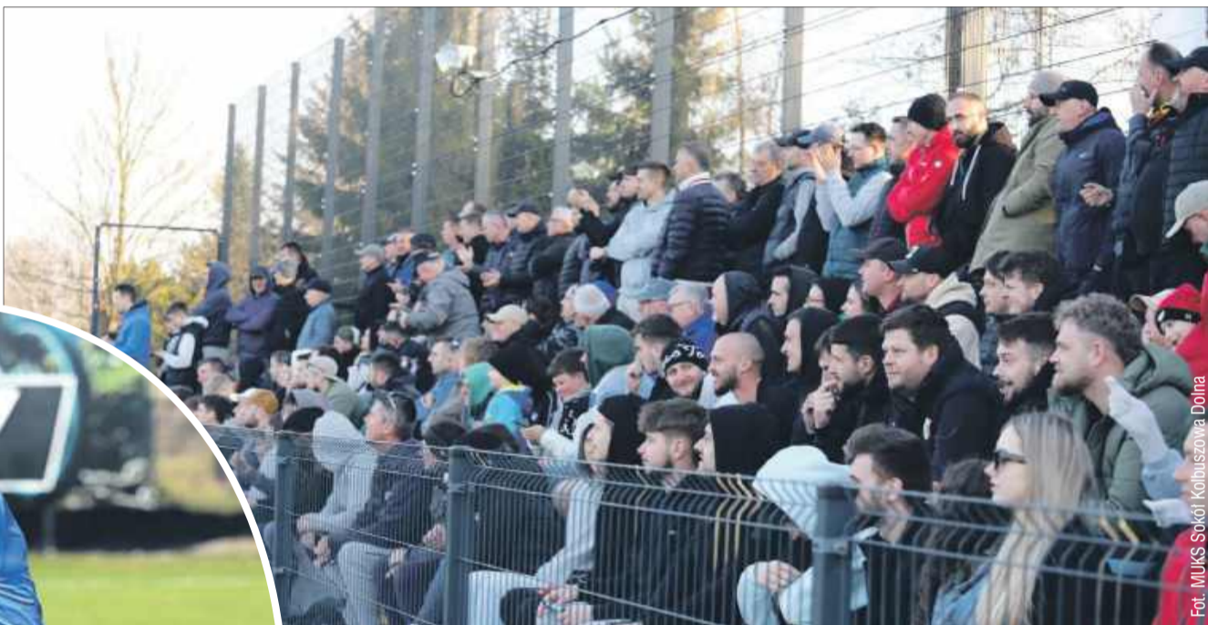
Zmagania zawodników z dużym zapalem śledziło wielu kibiców.

Teraz Sokół Kolbuszowa Dolna będzie musiał skoncentrować się na kolejnych wyzwaniach, ale jeśli będzie walczył w takim stylu, nie ma wątpliwości, że czeka go jeszcze wiele sukcesów w tym sezonie. bp