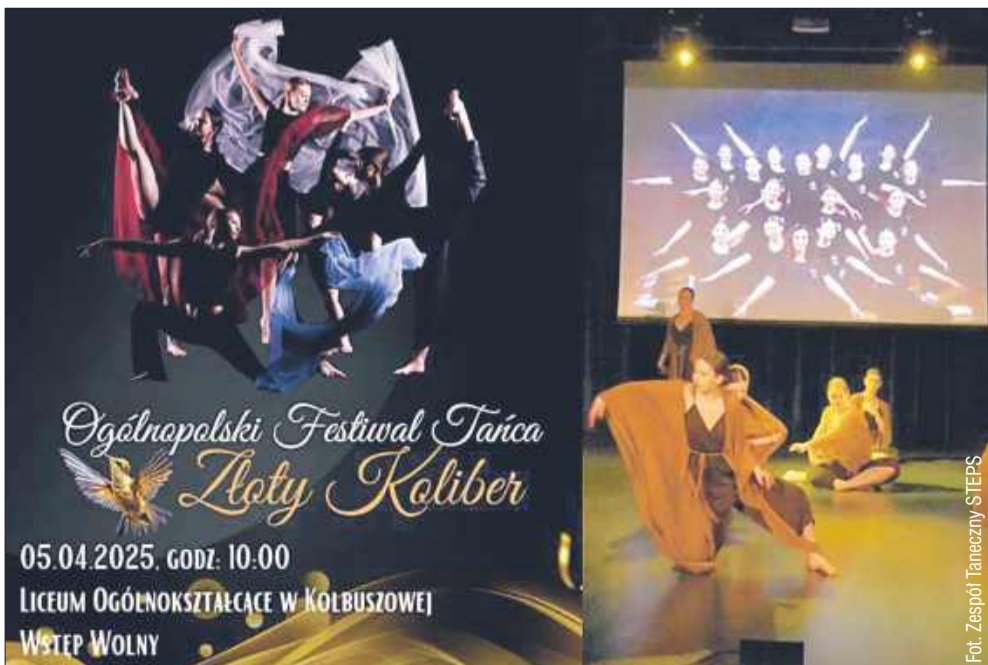
W Kolbuszowej odbędzie się Pierwszy Ogólnopolski Festiwal Tańca „Złoty Koliber”.