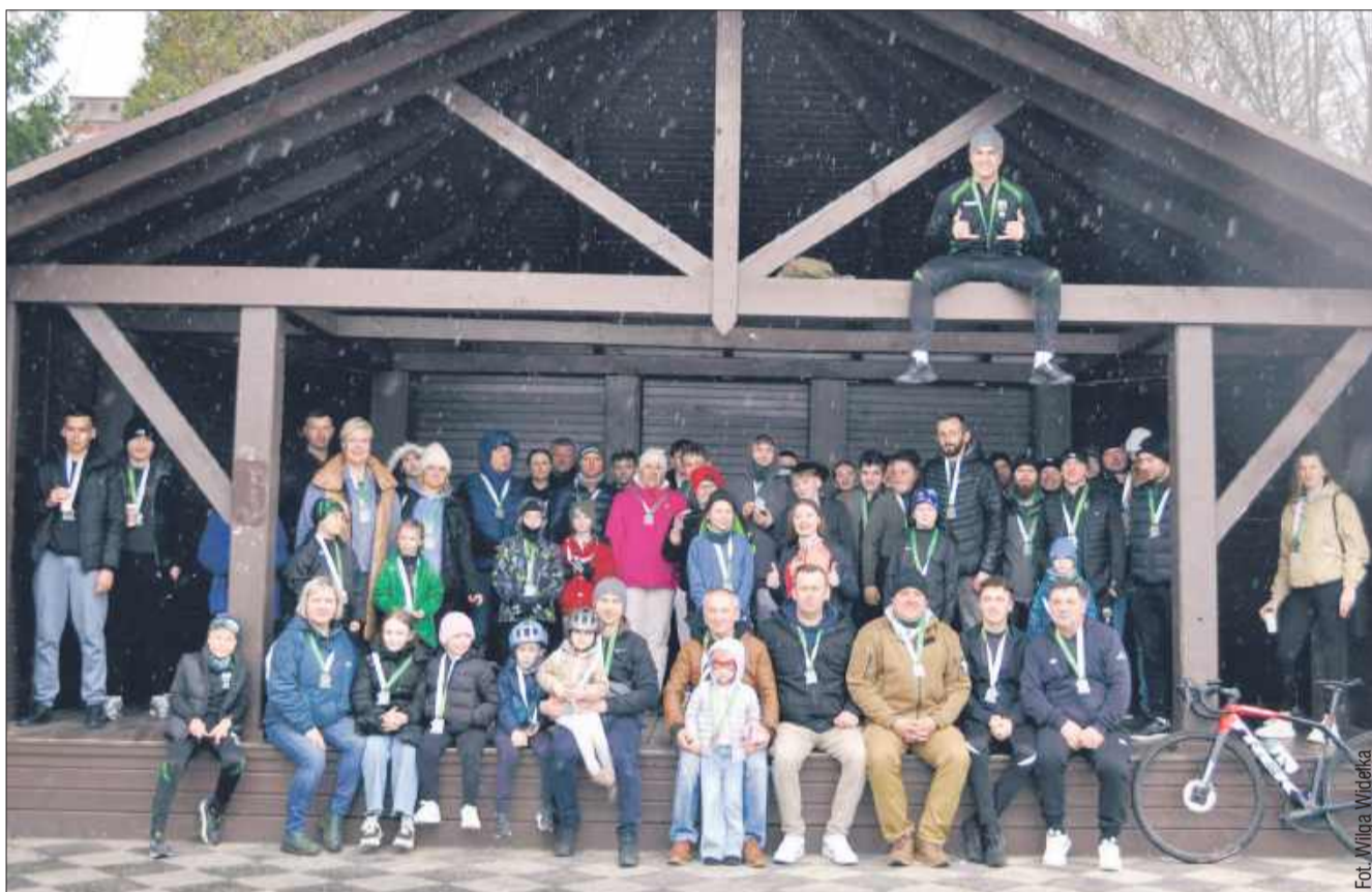
Rowerowe Powitanie Wiosny w Widelce przyciągnęło dziesiątki uczestników. AUTOPROMOCJA

Ponad 80 uczestników – dzieci, młodzież i dorośli – wzięło udział w wyjątkowym wydaniu, które oficjalnie zainaugurowało sportowe obchody 25-lecia klubu Wilga Widelka.