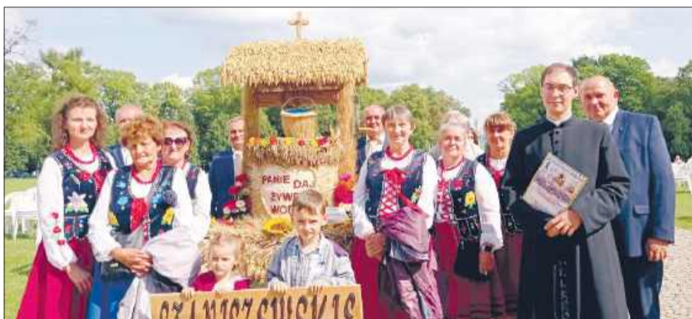
Gospodynie co roku wykonują także wieniec dożynkowy.