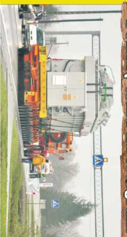
W sobotę, 28 marca 2015 roku, kierowcy jadący drogą krajową nr 9 z Kolbuszowej w kierunku Rzeszowa stali w długim korku. Powód? Wielkogabarytowy ładunek, który powoli zniżał krajową „dziwiątką” do Widelki. Mowa o transformatorze ważącym 190 ton.