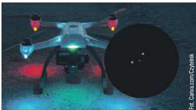
Tajemniczy obiekt na niebie wzbudził niepokój u jednego z mieszkańców.

W Polsce podobnie jak w wielu innych krajach, regulacje dotyczące latania dronami