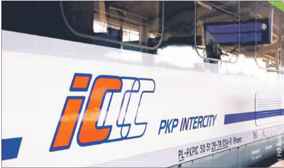
Ministerstwo Infrastruktury zabrało głos w sprawie likwidacji bezpośredniego połączenia z Kolbuszowej do Lublina.

Od 15 grudnia 2024 roku, kiedy wprowadzono nowy rozkład jazdy pociągów, zlikwidowano bezpośrednie połączenie PKP Intercity pomiędzy Kolbuszową a Lublinem. Mimo interwencji poselskiej, Ministerstwo Infrastruktury podtrzymuje stanowisko, że przesiadki stanowią integralny element publicznego transportu zbiorowego.