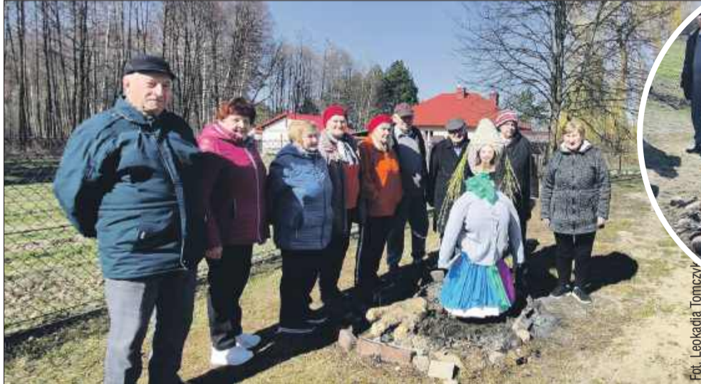
Seniorzy z Dziennego Domu Senior+ w Hucie Przedborskiej symbolicznie pożegnali zimą.

zenie w słowiańskich wierzeniach. Marzanna, znana także jako Morena, była utożsamiana ze śmiercią, zimą oraz ciemnością. Jej topienie, czy też pale-