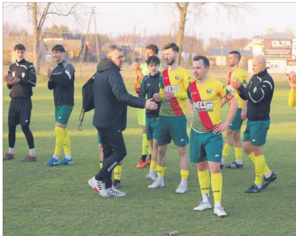
Mimo remisu drużyna z Kolbuszowej Dolnej nadal utrzymuje się na pierwszym miejscu w tabeli.