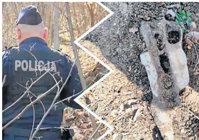
Po odkryciu karabinu i amunicji na miejsce trzeba było wzywać policję

Kilka dni wcześniej członkowie „Sokoła” dokonali innego odkrycia. W rejonie okopów, które są pozostałościami działań armii austro-węgierskiej, odnaleźli 50 nabołów do karabinu Mannlicher, a także monetę – austriackiego krajcara z 1816 roku. Amunicję również musiała zabezpieczyć policja. ©