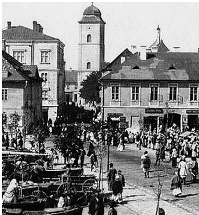
Rynek w Rzeszowie. Na początku lat 30. XX wieku ponad 70 procent placówek handlowych należało do Żydów