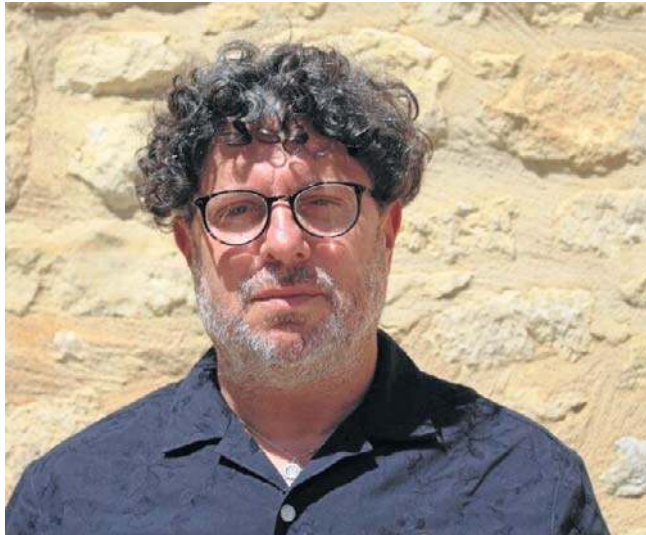
Brytyjski reżyser Marc Isaacs otworzy tegoroczną edycję Krakowskiego Festiwalu Filmowego 31 maja