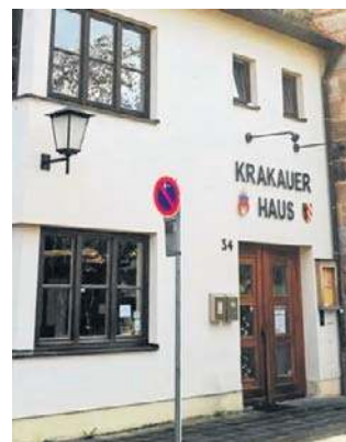
Dom Krakowski w Norymberdze

Dom Krakowski w Norymberdze ma swój odpowiednik pod Wawelem, to mieszczący się na rogu ulic Krakowskiej i Skałecznej Dom Norymberski.