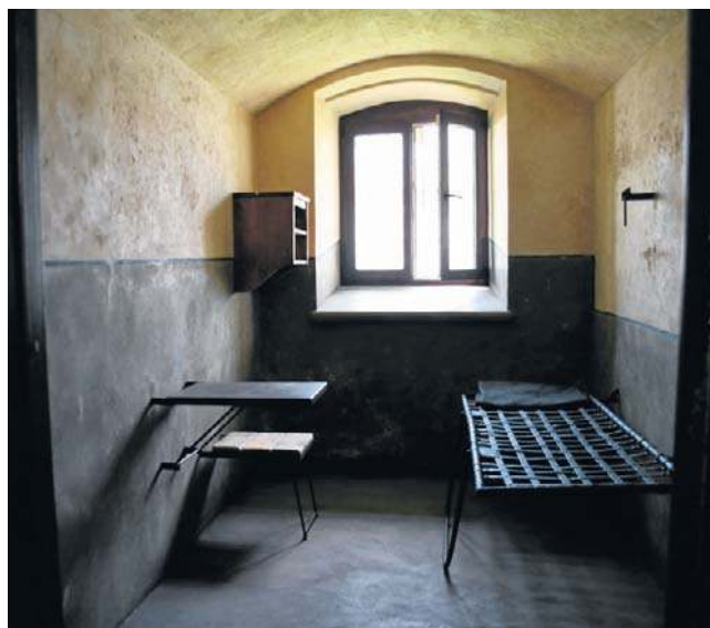
Zrekonstruowana konserwatorsko cela w X Pawilonie

Po „odwilży” 1956 r. w wybudowanym kilka lat wcześniej