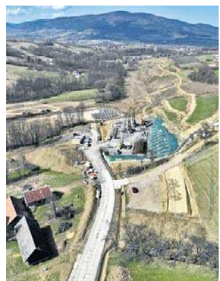
Budowa portalu startowego dla maszyn TBM w Stróży

Początkiem października 2025 roku PKP Polskie Linie Kolejowe S.A. podpisały umowę z konsorcjum firm Budimex S.A., Budimex Kolejnictwo S.A. i Gülermak S.A. na wykonanie nowego odcinka linii kolejowej, która połączy Szczyrzyc z Tymbarkiem. To pierwszy odcinek nowej trasy w ramach projektu Podłęże-Piekiełko. Konsorcjum firm ma 46 miesięcy na wykonanie prac, czyli do połowy 2029 roku. Efekt już zaczyna być widoczny.