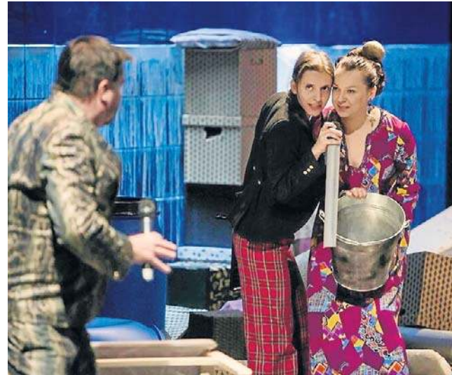
Wyreżyserowane przez Jana Klatę przedstawienie miało swoją premierę jesienią 2015 roku

Inscenizacja XIX-wiecznej sztuki w ujęciu Jana Klaty podnosiła problemy 2015 roku – jesienią tego roku spektakl miał