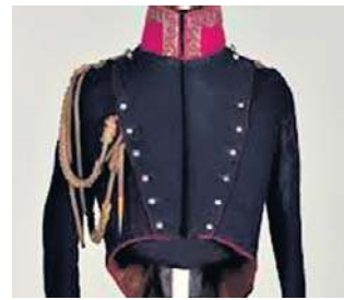
W 2016 r. w Pracowni Konserwacji Tkanin Muzeum Wojska Polskiego ukończono konserwację kurtki mundurowej Kozietulskiego

Rana okazała się ciężka. Kozacka pika przebiła ramię, docierając aż do piersi i poszkodowany trafił na dłuższy czas pod opiekę młodszego chirurga pułkowego Wawrzyńca Gadowskiego. Zapewne cały heroiczny odwrót