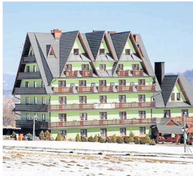
Zielony pensjonat powstał w 2004 r. na działce rolnej. Funkcjonuje, mimo że nakaz jego rozbioru wydano 16 lat temu