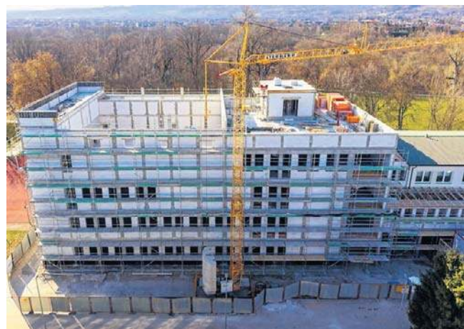
Nowoczesne zaplecze dla przyszłych medyków. Nowy gmach ANS rośnie w oczach

Uczelnia planuje również stworzenie sal odwzorowujących realne warunki pracy medyków, w tym przestrzeni do nauki umiejętności położniczych z salą porodową, a także pomieszczeń pediatrycznych, operacyjnych i do nauki procedur chirurgicznych. ©©