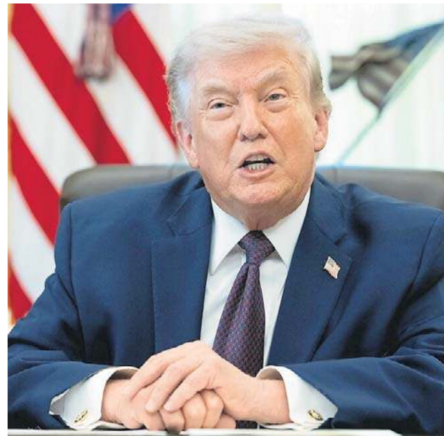
Prezydent USA nazwał sojusz „papierowym tygrysem”

Zapytano Trumpa, czy po konflikcie rozważyłby ponowne rozpatrzenie kwestii członkostwa USA w NATO. Odpowiedział: „Powiedziałbym, że nie ma sensu tego rozważać. Nigdy nie dałem się przekonać NATO. Zawsze wiedziałem, że to papierowy tygrys, i Putin też o tym wie, nawiasem mówiąc”.