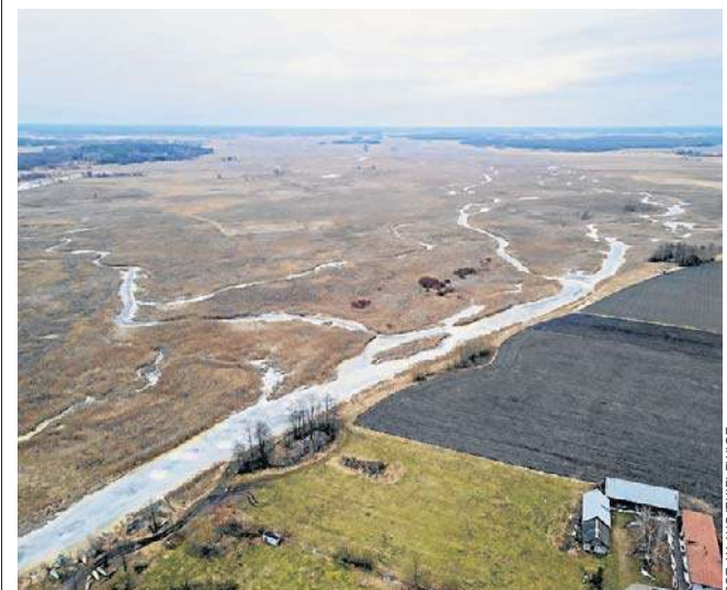
Na Narwi spodziewane są wahania poziomów wody, z możliwością miejscowych przekroczeń stanów ostrzegawczych

Specjaliści podkreślają, że podstawą profilaktyki pozostają szczepienia, regularna dezynfekcja i mycie rąk, unikanie bliskiego kontaktu z osobami chorymi oraz zakładanie maseczek - zwłaszcza w przychodniach i szpitalach. Grypa najczęściej rozpoczyna się gwałtownie - pojawia się wysoka gorączka, towarzyszą jej silne bóle mięśni oraz wyraźne osłabienie organizmu.