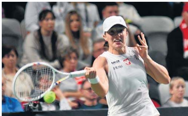
Iga Świątek ma szansę przejść do historii jako trzykrotna triumfatorka turnieju w Indian Wells