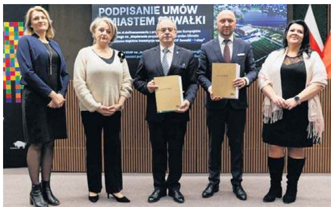
Dzięki dofinansowaniu miasto Suwałki zyska nowe tereny zielone. Kilka inwestycji jest już w trakcie realizacji

-To umowy związane z zieloną i błękitną energią, z nowoczesnym zagospodarowaniem wody deszczowej. W ramach jednego z projektów, którego