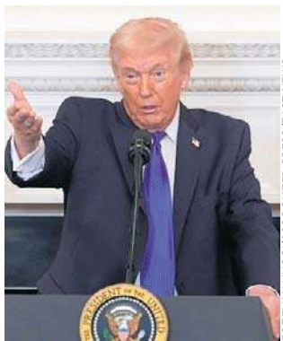
Donald Trump zapewnia, że amunicji nie zabraknie

Dziennikarze podkreślają, że trwająca operacja przeciwko Iranowi jest priorytetem dla planistów Pentagonu i Białego Domu. „Praktyczne skutki uwikłania się Stanów Zjednoczonych