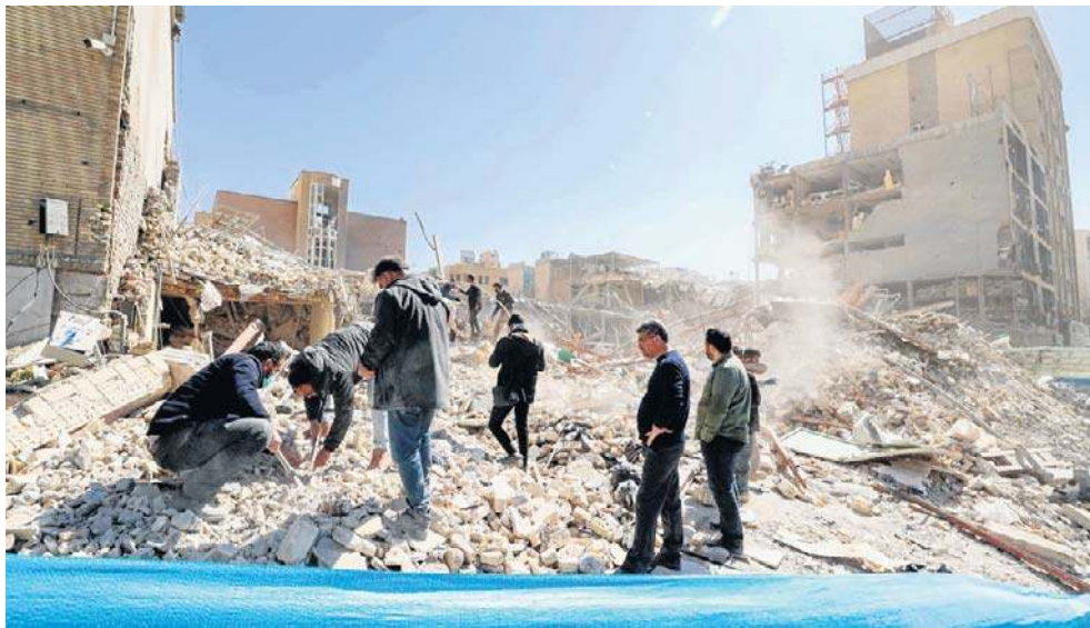
Ludzie oglądają gruzy zavalonego budynku w pobliżu placu Ferdousiego w Teheranie. Ataki Izraela i Stanów Zjednoczonych na Iran trwają od 28 lutego

Wszystkie trzy kraje zapewniły, że te przedsięwzięcia - o ile zostałyby podjęte - miałyby charakter stricte obronny.