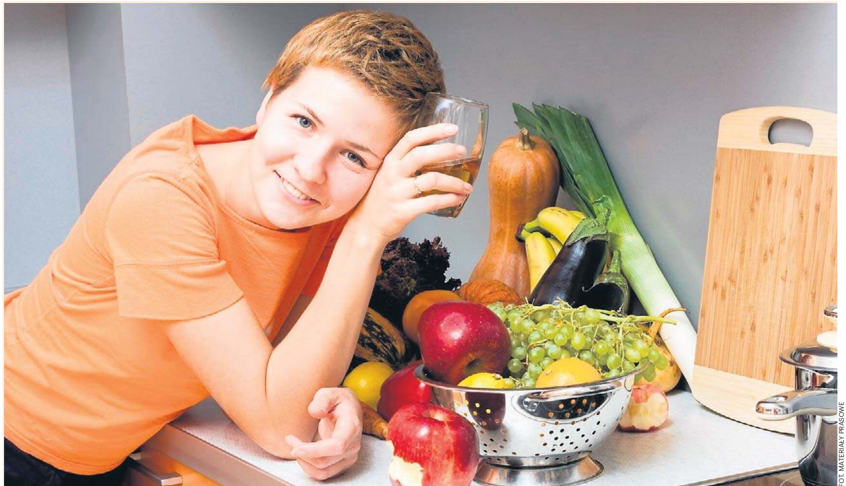
Narodowy Fundusz Zdrowia traktuje otyłość jako przewlekłą chorobę wymagającą leczenia

Z danych zebranych przez lekarzy POZ wynika, że 35 proc. spośród analizowanych pacjentów ma nadwagę, a 28 proc. choruje na otyłość. Wśród kobiet nadwagę odnotowano w 30