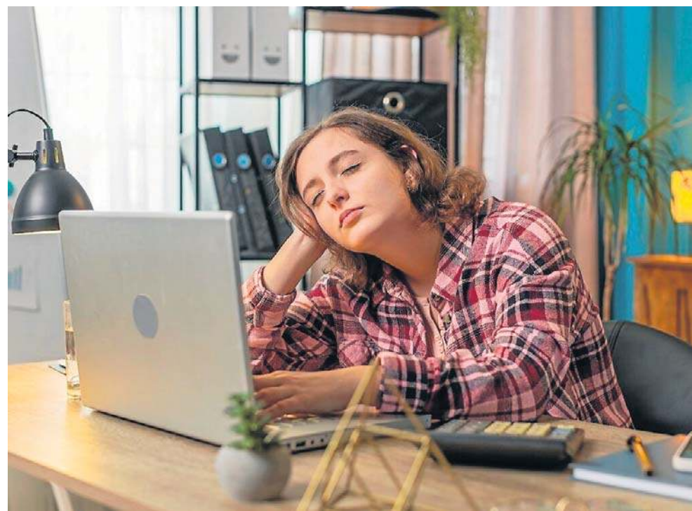
Badania pokazują, że przerwy co 60-90 minut pomagają ominąć kryzys koncentracji

Doświadczając mikrosnu, nie tyle mamy wolniejszą reakcję, ale jesteśmy wyłączeni i nie podejmujemy w ogóle decyzji. Omijają nas kilkanaście sekund z życia na jawie, a w wielu sytuacjach, jak przy wspomnianym prowadzeniu samochodu, te kilka-kilka sekund mogą zaważyć na bezpieczeństwie.