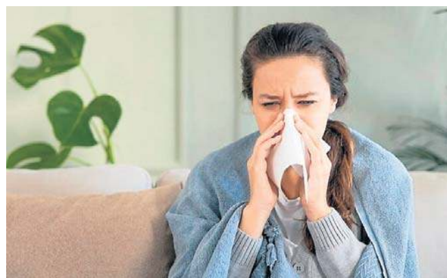
Po przebytej grypie znacząco wzrasta ryzyko zawałów serca i udarów mózgu, dlatego warto się szczepić

Szczyt zachorowań na grypę trwa do końca marca i początków kwietnia, jednak profilaktyka w postaci szczepień może zagwarantować spokój i bezpieczeństwo na dłużej.