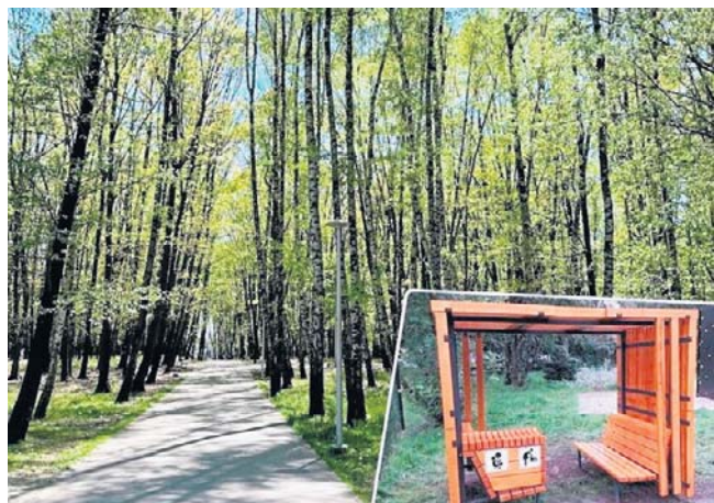
Ławeczka stanie w rejonie placu zabaw, przy jednej z parkowych alejek

Z programu „Małopolska Małuchom” miasto otrzyma ponad 45 tysięcy złotych. Skorzystają na tym także rodzice, którzy czuwają przy łóżkach chorych dzieci w szpitalu Szczeklika. Dzięki tym pieniądzom lecznica wymieni 11 dotychczasowych foteli. Nowe będą rozkładane, przystosowane również do spania i bardziej komfortowe. ©©