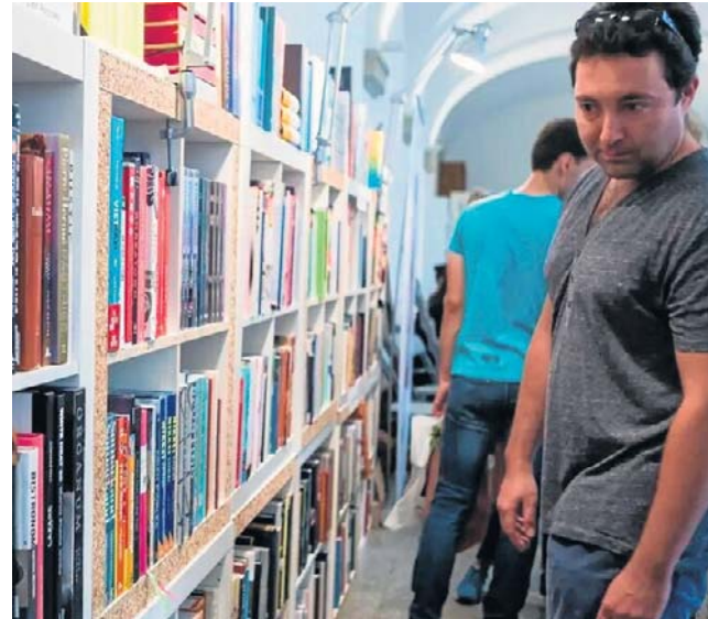
Festiwal Miłosza to okazja, by spotkać poetów, a na księgarnianych półkach wypatrzyć ich cienkie tomy

Czesław Miłosz będzie obecny podczas festiwalu nie tylko jako patron, o nieprzemijającej aktualności jego dzieł pod-