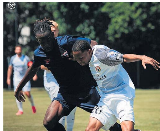
Puszcza nie sprostała Górnikowi Zabrze, ale w tym meczu testowała aż trzynastu zawodników

Ja lubię presję. Uważam, że ona mnie bardziej napędza niż hamuje. Postaram się ją wykorzystać po prostu jako dodatkowy bodziec. ©/©