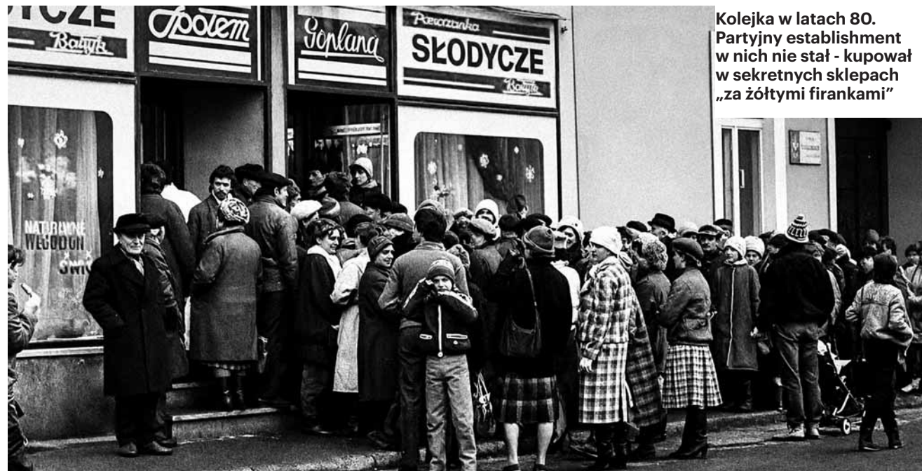
Kolejka w latach 80. Partyjny establishment w nich nie stał - kupował w sekretnych sklepach „za żółtymi firankami”

LUKSUS PRZYNALEŻY RZĄDZĄCYM, NIEZALEŻNIE OD CZASÓW I USTROJÓW