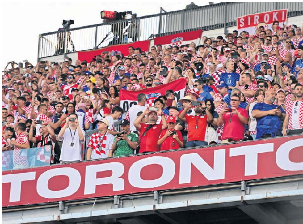
Chorwaccy kibice słyną z niezwykle żywiołowego dopingiu i silnego przywiązania do barw narodowych. Charakteryzują się gorącym, bałkańskim temperamentem

Toronto, które ma doświadczenia z organizacji zawodów sportowych dużej rangi, stara się nie zaniedbać żadnych szczegółów. Kwestia bezpieczeństwa jest postawiona najwyżej, w dniu spotkań mundialu widać wszędzie służby porządkowe. Policja przygoto-