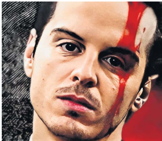
Scott za rolę Moriartego, nihilisty i geniusza-dowcipnisa, dostał nagrody BAFTA oraz IFTA Film & Drama

Na ekranie w postać wcielił się m.in. Jared Harris i Lionel Atwill. Natomiast jedną z najpopularniejszych serialowych ról Moriartego odegrał Andrew Scott w „Sherlocku”.