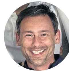
FOT. DOMENA PUBLICZNA

1976 – po ogłoszeniu uchwały Sejmu o podwyżkach cen żywności przez kraj zaczęła się przetaczać fala protestów. Największą skalę osiągnęły w Radomiu, Ursusie i Płocku. Były brutalnie tłumione