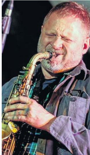
Na finale tegorocznej edycji FestivAltu wystąpi Mikołaj Trzaska

Publiczność zobaczy również spektakl „Jeszcze Polska nie zginęła” Doroty Abbe i Michała Rubenfelda. To futurystyczna satyra, w której państwo Izrael zostało zniszczone,