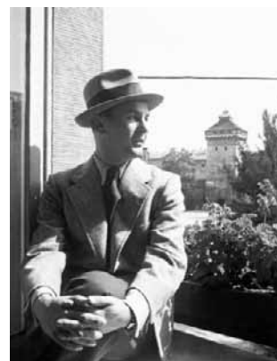
Jan Kiepura, „chłopak z Sosnowca”

„Burza oklasków wita Jana Kiepura”, „Kraków pod znakiem Kiepury”, „Mistrz