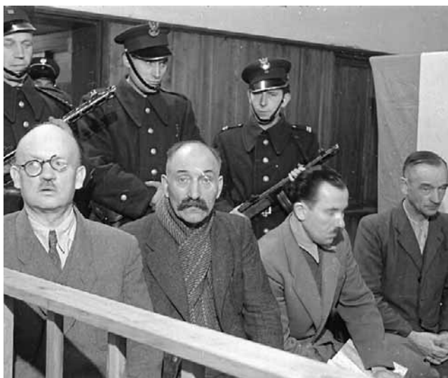
Lawa oskarżonych na jednym z procesów o sabotaż gospodarczy, 1948 r.

Komisja Specjalna do Walki z Nadużyciami i Szkodnictwem Gospodarczym została powołana 16 listopada 1945 r. do ścigania przestępstw gospodarczych. Jej przewodniczącym został Roman Zambrowski, członek Biura Politycznego KC PPR. Jako uzasadnienie stworzenia tej instytucji podawano wzrost nadużyć i korupcji po wojnie oraz szalejącą spekulację, nawiązywaną przy tym do istniejących w międzywojniu urzędów do walki z lichwą oraz z nadużyciami naruszającymi interesy państwa. Jednak powołana przez komunistów Komisja Specjalna miała inne zadania, była też tworem całkowicie pozasadnym. Jej istnienie i funkcjonowanie było sprzeczne z obowiązującymi normami zawartymi w ustawach zasadniczych - konstytucji marcowej z 1921 r., do której odwoływali się komuniści, tzw. małej konstytucji z 1947 r. i konstytucji PRL z 1952 r. Komisja Specjalna stała się nowym organem represji, wykorzystywanym do walki ze społeczeństwem. Stanowiła instytucję, która pozwoliła komunistom częściowo zastąpić wymiar sprawiedliwości i przejąć jego zadania. Spowodowało to obniżenie znaczenia sądownictwa i prokuratury powszechnej, w której zdaniem partii pracowali jeszcze „politycznie niepewni” przedwojenni prawnicy.