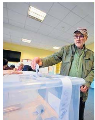
Od kwietnia 2021 roku Bułgarzy głosują ósmy raz

Próg wyborczy w wyborach parlamentarnych w Bułgarii wynosi 4 proc. dla partii i koalicji. Kadencja posła w jednoizbowym parlamencie trwa cztery lata. Uprawnionych do głosowania jest 6 575 151 wyborców.