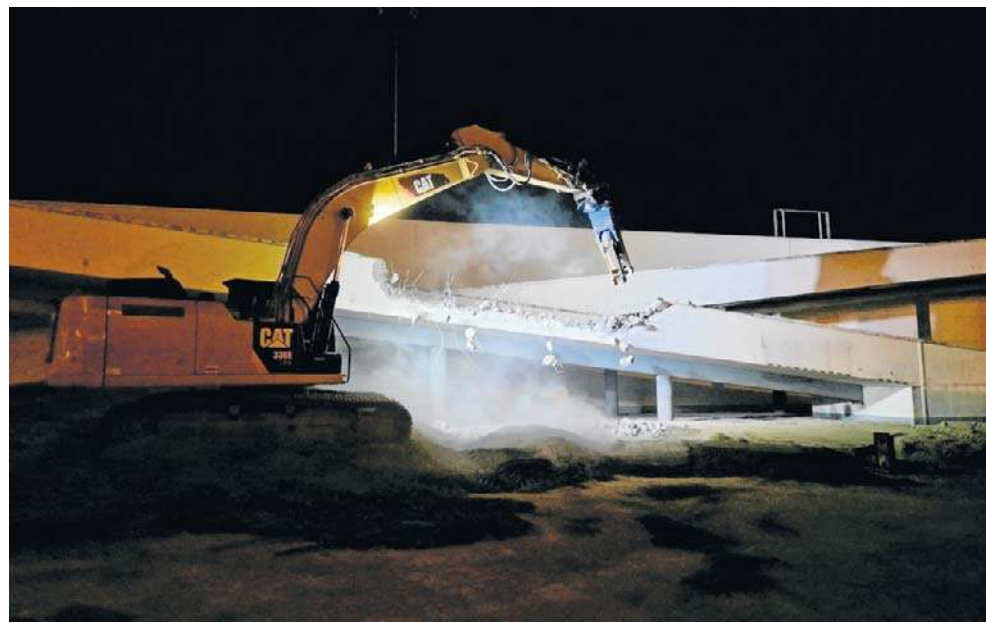
Mieszkańcy Piątkowa są oburzeni nocną rozbiórką ramp wjazdowych na parking galerii

Radny błyskawicznie pojawił się na miejscu razem z innymi mieszkańcami okolicznych bloków. - Osoby postronne, które dopytywały o podstawy prowadzenia tak uciążliwych prac, spotkały się z arogancją. Robotnicy byli wyraźnie poddenerwowani. Gdy po godz. 23 wykonawcy dowiedzieli się, że na miejsce została wezwana policja, wpadli