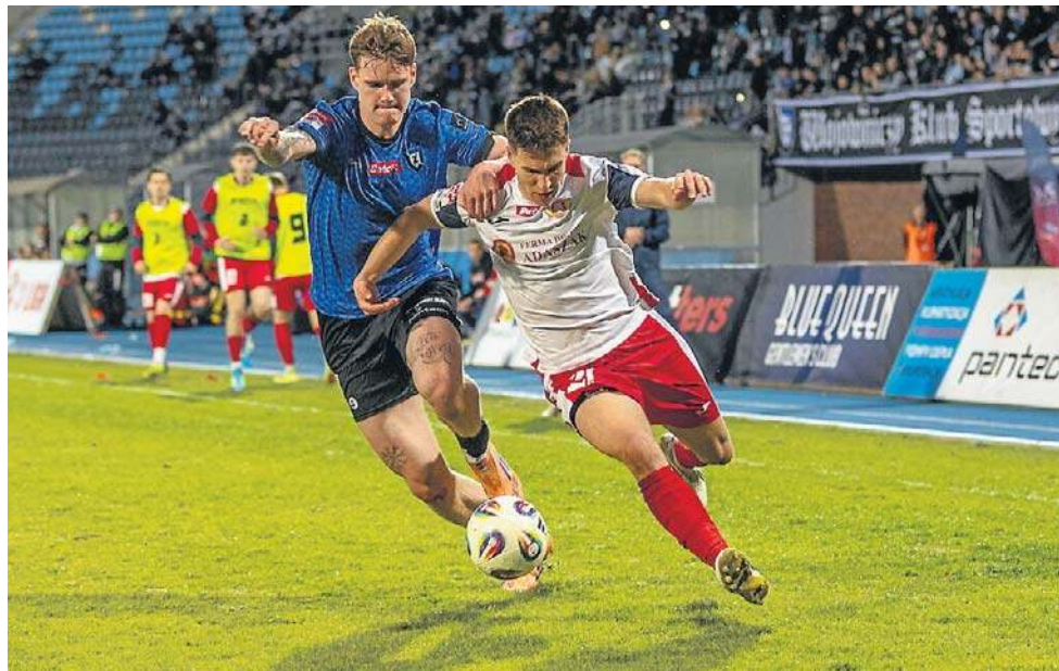
Mecz Zawiszy z Polonią Środa był zacięty, ale 1:0 wygrali gospodarze

W szlagierowym meczu 27. kolejki Betclit 3 ligi, prowadzący w rozgrywkach Zawisza Bydgoszcz podejmował trzecią Polonię Środa Wielkopolska.