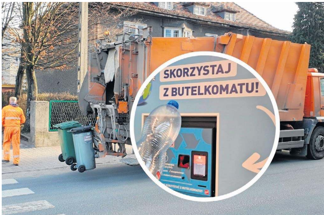
Butelki z kaucją i puszki aluminiowe nie trafiają już do samorządów. Spółki komunalne nagle straciły dopływ pieniędzy z tego tytułu. Coraz częściej słychać głosy, że skończy się to podwyżką opłat za odbiór odpadów