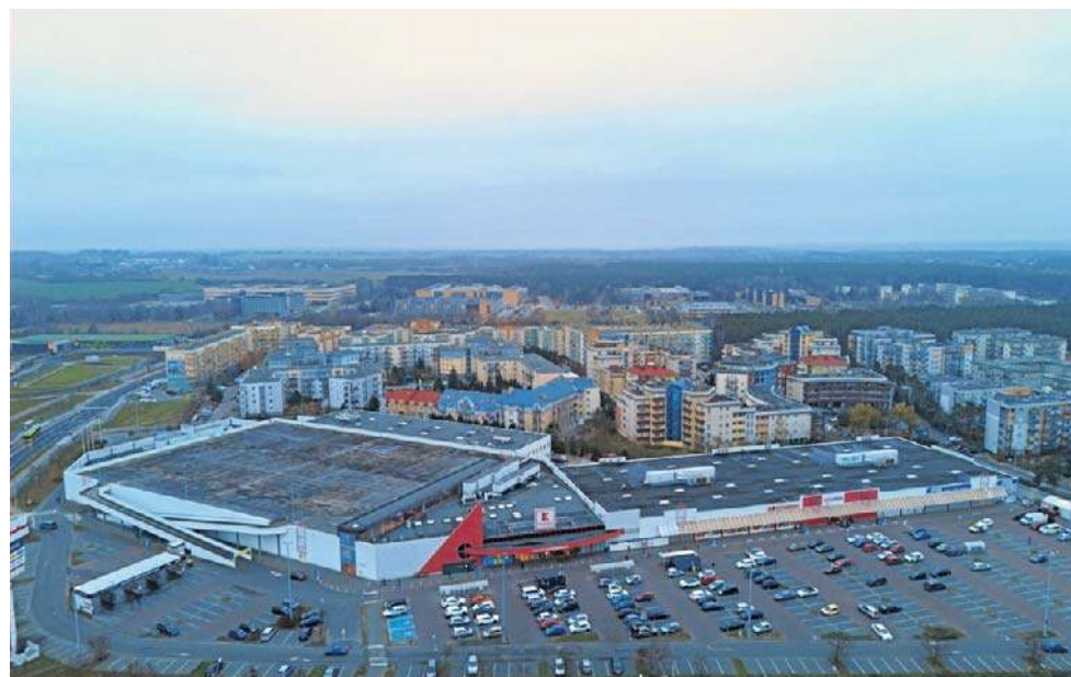
Centrum na Batorego ma zniknąć, a w jego miejscu staną kolejne bloki