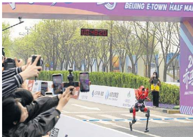
Robot humanoidalny Shandian zdecydowanie pokonał ludzi w pekińskim półmaratonie

W tegorocznej rywalizacji wzięło udział ponad 100 zespołów, pięciokrotnie więcej niż rok wcześniej. Aby wystartować, urzędnicy musieli spełniać rygorystyczne wymogi techniczne, w tym posiadać układ dwunożny i mierzyć od 75 do 180 cm. PAP