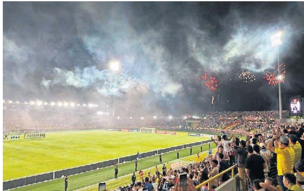
Atmosfera na meczach Copa Libertadores jest niepowtarzalna, inna niż w Europie

Wreszcie przyszedł wyciekający dzień meczu. Jak my-