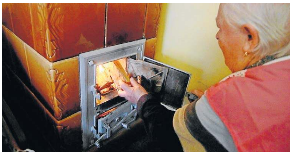
Klienci firmy PV Technik mieli mieć wymienione stare piece, wykonane termomodernizację domów. A mają jedynie wielki problem finansowy/zdjęcie ilustracyjne