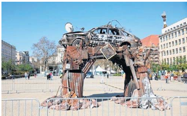
Nietypowa instalacja okazała się zapowiedzią nowego wydarzenia muzycznego, które odbędzie się na Śląsku

Festiwal potrwa dwa dni, ale jego program ma być intensywny i maksymalnie różnorodny. Na trzech scenach wybrzmia: alternative rock, indie, hyperpop i elektronika. Zapowiedziano gwiazdy z Polski i zagranicy. W sierpniu z kolei w Poznaniu odbędzie się BitterSweet Festival.