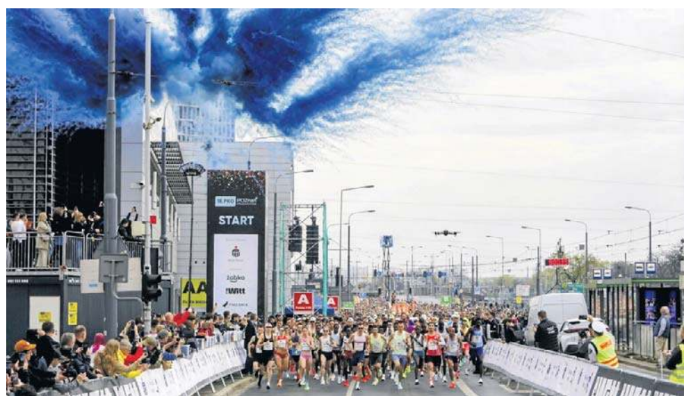
Tak wyglądał bardzo efektowny start do 18. PKO Poznań Półmaratonu. Nowa trasa generalnie przypadła do gustu zawodnikom, choć niektórzy mieli małe zastrzeżenia

U mężczyzn od pierwszych kilometrów była inna sytuacja, bo w czołówce było ośmiu zawodników i to oni wspólnie dyktowali tempo półmaratonu. Nie było jednak ono oszłamiające, albowiem nie zapowiadało rekordu trasy. Na ostatnich pięciu kilometrów grupa prowadząca wyraźnie się podzieliła i na ostatnich metrach o zwycięstwo rywalizowało dwóch Kenijczyków i Tanzańczyk.