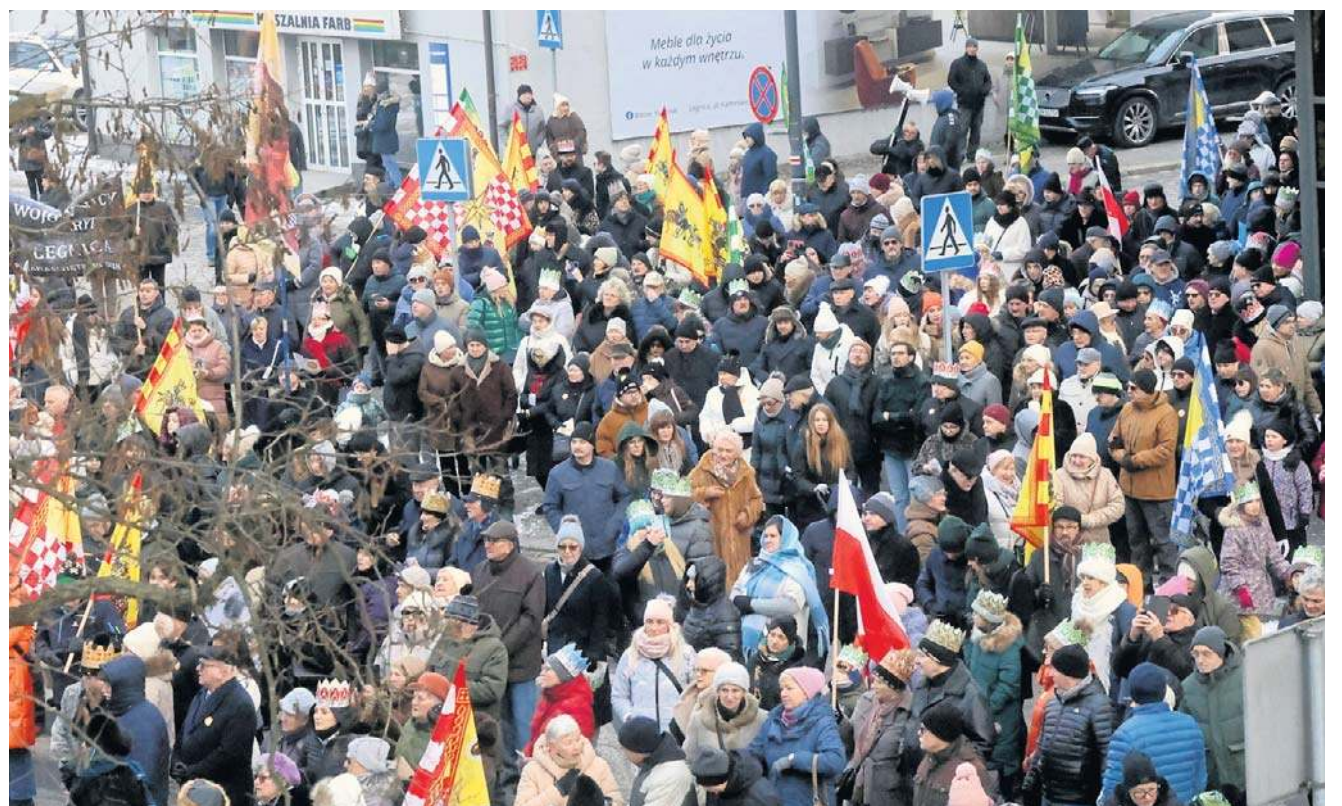
W legnickim centrum zebrał się 6 stycznia kolorowy tłum, były akcenty patriotyczne