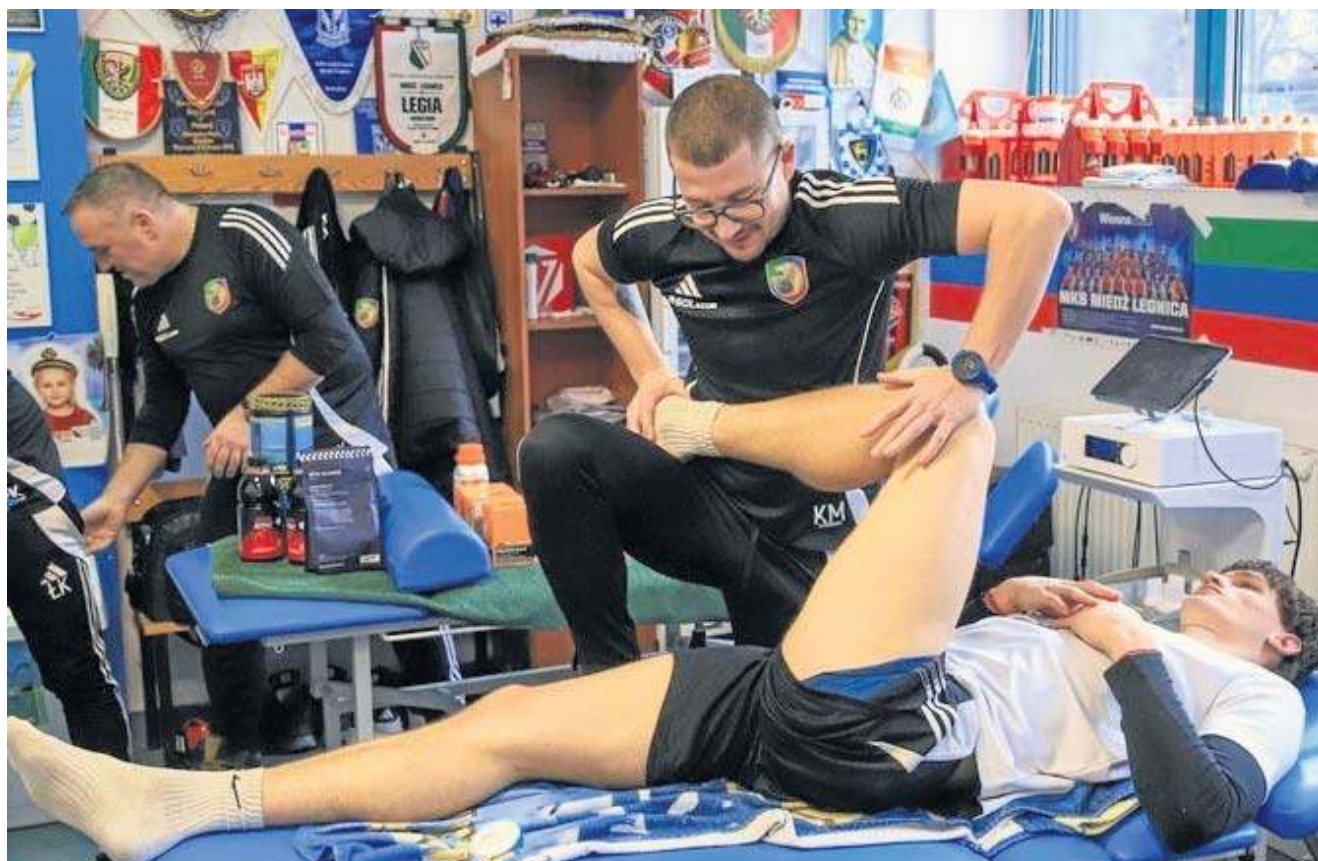
Przed pierwszymi treningami z piłką wszyscy zawodnicy Miedzi przeszli badania pod okiem sztabu medycznego

PIŁKA NOŻNA 19 STYCZNIA ROZPOCZNIE SIĘ OBÓZ TRENINGOWY W TURCJI