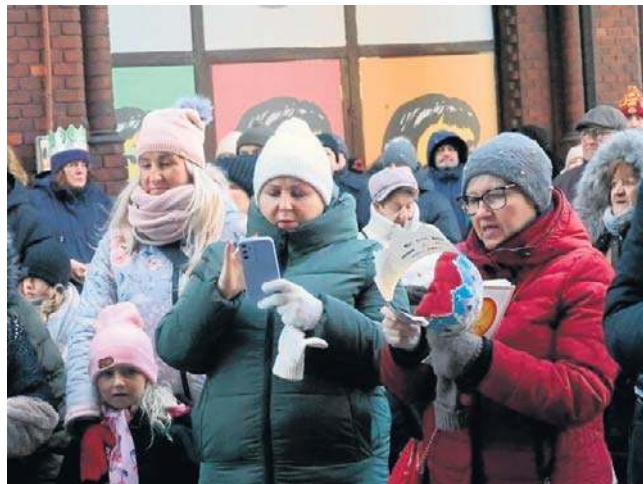
Legniczanie uwiecznili uroczystość licznymi zdjęciami, które za pomocą internetu powędrowały w świat