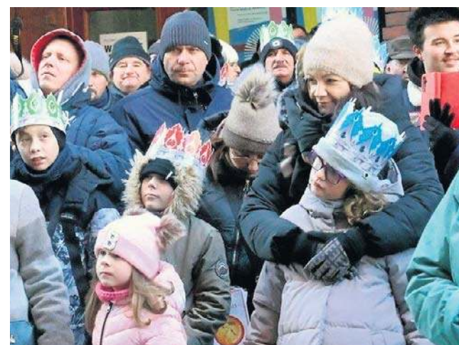
W orszaku było wiele dzieci. W odróżnieniu od dorosłych, którzy długo czekali na ten marsz, dla nich był on zawsze