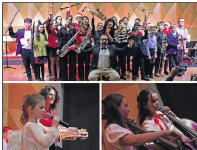
■ Koncert kolęd odbył się w piątkowy wieczór 19 grudnia 2025.