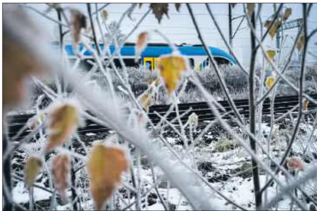
■ W nowym rozkładzie jazdy linia S17 została wydłużona do Wodzisławia Śląskiego

Uruchomienie nowej linii sprawi, że przybędzie pociągów na odcinku z Chorzowa Batorego do Tarnowskich Gór – pociągi będą tu kursować w ciągu dnia średnio co 30 minut. Na zagęszczenie ruchu wpływa także wydłużenie linii lotniskowej S9, która dotąd kursowała z Częstochowy do Tarnowskich Gór. Od 14 grudnia 10 par pociągów dziennie na S9 dojedzie aż do Chorzowa Batorego. Łącznie