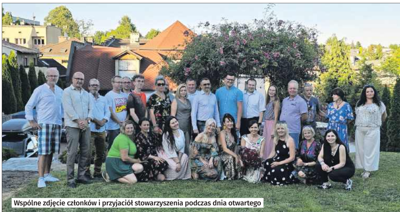
Wspólne zdjęcie członków i przyjaciół stowarzyszenia podczas dnia otwartego