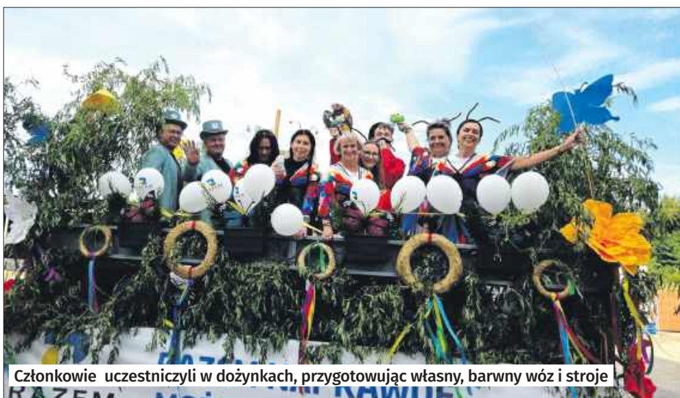
■ Członkowie uczestniczyli w dożynkach, przygotowując własny, barwny wóz i stroje