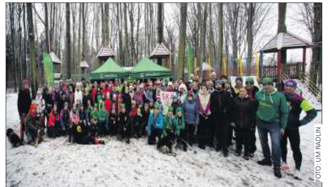
■ Wspólne zdjęcie uczestników radlińskiego biegu