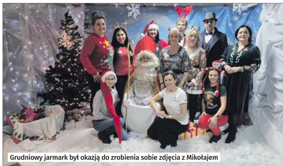
■ Grudniowy jarmark był okazją do zrobienia sobie zdjęcia z Mikołajem