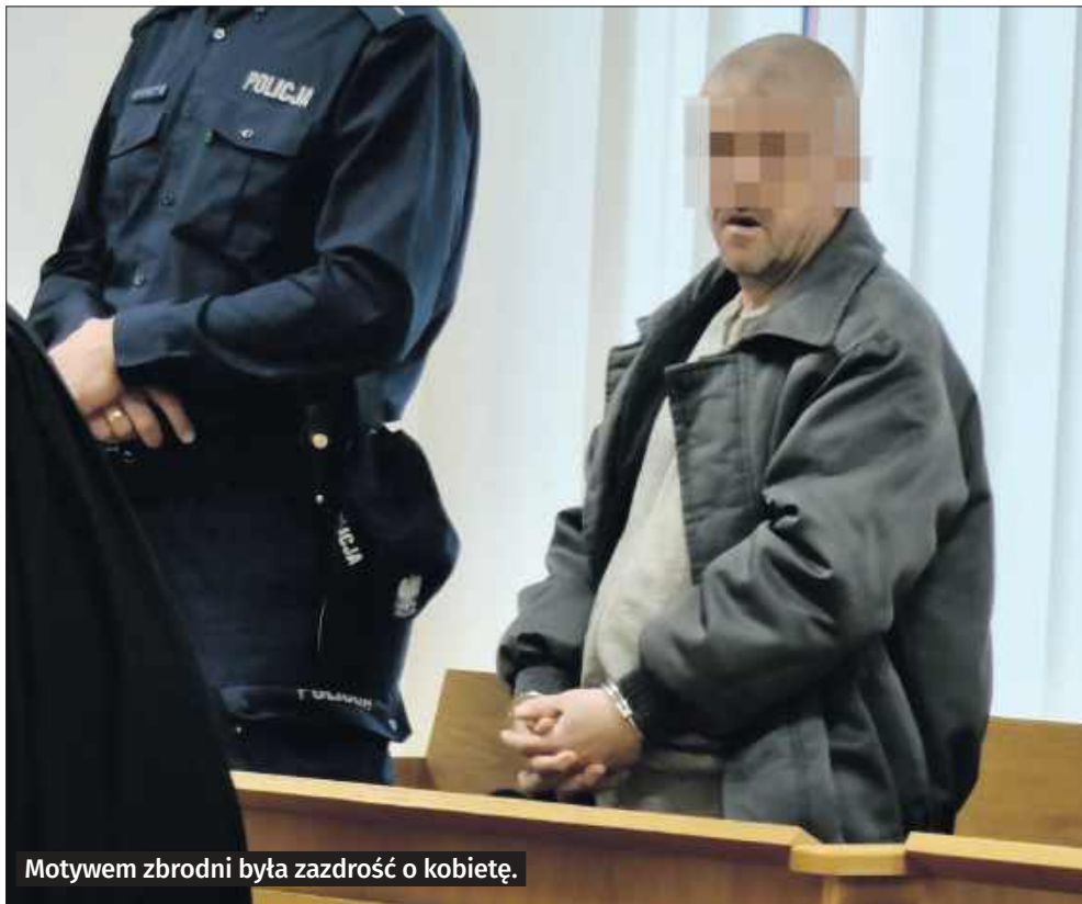
Motywy zbrodni była zazdrość o kobietę.

Stopień społecznej szkodliwości czynu sąd określił jako „ekstremalnie wysoki”. Podkreślił, że pokrzywdzony przed śmiercią doznał niewyobrażalnego rozmiaru cierpienia. – Sąd uznał, iż kara musi uwzględniać społeczny wymiar