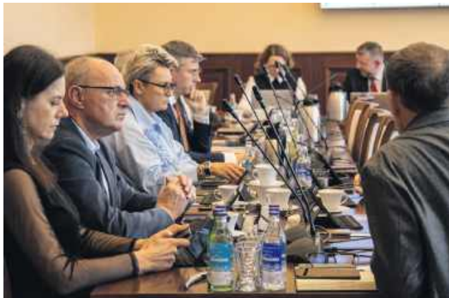
■ W głosowaniu nad budżetem 11 radnych było za, 9 przeciw.

WODZISŁAW ŚL. Podczas sesji rady miejskiej 18 grudnia wodziszławscy rajcy uchwalili budżet na 2026 rok. Prezydent określa budżet jako „realny”, natomiast opozycja wytyka dalsze zadłużanie miasta. Podczas sesji nie zabrakło również wystąpień, m.in. dotyczących uszczuplenia środków dla rad dzielnic.