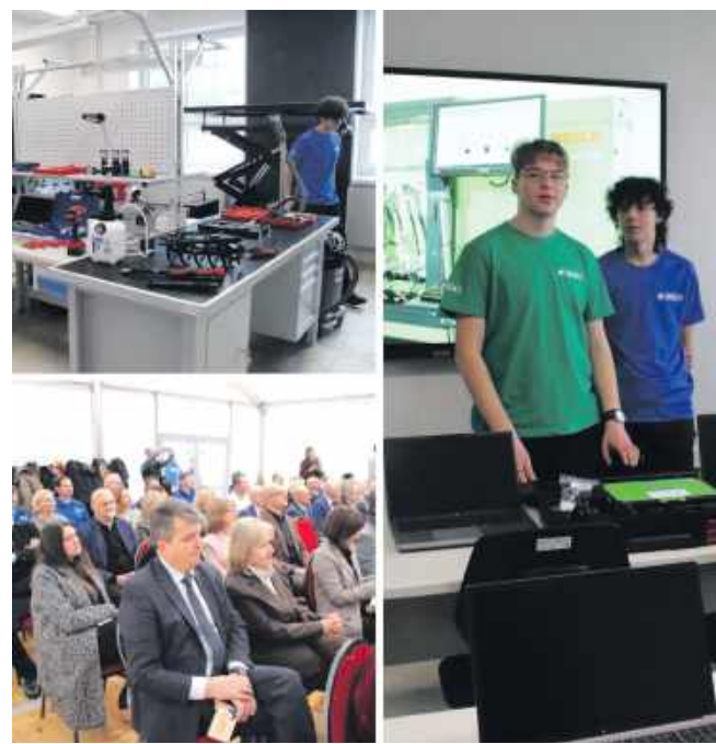
■ Branżowe Centrum Umiejętności w dziedzinie diagnostyki i naprawy pojazdów otwarto 16 grudnia w Pszowie

Stworzenie nowego Branżowego Centrum Umiejętności to wyzwanie, z jakim mierzyła się w ostatnich miesiącach dyrekcja i pracownicy ZSP w Pszowie. Wśród pojazdów, które stanowią część edukacyjnej przestrzeni, znajdują się: Kia Niro (hybryda), Kia EV3 (elektryk), Kia Stonic (benzyna), Škoda Octavia Combi (diesel). W nowym Branżowym Centrum Umiejętności w Pszowie zainstalowano również szeroką gamę urządzeń, które będą wykorzystywane podczas zajęć praktycznych. Są to między innymi ładowarka do samochodów elektrycz-