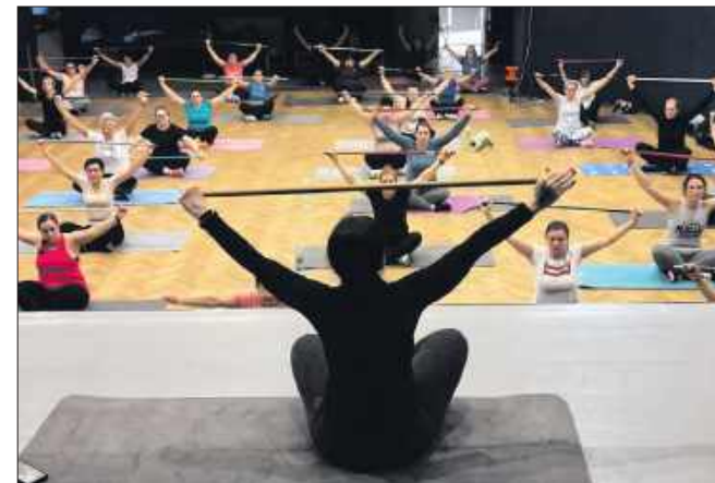
■ Zajęcia fitness w Miejskim Ośrodku Kultury