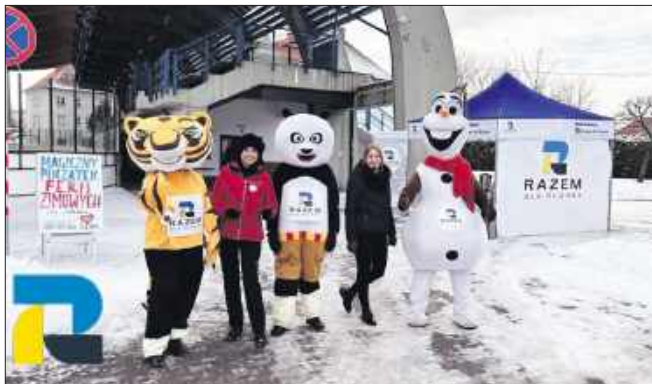
■ W lutym członkowie stowarzyszenia pojawili się też na pszowskim lodowisku. W ramach inicjatywy rozdawano darmowe wejściówki na lodowisko, które uczestnicy mogli wylosować na miejscu.

Pierwszy jarmark staroci i rękodzieła był sprawdzianem, czy w Pszowie jest jeszcze przestrzeń na tego typu inicjatywy. – Prosta formuła i brak barier wejścia sprawiły, że wydarzenie szybko zaczęło żyć własnym rytmem – mówi