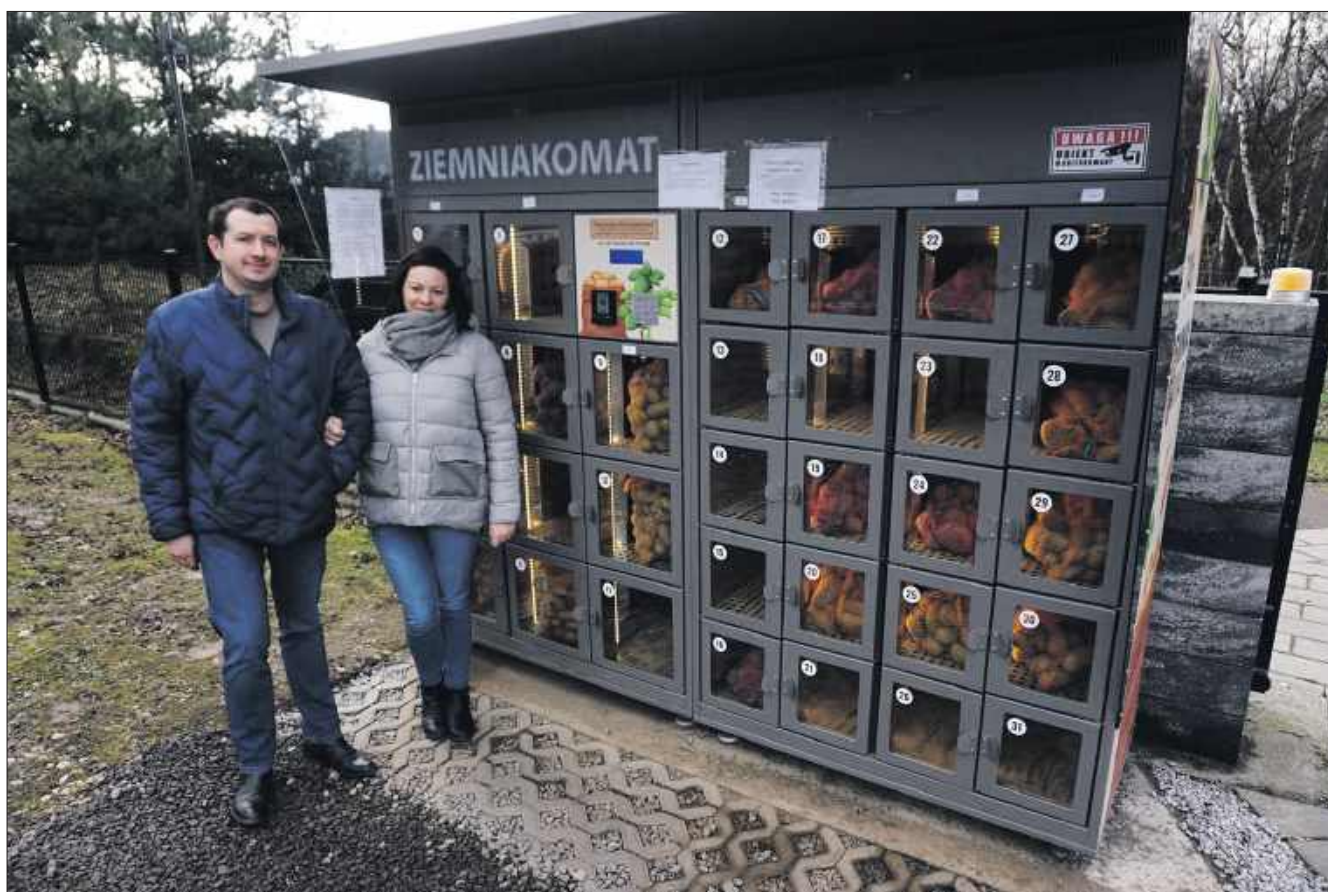
■ Ziemniakomat ułatwia szybkie zakupy, ale klienci wciąż mogą kupić towar także bezpośrednio w gospodarstwie.

Popularność przyszła szybciej, niż się spodziewali. Publikacje w internecie i materiały telewizyjne spra-