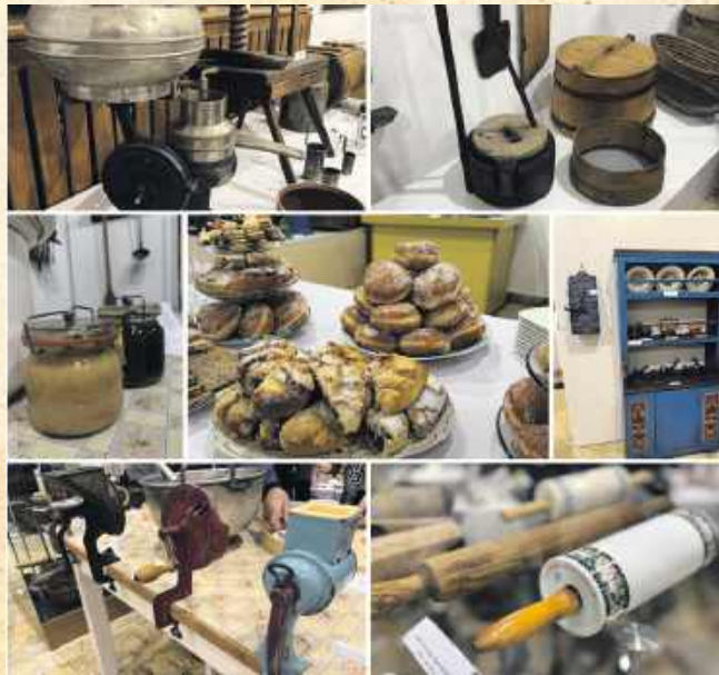
■ Chleb pieczony na liściu, broutzupa, kołoczki czy wytwarzanie nabiału, to tylko niektóre z tradycji kulinarnych, obecnych na Śląsku

Premierą ekspozycyjną jest piękny piec z blachą, zdobiony fajansami z zimowymi krajobrazami. Zakupiliśmy ten piec z dawnej Izby Regionalnej w pałacu wojnowickim. Dokładnie nie znamy jego proveniencji, ale jest tak piękny, że warto go zobaczyć, zwłaszcza, że jest pierwszy raz na ekspozycji. Chciałam też zwrócić uwagę na inną ciekawostkę na naszej wystawie, a mianowicie młynek do palenia kawy. Oczywiście nie tej kawy czarnej, tylko zbożowej, która kiedyś była podstawowym napojem. Nie herbata, ale właśnie kawą zbożową gaszono pragnie-