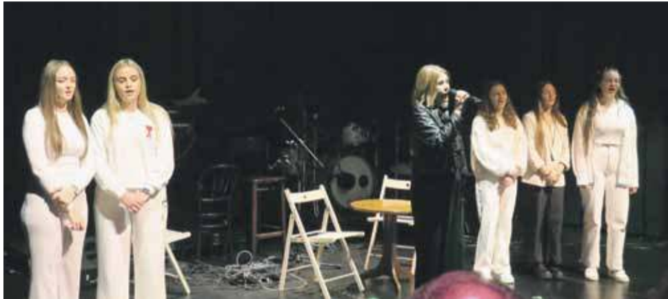
ETAM - czyli grupa z Hotelarza dała pouczający spektakl o tym jak ważna jest pomoc i otwartość dla drugiego człowieka.