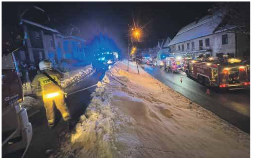
mk W czasie prowadzonych działań ruch ulicą Poniatowskiego w kierunku Słonego był utrudniony.