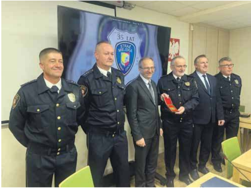
Dzisiaj formacja liczy czterech strażników.

W historii formacji nie brakowało niestandardowych działań. Rabczańscy municypalni ochraniały wizytę konsula Szwajcarii i prowadzili pierwsze lokalne akcje ekologiczne, m.in. program „Jestem zielony”. Orga-