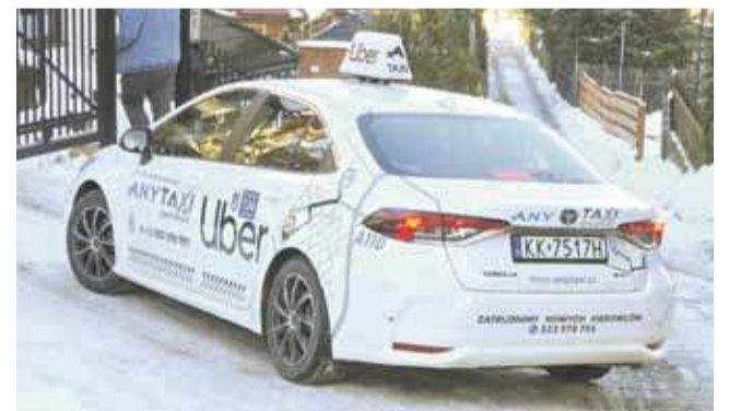
Samochody Ubera w Zakopanem już nikogo nie dziwią.