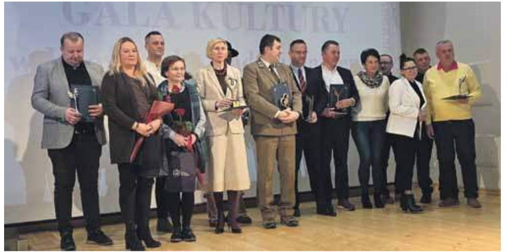
Nagrodzeni w czasie Gali Kultury w Krościenku