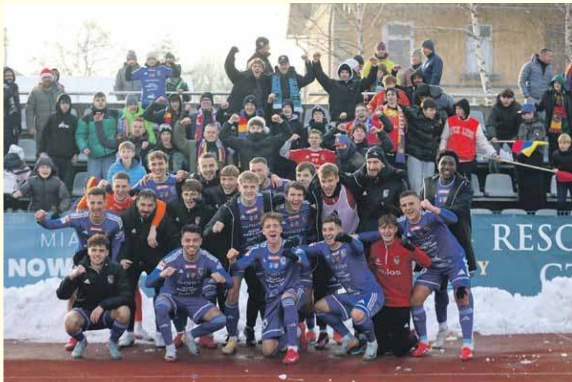
Podhale kolejny raz pokazało charakter i wygrało po голу w doliczonym czasie gry.