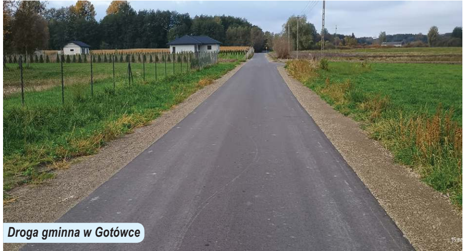
Droga gminna w Gotówce