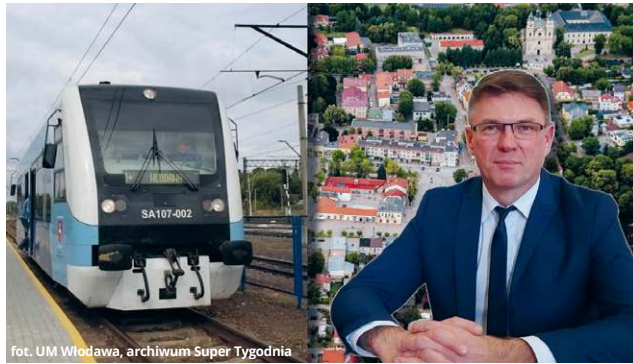
fol. UM Włodawa, archiwum Super Tygodnia

– Całkowity koszt inwestycji szacowany jest na około 500 milionów złotych. Jest to kwota,