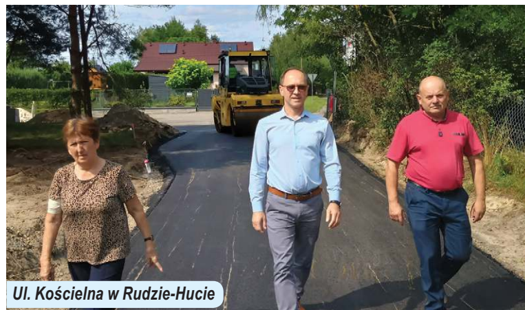
Ul. Kościelna w Rudzie-Hucie

Zakończono również budowę nowej, blisko kilometrowej drogi na ul. Kościelnej w Rudzie-Hucie, która znacząco poprawiła komfort jazdy, bezpieczeństwo oraz dostępność komunikacyjną w centrum miejscowości. Kolejnym krokiem była nowa nakładka asfaltowa w Zarudni o długości 0,8 km o budżecie niespełna 280 tys. zł.