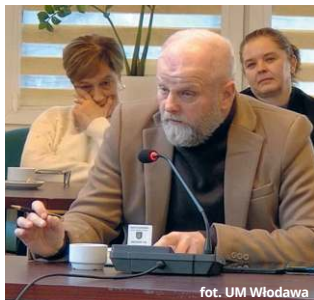
fol. UM Włodawa

Najwięcej uwagi poświęcono jednak Szkole Podstawowej