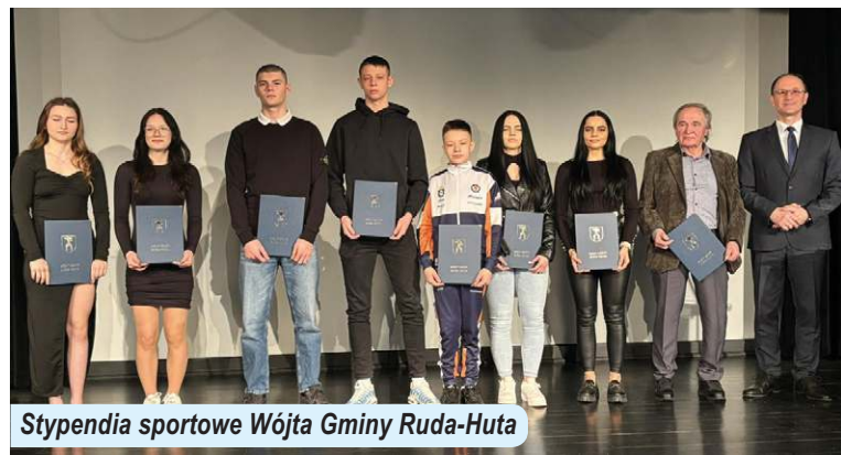
Stypendia sportowe Wójta Gminy Ruda-Huta