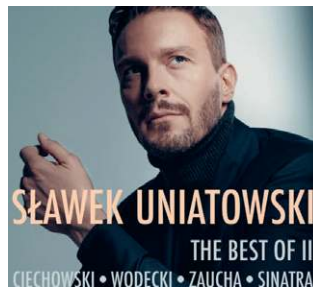
THE BEST OF II CIECHOWSKI • WODECKI • ZAUCHA • SINATRA