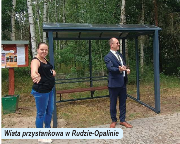
Wiatra przystankowa w Rudzie-Opalinie

Rok 2025 zapisał się w historii Gminy Ruda-Huta jako czas intensywnego rozwoju, licznych inwestycji oraz bogatego życia społecznego, kulturalnego i sportowego. Wydatki inwestycyjne zamknęły się rekordową kwotą 12.607.887,73 zł. Samorząd konsekwentnie realizował przyjętą strategię, skutecznie pozyskując środki zewnętrzne i łącząc nowoczesne rozwiązania infrastrukturalne z troską o lokalne dziedzictwo oraz integrację mieszkańców.