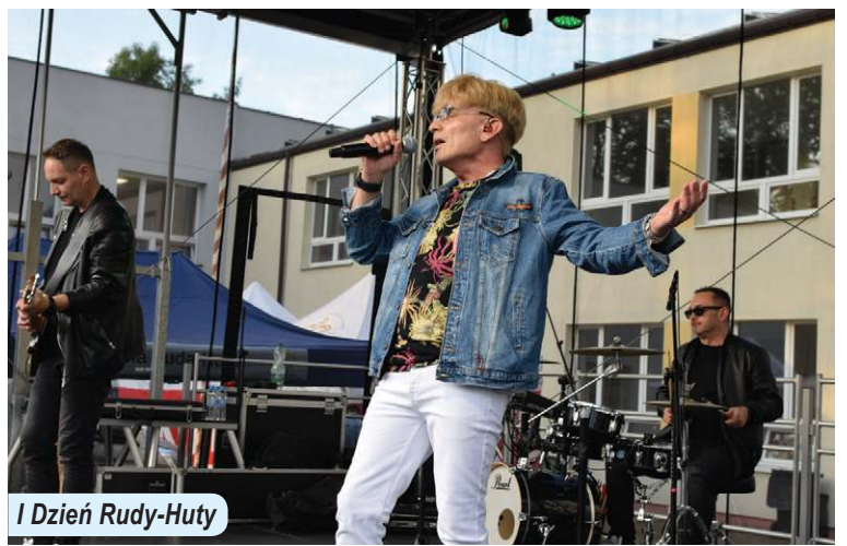
I Dzień Rudy-Huty