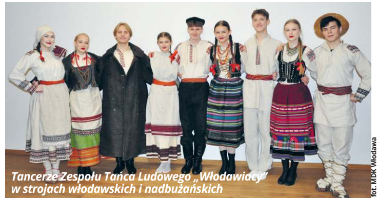
Tancerze Zespołu Tańca Ludowego „Włodawiecy” w strojach włodawskich i nadbużańskich