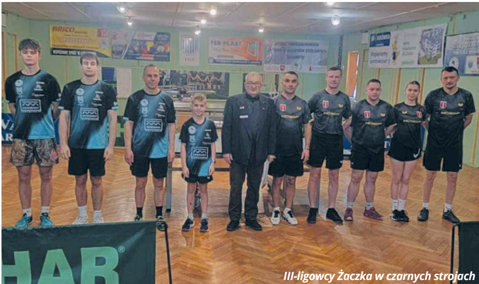
III-ligowcy Żaczka w czarnych strojach

● TENIS STOŁOWY III-ligowy skład UKS-u Żaczka Fajslawice zachował miejsce lidera po kolejnym zwycięskim meczu. Punkty w rozgrywkach dopisali do konta także reprezentanci KS-u Ogniwa Chełm.