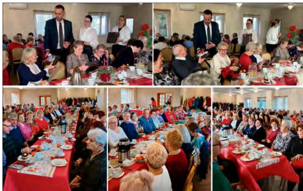
Uczestnicy spotkania zasiedli do świątecznego stołu.

Niepowtarzalny, świąteczny nastrój wydarzenia stworzyły dzieci z Publicznej Szkoły Podstawowej nr 1, które zaprezentowały piękne wykonania kolęd i pastorałek. Ich występ został przyjęty z wielkim wzruszeniem i gorącymi oklaskami.