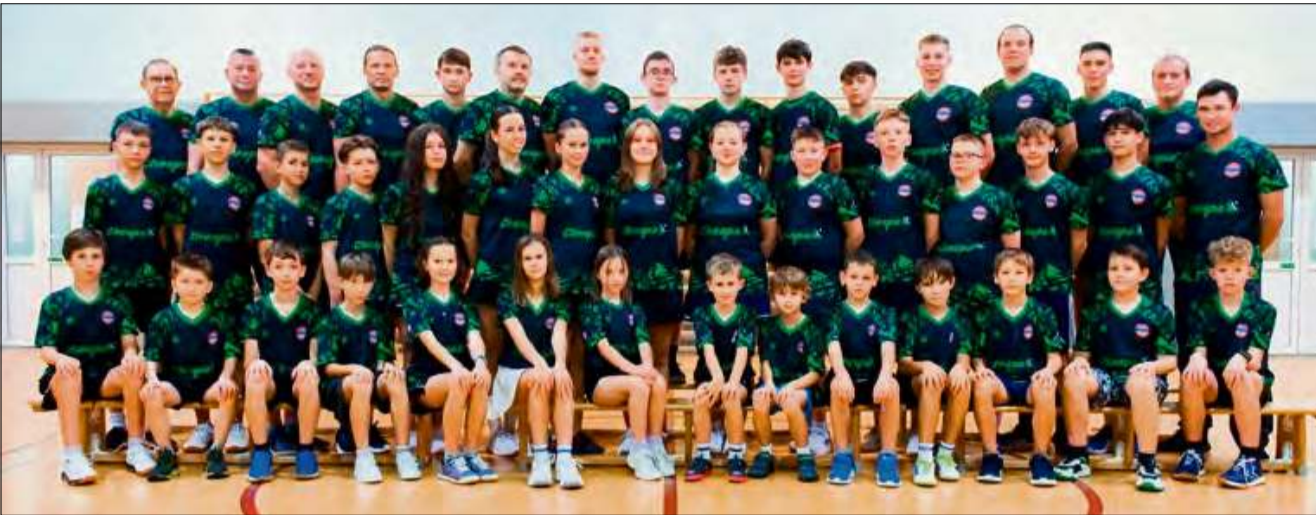
Tak prezentuje się kadra tenisowej sekcji LZS-u Żywocice.

Rok 2025 przejdzie do kronik LZS-u Żywocice jako czas przełomów, symboli i spełnionych ambicji. Klub, który jeszcze kilkanaście lat temu startował niemal od zera, dziś stawia się w jednym szeregu z dużo większymi ośrodkami w Polsce.