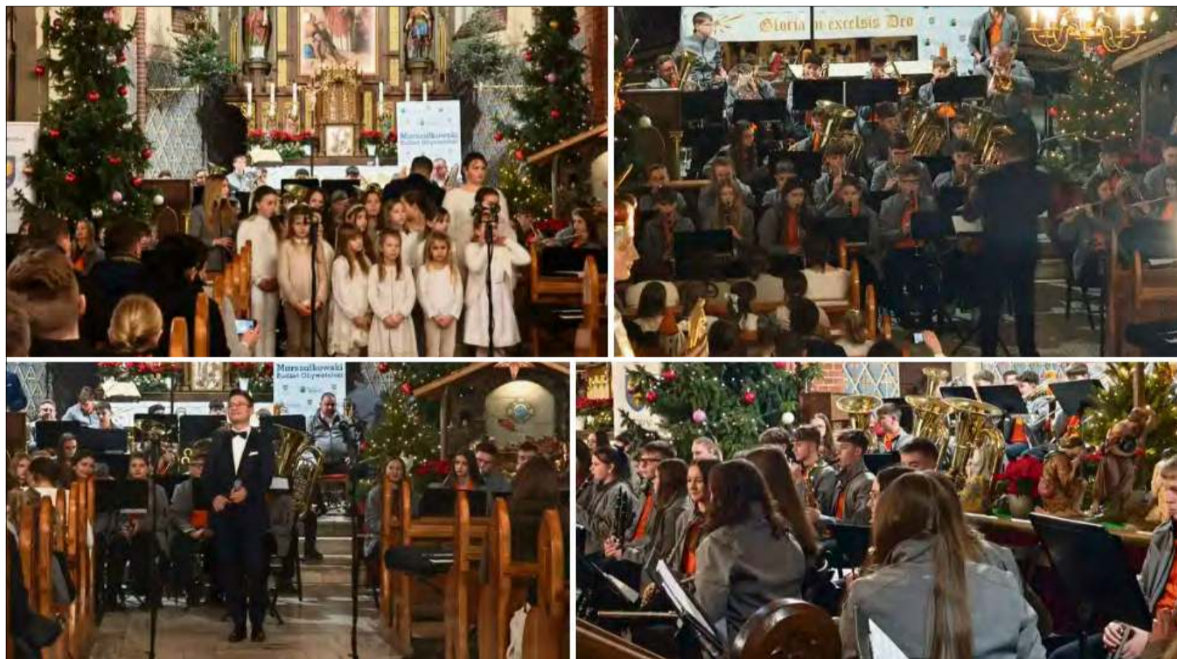
Koncert Kolęd w kościele św. Walentego w Walcach zachęcił mieszkańców do wspólnego kolędowania.

Na scenie zaprezentowali się artyści, którzy zagwarantowali wysoki poziom artystyczny i różnorodność brzmień. Opolska Dziecięca Orkiestra Dęta zachwycała dojrzałością wykonania, energią i precyzją.