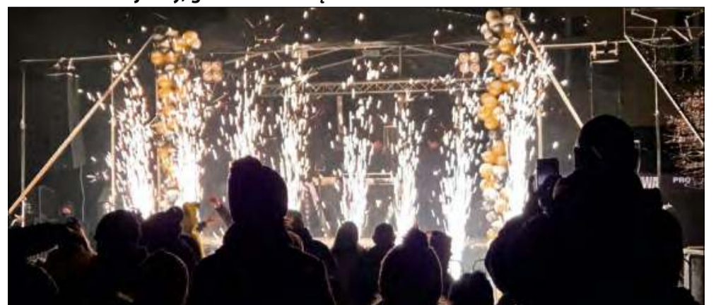
Nie zabrakło efektownych pokazów sztucznych ogni.