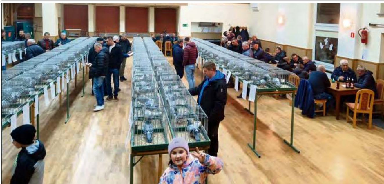
Członkowie Oddziału Moszna zaprezentowali podczas wystawy 32 gołębie pocztowe.

Od 19 do 21 grudnia w Domu Kultury w Kujawach odbyła się Wystawa Okręgu Opole Południe, organizowana przez Polski Związek Hodowców Gołębi Pocztowych. Wydarzenie podsumowało całoroczną pracę hodowców.