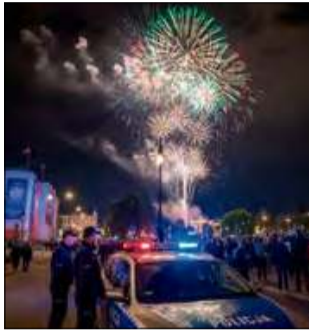
Tegoroczny sylwester przebiegał spokojnie.

Drugie zdarzenie, które wymagało interwencji, to pożar kontenera na śmieci, który znajdował się na osiedlu mieszkaniowym 1000-lecia w Krapkowicach. Zgłoszenie w tej sprawie wpłynęło krótko przed godziną 2.00 w nocy. Jak wy-