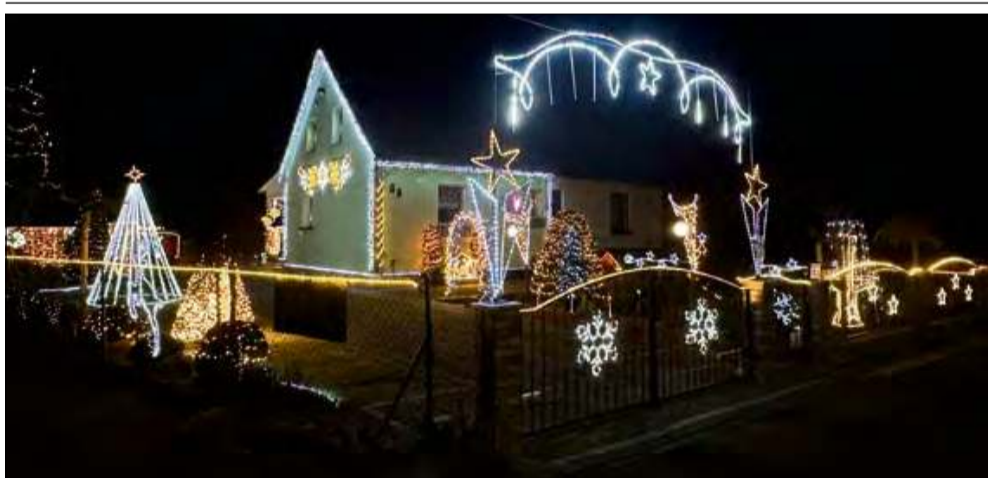
Świąteczne iluminacje domu rodziny Wieczorek w Obrowcu przy ul. Krapkowickiej – ponad 60 tysięcy światełek.

Przy ulicy Krapkowickiej w Obrowcu znów zrobiło się bajkowo. Ponad 60 tysięcy światełek, sztuczny śnieg i specjalna strefa do zdjęć przyciągają tłumy mieszkańców i turystów. Rodzina Wieczorek od 20 lat tworzy jedną z najbardziej magicznych iluminacji świątecznych w regionie, a w tym roku przygotowała wyjątkową noworoczną niespodziankę.