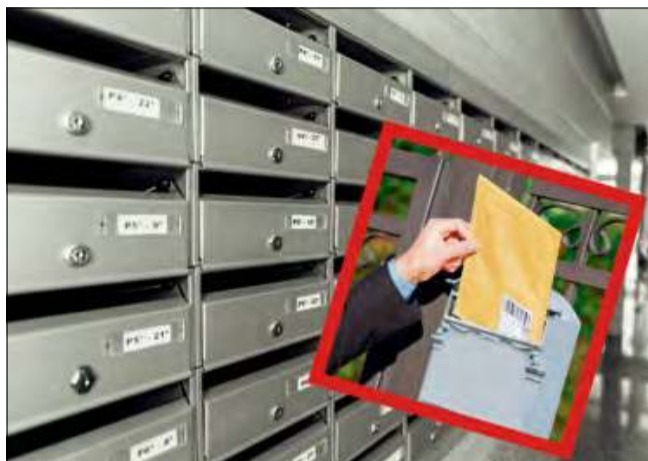
Poczta Polska zmienia zasady doręczeń od 2026 roku.

Listonosz zapuka, ale kartki już nie zostawi. Od 1 stycznia 2026 roku papierowe awizo przechodzi do historii, a urzędowe listy trafią do... internetu. Awizo to nic innego jak zawiadomienie o nieudanej próbie doręczenia przesyłki. Każdy, kto choć raz znalazł w skrzynce charakterystyczną kartkę, wie, że oznaczała to jedno – wyprawę na pocztę. System znany od dekad miał jednak swoje wady – kolejki, ograniczone godziny otwarcia placówek i stres, gdy awizo dotyczyło pisma z urzędu lub sądu.