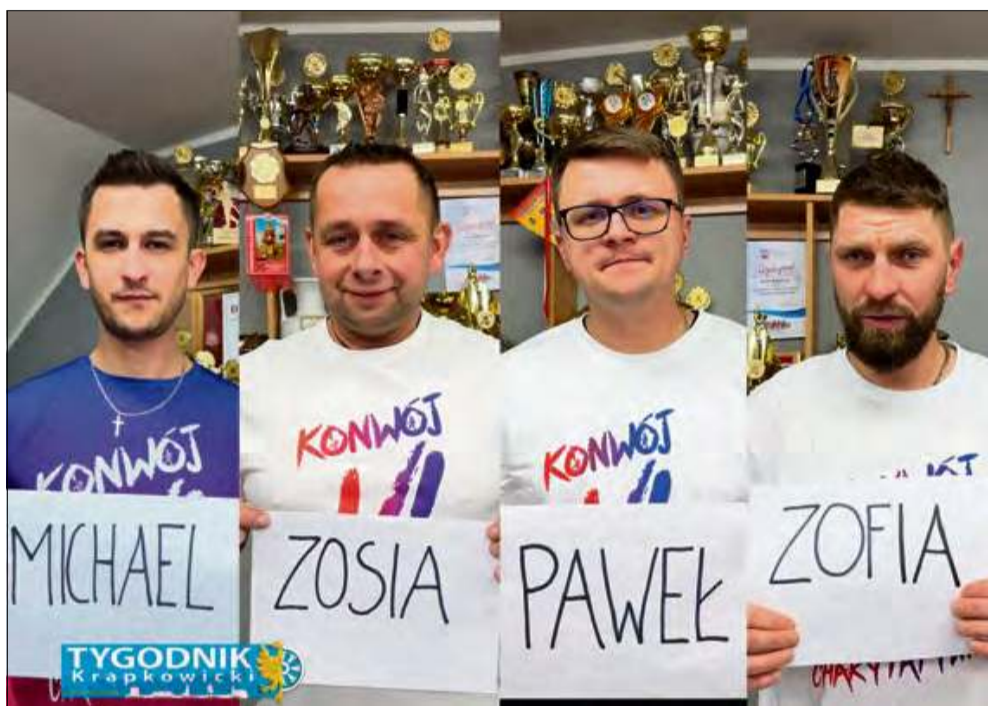
Strażacy z OSP Kórnica pojedą podczas VII Konwoju Charytatywnego dla czwórki małych bohaterów.

Konwój Charytatywny w Kórnicy dawno przestał być lokalną ciekawostką. Z edycji na edycję urósł do rangi jednej z najbardziej rozpoznawalnych inicjatyw dobroczynnych tworzonych oddolnie przez strażaków-ochotników. Setki druhów, dziesiątki wozów, kilometry tras i – co najważniejsze – realna pomoc, liczona w setkach tysięcy złotych.