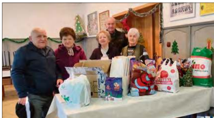
Zbiórka darów organizowana przez DFK Steblów dla Domu Pomocy Społecznej św. Karola.