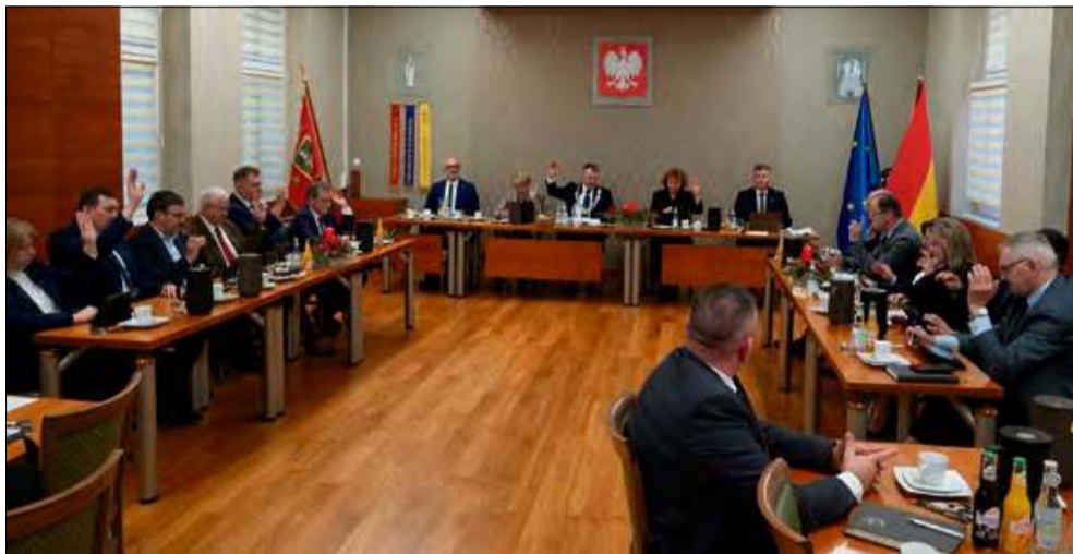
Budżet uchwalono podczas ostatniej sesji Rady Miejskiej w Gogolinie. Obrady odbyły się w poniedziałek 22 grudnia 2025 r.

W zakresie infrastruktury rekreacyjnej zaplanowano budowę „Zielonej Chatki” w Parku Miejskim w Gogolinie (900 tys. zł), zagospodarowanie centrum wsi Zakrzów (360 tys. zł) oraz kontynuację budowy parku na Osiedlu Dębowym w ramach projektu „Zioła mają