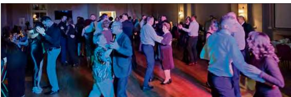
W Domu Kultury w Strzeleczy też odbyła się zabawa sylwestrowa.