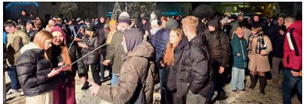
Zabawa sylwestrowa rozpoczęła się już wieczorną porą.