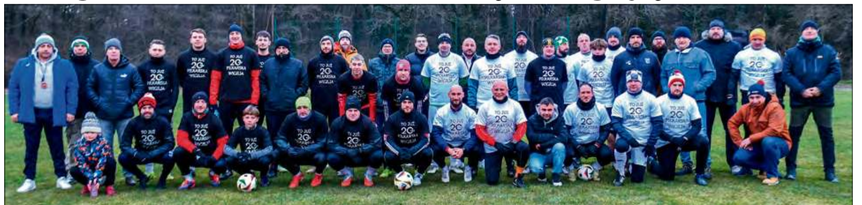
Tradycja wigilijnego grania w Otmęcie ma już 20 lat!

W ubiegłym roku wyjątkowo mroźny poranek nie odstraszył śmiałości wigilijnego grania. Na