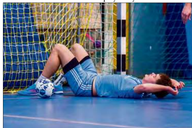
Po dobrej premierowej odsłonie, w drugiej Obrowczanie polegali z kretesem.