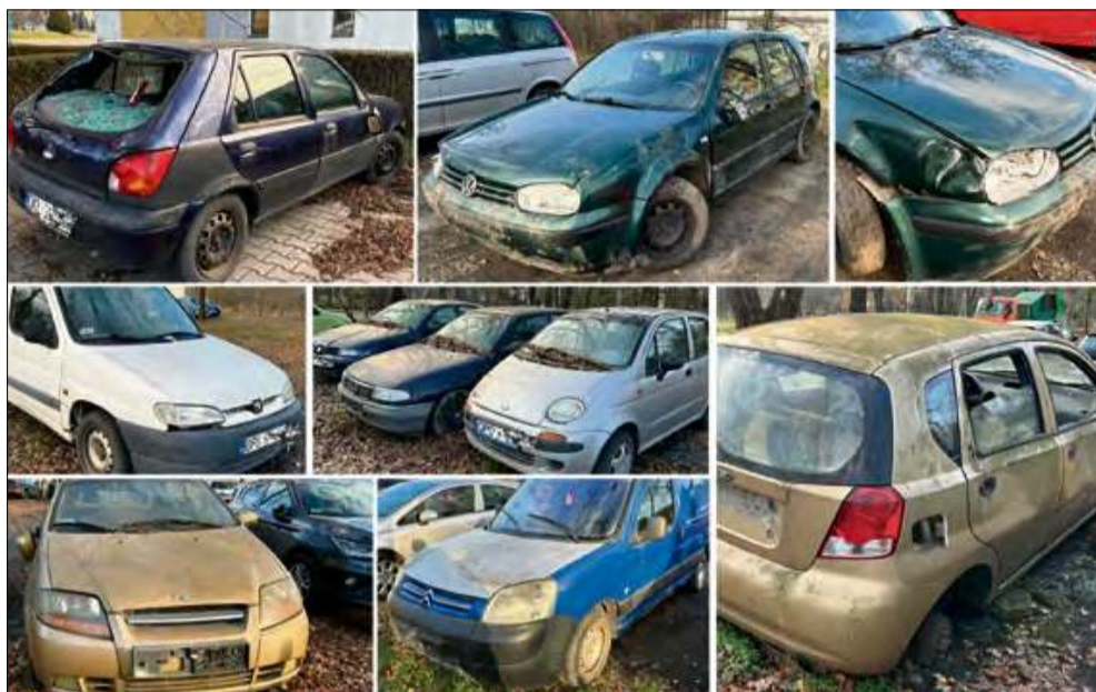
Nieopodal hali sportowej w Otmęcie pod koniec grudnia minionego roku doliczyliśmy się przynajmniej dziesięciu zdewastowanych pojazdów.

Mieszkańcy wyraźnie są zaniepokojeni i zdesperowani sytuacją, jaka w tym miejscu panuje od dużego czasu. Wygląda na to, że bez szybkiej interwencji odpowiednich służb i organów problem w tamtym miejscu będzie tylko