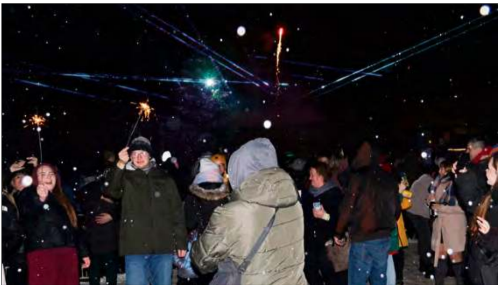
Światła lasera tańczyły nad głowami publiczności.

Strzeleczy z energią powitały Nowy Rok. W środę rynek miejski stał się centrum świętowania dla mieszkańców i gości.