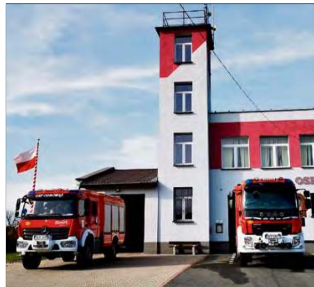
Jednostka OSP Odrowąż będzie miała kolejny, nowy sprzęt ratunkowy.

Strażakom z OSP Odrowąż udało się zebrać 8 tysięcy złotych w zbiórce internetowej. Środki zostaną przekazane na zakup niezbędnego sprzętu ratunkowego.