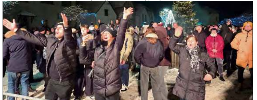
Mimo zimowej aury, goście bawili się znakomicie.