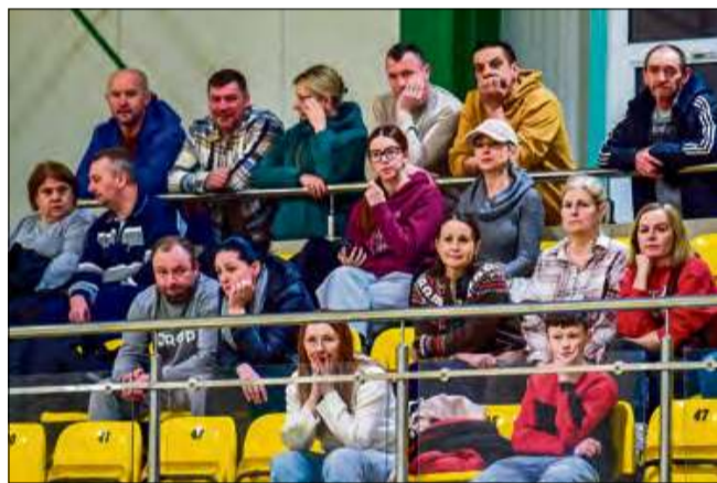
Kibice tygodnikowej halówki, jak co tydzień nie mogli narzekać na nudę.

do przerwy, gdy na tablicy świetnej widniał rezultat 3-3. Po zmianie stron grający w nowych strojach przeciwnik „docisnął pedał gazu” i dla Górażdżan skończyło