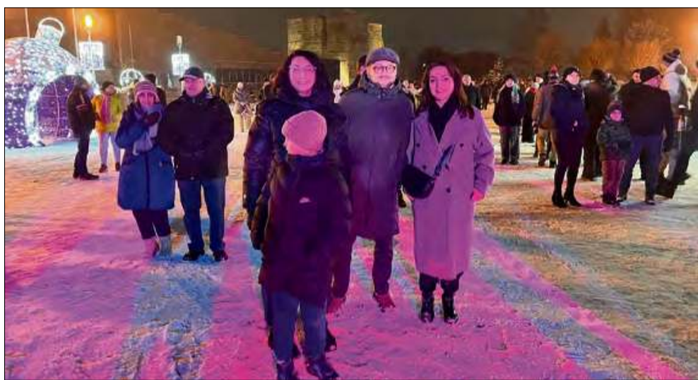
Goście bawili się znakomicie.

Organizatorzy dziękują wszystkim uczestnikom za obecność i wspólną zabawę. Życzą także społeczności zdrowia, pomyślności oraz wielu wartościowych wydarzeń w nadchodzących miesiącach.