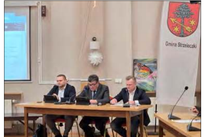
Uchwałę budżetową przegłosowano podczas sesji Rady Miejskiej w Strzeleczy, która odbyła się 22 grudnia.

W obszarze gospodarki wodno-kanalizacyjnej zaplanowano rozbudowę sieci oraz dokumentację dla kanalizacji w Raclawickach. W oświacie środki trafią na termomodernizację i remont dachu szkoły w Zielinie, budowę placów zabaw i miejsc rekreacji przy placówkach w Dobrej i Komornikach,