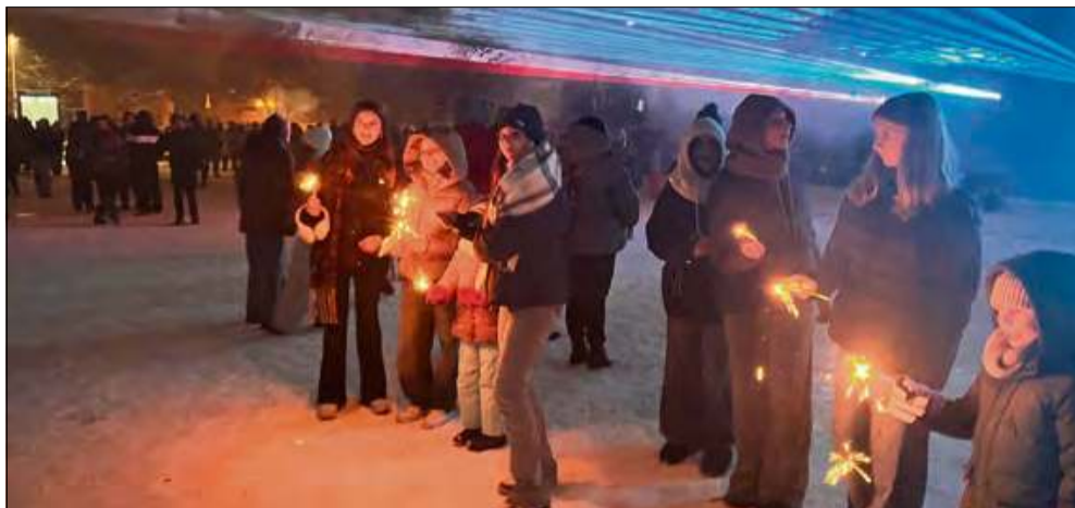
Plac Benedyktyński szybko wypełnił się tego wieczoru publicznością.

Wielu mieszkańców Gogolina i okolicznych miejscowości pożegnało 2025 rok podczas wspólnej zabawy na Placu Benedyktyńskim w centrum miasta. To było huczne świętowanie.