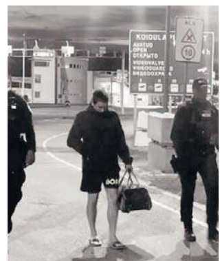
Estonia wydała przez granicę jednego z agentów Rosji