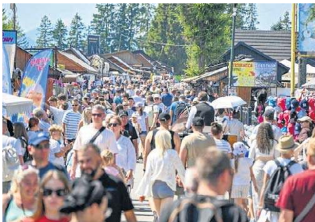
Majówka będzie krótka, jeśli pogoda dopisze tegoroczny wynik frekwencyjny przejdzie do historii jako rekordowy

Hotelarze spodziewają się, że nawet przy gorszej pogodzie sprzedadzą jeszcze około 10 procent wolnych miejsc. Jeśli jednak słońce dopisze, to pod Giewontem może nawet zabraknąć wolnych łóżek, a tegoroczny wynik frekwencyjny przejdzie do historii jako rekordowy. ©©