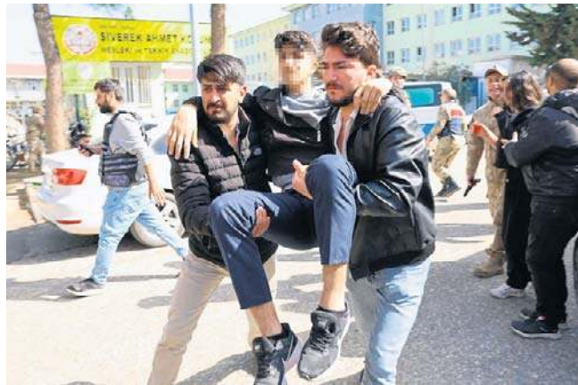
– Wszedł do szkoły i natychmiast zaczął strzelać – powiedział jeden z ewakuowanych uczniów

– Wszedł (do szkoły - PAP) i natychmiast zaczął strzelać. Od razu strzelił do osoby, która znalazła się przed nim – powiedział dziennikarzom jeden z ewakuowanych uczniów. PAP