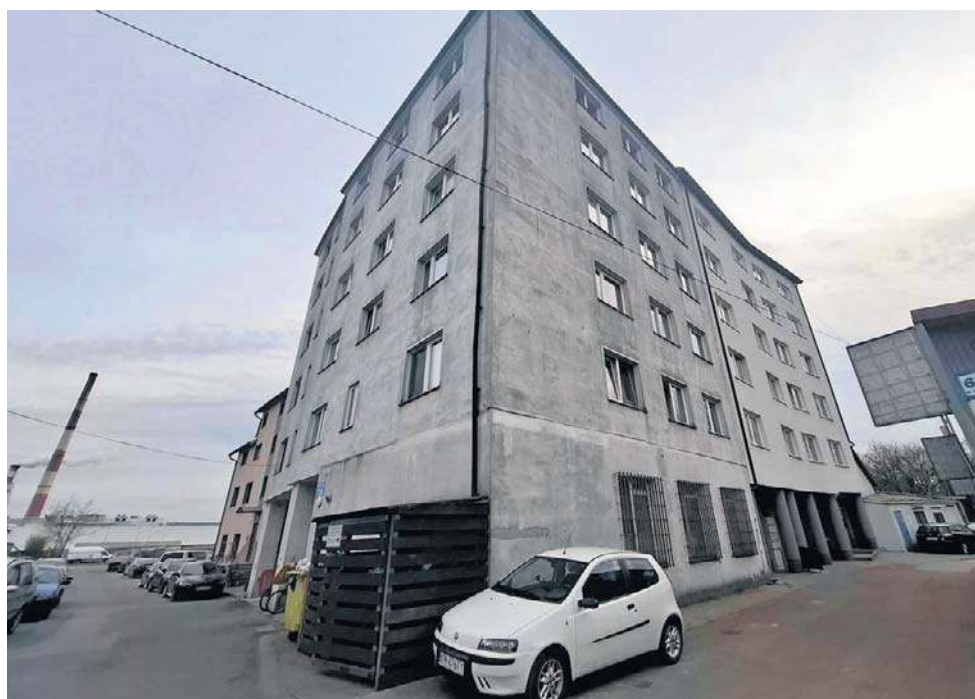
Właściciel wciąż przekonuje wynajmujących, że nie ma zagrożenia i rozbiórki nie będzie

- Mówił, że strażnicy chodzą tylko informacyjnie, że wcale nie trzeba ich wpuszczać. Przekonywał, że nie ma mowy o rozbiórce, że możemy być o to spokojni, że są różne prawne kruczki, które pozwolą zachować budynek. Faktem jest natomiast, że niektórzy wyprowadzili się stąd dosłownie po kilku dniach wynajmu, bo informację przekazywane przez strażników miejskich mocno ich wystraszyły - opowiada nam małżeństwo w średnim wieku, które wynajmuje mieszkanie przy ul. Centralnej 73B od dwóch miesięcy.