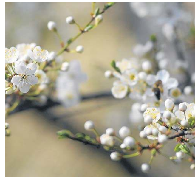
Wiosna jest szczególnie uciążliwa dla alergików. Dodatkowo zanieczyszczenie nasila objawy alergii

Dodatkowo refundacją objęto m.in. docetaksel w raku przełyku oraz paklitaksel w zaawansowanym raku żółtądką.