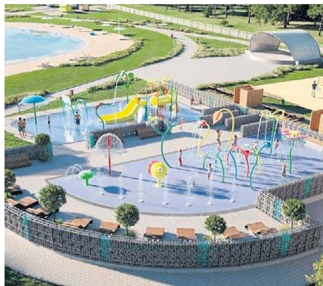
Tak ma wyglądać park wodny w Szerzynch. Obiekt ma być otwarty jeszcze w tegoroczne wakacje