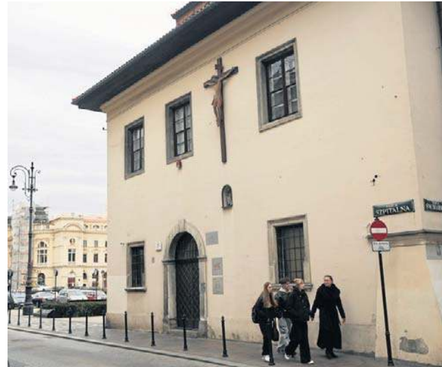
Miliony złotych popłyną do Muzeum Krakowa na kolejny remont budynku. To średniowieczny Dom pod Krzyżem

- Projekt jest obliczony na trzy lata. Chciałbym, abyśmy w pierwszym kwartale 2027 roku wbili łopatę,