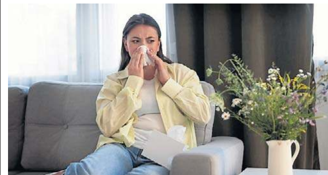
Wyniki badań są istotne dla codziennego życia alergików, szczególnie w zanieczyszczonych miastach

Konieczne jest zatem korzystanie zarówno z aplikacji monitorujących pyłki, jak i zanieczyszczenia powietrza.