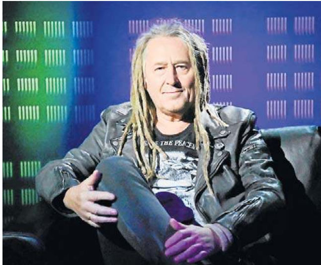
Podczas koncertu wokaliście i gitarzyście towarzyszyć będzie jego obecny zespół - Maleo Reggae Rockers