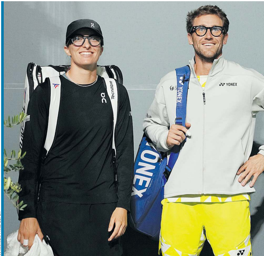
Iga Świątek i Casper Ruud wyróżnili się w turnieju mikstów...

Para polsko-norweska pojawiła się na korcie w okularach z maszynowymi oprawkami, co wywołało aplauz ośmiotyśięc publiczności. Jej pierwszymi rywalkami