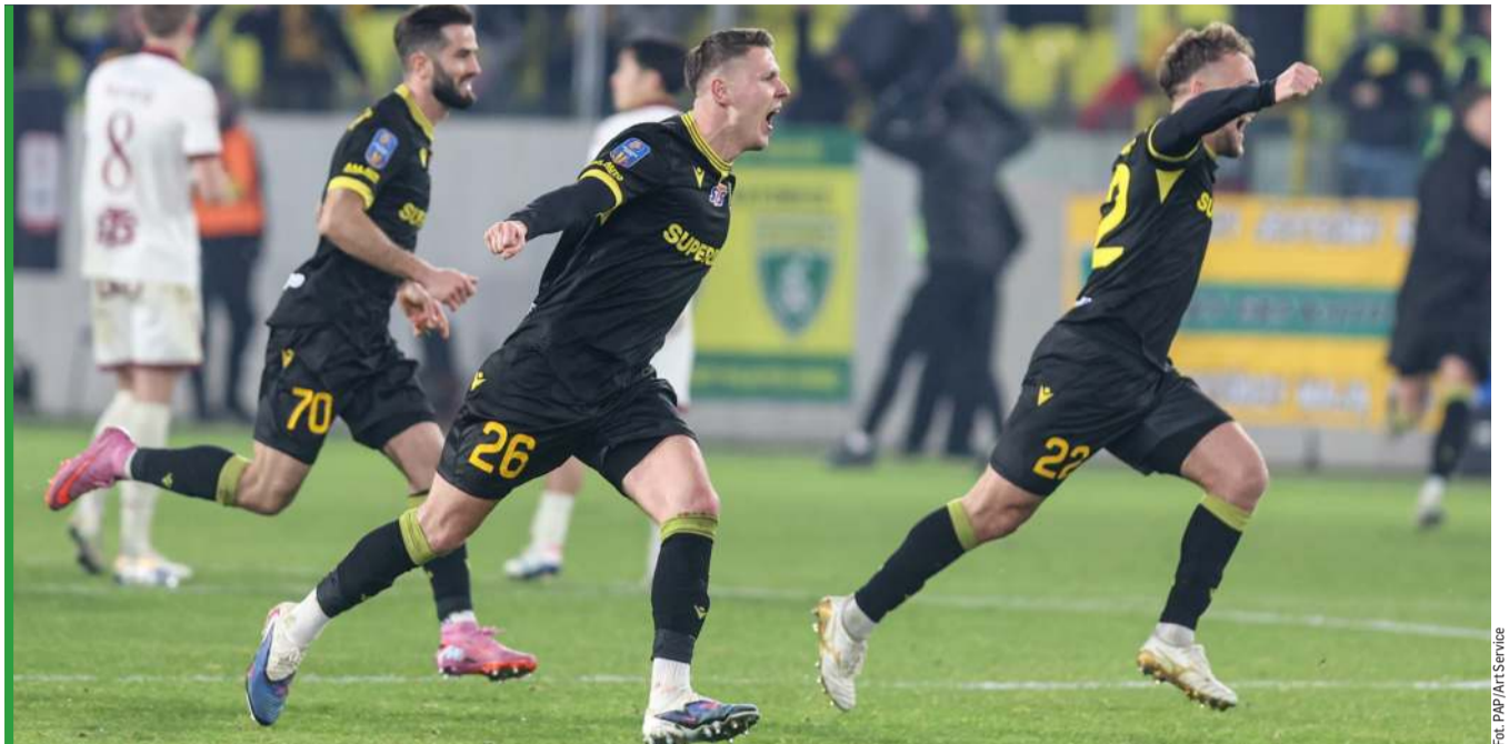
Moment euforii po serii rzutów karnych.