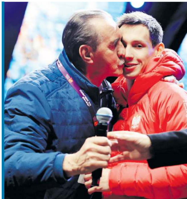
■ Czy trzykrotny medalista olimpijski jest w stanie utrzymać sportową koncentrację po tym, co spotyka go w kraju - to zdjęcie z ostatniej niedzieli z Bielska-Białej...