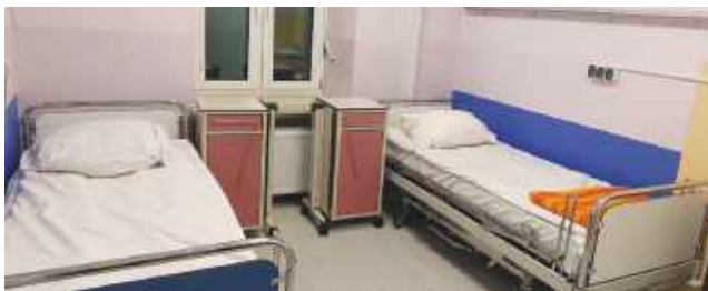
W oczekiwaniu na narodziny

Wokół planowanej biometanowni w Strubinach narasta niepokój, bo mieszkańcy chcą wiedzieć, czym dokładnie ma być ten zakład i jakie będą skutki jego funkcjonowania. Sprawa komplikuje się przez kolejne opóźnienie w procedurze środowiskowej