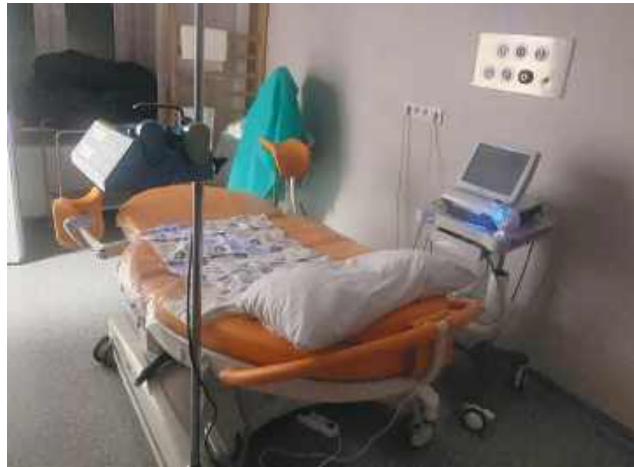
Nowoczesna sala porodowa

i tego, jak rozpoznać właściwy moment na sięgnięcie po spakowaną wcześniej walizkę. Wiele pytań dotyczyło także metod ograniczania bólu porodowego i warunków, w jakich przebywają