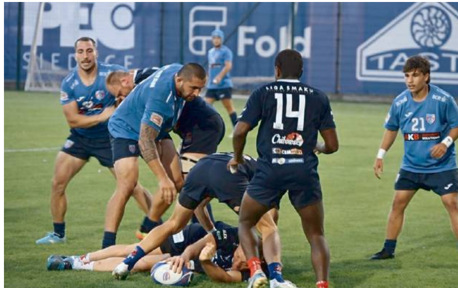
Sparing Pogoni ze Steaua Bukareszt

Inauguracja sezonu Ekstraligi już 23 sierpnia o godz. 16:00 na stadionie w Siedlcach. Gospodarze zmierzą się z beniaminkiem – AZS AWF Warszawa.