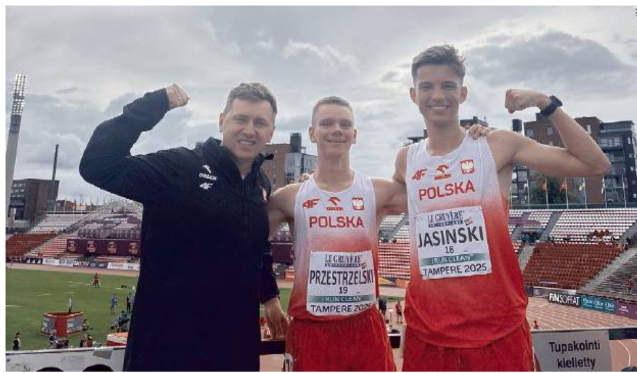
Siedleckie środowisko lekkoatletyczne zyskuje coraz większe uznanie na arenie krajowej i międzynarodowej.

Te imponujące rezultaty są także efektem ciężkiej pracy trenerów i dobrze funkcjonującego systemu szkolenia młodzieży w regionie.