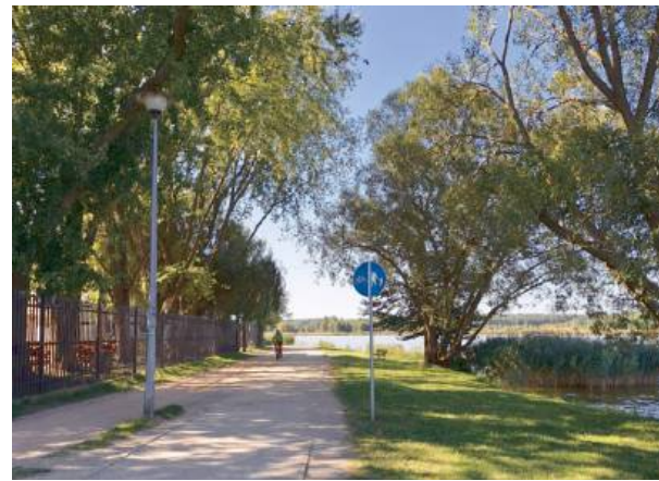
Mieszkańcy alarmują o brawurowej jeździe hulajnóg nad zalewem.