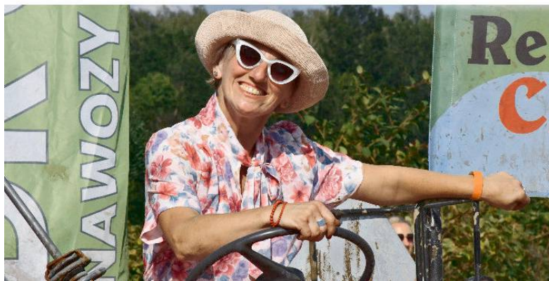
Takie inicjatywy warto propagować!

– Warto propagować takie inicjatywy, bo to nie tylko świetna zabawa, ale i promocja naszego regionu – podkreślał.