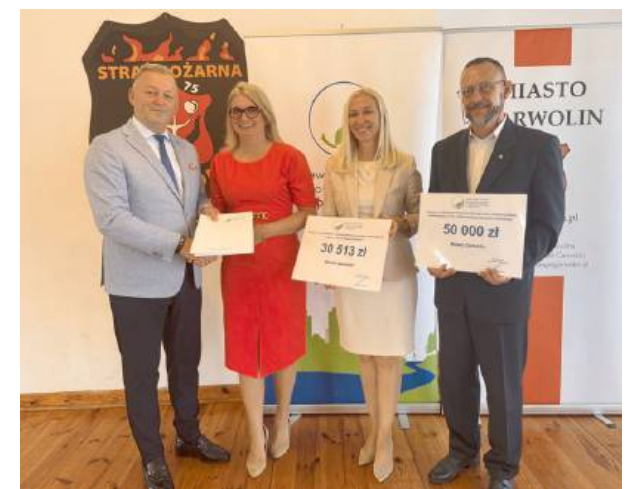
Łącznie miasto pozyskało ponad 100 tys. złotych.

Jednym z najważniejszych projektów jest utworzenie nowoczesnej Edukacyjnej Pracowni Ekologicznej w Publicznej Szkole Podstawowej nr 2 im. 1 Pułku Strzelców Konnych w Garwolinie. Z nowych zasobów dydaktycznych skorzysta ponad 950 uczniów. Pracownia będzie miejscem, gdzie dzieci i młodzież będą mogły rozwijać wiedzę z zakresu ekologii, ochrony środowiska i przyrody, korzystając z nowoczesnych narzędzi oraz materiałów edukacyjnych.