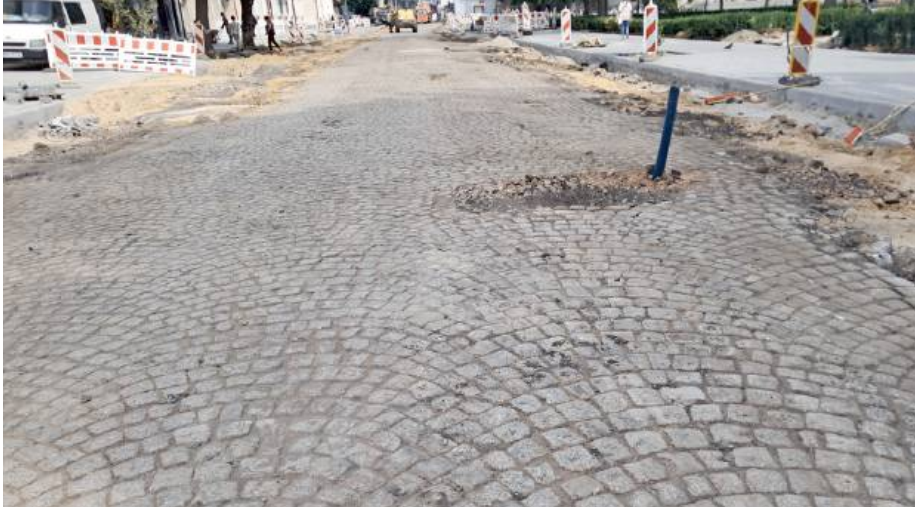
To niezwykle cenne odkrycie.

Trwa intensywny remont ulicy Floriańskiej w Siedlcach. Pod warstwą zerwanego asfaltu na zamkniętym odcinku ul. Piłsudskiego natrafiono na fragment niemal stuletniej brukowanej nawierzchni.