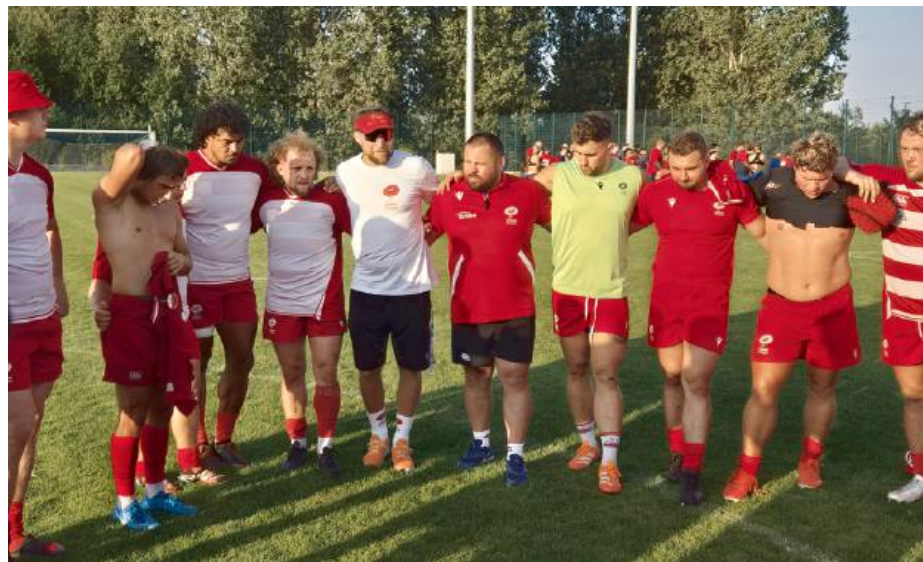
Pogon nie zwalnia tempa, 15–17 sierpnia drużyna uda się na konsultację szkoleniową do Lyonu.