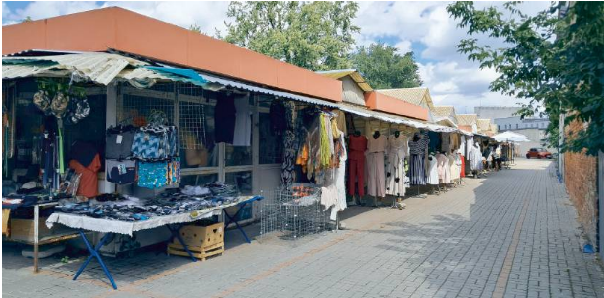
Bazyry nie upadły z dnia na dzień. Umierają powoli, cicho, tak jak odchodzą dawne tradycje.

„Kiedyś nie było gdzie wciśnąć nogi, dziś słychać własne kroki” – mówią ci, którzy zo-