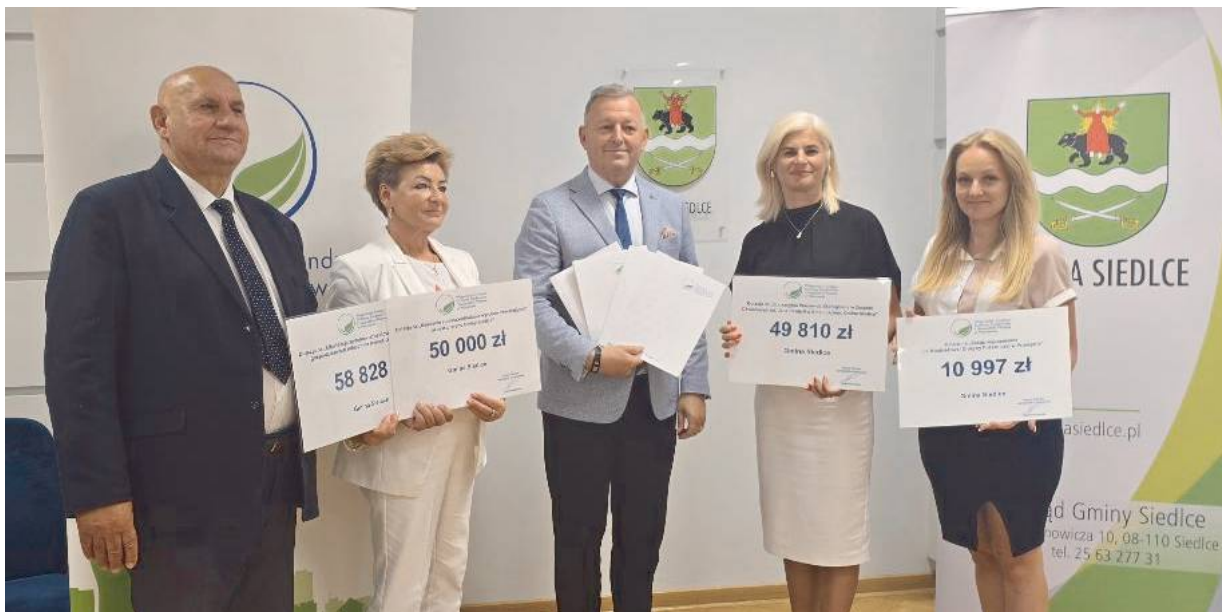
Zrealizowane projekty to kolejny krok w stronę zrównoważonego rozwoju gminy.

7 sierpnia w Urzędzie Gminy Siedlce odbyło się uroczyste podpisanie umów oraz wręczenie symbolicznych czeków na dofinansowanie zadań o charakterze proekologicznym. Łączna kwota wsparcia, jakie trafi do gminy dzięki współpracy z Wojewódzkim Funduszem Ochrony Środowiska i Gospodarki Wodnej w Warszawie, wyniosła 169 635 zł.