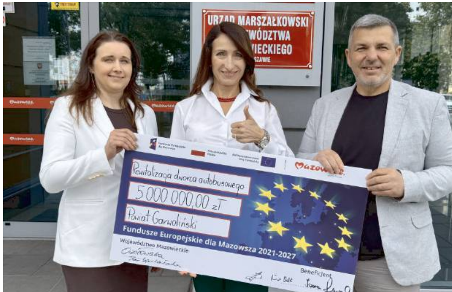
Wkład własny Powiatu Garwolińskiego to 882 352,95 zł

Projekt ma na celu nie tylko przebudowę istniejącej infrastruktury, lecz także stworzenie przestrzeni zarówno funkcjonalnej, jak i