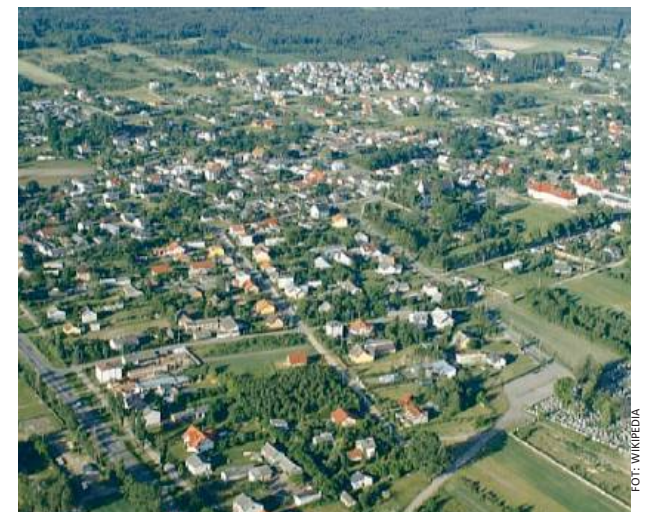
Prawa miejskie zostały Stanisławowowi odebrane w 1870 roku.