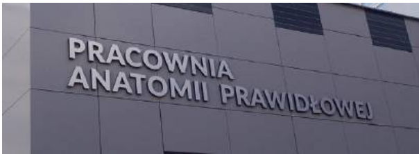
UwS otrzymał 30 miejsc.

Ministerstwo Zdrowia opublikowało rozporządzenie dotyczące limitu przyjęć na kierunek lekarski i lekarsko-dentystyczny. W dokumencie znalazła się informacja, że Uniwersytet w Siedlcach otrzymał 30 miejsc. Dokładnie połowę mniej niż uczelnia wnioskowała.