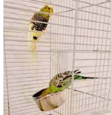
Kloj szczęśliwie wróciła do domu