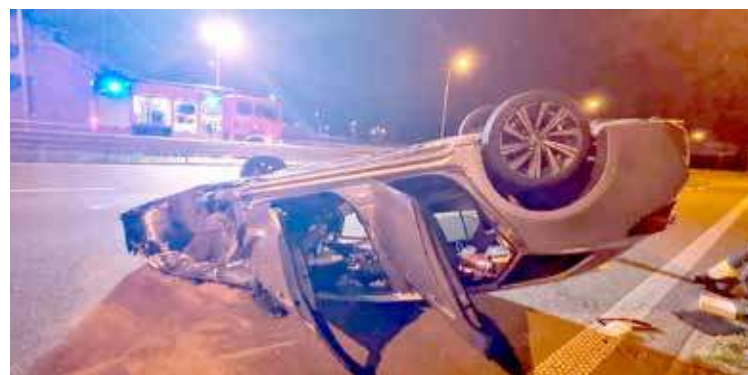
Do zdarzenia doszło na drodze S6

- Pojazd marki Opel Corsa znajdował się na lewym pasie ruchu. Kierujący oraz pasażerka opuścili pojazd przed przybyciem służb ratunkowych. Około sto metrów dalej, na jezdni znajdował się samochód marki Toyota Corolla o napędzie hybrydowym, leżący na dachu. Pojazdem