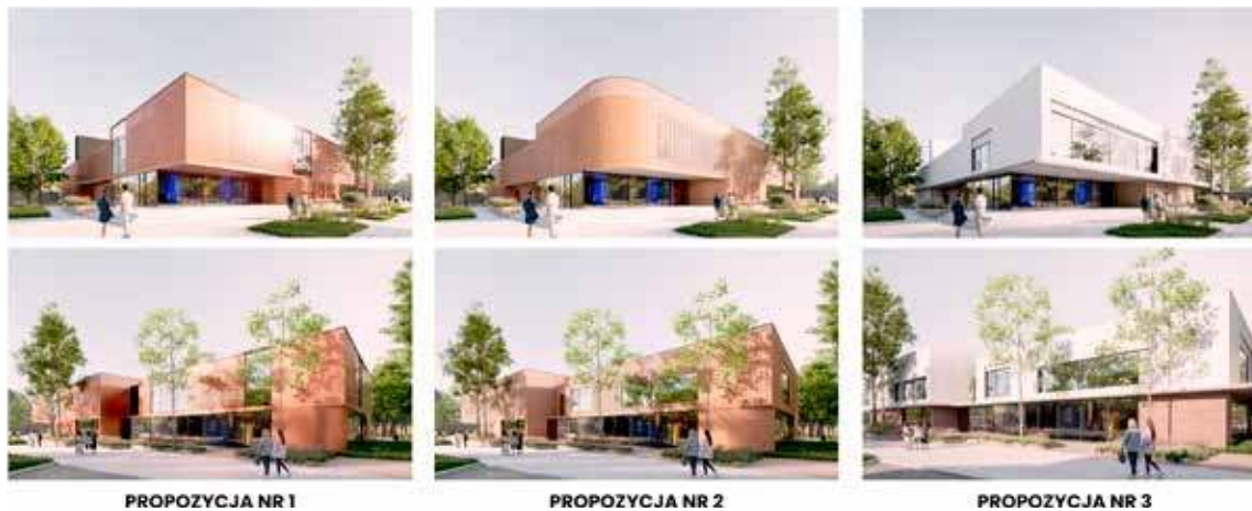
Najwięcej głosów mieszkańców zyskała propozycja numer 2

Na początku spotkania przedstawione zostały najważniejsze