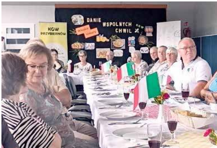
Włoskie smaki zagościły w Centrum Kultury

Na posiłku jednak się nie skończyło. Przy lampce wina