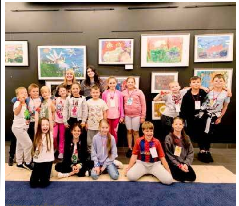
VI turnus półkolonii