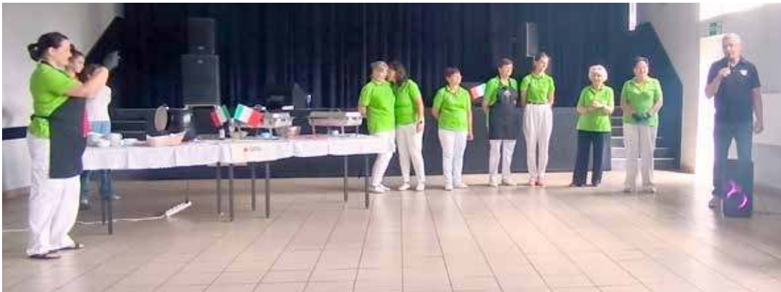
Dzień włoski w Przybiernowie (fot. Gm. Przybiernów)