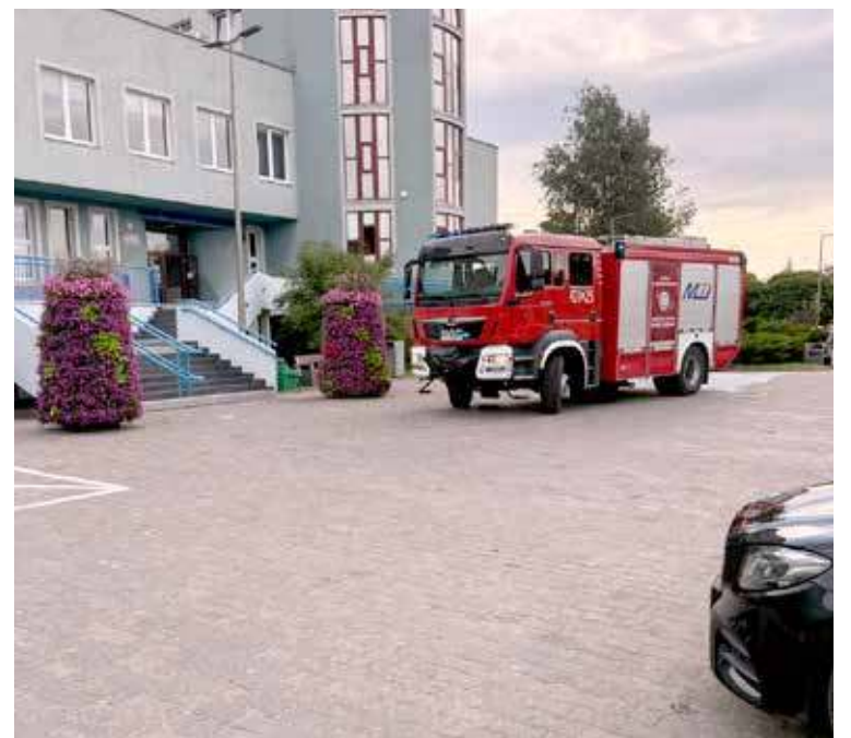
Pod Urzędem zjawiły się wozy strażackie