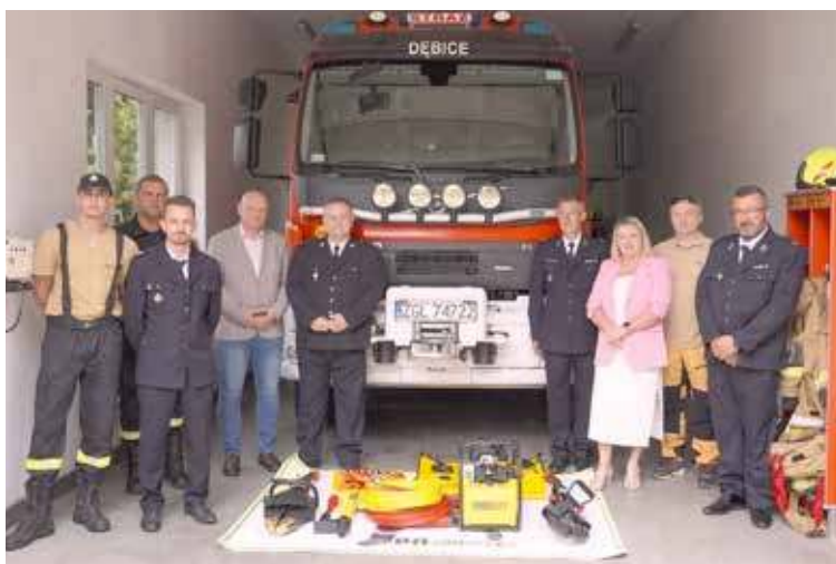
Nowy sprzęt został przekazany jednostce

teczniejsze prowadzenie akcji ratunkowych po wypadkach drogowych. Umożliwi szybkie i precyzyjne uwalnianie osób zakleszczonych w pojazdach. Jego