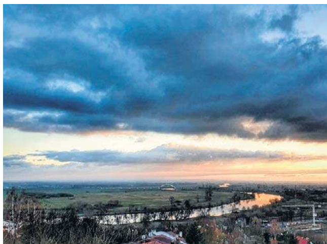
Z Gorzowskich Muraw rozciąga się piękny widok m.in. na południowy brzeg Warty

Czy miasto planuje objąć monitoringiem rezerwat przyrody i czy na Gorzowskich Murawach pojawi oznakowanie mówiące o zakazie rozpalania ognisk? Odpowiedź miasta w tej sprawie powinniśmy poznać jeszcze w lutym.