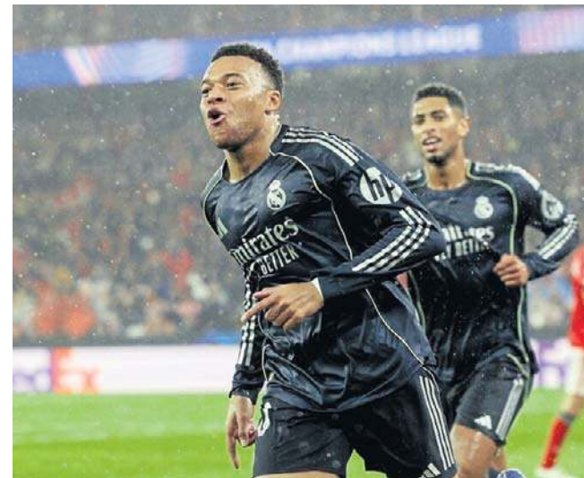
Real Madryt w ostatniej kolejce fazy ligowej LM przegrał 2:4 na Estádio da Luz i został zepchnięty do baraży

● godz. 21.00: AS Monaco - PSG, Benfica - Real Madryt, Borussia Dortmund - Atalanta BC. ©©