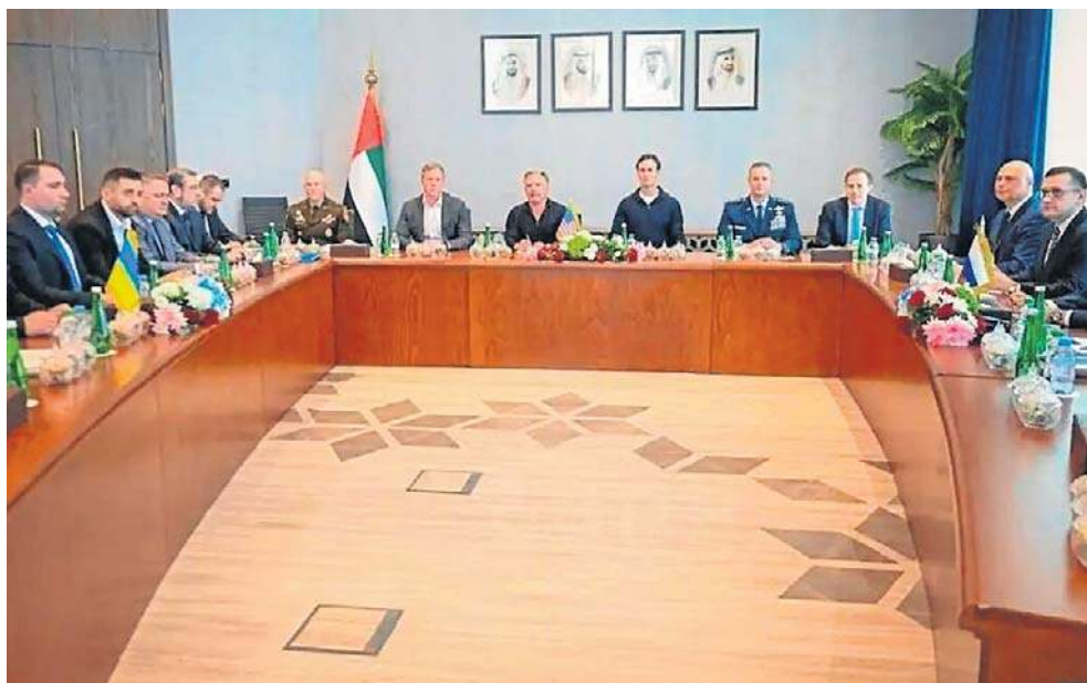
Rozmowy trójstronne w Abu Zabi między delegacjami USA, Ukrainy i Rosji trwały dwa dni i przez strony ukraińską i amerykańską zostały określone jako konstruktywne

„Ważne, aby zaplanowane w Genewie negocjacje były skuteczne, i dziękuję Stanom Zjednoczonym Ameryki za konstruktywne podejście. Poruszyliśmy również kwestię kolejności działań. Istotne jest, aby nastąpił postęp w sprawach gwarancji bezpieczeństwa oraz odbudowy gospodarczej” - napisał prezydent Ukrainy po monachijskim spotkaniu z szefem amerykańskiej dyplomacji Markiem Rubio.