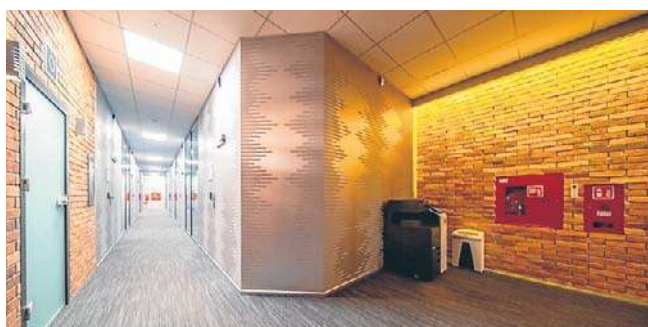
Obecne wnętrza dawnego biurówca fabryki mebli

Firma ma ponad 30-letnie doświadczenie w branży telekomunikacyjnej.