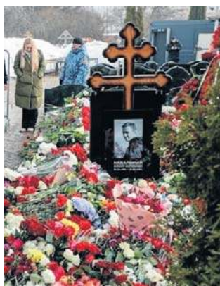
Pogrzeb Nawalnego zgromadził tłumy

Dodała: - Myślę, że to potrwia jakiś czas, ale odkryjemy,