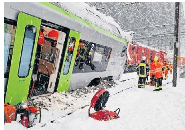
Między Goppenstein a Brig wstrzymano ruch pociągów. Wszystkiemu winne nowe opady śniegu

Do katastrofy kolejowej doszło kilka dni po tym, jak szwajcarskie władze podniosły poziom zagrożenia lawinowego do wysokiego. W środę Szwajcarski Federalny Instytut Badań Lasów, Śniegu i Krajobrazu (WSL) podniósł poziom zagrożenia do czwartego, drugiego najwyższego w skali. Jak wynika ze strony internetowej organizacji, w poniedziałkowy poranek poziom zagrożenia utrzymywał się na bardzo wysokim poziomie - głównie przez opady świeżego śniegu, który pokrył starszą warstwę - a to stworzyło warunki sprzyjające zejściu lawiny. PAP