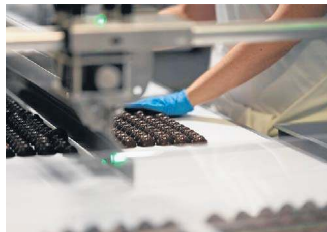
W portfolio Toms Group ma m.in. takie marki słodkości jak Anthon Berg, Hachez, Pingvin, Feodora czy Bonbon

Po inwestycji zatrudnienie w Nowej Soli może znaleźć dodatkowych 90-100 osób.