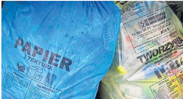
Od 1 marca zmienia się firma, odbierająca odpady z nieruchomości. Zmieni się też opłata za odbiór śmieci

- Chodzi o około 10 osób. Nadchodzi wiosna, a dla nas to czas większego obciążenia pracą. Dlatego będziemy się starać jakoś te osoby zagospo-