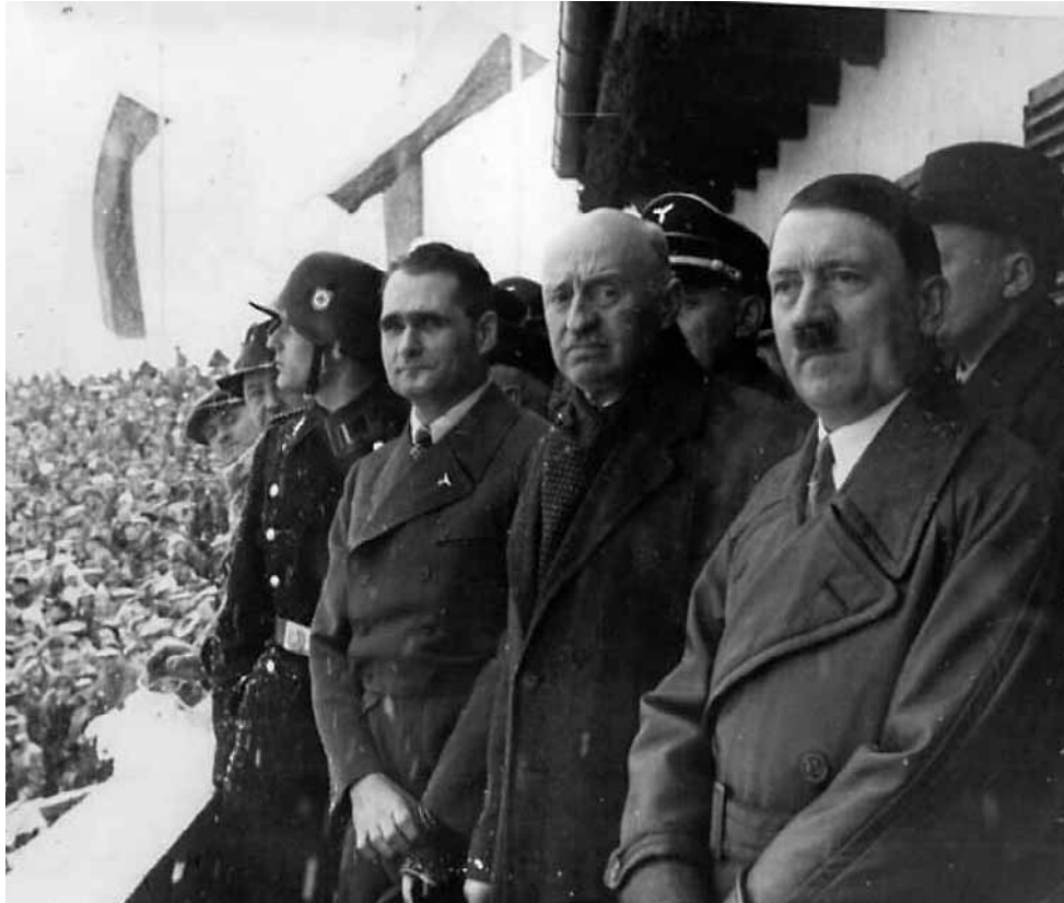
Uroczystego otwarcia igrzysk dokonał kanclerz Adolf Hitler, wygłaszając dla rozentuzjowanej półmilionowej publiczności namaszczone zdanie

Innym problemem, tym razem politycznym, była groźba bojkotu Igrzysk z powodu jawnej antysemickiej polityki Berlina. 15 września 1935 r. Reichstag uchwalił tzw. Ustawy Norymberskie, które stały się pod-