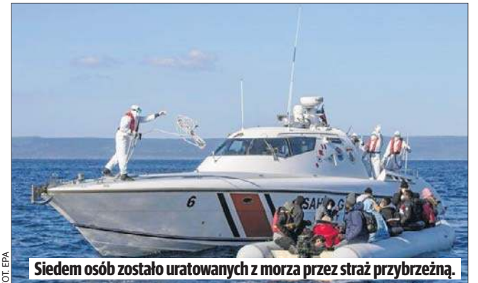
Siedem osób zostało uratowanych z morza przez straż przybrzeżną.

Szefowa KE zauważyła, że UE dysponuje własnymi źródłami energii jądrowej i odnawialnej, które połączone mogłyby się stać gwarantem bezpieczeństwa dostaw energii.