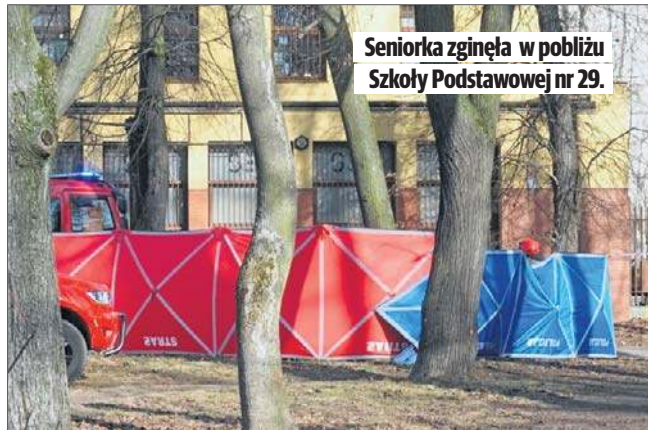
Seniorka zginęła w pobliżu Szkoły Podstawowej nr 29.