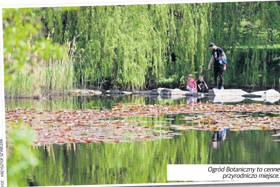
Ogród Botaniczny to cenne przyrodniczo miejsce.

- To temat, który jest niewyczerpany, debata dotycząca tego, co się dzieje wokół Ogrodu Botanicznego, w mediach, na spotkaniach, na ostatniej sesji