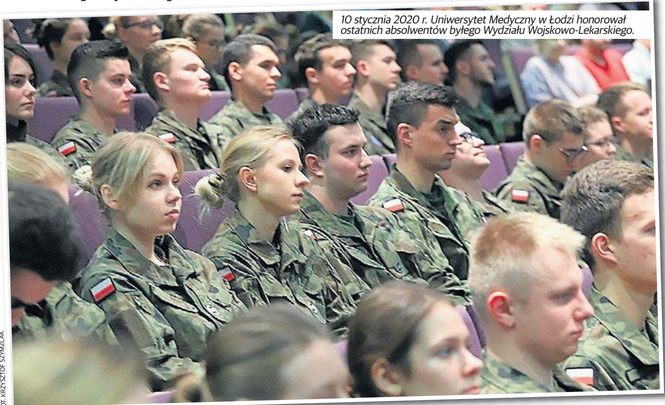
10 stycznia 2020 r. Uniwersytet Medyczny w Łodzi honorował ostatnich absolwentów byłego Wydziału Wojskowo-Lekarskiego.

Rozpoczyna się nabór na uczelnie wyższe, ale ci, którzy szykowali się na studia w reaktywowanej Wojskowej Akademii Medycznej w Łodzi, muszą poprzestać na cywilnych uczelniach. Reaktywacja WAM zalicza bowiem potężne opóźnienie.