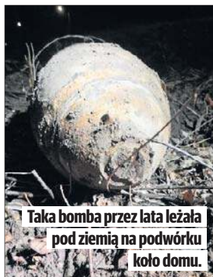
Taka bomba przez lata leżała pod ziemią na podwórku koło domu.

OPOCZNO Znalazł bombę lotniczą na swoim podwórku Mieszkaniec Opoczna odkopał na podwórku przy swoim domu bombę lotniczą TZ50 z II wojny światowej. Nie wybuch zabezpieczył i wywiózł patrol saperki z Tomaszowa Maz. Mężczyzna zadzwonił na komendę policji. - Mundurowi ustalili, że mężczyzna, który wykonywał prace ziemne, odnalazł wciąż groźny dla życia i zdrowia niewybuch. Na miejsce zostali skierowani funkcjonariusze, którzy potwierdzili, że to fragment bomby TZ50 pochodzący z czasów II wojny światowej - informuje asp. Agnieszka Januszewska-Kaluźna z opoczyńskiej policji. Okazało się, że jest to poniemiecka bomba betonowa, która zawiera beton zamiast ładunku wybuchowego. Wykorzystywana była do niszczenia celów przy użyciu energii kinetycznej, a także do szkoleń i testów jako bomba ćwiczebna. Niewybuch został zabezpieczony i przetransportowany przez wyspecjalizowany patrol saperki z tomaszowskiej jednostki wojskowej. (OBY)