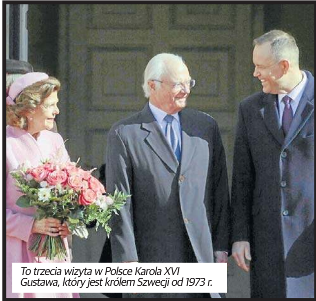
To trzecia wizyta w Polsce Karola XVI Gustawa, który jest królem Szwecji od 1973 r.

To trzecia wizyta w Polsce Karola XVI Gustawa, który jest królem Szwecji od 1973 roku.