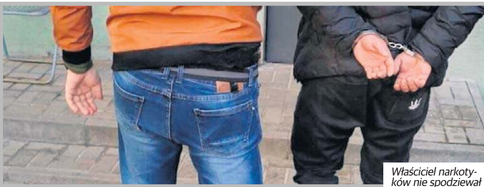
Właściciel narkotyków nie spodziewał się wizyty policjantów.

- Łącznie policjanci zabezpieczyli mefedron w postaci ponad 23 gramów zbrulonych, białych kryształków, ponad 15,5 gramów zielonych tabletek i niemal 35 gramów proszku, a także marihuanę o wadze ponad 147 gramów. Pabianiczanie usłyszały zarzuty. Grozi mu do 10 lat pozbawienia wolności - dodaje podkom. Agnieszka Jachimek.