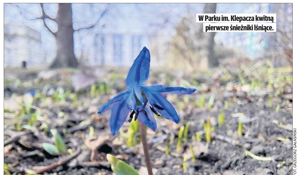
W Parku im. Klepacza kwitną pierwsze śnieżniki lśniące.

Śnieżniki razem z cebulicami syberyjskimi tworzą w parku im. Klepacza słynne niebieskie dywany. Ale na ten spektakl w przyrodzie trzeba jeszcze poczekać. W tym łódzkim zieleńcu daje się także zauważyć kępy kwitnących przebiśniegów. Lada dzień te pierwsze kwiaty wiosny rozwiną się też w zrewitalizowanym Pasażu Schillera. W ogródkach i na działkach kwitną pierwsze krokusy i ciemierniki. Na kalinach wonnych, forsycjach widać duże pąki liściowe, z ziemi wychodzą liście tulipanów.