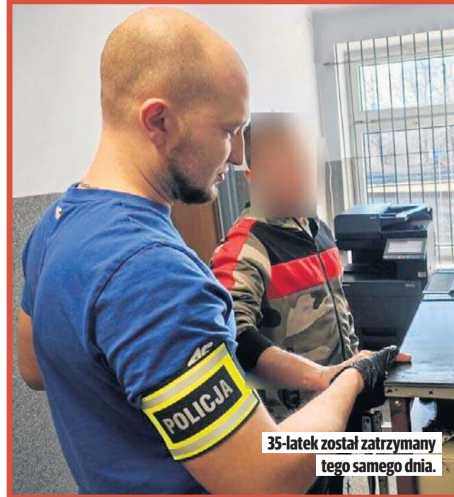
35-latek został zatrzymany tego samego dnia.

Zgłaszająca włamanie kobieta poinformowała, że złodziej z pomieszczenia gospodarczego wyniósł kilka wartościowych sprzętów. Mieszkanica