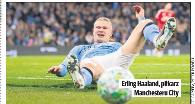
Erling Haaland, piłkarz Manchesteru City