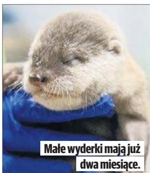
Małe wyderki mają już dwa miesiące.

Wyderka orientalna zwana także karłowatą, żyje w środowisku wodnym w Bangladeszu, południowych Indiach, Chinach, na Tajwanie, w Indochinach, Malezji, Indonezji i na Filipinach.