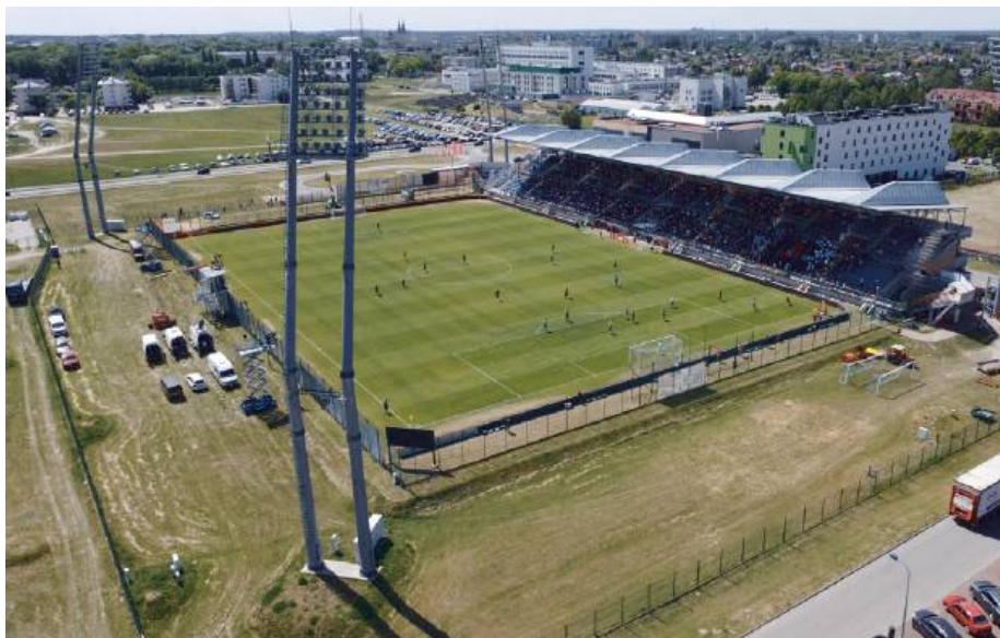
To, że w Pogoni Siedlce nie jest dobrze, stało się jasne w tym roku. Piłkarzom zaczęło grozić eksmisją, bo klub nie płacił za mieszkania, a zawodnicy nie dostawali wynagrodzeń.