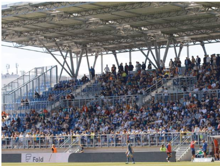
Trener Nocoń ocenia, że sytuacji Pogoni może nie da się nazwać idealną, ale na pewno jest stabilna.