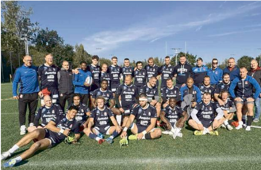
Pogoń Siedlce z kolejnym efektywnym zwycięstwem. Wysoka wygrana w Krakowie

Juvenia próbowała odpowiadać celnymi kopami, ale przyłożenia Pogoni szybko za-