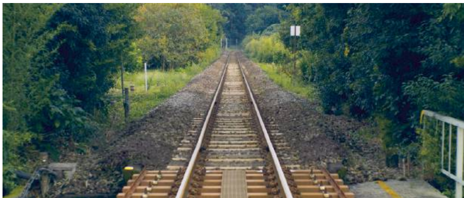
– Decyzja o integracji zakładów linii kolejowych jest elementem szerszej transformacji, jaką przechodzi PKP Polskie Linie Kolejowe S.A. – pisze PKP PLK.

Kilka dni później z „Życiem” skontaktował się jeden z pracowników Zakładu Linii Kolejowych w Siedlcach. Jak nam opowiedział, załoga o decyzji dowiedziała się pocztą pantoflową. A kiedy doszło do spotkania z pracownikami, obiecano, że każdy dostanie „oferę zmiany stanowiska”. – Ale nikt nie chciał odpowiedzieć, co będzie, gdy tej oferty nie przyjmie. A przecież dla wielu pracowników dojazd do Białegostoku do pracy jest po prostu niemożliwy. Powtarzano jedynie, że „nikt nikomu nie będzie kazał jeździć do Białegostoku” – mówił i ocenił: – Wszystko wygląda na zwolnienia w białych rękawiczkach. Blisko tysięcy osób stanęło przed groźbą utraty pracy. Albo pogodzą się z oferowanymi sta-