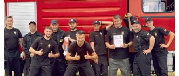
Mimo że nie są zawodowcami, ich rola w lokalnej społeczności jest ogromna.

Strażacy ochotnicy z OSP Pietrusy w gminie Olszanka rozpoczęli zbiórkę na zakup defibrylatora AED. To urządzenie, które może uratować życie w przypadku nagłego zatrzymania krążenia.