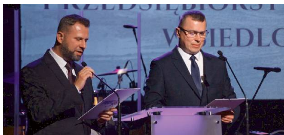
Jubileusz stał się wyjątkową okazją do podsumowania 50 lat pracy na rzecz mieszkańców Siedlec.

ma prezentuje swoje osiągnięcia, nieustannie się rozwija i patrzy z odwagą na wyzwania, które przyniesie przyszłość – dodał.