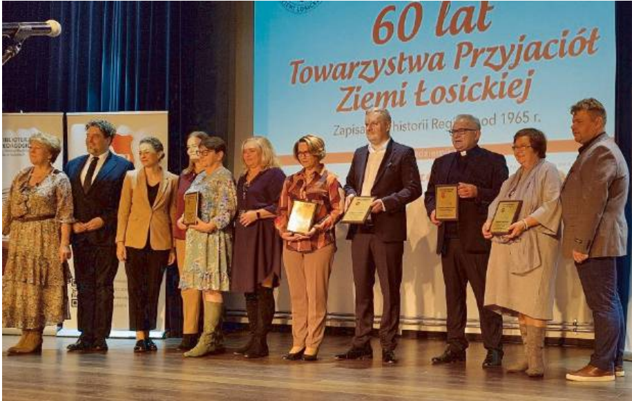
Towarzystwo Przyjaciół Ziemi Łosickiej od dekad pielęgnuje lokalne tradycje.

To był wyjątkowy dzień dla wszystkich, którym bliska jest Ziemia Łosicka. W sobotę, 4 października, w Łosickim Domu Kultury odbyła się uroczystość z okazji 60-lecia działalności Towarzystwa Przyjaciół Ziemi Łosickiej - organizacji, która od dekad pielęgnuje lokalne tradycje, dba o historię i tożsamość regionu.