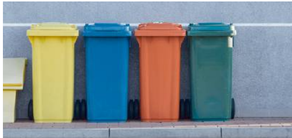
Gmina Garwolin liderem w recyklingu

Wskaźnik ten uzyskano m.in. dzięki regularnym kontrolom