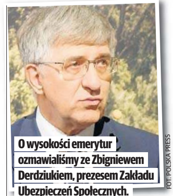
O wysokości emerytur rozmawialiśmy ze Zbigniewem Derdziukiem, prezesem Zakładu Ubezpieczeń Społecznych.

Nie każdy może liczyć na wysokie świadczenia. Osoby, które pracowały krótko lub odprowadzały niskie składki, mogą otrzymać bardzo niską emeryturę - czasem nawet poniżej 10 zł miesięcznie. Aby zapobiec takim sytuacjom, państwo gwarantuje emeryturę minimalną: kobiety, które przepracowały co najmniej 20 lat; mężczyźni, którzy mają minimum 25 lat stażu pracy, otrzymują świadczenie nie niższe niż 1878,91 zł brutto (2025 r.). Dodatkowo państwo wspiera seniorów dodatkowymi programami socjalnymi, takimi jak „trzynasta” i „czternasta” emerytura, dodatki pielęgnacyjne czy nowa renta wdowska (15% świadczenia zmarłego współmałżonka).