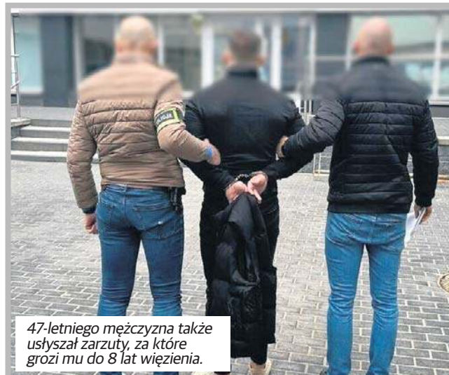
47-letniego mężczyznę także usłyszał zarzuty, za które grozi mu do 8 lat więzienia.