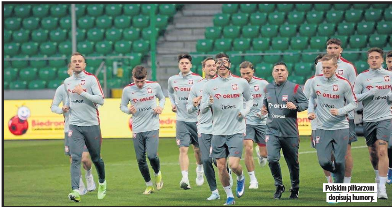
Polskim piłkarzom dopisują humory.

Dzisiejszym meczem z Albanią w Warszawie polscy piłkarze rozpoczną rywalizację w barażach o awans do mistrzostw świata w USA, Kanadzie i Meksyku.