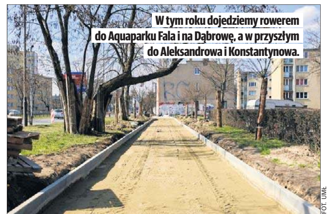
W tym roku dojedziemy rowerem do Aquaparku Fala i na Dąbrowę, a w przyszłym do Aleksandrowa i Konstanynowa.

W najbliższych dniach mają też zacząć się budowy dróg rowerowych z Łodzi do Konstanynowa i Aleksandrowa Łódzkiego. To wspólny projekt Łodzi i sąsiednich gmin z unijnym dofinansowaniem. Do Aleksandrowa łódzianie dojadą w śla-