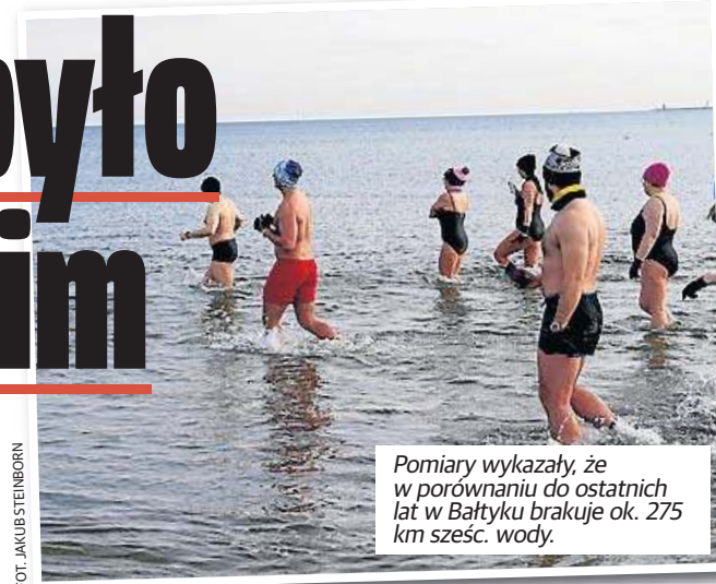
Pomiary wykazały, że w porównaniu do ostatnich lat w Bałtyku brakuje ok. 275 km sześć. wody.

Ubyło wody w Morzu Bałtyckim - tak wskazują badania naukowców. Sytuacja może mieć wpływ na rybołówstwo w regionie, w tym działalność polskich rybaków, ale także na najbliższy sezon letni.