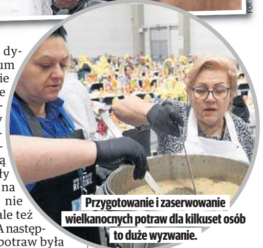
Przygotowanie i zaserwowanie wielkanocnych potraw dla kilkuset osób to duże wyzwanie.

nim momencie, tuż przed rozwożeniem paczek i tuż przed śniadaniem w hali tak, by sałatka się nie popsuła, a w jej przypadku może stać się to bardzo szybko.