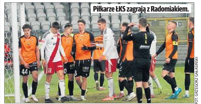
Piłkarze ŁKS zagrają z Radomiakiem.