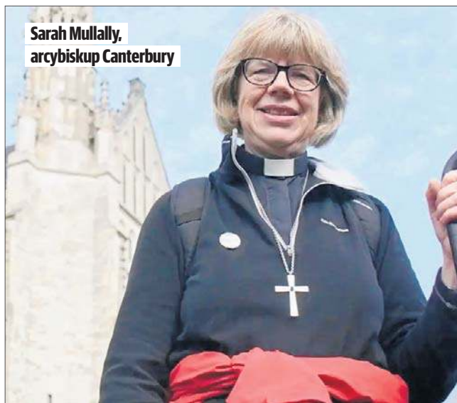
Sarah Mullally, arcybiskup Canterbury

Nowa arcybiskup od 1980 roku pracowała jako pielęgniarka, a w 1999 roku została najmłodszą w historii Pierwszą Pielęgniarką Kraju, czyli główną doradczynią rządu ds. pielęgniar-