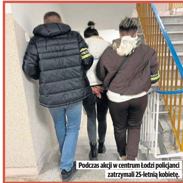
Podczas akcji w centrum Łodzi policjanci zatrzymali 25-letnią kobietę.

W centrum Łodzi w dwóch różnych miejscach zatrzymali 47-letniego mężczyznę i 25-letnią kobietę oraz zabezpieczyli 46 tys. zł, sprzęt kompu-