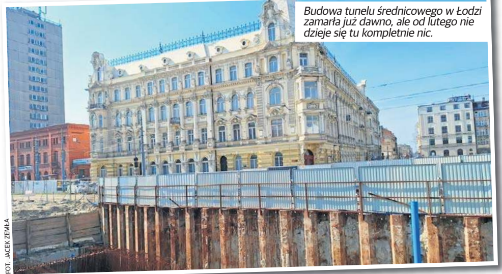
Budowa tunelu średnicowego w Łodzi zamarła już dawno, ale od lutego nie dzieje się tu kompletnie nic.

Dialog techniczny PKP PLK z firmami zainteresowanymi dokończeniem budowy tune-