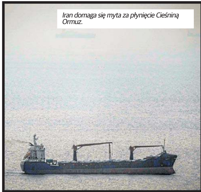
Iran domaga się myta za płynięcie Cieśniną Ormuz.

Żądania Iranu dotyczą także kluczowej pod względem strategicznym Cieśniny Ormuz. Ajatollahowie chcą, by statki przepływające przez nią płaciły im myto. Przesmyk ten był przed rozpoczęciem wojny drogą dla 20 procent światowego transportu ropy naftowej. Iran nie zamierza także przerywać