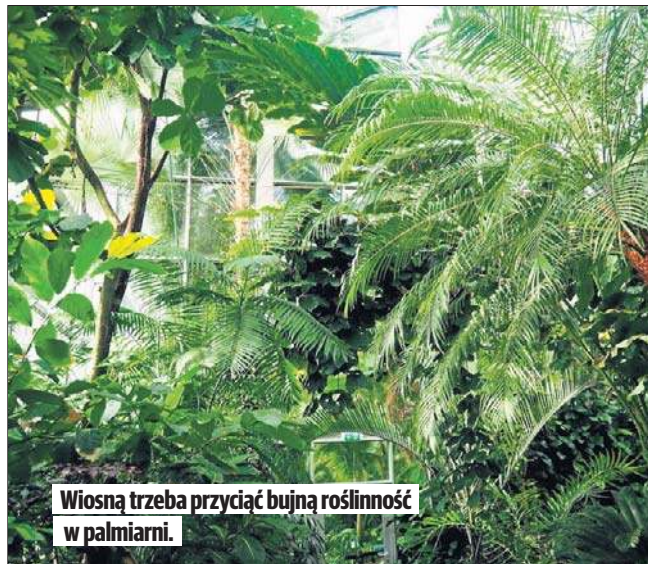
Wiosną trzeba przyciąć bujną roślinność w palmiarni.