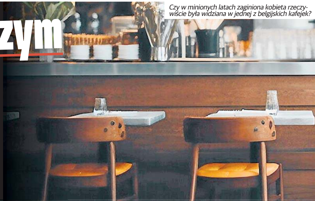
Czy w minionych latach zaginiona kobieta rzeczywiście była widziana w jednej z belgijskich kafejek?

„Oszukali nas. Zostałyśmy wystawione na ulicę”. 20-letnia Izabela Żukowska wyjechała do pracy w Belgii i ślad po niej zaginęła. Po 27 latach jej córka poszukuje prawdy.